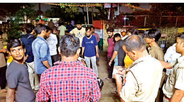
अस्पताल में हादसे की जानकारी लेती पुलिस।