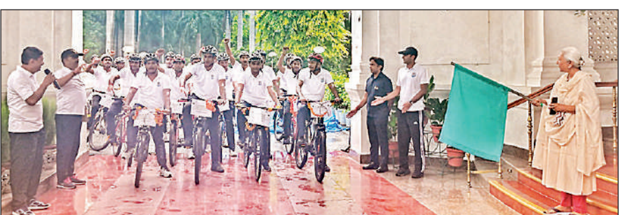
राजभवन से साइकिल जामरुकता रैली को हरी झंडी दिखाकर रवाना करतीं राज्यपाल आनंदी बेन पटेल।

अमृत विचार, लखनऊ : कस्तूरबा गांधी विद्यालयों में पौधारोपण व स्वच्छता अभियान 'एक पेड़ मां के नाम 2.0' के तहत रविवार को राजभवन से उन्नाव के लिए दो दिवसीय साइकिल रैली को रवाना किया गया। राज्यपाल आनंदीबेन पटेल ने हरी झंडी दिखाकर रैली को रवाना किया। अभियान के तहत राजभवन के अधिकारियों-कर्मचारियों की टीम उन्नाव के कस्तूरबा गांधी आवासीय बालिका विद्यालय में पौधारोपण व साफ-सफाई से संबंधित कार्यों में शामिल होगी। देर शाम राजभवन के अधिकारियों ने बताया कि टीम उन्नाव में गौरा कंठेरवा, नवागंज व आदमपुर बरेली हसनगंज स्थित कस्तूरबा गांधी आवासीय बालिका विद्यालय पहुंची व पौधारोपण व साफ-सफाई अभियान में शामिल हुई। कुल 100 पीछे रोपित किये गये। इन पीछों में जामुन, छितवन, मौलसी, सहजन, नीम, बॉटल ब्रश, आंवला आदि शामिल हैं।