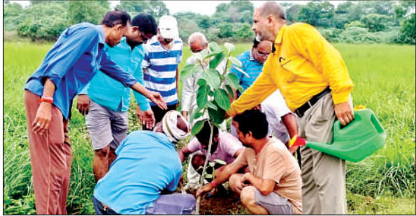
यमुना तट मार्ग पर पौधरोपण करते संगठन के पदाधिकारी।