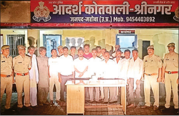
पुलिस गिरफ्तार में जुआरी ।