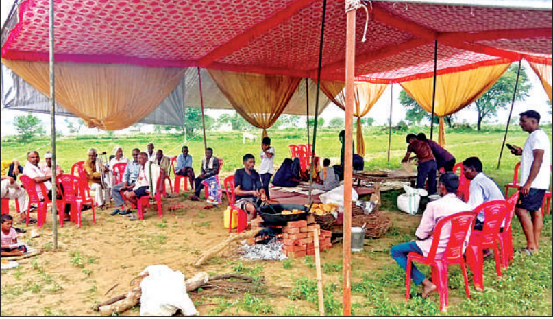
बाढ़ पीड़ितों के लिए बनता खाना। खेतों में भरा पानी।