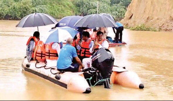
बाढ़ क्षेत्र का निरीक्षण करते जलशक्ति राज्यमंत्री रामकेश निषाद।