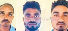
पकड़े गए आरोपी।