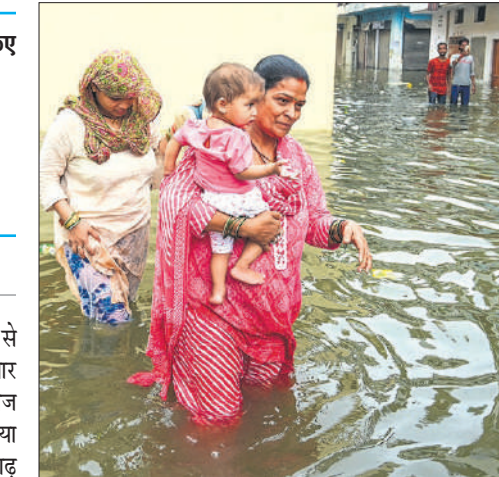
प्रयागराज के राजापुर मोहल्ले में घुसा गंगा नदी का पानी।

दरअसल, मध्य प्रदेश से आने वाली सहायक नदियों के पानी से गंगा और यमुना नदियों का जलस्तर बढ़ रहा है। इसका असर प्रयागराज से लेकर बंगाल की खाड़ी