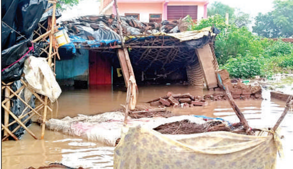
बाढ़ कम होने के बाद केसरियाडैरा में क्षतिग्रस्त मकान।