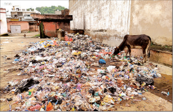
अस्पताल परिसर में लगा गंदगी का अंबार ।

अमृत विचार । जिला अस्पताल के इमरजेंसी वार्ड के पीछे गंदगी का अंबार लगा है। बावजूद इसके स्वास्थ्य विभाग के अधिकारी कोई ध्यान नहीं दे रहे हैं। इससे अस्पताल के एक हिस्से में पड़ा कूड़ा करकट और गंदगी संक्रामक बीमारियों को दवात दे रही हैं। इतना ही नहीं पोस्टमार्टम के लिए आने वाले शवों को भी इसी गंदगी के पास बने शव घर में रखा जाता है, इससे मृतक के परिजन शवों के नजदीक इसी गंदगी के आस पास बैठे रहते हैं। गौरतलब है कि जिला अस्पताल के निरीक्षण के दौरान पूर्व में उपमुख्यमंत्री ब्रजेश पाठक, जिलाधिकारी गजल भारद्वाज, संयुक्त निदेशक स्वास्थ्य अभय प्रताप सिंह सहित तमाम