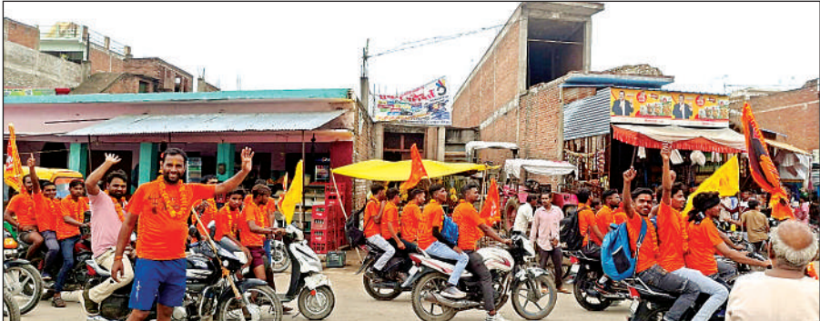
बिटूर के लिए रवाना होते श्रद्धालु।

अमृत विचार। सावन माह का अंतिम सोमवार आज है। अल सुबह से ही शिवालयों में आस्था का ज्वार उमड़ेगा। इसे लेकर रविवार को मंदिर में व्यवस्थाओं को अंतिम रूप दिया गया। वहीं सोमवार को श्रद्धालु भगवान शिव का जलाभिषेक, दुग्धाभिषेक कर भगवान को बेलपत्र चढ़ाएंगे। इधर अंतिम सोमवार को ध्यान में रखते हुए जिला प्रशासन ने भी प्रमुख मंदिरों के आसपास पुलिस कर्मियों की ड्यूटी लगाई है ताकि श्रद्धालुओं को दर्शनों में किसी तरह की असुविधा नहीं हो। कांवड़ियों के लिए मंदिर में विशेष रास्ता भी बनाया गया है।