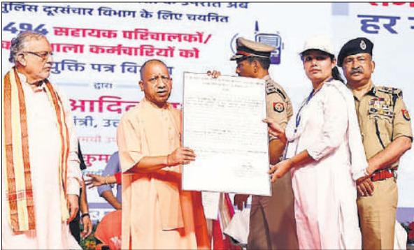
नवनियुक्त महिला पुलिसकर्मी को नियुक्ति पत्र सौंपते मुख्यमंत्री योगी आदित्यनाथ।

को अंधकारमय बना दिया था। इसका सीधा असर प्रदेश की कानून व्यवस्था पर पड़ा। इससे दंगे, अराजकता, गुंडागर्दी, आतंकी घटनाएं बढ़ गईं और जनता में असुरक्षा का माहौल बन गया। मुख्यमंत्री रविवार को इंदिरा गांधी प्रतिष्ठान में आयोजित यूपी पुलिस दूरसंचार विभाग में