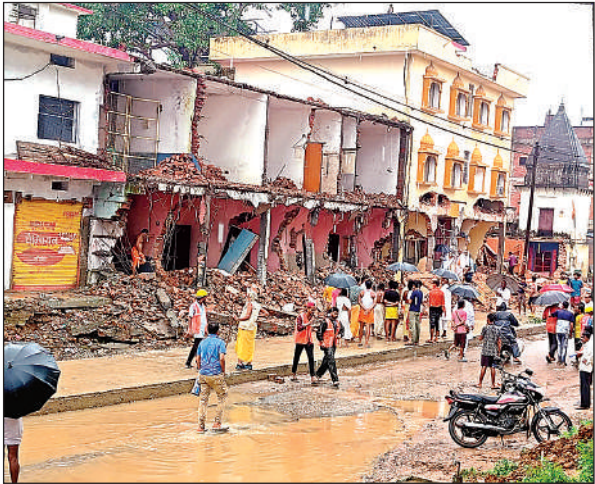
तीर्थक्षेत्र में ढहाया जा रहा अवैध निर्माण।