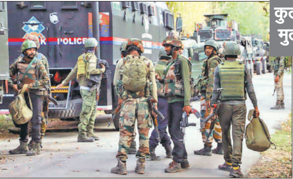
कुलगाम में सुरक्षा बलों और आतंकवादियों के बीच रविवार को भी मुठभेड़ जारी रही।

श्रीनगर पुलिस को इस प्रवृत्ति का पता तब चला जब उसने ऐसे अकाउंट से जुड़े, कुछ युवाओं को हिरासत में लिया। युवकों ने पूछताछ के दौरान स्वीकार किया कि प्रतिबंधित हिजबुल मुजाहिदीन के मारे गए आतंकवादी बुरहान वानी की तस्वीर जैसी भड़काऊ तस्वीरों का इस्तेमाल फॉलोवर का एक बड़ा आधार हासिल करने के लिए एक सोची-समझी रणनीति थी। युवकों ने बताया कि इससे वे बाद में अपने सोशल मीडिया अकाउंट पर विज्ञापनदाताओं से विज्ञापन हासिल करके उससे पैसे कमाने में सक्षम हो सके। अधिकारियों ने बताया कि