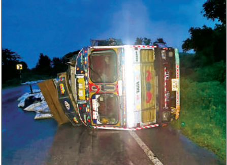
टक्कर के बाद पलटा पड़ा ट्रक। घटनास्थल पर जानकारी लेने पहुंची पुलिस।