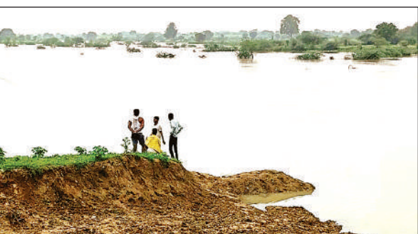
केन की बाढ़ से किसवाही में उफनाई चंद्रावल नदी का रपटा डूबा।

संचालित बाढ़ राहत शिविरों में अभी तक 18500 लंच पैकेट वितरित किए गए हैं। बाढ़ पीड़ितों को 1000 बाढ़ राहत किट (सूखा राशन) का वितरण किया जा रहा है। अस्थायी आश्रयगृह कुछेछा में पशुओं के लिए अब तक 74.80 क्विंटल भूसा बांटा गया है। बचाव और राहत कार्यों