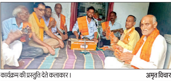
कार्यक्रम की प्रस्तुति देते कलाकार ।