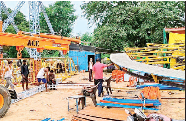
मेला मैदान पर झूले लगाते संचालक ।

कजली मेले में कीरत सागर स्थल पर अस्थाई शौचालय वाचटावर, अस्थाई पुलिस चौकी भी बनाई जाएगी साथ ही कीरत सागर तट के अलावा शहर के सभी मार्गों को सीसी टीवी कैमरों से लैस किया जाएगा। टीका कीरत सागर तट पर जुटने वाली भीड़ में महिलाओं के साथ किसी भी तरह की छेड़छाड़ व अन्य हरकत न हो सके। सीसी टीवी कैमरे लगने से अराजकतत्व कैमरे की नजर में रहेंगे। कीरत सागर तट पर बनी बारहदरी में आल्हा ऊदल