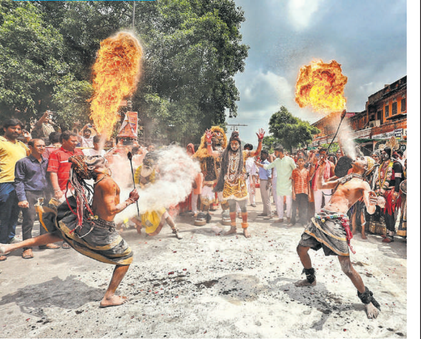
जयपुर में रविवार को कांवड़ यात्रा के दौरान कई कलाकार हेरतअंगेज प्रदर्शन करते हुए गुजरें। सड़कों पर उन्हें देखने के लिए भीड़ लग गई। श्रावण मास में कांवड़ यात्रा के दौरान ऐसे करतब दिखाने वाले कलाकार लोगों को खूब लुभा रहे हैं।