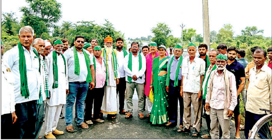
बाढ़ पीड़ितों का हाल जानते किसान यूनियन के पदाधिकारी।