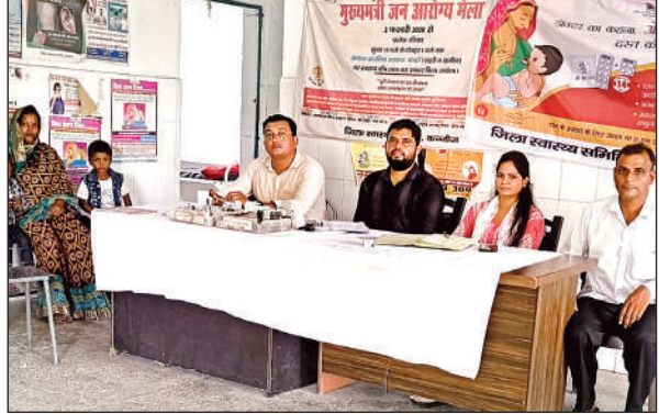
मुख्यमंत्री आरोग्य स्वास्थ्य मेले में उपचार देते डाक्टर व कर्मचारी।