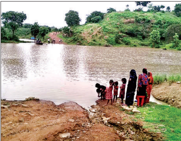
बुंदेला नाले में उफानाया पानी, यह चित्रकूट को प्रयागराज से जोड़ता है।