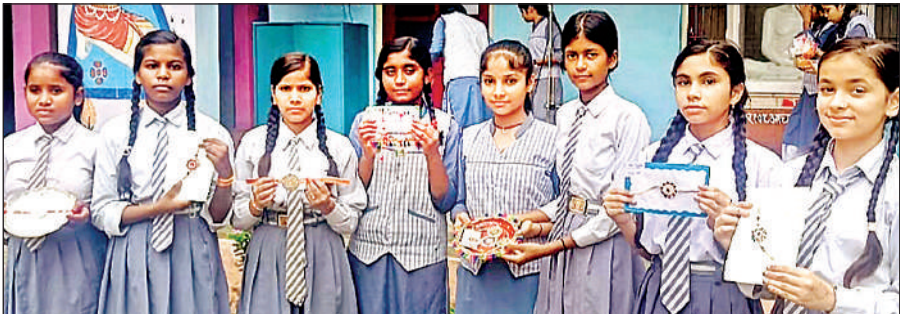
प्रतियोगिता में बनाई गई राखियां दिखाती छात्राएं।