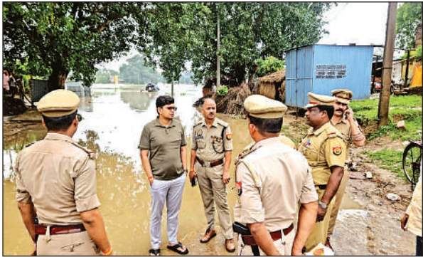
बाढ़ और व्यवस्थाओं का जायजा लेने पहुंचे जिलाधिकारी शिवशरणप्पा जीएन और पुलिस अधीक्षक अरुण कुमार सिंह।

सिलौटा स्थित नमामि गंगे जल जीवन मिशन का इंटेकवेल यमुना नदी की बाढ़ में डूब गया है। इससे