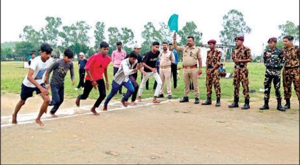
दौड़ प्रतियोगिता में दौड़ते बच्चे ।

अखंड हिंद फौज संगठन द्वारा प्रदेश में 12 से 17 वर्ष तक के