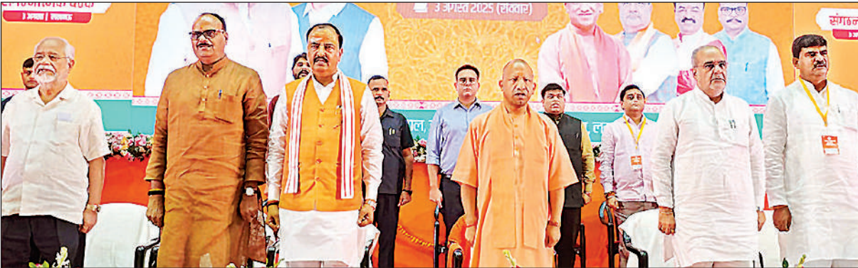
लखनऊ में आयोजित भाजपा की संगठनात्मक बैठक में उपस्थित मुख्यमंत्री योगी, प्रदेश अध्यक्ष भूपेंद्र सिंह चौधरी, उप मुख्यमंत्री केशव मोर्य व ब्रजेश पाठक और अन्य।

मुख्यमंत्री रविवार को इंदिरा गांधी प्रतिष्ठान में आयोजित भाजपा की संगठनात्मक बैठक में