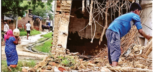
मकान के गिरने के बाद बिखरा पड़ा मलवा।