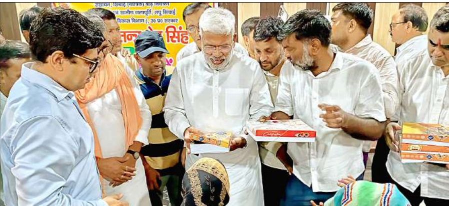
रविवार को राहत शिविर में बाढ़ पीड़ितों को लंच पैकेट बांटते जलशक्ति मंत्री स्वतंत्रदेव सिंह।