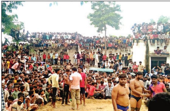
मानीमऊ के मोचीपुर में दंगल देखने उमड़ी भीड़।