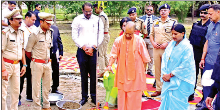
पौधा रोपित करते मुख्यमंत्री योगी आदित्यनाथ।

सीएम ने कहा कि बाढ़ राहत कार्यों के लिए सरकार ने पीएसी की फ्लड यूनिट, एनडीआरएफ, एसडीआरएफ को तैनात किया है। एनडीआरएफ की 16, एसडीआरएफ की 18 तथा पीएसी फ्लड यूनिट की 31 टीमें बाढ़ प्रभावित जनपदों में कार्य कर रही हैं। सभी 21 जनपदों में 1250 से अधिक नौकाओं की व्यवस्था की गई है, जिसके माध्यम से नागरिकों