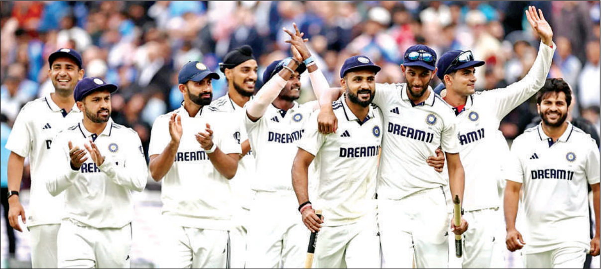
इंग्लैंड के खिलाफ पांचवां व अंतिम मैच जीतने के बाद जश्न मनाते भारतीय टीम के युवा खिलाड़ी ।

भारत ने दो मैच गंवाए, लीड्स में पहला मैच और लॉर्ड्स में तीसरा टेस्ट। इन मैच में भी भारत जीत सकता था लेकिन यही वह सबक है जो युवा खिलाड़ियों को मिला है। भारतीय टीम की सबसे बड़ी विशेषता यह रही कि उसने किसी भी मैच में आखिर तक हार नहीं मानी और दो मैच में शानदार वापसी की। इससे टीम के जज्बे का पता चलता है। इस श्रृंखला में यह भी साबित हो गया कि भारतीय टीम का भविष्य सुरक्षित हाथों में