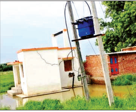
नलकूप का खराब ट्रांसफार्मर।

अमृत विचार। विकासखंड के बड़ी आबादी वाले गांव सिसोलर में पेयजल आपूर्ति के लिए बनी जल निगम की टंकी में पानी पहुंचाने के लिए बने ट्यूबवेल का ट्रांसफार्मर बीते 15 दिनों से खराब होने के कारण ग्रामीणों के सामने गंभीर संकट बना हुआ है। ग्रामीणों ने बताया कि गांव में जल निगम ने कई वर्ष पहले पानी की टंकी बनाई थी। इसमें पानी पहुंचाने के लिए दो नलकूप लगाए गए थे। एक नलकूप टंकी के कैपस में तथा दूसरा नलकूप टंकी से दूर खेतों में लगाया गया था। इनमें से खेतों में लगा नलकूप कुछ वर्षों में ध्वस्त होने से पुनः नए नलकूप का निर्माण कराया गया है, जो कि टंकी