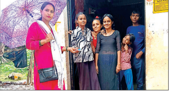
बाढ़ पीड़ितों को दवाएं वितरित करती स्वास्थ्य टीम की महिला कर्मचारी।