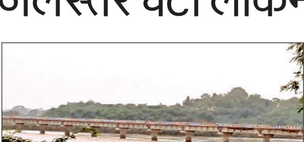
यमुना नदी का बढ़ा जलस्तर।

बहनें डाक से दूर-दराज रह रहे भाई के लिए राखी भेज रही हैं। डायमंड की तरह दिखने वाली राखी महिलाओं की पहली पसंद बनी हुई है। शहर में बाजारों के अलावा गांव व सेक्टर-सोसाइटियों के बाजारों में दुकानों पर राखियां सज चुकी हैं। रामशंकर का कहना है कि उनके कोरियर सेंटर से कुछ दिनों से 150 से अधिक बहनों ने भाइयों के लिए राखी संग उपहार भेजे हैं।