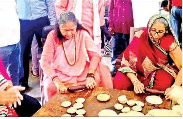
राहत रसोई में पूड़ियां बेलती पूर्व केंद्रीय मंत्री साध्वी निरंजन ज्योति।