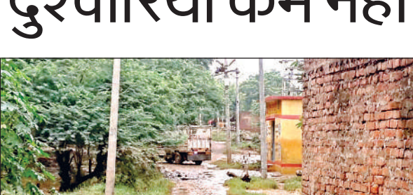
जलस्तर घटने के बाद गांव की गलियों में हुआ कीचड़।