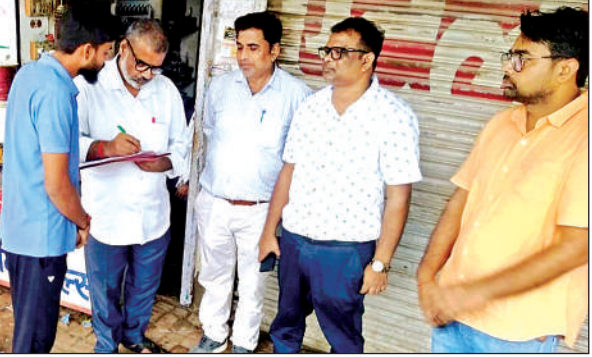
मेडिकल स्टोर संचालक के खिलाफ कार्रवाई करने पहुंची स्वास्थ्य विभाग की टीम।