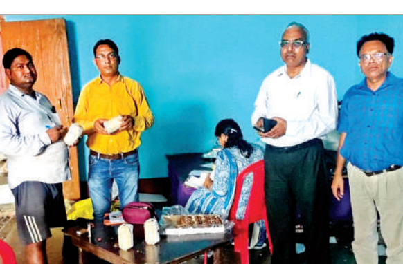
छापामार कार्रवाई करती खाद्य सुरक्षा विभाग की टीम।

अमृत विचार। रक्षाबंधन पर्व पर मिठाईयों सहित अन्य मिलावटी खाद्य पदार्थों के निर्माण, वितरण व बिक्री पर प्रभावी अंकुश लगाए जाने को जिलाधिकारी के निर्देश पर खाद्य सुरक्षा विभाग की तरफ से छापेमारी की गई। इस दौरान 11 नमूने भरे गए जबकि कई क्विंटल कच्चा माल व रिफाईंड आयल सीज किया गया। मंगलवार को विभाग की ओर से सदर तहसील क्षेत्र में बेहरिन, तिर्वा, कन्नौज स्थित नकली मिठाई निर्माण इकाई पर छापामार करवाई की गई। इसमें इकाई में निर्मित मिल्क केक के 02, बर्फी का 01, डोडा बर्फी का 01, निर्माण में प्रयोग में लाये जा रहे रवा का 01, सोयाबीन रिफाईंड तेल का 01 एवं चीनी का 01, कुल 07 नमूने जांच हेतु संग्रहित किए गए। इसके अलावा एक खुले टीन