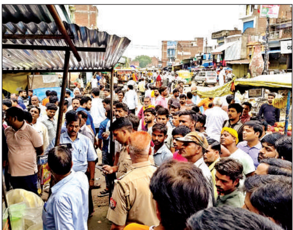
घटना स्थल पर उपस्थित सैकड़ों व्यापारी व पुलिस।

मिठाई की दुकान पर नमूना भरने गए अस्सिस्टेंट कमिश्नर फूड से व्यापारी ने उनका परिचय पूछ लिया। इससे नाराज अस्सिस्टेंट कमिश्नर फूड ने मिठाई व्यापारी को थप्पड़ जड़ दिया। व्यापारी की पिटाई से नाराज सैकड़ों व्यापारियों ने अस्सिस्टेंट कमिश्नर फूड की कार को घेर लिया और उन्हें थाने ले जाने के लिए कार के सामने खड़े हो गए। मौके पर पहुंची पुलिस ने भी उन्हें थाने चलने के लिए कहा लेकिन वह सभी अपनी कारो को