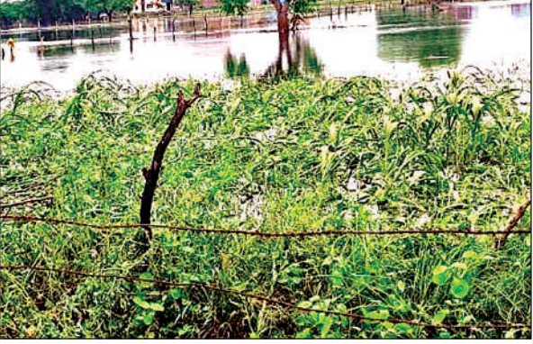
खरीफ की फसल में भरा बाढ़ का पानी।

उतरते ही तबाही का मंजर देखकर किसानों के चेहरों से खुशी गायब हो गई है। क्षेत्र के ग्राम प्रधानों ने बताया कि बाढ़ से किसानों का सर्वाधिक नुकसान हुआ है। खेतों में बाढ़ का पानी भर जाने से एक माह पूर्व बोई गई खरीफ की फसलें सड़ कर पूरी तरह से जमींदोज हो गई। बेतवा नदी की बाढ़ से ब्लॉक की ग्राम पंचायत मोराकांदर, कुम्हऊपुर, सहुरापुर, पौथिया, कलौली तीर, हलापुर, अभिरता, चंदौखी, कुंडोरा, दरियापुर, बरदहा सहजना, टिकरौली, पारा ओझी, बड़ा गांव प्रभावित हुई हैं। इसी तरह यमुना नदी की बाढ़ से पत्थोरा, सुरौली बुजुर्ग, बरुआ, भीरा के अलावा सुरौली बुजुर्ग के मजरा छोटा कछार, बड़ा कछार प्रभावित है। वहीं चंद्रावल नदी की बाढ़ ने कैथी, मौहर में कहर बरपाया है। ब्लॉक क्षेत्र में करीब 500 हेक्टेयर की फसल बाढ़ के पानी से सड़ कर नष्ट होने का अनुमान है।