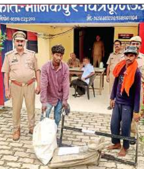
गिरफ्त में आरोपी और बरामद माल।