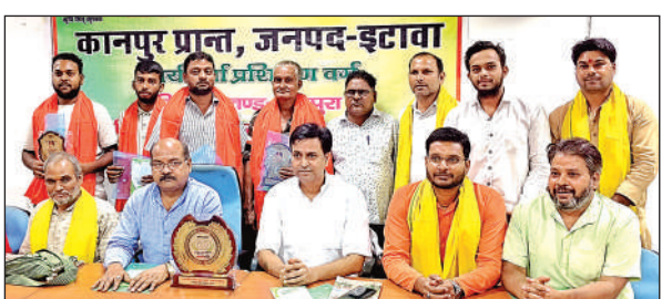
प्रशिक्षण में मौजूद अतिथिगण।