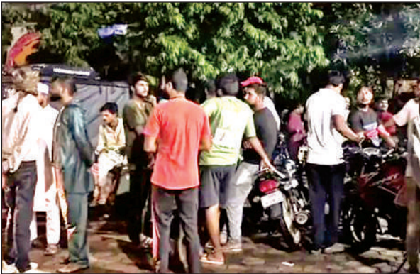
महोबा में घटना स्थल पर जुटी लोगों की भीड़।

बाइक चालक को नाजुक हालत में सामुदायिक स्वास्थ्य केन्द्र ले जाया गया, जहां से उसे मेडिकल कॉलेज झांसी के रेफर कर दिया गया। दुर्घटना के बाद मौके पर पहुंची पुलिस कार चालक की तलाश में जुट गई है। लेकिन देर शाम तक पुलिस कार चालक का सुराग नहीं लगा सकी। पुलिस ने शव को पोस्टमार्टम के लिए भेजा।