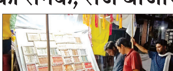
बाजार में खरीदारी करते ग्राहक।

युवतियां अपने भाइयों के नाम और पसंद के हिसाब से दुकानदारों को आर्डर देकर राखियां भी बनवा रही हैं। हालांकि दुकानदार इसका चार्ज अधिक ले रहे हैं। मंगलवार को शहर के लेडीज मार्केट, सदर बाजार, होमगंज में राखियों की खासी खरीदारी हुई। बच्चों के लिए कार्टून वाली राखियां, युवाओं के लिए फैसी और स्टायलिश राखियां, बड़े बड़े-बुजुर्गों के लिए पारंपरिक राखियां भी मौजूद हैं।