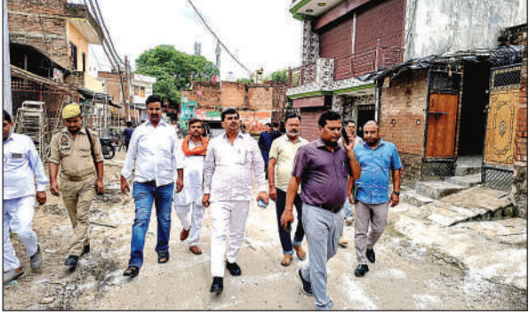
निरीक्षण करते एसडीएम व पालिका अध्यक्ष।

यमुना नदी की बाढ़ की वजह से कालपी नगर के मोहल्लों राजघाट, आलमपुर, कागजीपुरा, रामगंज, तरीबुल्दा की बस्तियों में पानी घुस गया था। फलस्वरूप तमाम सड़कें और कई मकान तीन दिनों तक बाढ़