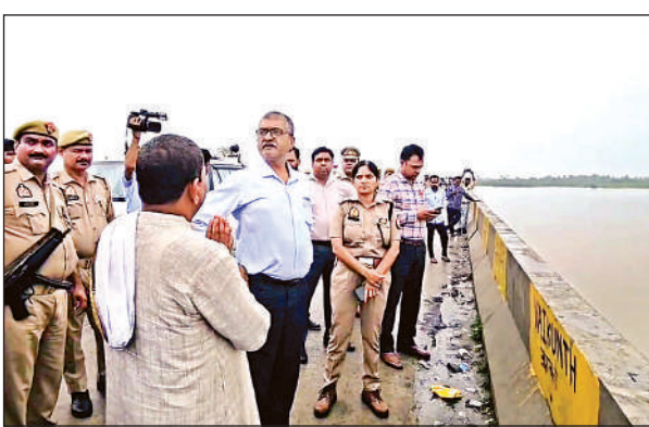
ढाई घाट गंगा पुल से बाढ़ को देखते डीएम व एसपी ।

जिलाधिकारी ने ग्रामीणों से बात कर बाढ़ से होने वाली समस्याओं व कटान की जानकारी की। साथ ही सिंचाई विभाग के अधिकारियों को आवश्यक व प्रभावी उपाय करने के निर्देश दिए। उन्होंने कहा कि चिकित्सा विभाग संबंधित गांवों में आवश्यक दवाएं व डॉक्टरों की