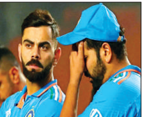
विराट कोहली व रोहित शर्मा।

कोहली और रोहित शर्मा तथा चोटों से जूझने वाले जसप्रीत बुमराह जैसे सीनियर खिलाड़ियों का योगा होगा। कोहली 36 और रोहित 38 साल के हैं और ये दोनों संभवतः ऑस्ट्रेलिया में तीन मैच की एकदिवसीय श्रृंखला पड़ने पर योगदान दिया, आकाश दीप और प्रसिद्ध कृष्णा प्रभावी नजर आए और साई सुदर्शन ने अपनी दीर्घकालिक उपयोगिता की झलक दिखाई। लेकिन इस शानदार प्रयास का एक और आयाम भी है। इससे सवाल उठता है कि टी20 और टेस्ट क्रिकेट से संन्यास लेने वाले विराट