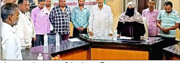
मौन रखकर शोक व्यक्त करतीं चेयरमैन व कर्मी।