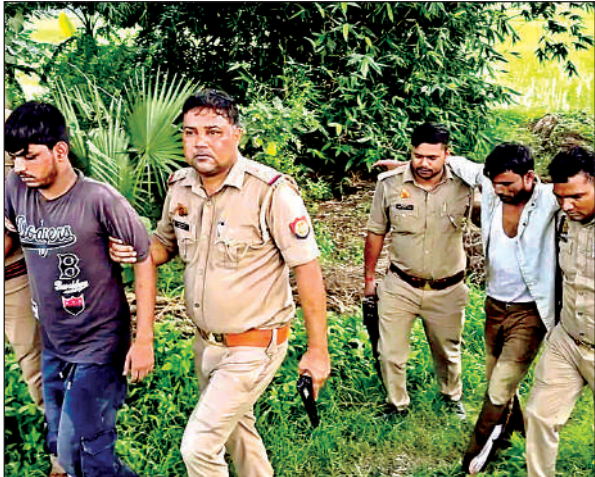
मुठभेड़ में घायल बदमाशों को ले जाती पुलिस।