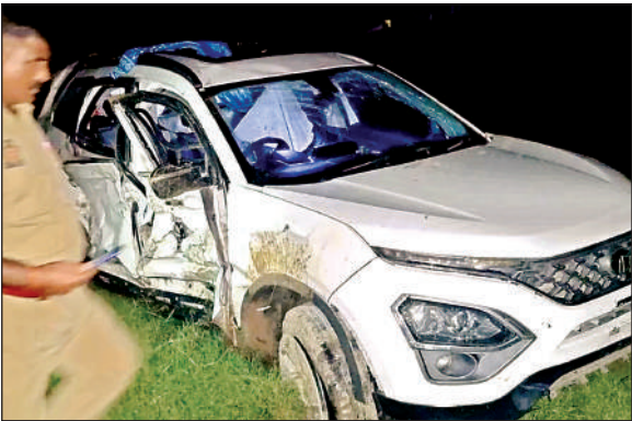
घटनास्थल पर खड़ी क्षतिग्रस्त कार।