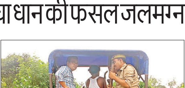
उप जिलाधिकारी ने बाढ़ प्रभावित क्षेत्र का किया निरीक्षण।

असुविधा को देखते हुए तहसील प्रशासन द्वारा ग्राम तीसराम की मड़ैया, ऊगरपुर, कछुआगढा, नगला दुर्ग के ग्रामीणों को नाव उपलब्ध करा दी गई है जिससे लोग नाव के सहारे आवागमन कर अपनी दिनचर्या पूरी कर सकें। वहीं