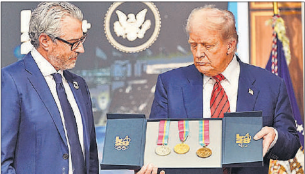
क्वाइट हाउस में एक कार्यक्रम में ट्रंप को ओलंपिक 1984 के पदकों सेट प्रदान किया गया।

भारत पर 25 प्रतिशत और टैरिफ लगाने की घोषणा से ऐन पहले अमेरिकी राष्ट्रपति ने कहा कि वह जल्द ही उन देशों पर टैरिफ लगाने का फैसला करेंगे जो रूसी ऊर्जा खरीद रहे हैं। ट्रंप ने भारत पर यह आरोप भी लगाया कि वह बड़ी मात्रा में रूसी तेल खरीद रहा है और उसे मुनाफे में बेच रहा है। भारत ने रूस से कच्चे तेल की खरीद के लिए नई दिल्ली को अनुचित और अविवेकपूर्ण तरीके से निशाना बनाने पर सोमवार को अमेरिका और यूरोपीय संघ पर जोरदार पलटवार किया था। ट्रंप ने रूस से ऊर्जा खरीदने वाले चीन समेत सभी देशों पर 100 प्रतिशत शुल्क लगाने की धमकी देने