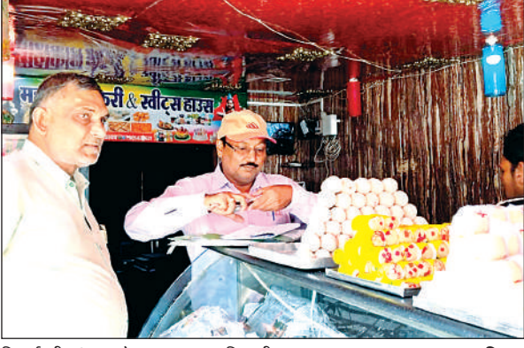
मिठाई की जांच करते खाद्य सुरक्षा अधिकारी।

अमृत विचार। रक्षाबंधन के त्योहार को देखते हुए जिले में खाद्य विभाग ने छापामारी अभियान शुरू कर दिया है। इससे दुकानदारों और होटल संचालकों में खलबली मच गई है। खाद्य सुरक्षा एवं औषधि प्रशासन ने एक-एक खाद्य की दुकान चेक कर सैंपल लिए। छापामार अभियान को देखकर तमाम दुकानदारों ने खाद्य की दुकानें बंद कर दी। जिलाधिकारी के निर्देश पर आम जनमानस को शुद्ध खाद्य पदार्थ उपलब्ध कराने के उद्देश्य से रक्षाबंधन त्योहार के मद्देनजर चेंकिंग अभियान चलाया। सुरक्षा एवं औषधि प्रशासन ने जनपद के नगर पालिका परिषद महोबा, राजपूत कालोनी कुलपहाड़, श्रीनगर तिगेला, बेलाताल में छापेमारी कर