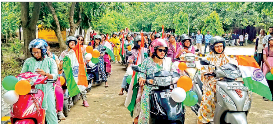
कलेक्ट्रेट परिसर से तिरंगा यात्रा शुरू होने के दौरान दोपहिया वाहनो पर बैठी शिक्षिकाएं।

बुधवार को भारत माता की जय के उद्घोष के उत्साह के साथ रैली कलेक्ट्रेट से प्रारंभ होकर गोल कुआं, लाखन तिराहा, मकरंदनगर होते हुए पीएसएम कॉलेज परिसर में समाप्त हुई। रैली रवाना करने समय जिलाधिकारी ने कहा कि