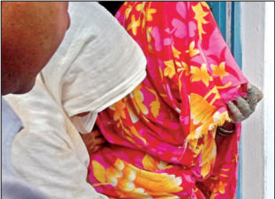
झुलसी महिला को बाहर लाते लोग।