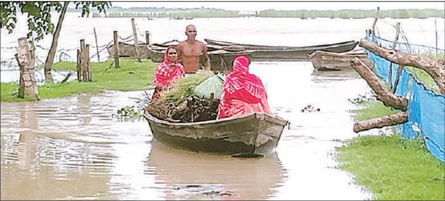
बारबंकी में सरयू नदी के बढ़े जलस्तर के बीच नाव से चारा लाते ग्रामीण।

उन्होंने कहा कि संबंधित कृषि यंत्र भी किसानों को समय से