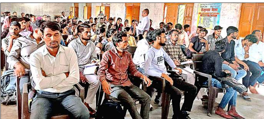
मकरांव के रोजगार मेले में प्रतिभाग करते अभ्यर्थी।