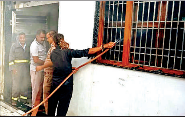
आग बुझाते फायर ब्रिगेड और मोहल्ले के लोग।