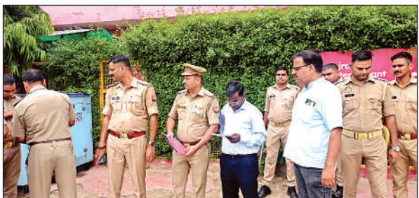
रेस्टोरेट को सील कराते तहसीलदार फोर्स के साथ।