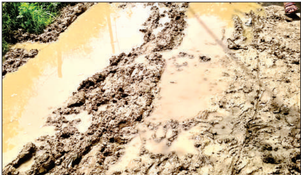
गांव की गलियों में भरा कीचड़।

आगामी समय में समस्याओं का सामना न करना पड़े। ग्राम बडैरा में बाढ़ पीड़ितों ने अवगत कराया कि मकान कच्चे व निचले स्तर पर हैं, जिससे बाढ़ के दौरान जल भराव व क्षतिग्रस्त होने की स्थिति उत्पन्न होती है। अतः ऊंचे स्तर पर भवन निर्माण हेतु पट्टा आवंटन करा दिया जाये और मुख्यमंत्री आवास दिला दिए जाएं। राज्यमंत्री ने आश्वस्त किया कि ग्राम प्रधान द्वारा एक सप्ताह में भूमि प्रबंधन समिति के द्वारा प्रस्ताव तैयार कर एक सप्ताह में उपलब्ध कराएं जिससे आवंटन की प्रक्रिया पूर्ण की जा सके। इस मौके पर राज्यमंत्री को बाढ़ पीड़ितों