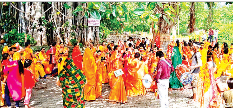
कावड़ यात्रा के दौरान थिरकती महिलाएं।

अमृत विचार। भगवान श्री राम के पावन तीर्थ श्री रामकुंड धाम में बुधवार को पवित्र कांवड़ यात्रा के लिये पीताम्बरी परिधानों से सजी सैकड़ों महिलाओं ने हर-हर महादेव व ओम नमः शिवाय के उदघोष के साथ रामकुंड से पावन जल भर कर उमंगेश्वर ज्योतिर्लिंग सहित अन्य शिवलिंगों का जलाभिषेक किया। इस दौरान महिला श्रद्धालु बेंडबाजों की धुन पर जमकर थिरकीं। सावन माह के चलते बुधवार को महिलाओं ने कांवड़ और जल पात्रों को तरह-तरह के फूलों से आकर्षक सजाकर यात्रा निकाली। रास्ते में