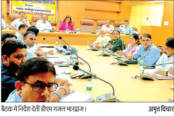
बैठक में निर्देश देती डीएम गजल भारद्वाज।

अमृत विचार। जिलाधिकारी गजल भारद्वाज की अध्यक्षता में बुधवार को कलेक्ट्रेट सभागार में जिला स्वास्थ्य समिति की बैठक आयोजित की गई। बैठक में स्वास्थ्य विभाग से संबन्धित पल्स पोलियो, जननी सुरक्षा योजना, मातृ मृत्यु, शिशु मृत्यु, प्रधानमंत्री सुरक्षित मातृत्व अभियान, पीएमएसएम दिवसों में क्यूआरकोड के माध्यम से अल्ट्रासउंड टीकाकरण परिवार कल्याण, राष्ट्रीय बाल स्वास्थ्य कार्यक्रम संचारी रोग अभियान आदि की समीक्षा की गई। जिलाधिकारी ने जनपद के सभी एमओआईसी को जननी सुरक्षा योजना के अंतर्गत संस्थागत प्रसव को बढ़ाने एवं एफआरयू की क्रियाशीलता तथा लाभार्थियों को प्रसव उपरांत 24 घंटे तक रोकने सहित गुणवत्ता पूर्ण भोजन प्रदान करने के लिए निर्देशित किया। डीएम ने नाराजगी व्यक्त करते हुए सभी चिकित्सा अधीक्षकों को निर्देश देते हुए कहा कि चाइल्ड रजिस्ट्रेशन