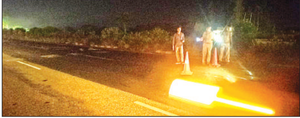
हादसे के बाद मौके पर मौजूद पुलिस।