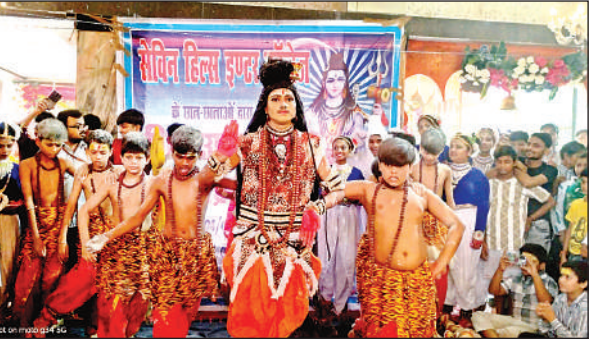
कार्यक्रम में अपनी प्रस्तुति देते छात्र-छात्राएं।