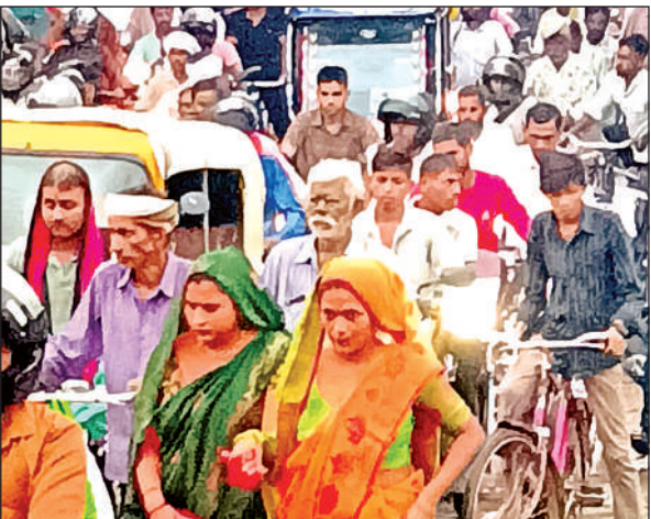
जाम में फंसकर परेशान होते लोग।