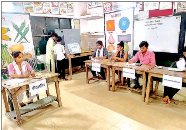
विद्यार्थियों ने किया मतदान।