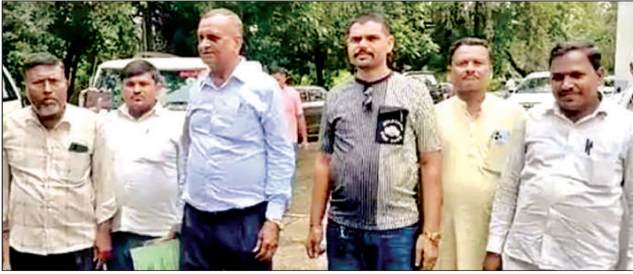
जिलाधिकारी को ज्ञापन देने जाने जाते ग्राम प्रधान।