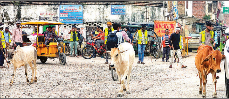
इस तरह जगह-जगह विवरण करते हैं अन्ना मवेशी।