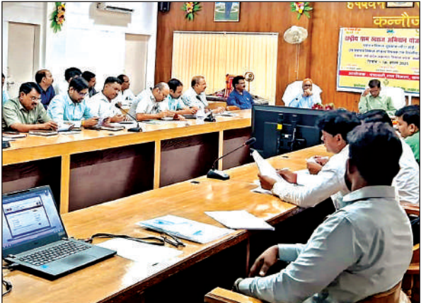
विकास भवन सभागार में कार्यशाला में शामिल अधिकारी व अन्य लोग।