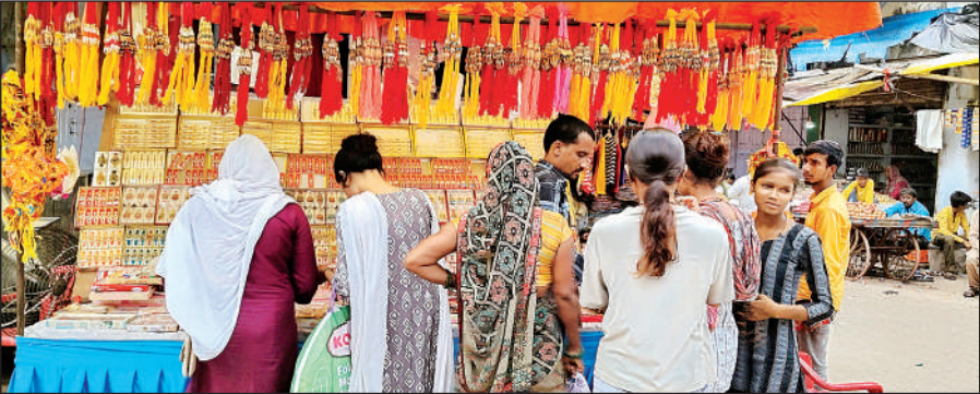
राखी खरीदने के लिए जुटी भीड़।

अमृत विचार। भाई बहन के अटूट स्नेह और पवित्र बंधन का त्योहार रक्षाबंधन जैसे-जैसे नजदीक आता जा रहा है, वैसे-वैसे बाजार में रैनक बढ़ती जा रही है। शहर ही नहीं बल्कि ग्रामीण क्षेत्रों में भी दुकानदारों ने राखी की अस्थायी दुकानें सजाकर तैयार कर ली है। जिले में 9 अगस्त को भाई बहन का पवित्र त्योहार रक्षा बंधन मनाया जाएगा। रंग बिरंगी और एक से एक खूबसूरत राखियां इस दृश्य का बाजार में नजर आ रही हैं। बहनों ने अपने भाई की कलाई में बांधने के लिए अभी से राखियों की खरीददारी शुरू कर दी है। पर्व के मद्देनजर बाजार में लोगों की चहल-पहल बढ़ गई है। गौतमलब है कि रक्षाबंधन त्योहार आते ही शहर में राखियों का बाजार