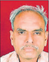
प्रकाश श्रीवास्तव स्वतंत्र लेखक

एक अनुमान के अनुसार, पिछले वर्ष फेब्रु में आईटी सेक्टर से जुड़े लगभग पचास हजार लोगों की नौकरियां खत्म हो गईं। साथ ही देश की शीर्ष छह आईटी सर्विस कंपनियों में कर्मचारियों को नियुक्त करने में 72 फीसदी गिरावट आई है। कहने की जरूरत नहीं कि देश का आईटी क्षेत्र जो सामाजिक गतिशीलता और गरीबी में जन्मे बच्चों द्वारा शिक्षा और कड़ी मेहनत से उच्च वेतन वाली नौकरियां हासिल करने का जरिया रहा है, आर्टिफिशियल इंटेलीजेंस के आने से तेजी से नया रूप लेता जा रहा है। प्रमुख कंपनियों में नौकरियों का जाना या उसमें कमी आना यह कोई अकेली घटना नहीं है। पर ये घटनाएं भारत में ऐसी नौकरियों, जिसमें विशिष्ट कौशल, उच्च शिक्षा और प्रशिक्षण की आवश्यकता होती है और ये आमतौर पर वित्त, स्वास्थ्य सेवा, कानून और प्रौद्योगिकी जैसे सेक्टर से जुड़ी होती हैं, कि प्रकृति में एक संरचनात्मक बदलाव का संकेत लिए हैं।