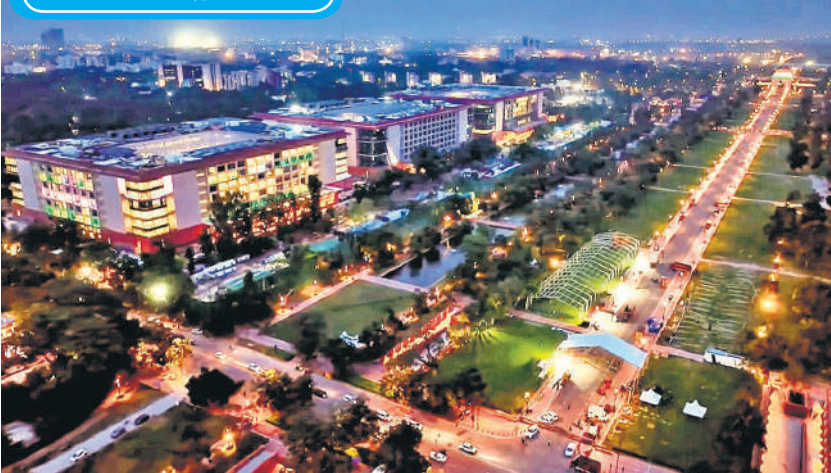
प्रधानमंत्री नरेंद्र मोदी ने बुधवार को नई दिल्ली में नवनिर्मित कर्तव्य भवन का उद्घाटन किया। इस दौरान उनकी उपस्थिति में आयोजित एक सार्वजनिक कार्यक्रम के दौरान कर्तव्य पथ को प्रकाशित किया गया।

मॉस्को। रूसी राष्ट्रपति कार्यालय क्रेमलिन ने बुधवार को कहा कि अमेरिकी राष्ट्रपति डोनाल्ड ट्रंप के विशेष दूत स्टीव वित्कोफ रूस के राष्ट्रपति व्लादिमीर पुतिन से यहां मुलाकात की है। यह बैठक क्वाइट हाउस की ओर से रूस को यूक्रेन के साथ शांति समझौता करने के लिए दी गई समय सीमा से कुछ दिन पहले हुई। अमेरिका ने चेतावनी दी है कि शांति समझौता नहीं करने पर रूस को गंभीर आर्थिक दंड का सामना करना पड़ सकता है, जिससे रूस से तेल खरीदने वाले देश भी प्रभावित हो सकते हैं। रूस के लिए ट्रंप की समय सीमा शुष्कवायु को समाप्त होगी। ट्रंप ने यूक्रेन के नागरिक क्षेत्रों पर रूस के बढ़ते हमलों पर पुतिन के प्रति निराशा व्यक्त की है।