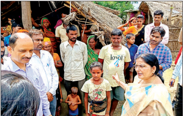
कासिमपुर गांव में महिलाओं व बच्चों से बात करती प्रभारी मंत्री व मौजूद अधिकारी।