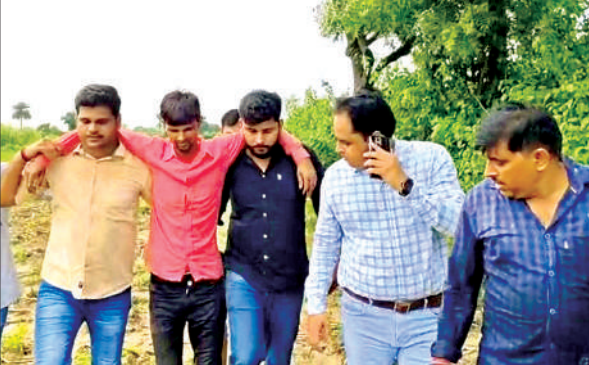
घायल आरोपी को अस्पताल ले जाया जा रहा।