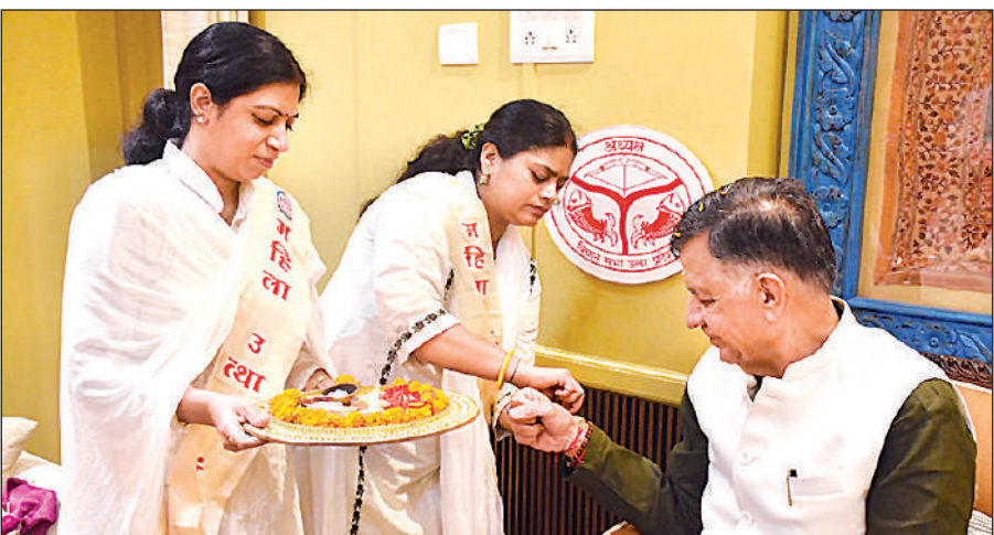
लखनऊ में विधानसभा अध्यक्ष सतीश महाना को रक्षा सूत्र बांधती महिला उत्थान मंडल की बहनें।

निदेशक के मुताबिक, योजना का लाभ प्राप्त करने के लिए उप-की निवासी महिलाएं ssppv-up.gov.in वेब पोर्टल के माध्यम से ऑनलाइन आवेदन कर सकती हैं। इससे पूर्व वित्तीय वर्ष 2025-26 की पहली तिमाही (अप्रैल-जून) में इस योजना के तहत 35,78,111 लाभार्थी महिलाओं को 1062.15 करोड़ रुपये की धनराशि प्रदान की गई थी।