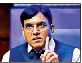
खेलमंत्रि मनसुख मांडविया।

खेलमंत्रि मनसुख मांडविया ने 23 जुलाई को लोकसभा में यह बिल रखा जिसके प्रावधान 15 (2) में कहा गया है कि किसी मान्यता प्राप्त खेल संगठन को इस अधिनियम के तहत अपने कार्यों, कर्तव्यों और शक्तियों के प्रयोग के संबंध में सूचना का अधिकार (आरटीआई) अधिनियम, 2005 के तहत एक सार्वजनिक प्राधिकरण माना जाएगा। आरटीआई बीसीसीआई के लिए एक पेचीदा मुद्दा रहा है जिसने इसके अंतर्गत आने का लगातार