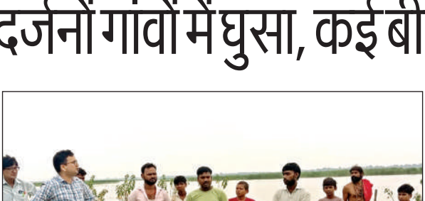
बाढ़ का पानी गांव में घुसने से ग्रामीण परेशान।

अमृत विचार।। पिछले दो दिनों से गंगा नदी के जलस्तर में तेजी से इजाफा हुआ है जिससे गंगा का रुख अब ग्रामों की ओर है। गंगा में सुबह नौरा बांध से 1 लाख 15 हजार क्यूसेक, बिजनौर बैराज से 2 लाख 26 हजार क्यूसेक, हरिद्वार बैराज से 1 लाख 79 हजार क्यूसेक पानी छोड़ा गया। आज सुबह पांचाल घाट पर गंगा का जलस्तर 136.95 मीटर पर दर्ज किया गया। गंगा का पानी खेतों से होते हुए अब गांवों में प्रवेश कर रहा है जिससे लोगों का जनजीवन अस्त व्यस्त होने लगा है। पानी फर्रुखाबाद बदायूं मार्ग को छूकर बहने लगा है। जलस्तर बढ़ने से नगरीया जवाहर, कुसुमापुर, सबलपुर, मड़ैया तौफीक, भारूपुर