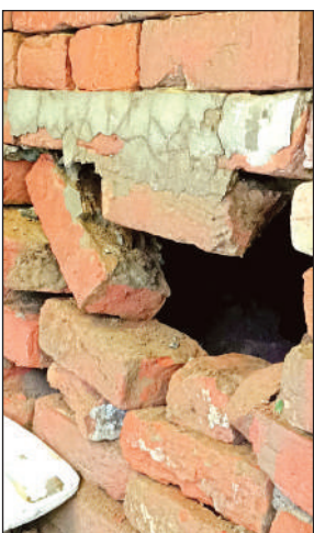
दीवार में लगाई गई सेंध।