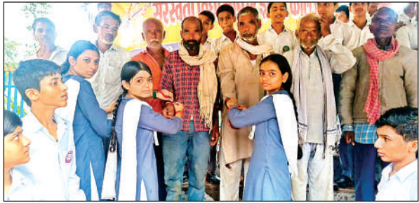
आल्हा चौक में मजदूरों को राखी बांधती छात्राएं।