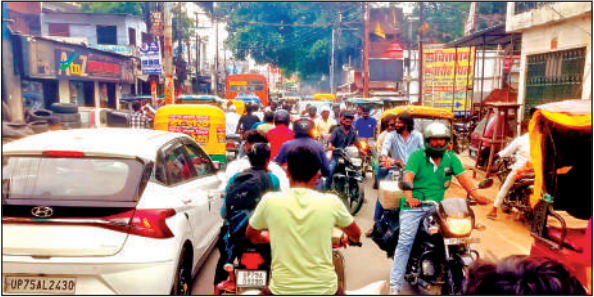
भीषण जाम में फंसे वाहन सवार।

रक्षा बंधन पर्व पर लोग खरीद दारी के लिए बाजार को निकले व त्योहार मनाने के लिए बाहर से आए लोगों को जाम से जूझना पड़ा। पूरा शहर दिनभर जाम से कराहता रहा। रेलवे स्टेशन से बस स्टैंड और गुरुतेग बहादुर पुल पर भीषण जाम की स्थिति रही। ट्रैफिक पुलिस और पीआरडी जवान जाम खुलवाने की जोर आजमाइश करते दिखाई दिए लेकिन जाम की स्थिति खास की तस रही। जाम ने यात्रियों और