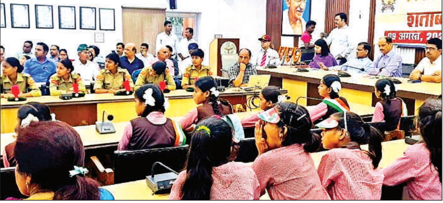
कलेक्ट्रेट सभागार में काकोरी ट्रेन एक्शन शताब्दी समारोह में मौजूद अधिकारी व विद्यार्थी।