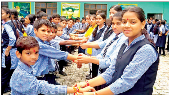
विद्यालय में राखी बांधकर रक्षाबंधन त्योहार मनाते बच्चे।