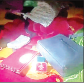
घर में बिखरा पड़ा सामान।

आरोप है कि महिलाएं कमरे में रखी अलमारी से डेढ़ तोले का सोने का नेकलेस, दो जोड़ी सोने की