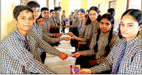
बहनों को उपहार देते छात्र।

अमृत विचार। कलेक्ट्रेट परिसर में आयोजित हुई जिलास्तरीय रंगोली प्रतियोगिता में कई वर्षों बाद रिकार्ड टूट गया। परिषदीय स्कूलों के शिक्षक-शिक्षिकाओं ने शामिल होकर रंगोली को दोपहर 12 बजे से पहले लेऑन रूप दे दिया। जलालाबाद बल्लिक क्षेत्र के शिक्षक-शिक्षिकाओं का पहला स्थान आया। द्वितीय स्थान पर कन्नौज और तृतीय पुरस्कार गुगरापुर ब्लॉक के अध्यापकों को मिला।