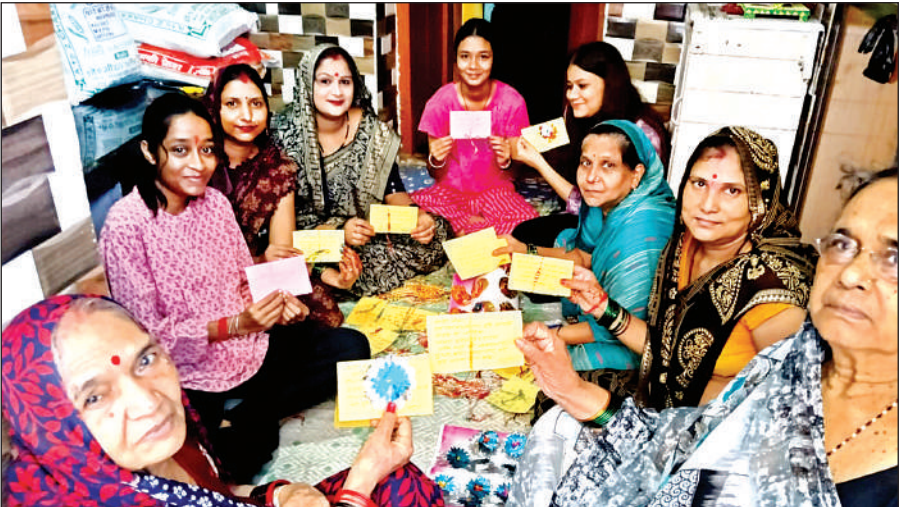
बुंदेली बहनों ने प्रधानमंत्री नरेंद्र मोदी को राखियां भेजकर अलग बुंदेलखंड राज्य की मांग उठाई।