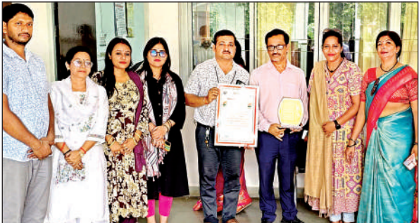
पहले स्थान पर आई जलालाबाद रंगोली के पास पुरस्कार लेकर खड़े अध्यापक।