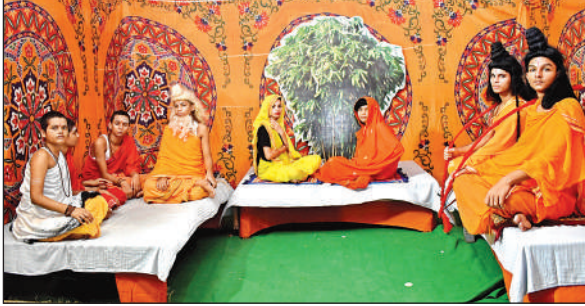
झूला महोत्सव में सजी झांकी।