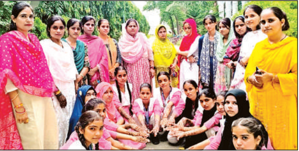
मेहंदी प्रतियोगिता में प्रतिभाग करती छात्राएं।