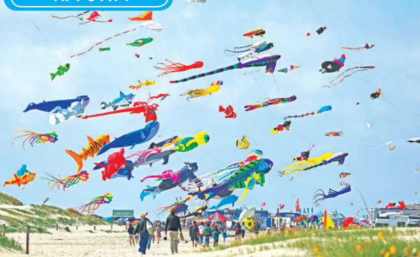
जर्मनी का सेंट पीटर-ऑर्डिंग जर्मनी का सबसे बड़ा समुद्र तट है और पतंगबाजी के लिए एक लोकप्रिय स्थान है। शुक्रवार को यहां शुरु हुए पतंग उत्सव के दौरान समुद्र तट पर अलग-अलग तरह की रंग-बिरंगी पतंगें उड़ती दिखाई दीं। एजेंसी

डार्क वेब इंटरनेट का वह हिस्सा है जिसे आम सर्व इंजन से नहीं खोजा जा सकता। डार्क वेब पर ड्रग्स, हथियार, नकली पहचान पत्र जैसी गैरकानूनी चीजों की खरीद-फरोख के साथ हैक किए गए डेटा का लेनदेन होता है। यहां यूजर की पहचान छुपी रहती है।