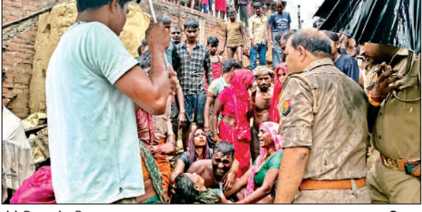
रोते बिलखते परिजन।