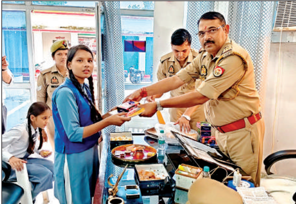
कोतवाली निरीक्षक को राखी बांधती छात्राएं।