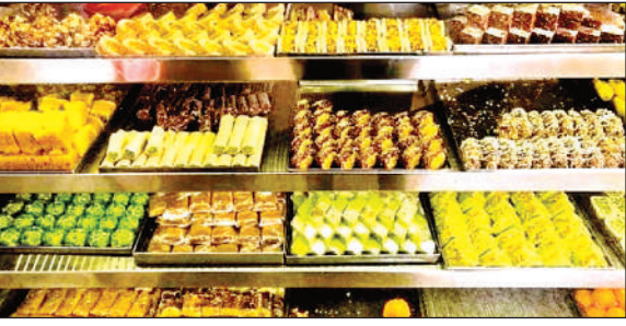
बाजार में सजी विभिन्न प्रकार की मिठाइयां।

अमृत विचार। भाई बहन के त्योहार रक्षाबंधन पर मिठाई खरीदने से पहले सावधानी बरतें अन्यथा सेहत पर भारी पड़ सकती है। खोआ, पनीर, दूध और मिठाई खरीदने से पहले कुछ बातों का ध्यान देना आवश्यक है। विशेषज्ञ मिठाई की जांच करने के कई तरीके बताते हैं। बताया कि मिठाई का एक छोटा-सा टुकड़ा तोड़कर पानी में डालकर देखें। अगर पानी का रंग बदल जाता है, जैसे कि पीला या गुलाबी हो जाता है तो इसका मतलब है कि मिठाई में हानिकारक रंग मिलाया गया है। अगर पानी में झाग आता है तो यह संकेत है कि मिठाई में डिटर्जेंट या अन्य केमिकल मिलाया गया है। अगर पानी की सतह पर तेल की परत बन जाती है तो मिठाई में