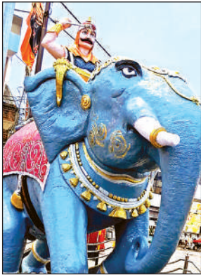
हाथी पर सवार वीर आल्हा और घोड़े पर सवार ऊदल।

विंध्य पर्वत मालाओं सुरम्य सरोवरों और मोहक नैसर्गिक छटाओं से परिपूर्ण बुंदेलखंड ऐतिहासिक, लोक साहित्य, कला संगीत की वैविध्य के लिए जाना जाता है। महोबा चंदेल राजा परमाल के शासन की गौरव गाथा से जुड़ा