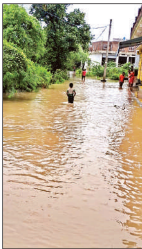
सड़क पर भरा पानी

शहर के लौड़ी तिराहा से गैस एजेंन्सी रोड पर चार फीट पानी भर जाने से कई घंटे तक आवागमन ठप रहा। कई वाहन फंस गए। धीरे धीरे पानी कम होने के बाद किसी तरह वाहनों को निकाला गया। इसी तरह चरखारी बाईपास रोड पर बलदेव नगर नयापुरा में चारों तरफ पानी भर जाने से लोग घरों तक नहीं आ