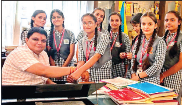
रक्षाबंधन पर्व मनाती छात्राएं।