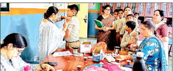
बच्चों को टीका लगाती मेडीकल स्टाफ की टीम।