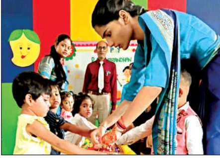
बच्चों ने मनाया रक्षाबंधन का त्यौहार