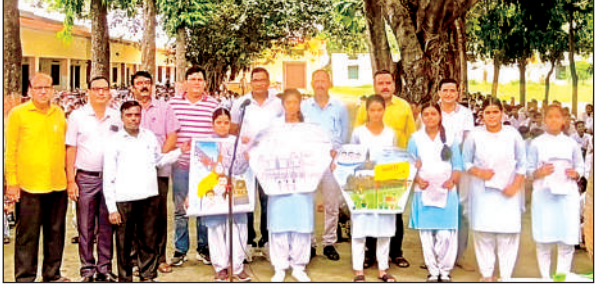
चित्रकला के फोटो दिखाते छात्र छात्राएं