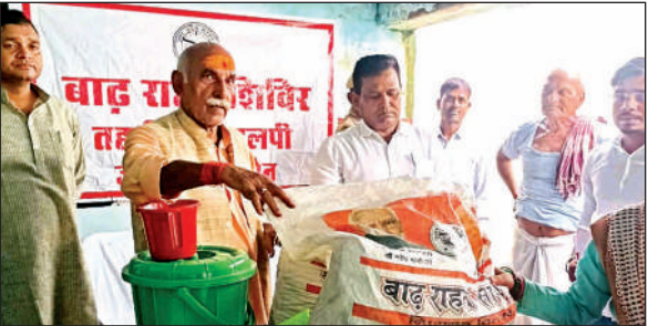
खाद्यान्न सामग्री का वितरण करते एसडीएम और नायब तहसीलदार।