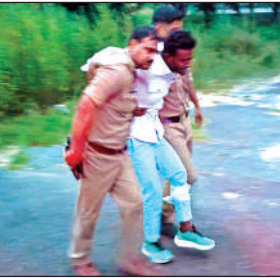
मुठभेड़ में घायल लुटेरे।