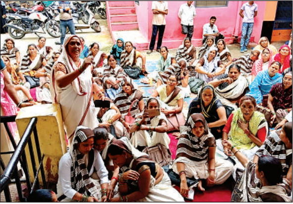
सीएमओ कार्यालय के बाहर धरना प्रदर्शन करती आशा कार्यकर्ता।

फाइलेरिया को लेकर विनोद दीक्षित अस्पताल में बुधवार को आशा की बैठक चल रही थी। इसी दौरान डब्ल्यूएचओ के सुपरवाइजर पहुंचे और तत्काल रिपोर्ट मांगने लगे। आशा ने बैठक के बाद रिपोर्ट देने की बात कही। आरोप है कि इसी बात पर सुपरवाइजर ने आशा के लिये अभद्र भाषा का प्रयोग कर दिया। इसी से