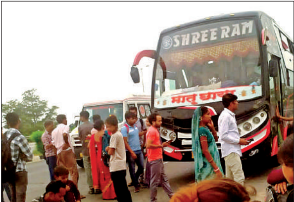
हादसे के बाद खड़ी बस और वहां पर मौजूद सवारियां।

बताया गया है कि दिल्ली से एक डबल डेकर बस सवारियां लेकर कानपुर जा रही थी। वहीं दूसरी बस जालौन जा रही थी। कानपुर जाने