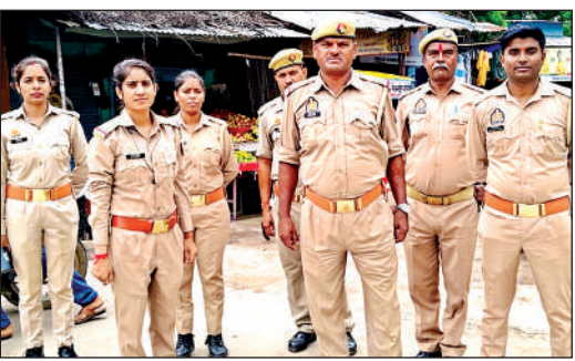
फुट मार्च करते पुलिस के जवान ।