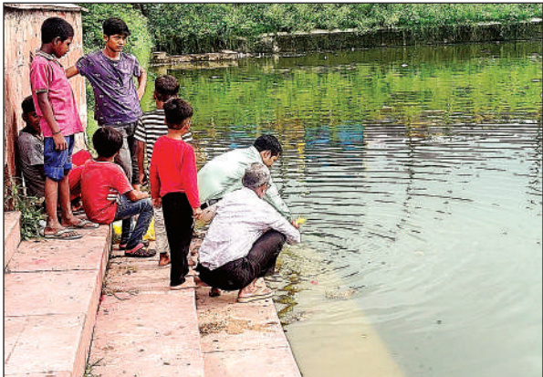
पक्का तालाब पर भुजरियों का विसर्जन करते लोग ।

धज कर भाइयों को राखी बांधी । जो बहनें अपने भाइयों के घर नहीं पहुंच सकी वह भाई बहनों के घर राखी बधवाने के लिए पहुंचे थे। वहीं बच्चों में त्योहार को लेकर सबसे ज्यादा क्रेज दिखाई दिया। राखी बंधवाकर छोटे-छोटे बच्चे खुशी से झूम उठे। इसके अलावा पुरोहितों ने भी अपने यजमानों के घर जाकर वैदिक मंत्रोच्चार के साथ रक्षा सूत्र बांधे। वहीं रक्षाबंधन के चलते दिनभर