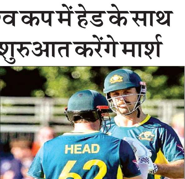
ऑस्ट्रेलिया की टी20 टीम के कप्तान मिचेल मार्श व ट्रेविस हेड।