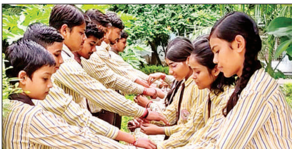
ज्ञान स्थलीय स्कूल में छात्रों को रक्षासूत्र बांधती बहनें ।