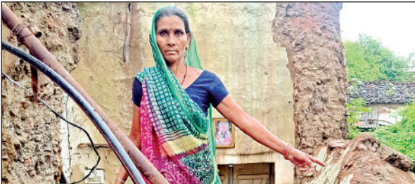
बारिश से गिरा मकान दिखाती महिला।

कुलपहाड़ संवाददाता के अनुसार नगर सहित ग्रामीण क्षेत्र में रक्षा बंधन पर्व श्रद्धा एवं उल्लास पूर्वक मनाया गया। भाई बहन के प्रेम का प्रतीक इस रक्षा बंधन पर्व को लेकर राखी तथा मिठाई की दुकानों में महिलाओं की भारी भीड़ जुटी। बहनें अपने भाई की कलाई में रक्षा सूत्र बांधने को लेकर उत्साहित दिखाई दीं। बता दें कि नगर व आसपास के ग्रामीण क्षेत्रों में भी भाई बहन के प्रेम का प्रतीक रक्षा बंधन पर्व मनाया गया। बहनों ने अपने भाइयों की कलाई में राखी बांधकर रक्षा का संकल्प लिया और मूह मीठा कराया। बाजारों में काफी संख्या में राखी और मिष्ठान की दुकानें सजी दिखाई दीं, जहां पर भारी भीड़ जुटी।