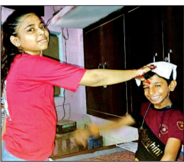
भाई को राखी बांधकर टीका लगाती बहन ।

कलाई में राखी बांधते हुए मंत्र का जाप करती हैं। भाई अपनी बहनों को रक्षा का वचन देते हैं। दुनिया भर में जहां पर भी भारतीय समुदाय के लोगरहते हैं। रक्षाबंधन का पर्व मनाया जाता है। शनिवार की सुबह से ही धर्म नगरी कालपी में रक्षाबंधन पर्व की धूमधाम रही। दूर दूर से आकर बहनों ने अपने भाइयों को राखी बांधकर टीका किया तथा मिठाइयां खिलाकर प्रार्थना की। भाइयों ने भी अपनी-अपनी बहनों को उपहार देकर के रक्षा का वचन देते हुए सामाजिक तथा पारिवारिक सद्भाव प्रस्तुत किया। नगर के मुख्य बाजार टरननगंज, रावगंज, रामगंज, बड़ा बाजार आदि के अलावा जोल्हूपुर मोड़, मंगरौली, बैरई आदि स्थानों में त्योहार को लेकर धूम-धाम दिखाई दी। त्योहार के चलते सड़क पर काफी रौनक रही।