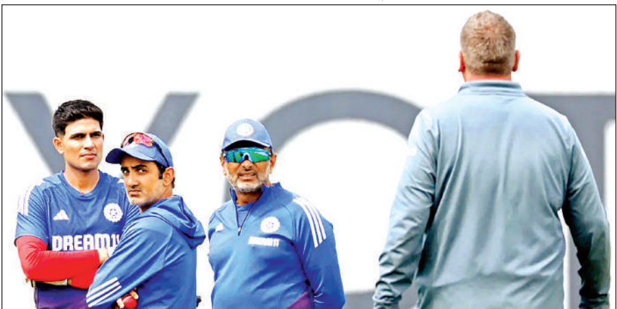
ओवल में भारतीय टीम के मुख्य कोच गौतम गंभीर और क्यूरेटर के बीच बहस का दृश्य।

अंडर-19 और अंडर-22 एशियाई मुक्केबाजी चैंपियनशिप,