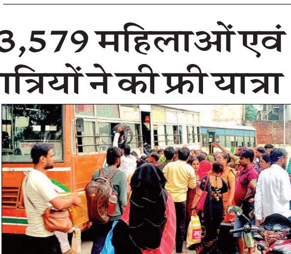
रोडेवज बस स्टैंड पर लगी महिलाओं की भारी भीड़ ।