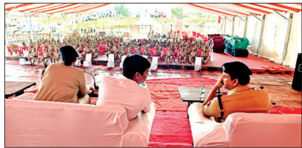
मेला इयूटी में आए पुलिस फोर्स को निर्देश देते एसपी।

एसपी ने बताया कि बांदा, हमीरपुर, चित्रकूट से एक-एक डिप्टी एसपी की तैनाती मेले में की गई है, चार डिप्टी एसपी मेले की निगरानी करेंगे। साथ ही जिले के 4 इंस्पेक्टर, 10 सब इंस्पेक्टर के अलावा बांदा से 30, चित्रकूट से 10, हमीरपुर से 20 सब इंस्पेक्टर कुल 70 सब इंस्पेक्टर लगाए गए हैं। 8 महिला उप निरीक्षकों की तैनाती की गई है साथ ही बड़ी संख्या में कांस्टेबल लगाए गए हैं। इसी प्रकार महिला पुलिस कर्मियों में जिले से 15, बांदा से 25, चित्रकूट से 10 हमीरपुर से 15 कुल 65 महिला कांस्टेबल के अलावा उप निरीक्षक यातायात 4, हेड कांस्टेबल टीपी 34, फायर टेंडर 3, एलआईयू के दो निरीक्षक, कांस्टेबल एलआईयू के 10 एवं एससे के चक 1 पुलिसकर्मी के आलावा दो कंपनी पीएससी एक प्लाटून फ्लोड पीएससी की तैनाती की गई है। मेला में अलग-अलग इयूनिटें मंडल के सभी जनपदों से आए कर्मियों को लगाया गया है। साथ ही दो सीओ इनर कार्डन एक सीओ आउटर कार्डन लगाए गए हैं।