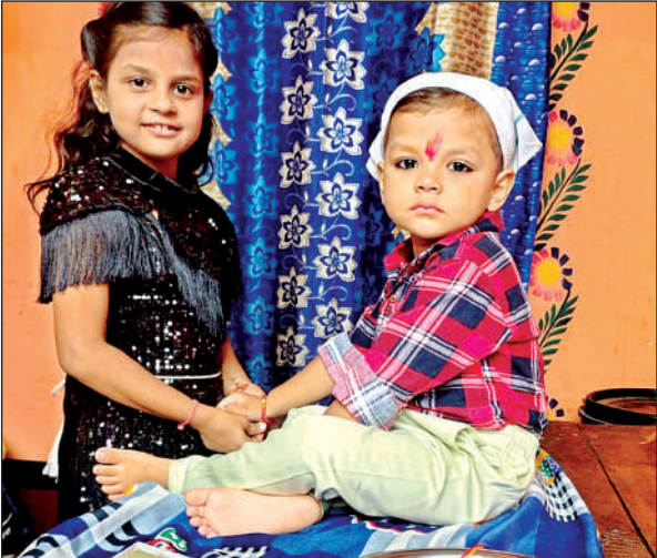
भाई की कलाई पर राखी बांधती बहन।

सुबह से भाई-बहनों में त्योहार को लेकर भारी उत्साह दिखाई दिया। छोटे बच्चे नए कपड़े पहनकर प्रसन्नचित नजर आए। बहनों ने भाइयों की कलाई पर राखी बांधी। भाइयों ने बहनों को उपहार दिए और आजीवन रक्षा का संकल्प लिया। राजापुर संवाददाता के अनुसार, राजापुर व ग्रामीण क्षेत्रों में हर्षोल्लास और पारंपरिक रीति-रिवाजों के साथ मनाया गया। छोटे-छोटे हाथों से सजी हुई राखी बांधते और मिठाई खिलाते बच्चों ने