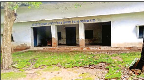
उपेक्षित पड़ा गांधी आश्रम।