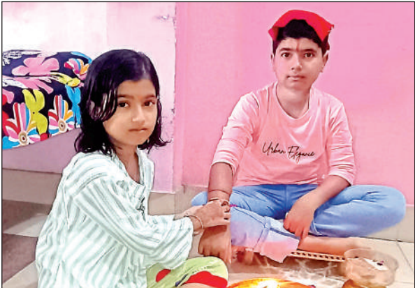
भाई को राखी बांधती बहन ।

श्रावण पूर्णिमा शुक्रवार की दोपहर दो बजे से शुरू हो गई थी जो शनिवार रात 1: 21 बजे तक रही। वहीश्रवण व घनिष्ठा नक्षत्र के साथ सर्वाथ सिद्धि रवि शोभन व सौभाग्य योग भी था इसी खास मुहूर्त में बहनों ने भाइयों की कलाई पर रक्षा सूत्र बांधे । रक्षाबंधन के त्योहार की तैयारियां पिछले कई दिनों से चल रही थीं क्योंकि इस त्योहार का भाई व बहनों दोनों को काफी बेसब्री से इंतजार रहता है। बहनों ने जहां आकर्षक मेहंदी सजाई थी वहीं सज