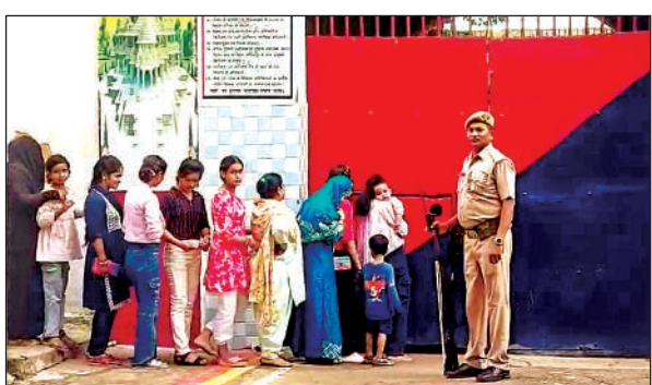
जिला कारागार गेट पर खड़ी बहनें

जेलों में बंद भाइयों के हाथों में राखी बांधने के लिए बहनें पहुंचीं: फर्रुखाबाद। जिला जेल और सेंट्रल जेल में बहनों ने अपने अपने बंदी भाइयों के हाथों में राखी बांधकर उनका आशीर्वाद लिया। शनिवार को सुबह से बड़ी तादाद