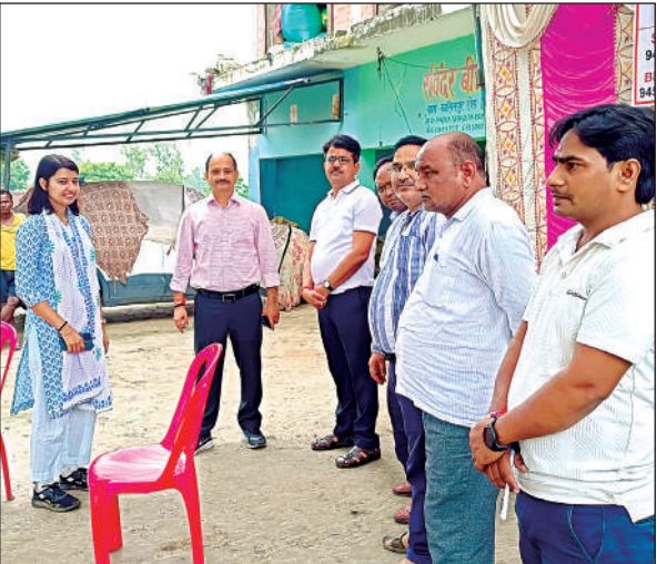
बाढ़ राहत शिविर का जायजा लेते अधिकारी।

बजे बैराज से तीन लाख पांच हजार 41 क्यूसेक पानी और गंगा में छोड़ दिया गया है। इसके यहां पहुंचने पर रविवार जलस्तर के और बढ़ने की उम्मीद है। बाढ़ की तरफ बढ़ रही गंगा ने तट पर बसे गांव के लोगों की धड़कनें बढ़ा दी हैं। कासिमपुर में तो सड़क के ऊपर से पानी चलने लगा