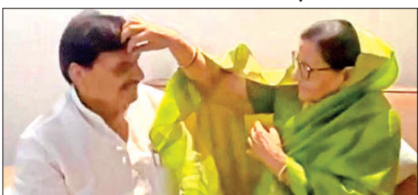
अपनी बहन से राखी बंधवाते शिवपाल सिंह यादव ।