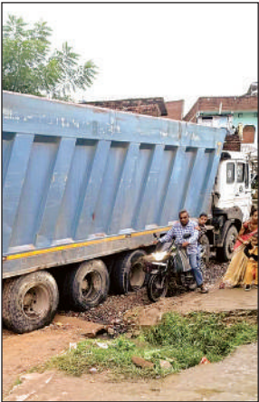
बीते दिनों पुलिया में धंस गया था ट्रक।