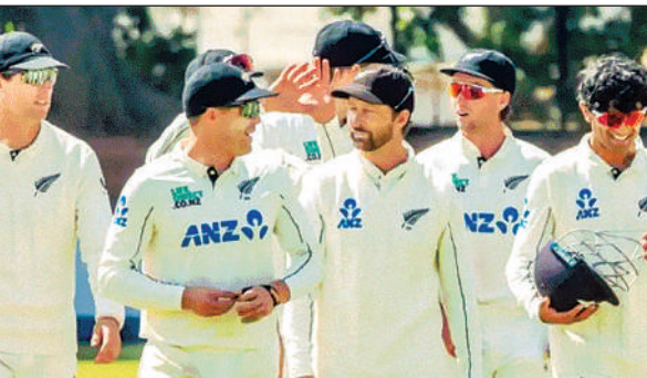
जीत दर्ज करने के बाद जश्न मनाती न्यूजीलैंड की टीम।