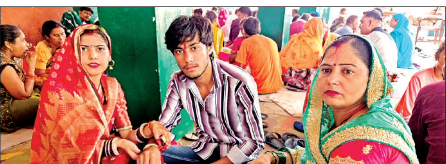
जेल में अपने भाइयों को राखी बांधती बहनें ।