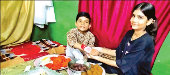
भाई को राखी बांधती बहन।

शनिवार को रक्षाबंधन त्योहार को लेकर सारा दिन चहल-पहल दिखाई दी। घर-घर में बहनों ने अपने भाइयों की कलाईयों पर राखी बांधकर उनका मुंह मीठा कराते हुए रक्षा का वचन लिया। भाइयों ने भी