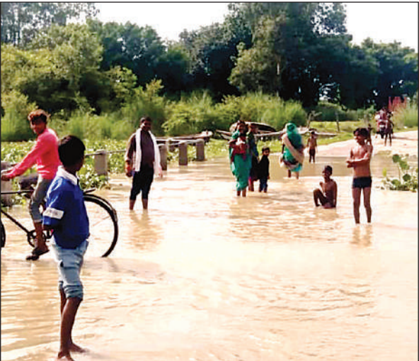
कासिमपुर में सड़क के ऊपर बह रहे पानी से गुजरते लोग।

पहाड़ों व मैदानी क्षेत्रों में लगातार भीषण बारिश होने से गंगा का जल स्तर बढ़ने लगा है। शुक्रवार को चौधरी चरण सिंह गंगा बैराज नरौरा से से दो लाख छः हजार क्यूसेक पानी छोड़ा गया था। तब गंगा का जल स्तर 124.740 मीटर पर था।