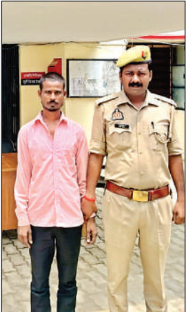
पुलिस की गिरफ्त में आरोपी।