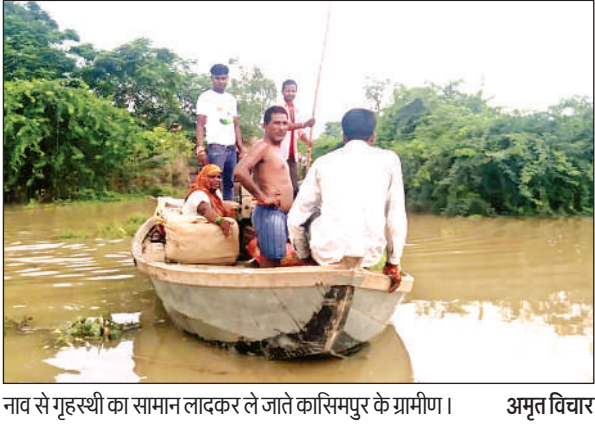
नाव से गृहस्थी का सामान लादकर ले जाते कासिमपुर के ग्रामीण।