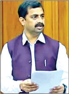
सदन में बोलते एमएलसी।

इस सीजन में बुंदेलखंड क्षेत्र में अत्याधिक वर्षा एवं अतिवृष्टि से विशेष कर चित्रकूट धाम मंडल में उर्द, मूंग, तिल आदि की बोई हुई फसल का पूर्ण रूप से नष्ट होने के कारण किसानों को आर्थिक नुकसान का सामना करना पड़ रहा है। कृषकों को तत्काल बीमा का