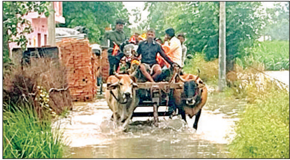
बाढ़ के चलते बैल-गाड़ी से जाते लोग।