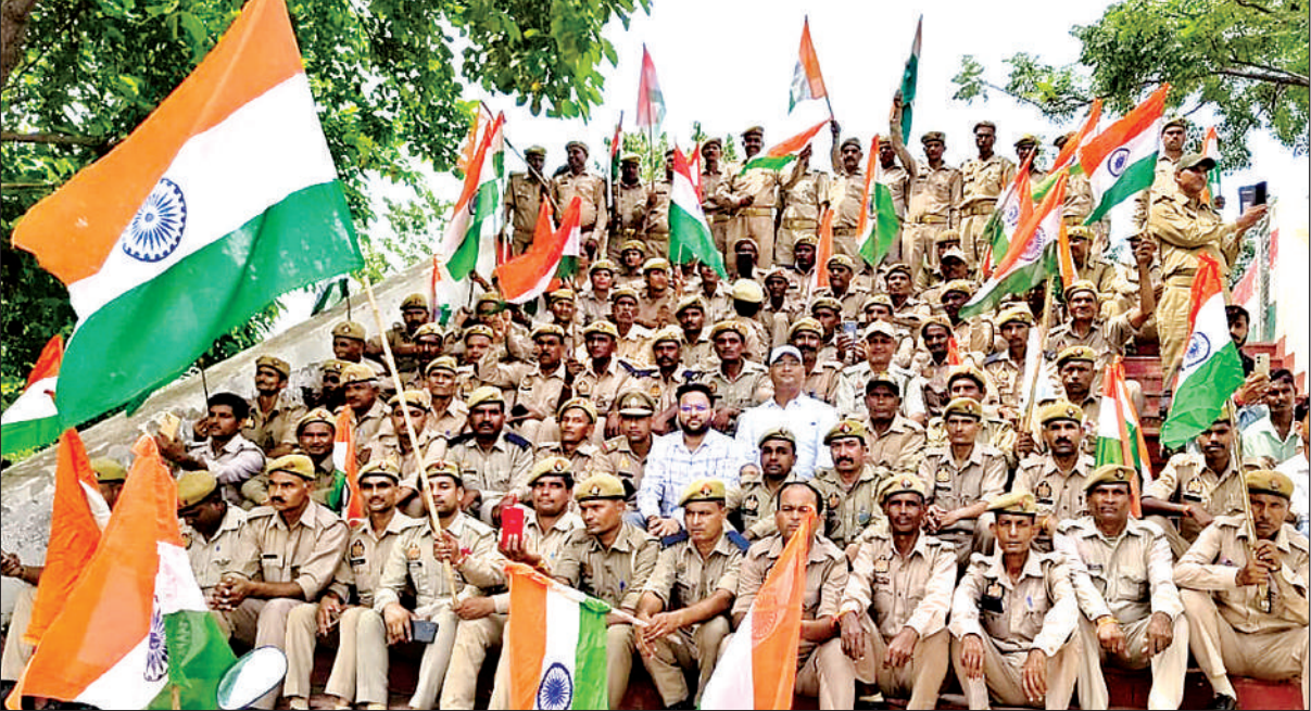
तिरंगा यात्रा में शामिल जवान।