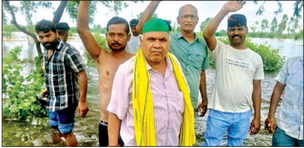
बाढ़ क्षेत्र का दौरा करते किसान नेता।