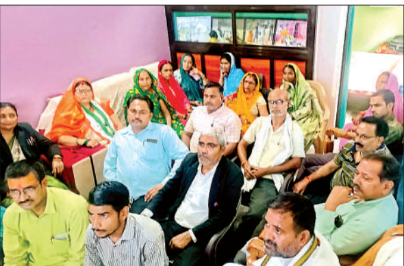
राहुल गांधी के प्रेजेंटेशन को देखते कांग्रेसी।