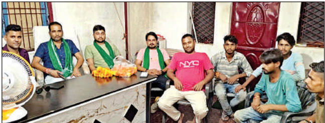
स्थापना दिवस की रूपरेखा बनाते भाकियू अवधेश संगठन के लोग।