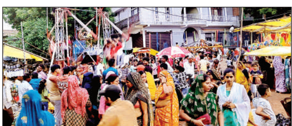
मेले की दुकानों में खरीदारी करती ग्रामीण महिलाएं।

तमाम दुकानदारों ने बारिश के मौसम को देखते हुए पानी से बचने के लिए वाटरप्रूफ दुकाने बनाई। इतना ही नहीं मेले में दुकानदारों की अच्छी खासी बिक्री होने के कारण दूर दराज से बड़े बड़े दुकानदार और झूला संचालक दो दिन तक डेरा जमाए रहते थे, लेकिन अब शहीद स्थल में अस्थायी दुकानें बनाकर कब्जे कर