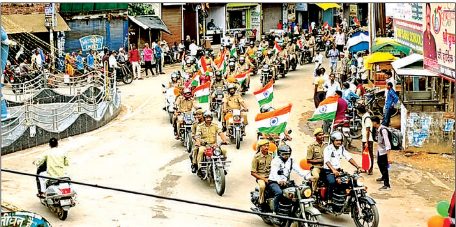
बाइक तिरंगा यात्रा निकालते पुलिस के जवान।

हर घर तिरंगा अभियान के तहत यात्रा का आयोजन किया गया। यात्रा रामलीला डाकबंगला मैदान से शुरू होकर शहर के पुराने बस स्टैंड, तहसील चौराहा सहित प्रमुख चौराहों से होते हुए सुभाष चौक में खत्म हुई। तिरंगा यात्रा के दौरान पुलिस अधिकारियों ने लोगों से घर, दुकान, व्यापारिक संस्थानों में झंडा लगाने की अपील की। तिरंगा यात्रा में पुलिस के अधिकारी व कर्मचारियों सहित 250 से अधिक लोगों ने