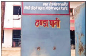
बिना टोटी का वाटर कूलर।

अमृत विचार। ब्लाक प्रमुख कोटे से मानीमऊ क्षेत्र में पाँच वॉटर कूलर लगाये गए जिसमे चार दस दिन बाद बंद हो गए। कुछ की चोर टोटियां चुरा ले गए तो किसी की मोटर फुक गई। चार माह से चल रही समस्या कोई देखने नहीं आया। इसी साल अप्रैल में मानीमऊ क्षेत्र में ब्लाक प्रमुख कोटे से पाँच स्थानों पर मानीमऊ मुख्य बाजार, हनुमान मन्दिर, मानीमऊ ठठिया रेलवे क्रॉसिंग, उदैतापुर में कन्या पाठ शाला और उदैतापुर के बीच गांव में वॉटर कूलर लगाया गया। इसमे चार वॉटर कूलरों में किसी की मोटर फुकी तो किसी की टोटियां गायब हो गईं। किसी की बोरिंग फेल हो गई। चार वॉटर कूलर ने के दस दिनों