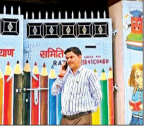
विद्यालय का निरीक्षण करते खंड शिक्षा अधिकारी।

खंड शिक्षा अधिकारी ने बताया कि जांच के दौरान स्कूल बंद पाया गया। मखदूमिया इस्लामिया जूनियर हाईस्कूल ट्रैक्टर एजेंसी के पीछे की मान्यता थी, परंतु जांच के दौरान दूसरे स्थान पर संचालित पाया गया। जो कि नियमों के विरुद्ध है। जांच के दौरान साईं वैली प्ले स्कूल पठनऊ की मान्यता अन्य नाम से मिली। बताया कि उत्सव पैलैस के सामने स्थित इन्फिनिट क्रिएशन स्कूल की मान्यता चंद्रशेखर विद्यापीठ के नाम से मिली। गल्ला मंडी के पास स्थित