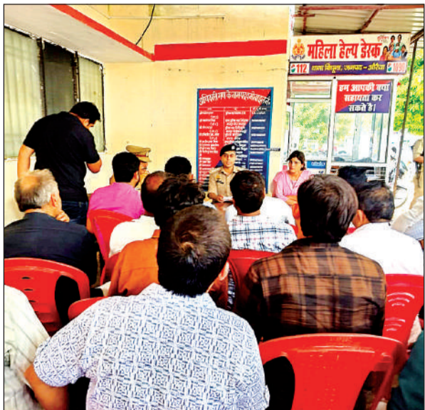
बैठक के दौरान निर्देश देते अधिकारी।

● शांति एवं सोहार्दपूर्ण वातावरण में त्योहार मनाने को कहा