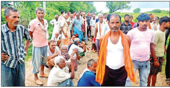
कैथी गांव में शनिवार को अंतिम संस्कार में शामिल ग्रामीण।