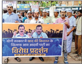
विरोध प्रदर्शन करते आप कार्यकर्ता।