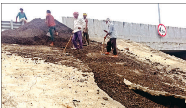
मरम्मत कार्य करते कर्मचारी।

अमृत विचार। गुरुवार को हुई मूसलाधार बारिश ने बुंदेलखंड एक्सप्रेस-वे पर बड़ी समस्या खड़ी कर दी। बिचौलिया गांव के पास किलोमीटर संख्या 269 से 270 के बीच एक्सप्रेस-वे की साइड में बनी नालियों के किनारे मिट्टी धंसने से 6-7 फीट गहरे गड्ढे बन गए हैं। बारिश का पानी निकासी के लिए बनाई गई नालियों के आसपास की मिट्टी पूरी तरह बैठ जाने से कई स्थानों पर नालियां टूट गईं। पानी सीधे किनारों की मिट्टी में समा रहा है, जिससे कटान और तेज हो गया है। स्थिति की जानकारी मिलते ही डीबीएल कंपनी ने तुरंत मरम्मत कार्य शुरू कर दिया। मौके पर पहुंचे