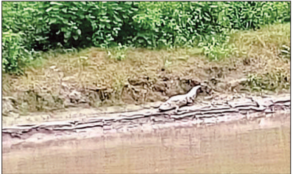
नहर के किनारे लेटा मगरमच्छ।