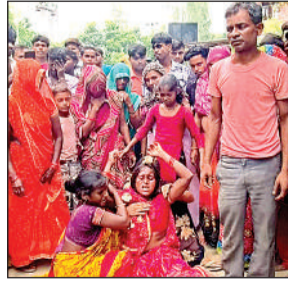
मृतक बालक के बिलखते परिजन।