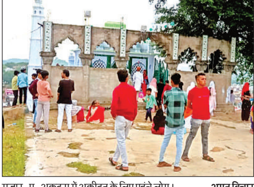
मजार-ए-अकदस में अकीदत के लिए पहुंचे लोग।

शुक्रवार की रात नमाज-ए-इशा के बाद अकीदतदों द्वारा चादर जुलूस निकाला गया, जो प्रमुख मार्गों से होता हुआ रात में करीब साढ़े दस बजे बस्ती के बीच पहाड़ पर स्थित मजार पर पहुंचा और अकीदत के साथ चादर चढ़ाई गई और फातिहा के बाद दुआएं मांगी गईं। फातिहा के मौके पर मुस्लिम