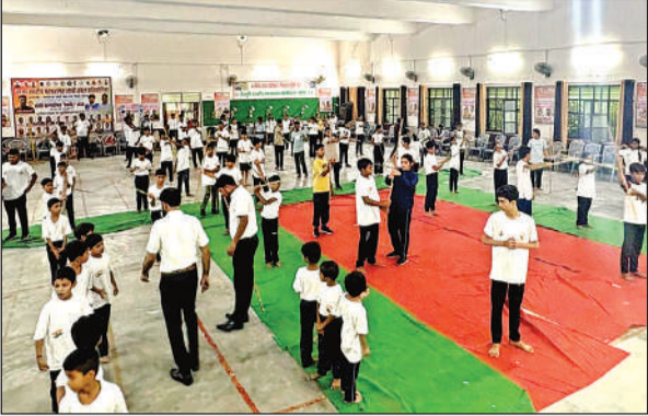
प्रतियोगिता के दौरान लाठी का प्रदर्शन करते प्रतिभागी।

कार्यक्रम के मुख्य अतिथि एमएलसी ने कहा कि राज्य स्तरीय आयोजन खेलों के प्रचार और बच्चों में प्रतिस्पर्धात्मक भावना को बढ़ावा देते हैं। प्रतिभागियों ने पारम्परिक