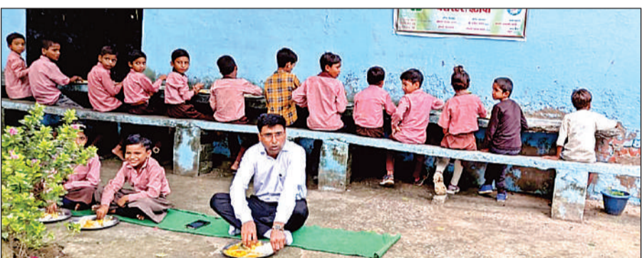
इटगांव में बच्चों के साथ भोजन करते बीएसए।