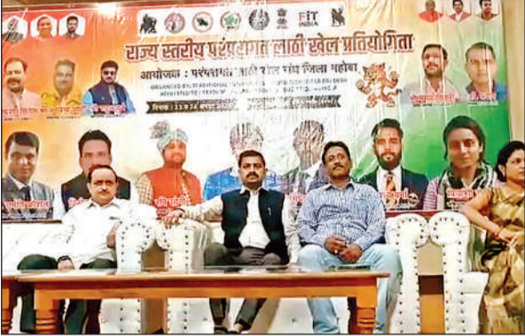
प्रतियोगिता के दौरान मंच पर बैठे मुख्य अतिथि व अन्य।

दो दिवसीय लाठी प्रतियोगिता का शुभारंभ शनिवार को हुआ। प्रतियोगिता में शामिल प्रतिभागियों