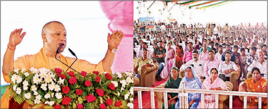
गोरखपुर में कल्याण मंडपम के उद्घाटन कार्यक्रम के दौरान जनसमूह को संबोधित करते मुख्यमंत्री योगी आदित्यनाथ।

सीएम योगी शनिवार को गोरखपुर में दो कल्याण मंडपम