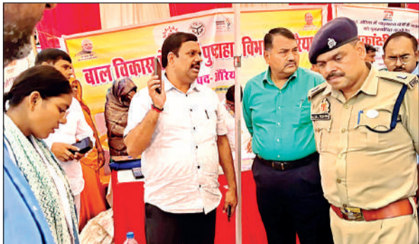
ग्रामीणों की समस्याओं को सुनते डीएम।