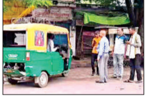
चालकों को चेतावनी देते एआरएम।

मुख्यालय के रोडवेज बस स्टैंड के समीप सुबह से ही डग्गामार वाहनों का हुजूम लग जाता है। जो सवारियों को कम किराए का लालच देकर उन्हें अपने वाहनों में बैठाकर जल्द से जल्द उनके गंतव्य तक पहुंचाने का आश्वासन देते हैं। इसके साथ ही इन वाहनों में जल्दी