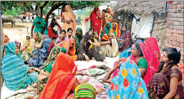
घर के बाहर रोते बिलखते परिजन।