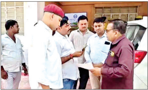
अतिरिक्त एसडीएम को ज्ञापन सौंपते शराब ठेका संचालक।