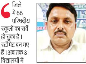
जिले में 66 परिषदीय स्कूलों का सर्वे हो चुका है। स्टीमेंट बन गए हैं। अब तक 3 विद्यालयों में काम हुआ है। 123 स्कूल कन्नौज यानि उनके क्षेत्र के हैं और अन्य हिवरामऊ डिवीजन में आते हैं। सितंबर में कार्य करा दिया जाएगा। पुराने तार व पोल से ही काम चलाना है। अगर टूट-फूट होती है तब ही नया उपकरण या पोल लगा सकते हैं।