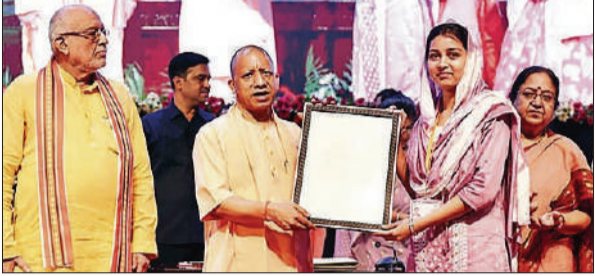
चयनित अभ्यर्थी को नियुक्ति पत्र सौंपते मुख्यमंत्री योगी आदित्यनाथ ।

सरकारों के कार्यकाल में खाद्यान्न उत्पादन, इंफ्रास्ट्रक्चर और निवेश में प्रदेश पिछड़ता गया। नौजवान यूपी से बाहर जाते तो पहचान का संकट झेलते थे। योगी ने कहा कि युवा प्रतिभाशाली और ऊर्जावान होता है,