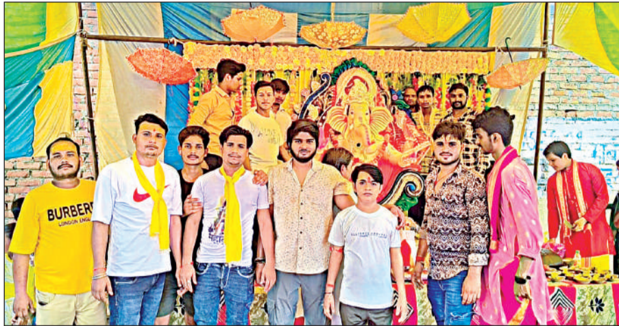
पूजा-अर्चना करते भक्त।