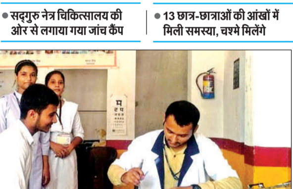
शिविर में छात्रों का नेत्र परीक्षण करते चिकित्सक ।

● सद्गुरु नेत्र चिकित्सालय की ओर से लगाया गया जांच कैंप