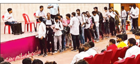
रोजगार महाकुंभ के दौरान कतार में लगे युवा।

में विभिन्न नौकरियों के लिए और 532 का चयन संयुक्त अरब अमीरात (यूएई) स्थित 22 कंपनियों में नौकरियों के लिए किया गया है। मंगलवार को 1,818 और बुधवार को 7,479 यानी कुल 9,297 युवकों की भर्ती हुई। उम्मीद है कि तीसरे और अंतिम दिन तक कुल भर्ती 15 हजार को पार कर जाएगी।