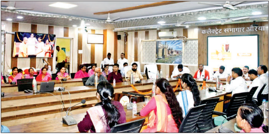
लखनऊ में हुए आयोजन का सजीव प्रसारण दिखाया गया।