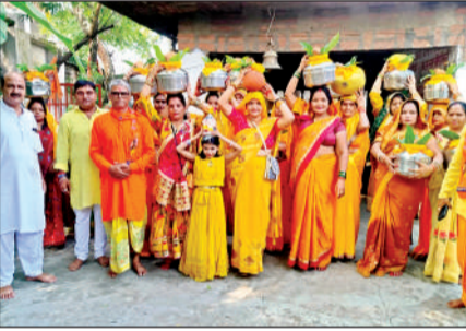
कलश यात्रा में मौजूद महिलाएं व पुरुष।