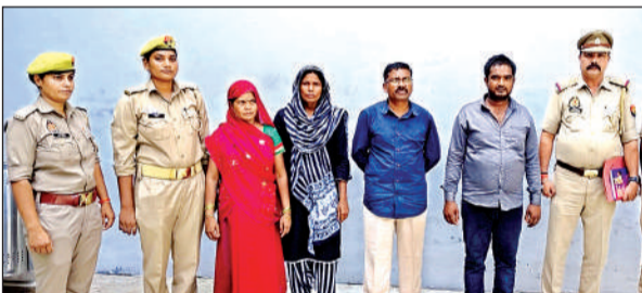
पुलिस गिरफ्त में धर्मांतरण कराने का प्रयास करने के आरोपी।