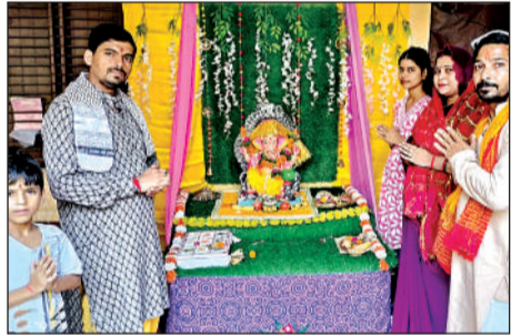
गणेश प्रतिमा की स्थापना के दौरान आराधना करते भक्त।