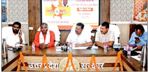
बैठक के दौरान निर्देश देते डीएम डॉक्टर इन्द्रमणि त्रिपाठी।

अमृत विचार। जिलाधिकारी डॉ. इन्द्रमणि त्रिपाठी ने कलेक्ट्रेट स्थित मानस सभागार में आयोजित मुख्यमंत्री डैशबोर्ड जिला अनुश्रवण पुस्तिका संबंधी परियोजनाओं की समीक्षा करते हुए संबंधितों को निर्देशित किया कि शासन द्वारा प्राप्त योजनाओं का लक्ष्य पूर्ण कराना सुनिश्चित करें जिससे कार्यों में प्रगति के साथ साथ जनपद की रैंकिंग में भी सुधार प्रदर्शित हो। उन्होंने मुख्य विकास अधिकारी व जिला अर्थ संख्या अधिकारी को निर्देश दिए कि वह कार्यों की प्रतिदिन अपने स्तर से समीक्षा करें और खराब प्रगति पाए जाने पर संबंधित अधिकारी के विरुद्ध