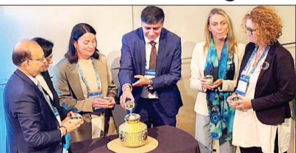
नदियों के संरक्षण को लेकर आयोजित कार्यक्रम में मौजूद विशेषज्ञ।

स्टॉकहोम इंटरनेशनल वॉटर इंस्टीट्यूट द्वारा वर्ष 1991 से आयोजित यह प्रतिष्ठित आयोजन अब वैश्विक नीति निर्धारकों, वैज्ञानिकों, उद्योग विशेषज्ञों और सामाजिक कार्यकर्ताओं के लिए सबसे प्रभावशाली मंच बन चुका है। गंगा के विस्तृत प्रवाह वाले प्रदेश के रूप में उत्तर प्रदेश नमामि