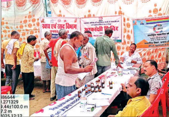
बाढ़ ग्रस्त क्षेत्रों में लगाया गया शिविर।

जिसके तहत विकास खण्ड के अन्तर्गत ग्राम पंचायत असेवा में आकांक्षी शिविर का आयोजन किया गया। आकांक्षी शिविर में पंचायती राज, ग्राम्य विकास, बाल विकास परियोजना, चिकित्सा, पशुपालन, कृषि, रोजगार, सोशल सेक्टर, महिला एवं बाल विकास, राजस्व, खाद्य एवं रसद विभाग, शिक्षा, जल निगम आदि विभागों द्वारा अपनी-अपनी योजनाओं के सम्बन्ध में जनमानस को शासकीय योजनाओं का लाभ देने हेतु स्टॉल लगाए गए। जिसमें पशु पालन विभाग के 14