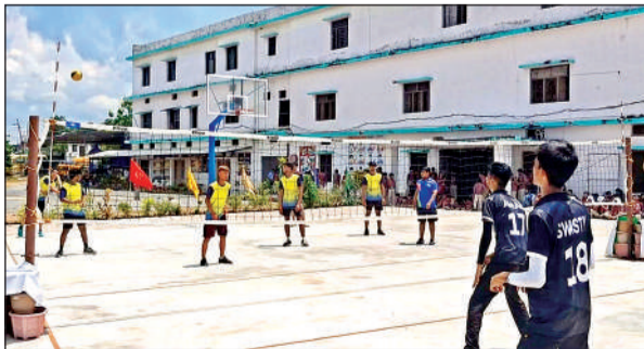
स्टेट थ्रो बाल प्रतियोगिता में प्रदर्शन करते खिलाड़ी।

आरबीपीएस में हुई 35वीं जूनियर स्टेट थ्रोबाल चैम्पियनशिप के बालक वर्ग में प्रयागराज, चित्रकूट, महोबा और बांदा की टीमें सेमी फाइनल में पहुंचीं। पहले सेमीफाइनल में प्रयागराज ने महोबा और दूसरे सेमीफाइनल में चित्रकूट ने बांदा को पराजित कर फाइनल में प्रवेश किया। फाइनल मुकाबले में प्रयागराज की बालिका वर्ग की टीम ने महोबा को हराया और बालक वर्ग में प्रयागराज ने चित्रकूट को हराकर