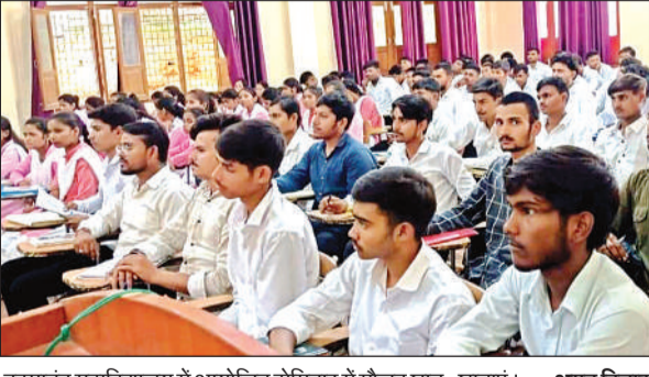
ब्रह्मानंद महाविद्यालय में आयोजित सेमिनार में मौजूद छात्र-छात्राएं ।