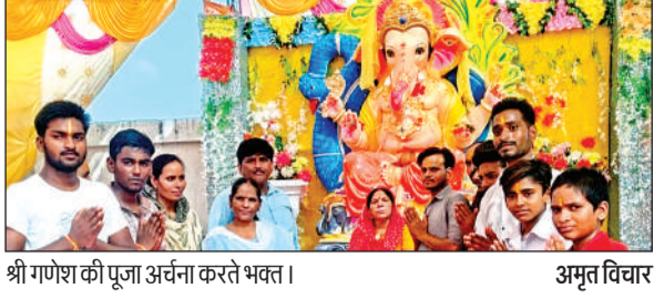
श्री गणेश की पूजा अर्चना करते भक्त।