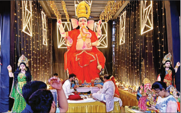
मोहल्ला कटरा बहादुर में गणेश जी की प्रतिमा स्थापित होने के बाद पूजा करते यजमान।