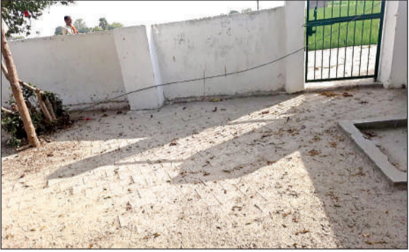
प्राथमिक स्कूल में जमीन पर पड़ा बिजली का तार।

जिला बेसिक शिक्षा विभाग की ओर से बिजली विभाग को उन 66 प्राथमिक, जूनियर व कंपोजिट विद्यालयों की सूची भेजी गई जहां हाईटेंशन लाइन से विद्यार्थियों व शिक्षकों की जान को खतरा बना हुआ है। ऐसे स्कूलों से बिजली लाइन हटाने को कहा गया। बताया गया कि सूची मिलने के बाद स्टीमेंट बनाकर बजट की मांग की गई।