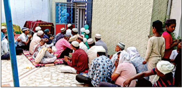
कुल की फातिहा में मौजूद लोग।

शहर के मोहल्ला शेखनपुरा स्थित हजरत मखदूम शाह की दरगाह का सालाना उर्स के मौके पर मंगलवार की रात साढ़े नौ बजे मोहल्ला कतीपुरा वाशिंदों ने चादर जूलूस निकाला, जो ऊदल चौक, सुभाष चौक होते हुए मजार-ए-अकदस पर पहुंचा। जूलूस दौरान लोग सिर पर बड़ी बड़ी थाली में चादर रखकर चल रहे थे, तो वहीं अकीदमंदों में खामोशी अख्तियार