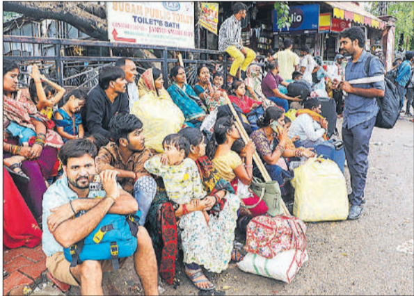
जम्मू तवी रेलवे स्टेशन पर घर लौटने के लिए ट्रेनों का इंतजार करते यात्री ।

मंगलवार को अपराह्न करीब तीन बजे भूस्खलन हुआ और पहाड़ की ढलान से पत्थर, शिलाखंड और चट्टानें नीचे गिरने लगीं। इससे बेखबर लोग इसकी चपेट में आ गए। जम्मू कश्मीर