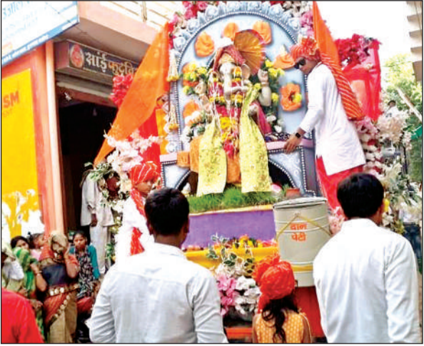
भगवान गणेश को विराजमान करने ले जाते भक्त।

विघ्नहर्ता, मंगलमूर्ति भगवान श्री गणेश जी का आगमन बुधवार को डीजे और गाजेबाजे के साथ भक्तों द्वारा किया गया और शाम व देर रात तक पंडालों में बप्पा विराजे। स्वागत में भक्तों ने जमकर आतिशबाजी के साथ रंग गुलाल उड़या। गणेशजी के आगमन पर भक्तों के चेहरे पर