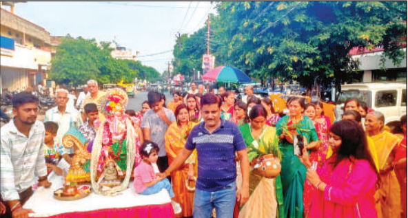
गजानन की मूर्ति लेकर जाते भक्त गण।