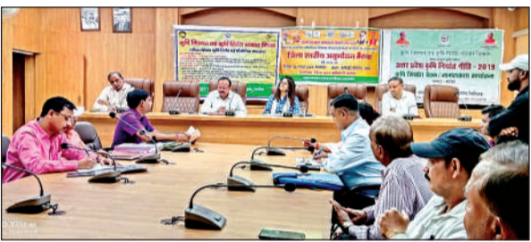
कलेक्ट्रेट सभागार में गुरुवार को बैठक में मौजूद अधिकारी।