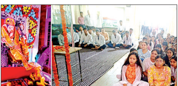
स्थापित की गयी भगवान गणेश की मूर्ति व ध्यान मनन मेडिकल छात्र।