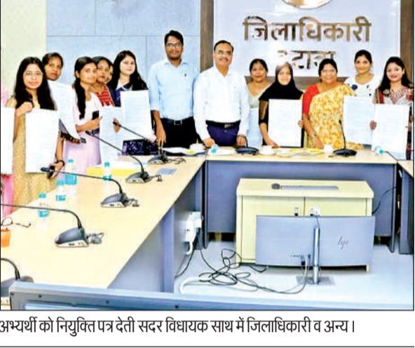
अभ्यर्थी को नियुक्ति पत्र देती सदर विधायक साथ में जिलाधिकारी व अन्य।