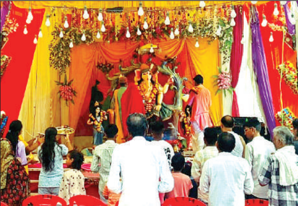
महोत्सव पंडाल में भगवान श्रीगणेश की आरती करते श्रद्धालु।

गजानन को लड्डू व मोदक का भोग लगाया गया। आरती के बाद लोगों ने श्रद्धापूर्वक प्रार्थना की, इसके बाद गणेश भक्तों को प्रसाद वितरण किया गया। बुधवार को दोपहर से देर शाम तक भक्त ट्रैक्टरों व अन्य वाहनों में एकदंत की प्रतिमा को रखकर गाजेबाजे और जयकारों के साथ शहर में करीब एक दर्जन से ज्यादा स्थानों पर सजाए गए पंडालों में विराजमान किया गया। शहर के मोहल्ला पठानपुरा, माथुरनपुरा,