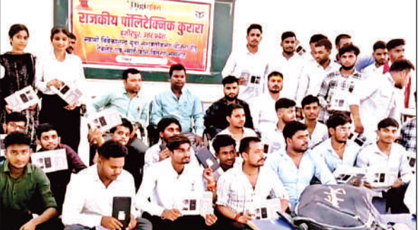
टैबलेट के साथ खुशी का इजहार करते पॉलिटेक्निक के छात्र।