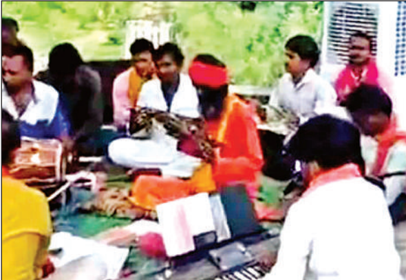
ढोलक-हारमोनियम के साथ सुदकांड पाठ का आयोजन किया गया।

आवाज सुनाई देने लगी। सुबह छह बजे से पंडालों में लगे लाउडस्पीकरों से समितियों के लोगों द्वारा लोगों को गणेश की पहली आरती का बुलावा दिया गया। भगवान लंबोदर का प्रिय मोदक के साथ साथ लड्डू, केले, मोखाने की खीर व अन्य सामग्री का भोग गणपति को लगाया गया। आरती में पुरुषों के अलावा महिलाएं व बच्चे शामिल हुए। आरती के समय भक्त हाथों में एक थाली में कपूर जलाएं और उसे मूर्ति के सामने गोलाकार घुमाकर आरती