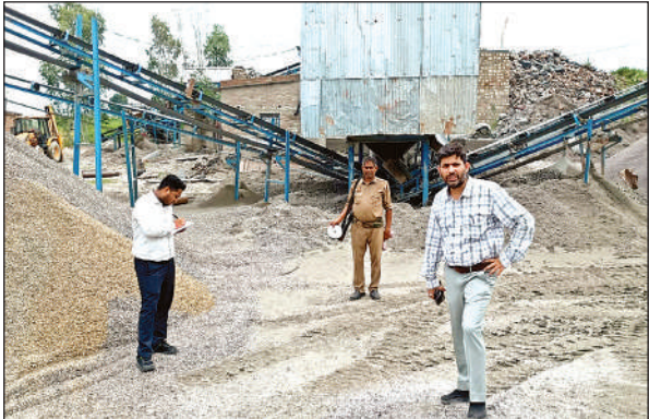
स्टोन क्रशरों का मुआयना करते अधिकारी।