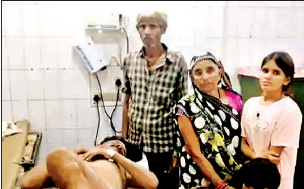
जिला अस्पताल में भर्ती घायल मजदूर।

प्राचार्य ने कहा कि नशा नश की जड़ है। नशा मनुष्य को पशु तुल्य बनाता है, जैसे कबीरदास ने कहा कि अवगुन कहुं शराब का आपा अहमक साथ मानुष से पशुआ करे