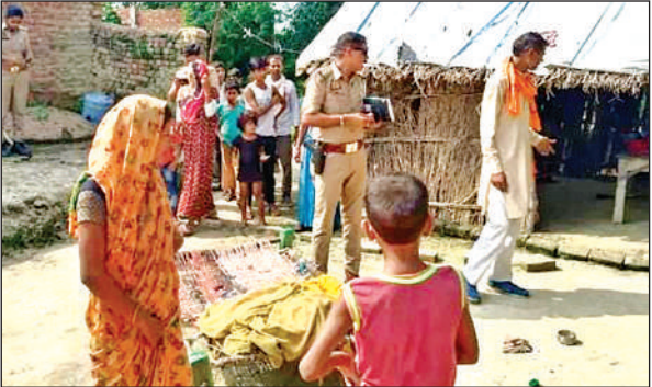
जांच पड़ताल करती पुलिस।