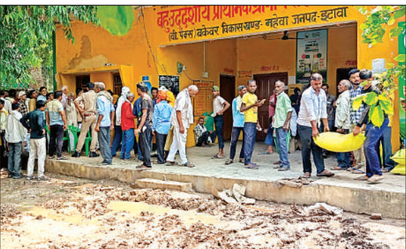
सहकारी समिति पर खाद के लिए लाइन में लगे किसान।

अमृत विचार। बकेवर सहकारी समिति पर भेजी गई 12 सौ बोरी यूरिया खाद आने के बाद गुरुवार को खाद वितरित की गई। पुलिस की सुरक्षा में खाद का वितरण किया गया। पहले दिन 465 बोरी यूरिया खाद किसानों को बांटी गई। किसान यूरिया खाद लेने सुबह से ही समिति पर किसानों की भारी भीड़ लगी रही।धान की फसल के लिए किसानों को यूरिया खाद की आवश्यकता है किसान धान की फसल में यूरिया डालने के लिए, सहकारी समितियां पर चक्कर लगा रहे थे।बुधवार को देर शाम तक सरकारी समिति बकेवर पर रविवार को जिला मुख्यालय से 12 बोरी यूरिया खाद की भेजी गई थी। यूरिया खाद आने की जानकारी होते ही काफी संख्या में क्षेत्र के