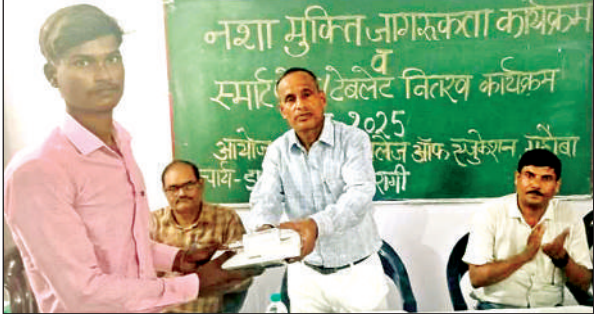
कार्यक्रम में छात्र को स्मार्टफोन देते प्राचार्य।