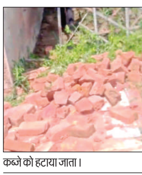
कब्जे को हटाया जाता।