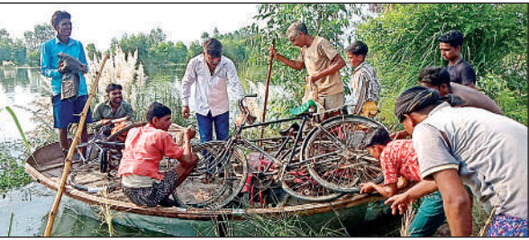
नाव से सफर करते अमृतपुर क्षेत्र के ग्रामीण।