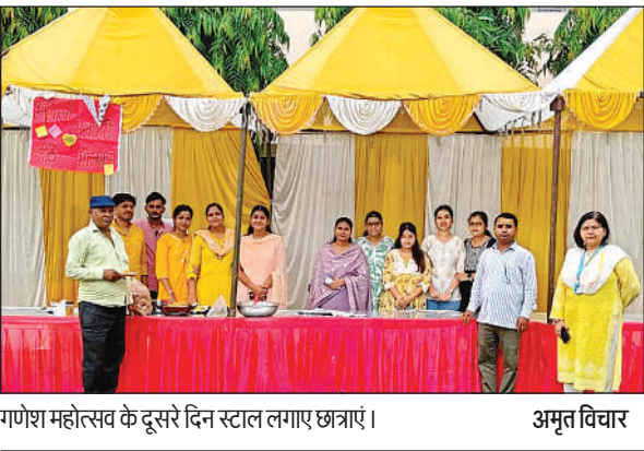
गणेश महोत्सव के दूसरे दिन स्टाल लगाए छात्राएं।