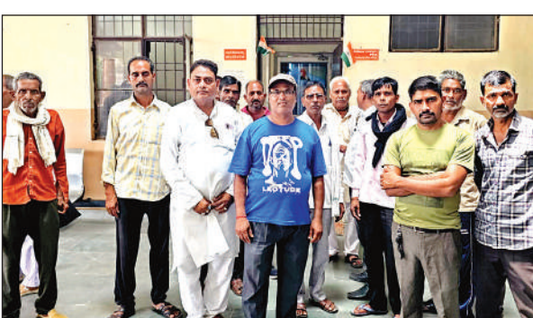
अजीतमल में ज्ञापन देने जाते लोग।

अमृत विचार। ग्राम पंचायत विलावा एवं परगना अजीतमल के ग्रामीणों ने विकासखंड परिवर्तन की मांग को लेकर उपजिलाधिकारी अजीतमल को ज्ञापन सौंपा। ग्रामीणों ने मांग की है कि ग्राम पंचायत विलावा को अजीतमल विकासखंड में ही शामिल रखा जाए। ग्रामीणों ने बताया कि शासन द्वारा विकास खंड के पुनर्गठन के तहत एक नया विकासखंड अयाना प्रस्तावित किया जा रहा है। इसमें 42 ग्राम जोड़े जा रहे हैं, जिनमें विलावा भी शामिल है। ज्ञापन में कहा गया है कि ग्राम पंचायत विलावा अजीतमल से महज 3 किमी की दूरी पर स्थित है और यहां के सभी सरकारी काम अजीतमल में ही संपन्न होते हैं। जबकि