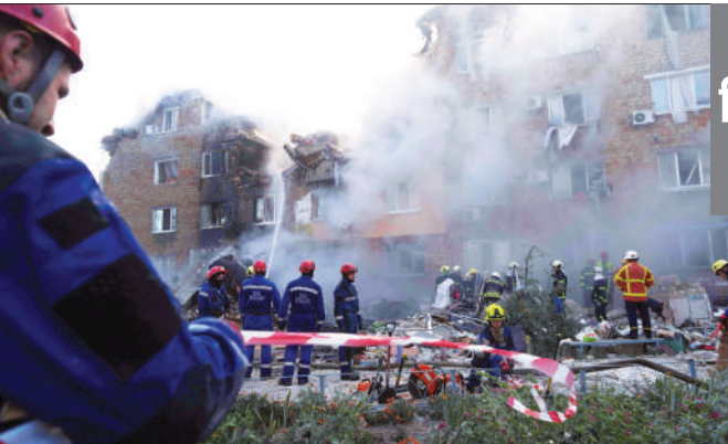
गुरुवार को यूक्रेन के कीव में रूसी हमले में नष्ट हुए एक घर पर काम कर रहा बचाव दल।

जब उनसे पूछा गया कि क्या उनका मतलब 'पुतिन का युद्ध' है तो नवारो ने दोहराया, मेरा मतलब मोदी का युद्ध है क्योंकि शांति का रास्ता आंशिक रूप से नई दिल्ली से होकर जाता है। ट्रंप ने रूसी तेल की खरीद के लिए भारत पर 25 प्रतिशत का अतिरिक्त शुल्क लगाया है, जो बुधवार से प्रभावी हो गया है। इसके साथ ही अमेरिका द्वारा भारत पर लगाया गया कुल शुल्क 50 प्रतिशत हो गया है। नवारो ने दावा किया कि भारत