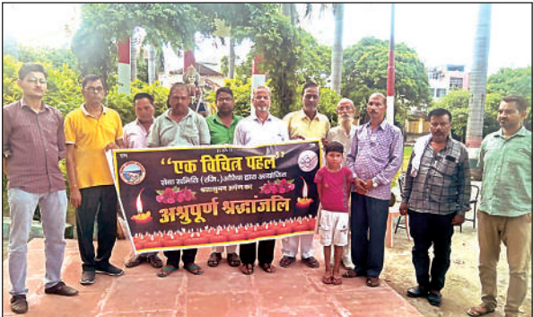
श्रद्धांजलि अर्पित करते संगठन के पदाधिकारी।

अमृत विचार। समाजसेवी संगठन एक विचित्र पहल सेवा समिति की ओर से गुरुवार को शाम 5 बजे शहीद पार्क, औरैया में श्रद्धांजलि सभा का आयोजन किया गया। जिसके अंतर्गत मंगलवार को जम्मू में वैष्णो देवी मंदिर मार्ग पर अर्धकुमारी मंदिर व इंद्रप्रस्थ भोजनालय के समीप अचानक भूस्खलन हुआ था, जिसमें पहाड़ों की ढलान से बड़े पत्थर, शिला खंड व चट्टानें नीचे गिरने लगी थी, जिसमें अपनी धार्मिक आस्था में सरावोर भीषण हादसे की चपेट में आए लगभग 34 श्रद्धालुओं की हृदय विदारक मृत्यु हो गई थी, तथा तमाम श्रद्धालु घायल हो गए हैं, उनकी कटरा के नारायणा अस्पताल में चिकित्सा चल रही है।