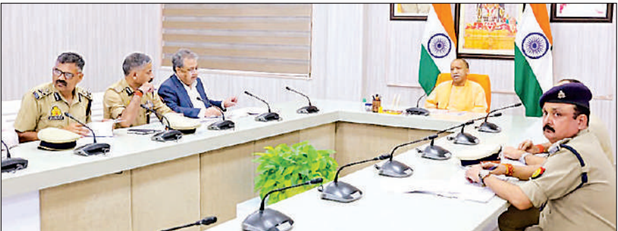
लखनऊ स्थित अपने आवास पर होमगार्ड्स स्वयंसेवकों के रिक्त पदों पर एनरोलमेंट के संबंध में बैठक करते मुख्यमंत्री योगी।

अमृत विचार : मुख्यमंत्री योगी आदित्यनाथ ने आपदा मित्रों को होमगार्ड स्वयंसेवकों के रूप में तैनाती देने के निर्देश दिए। कहा कि प्रदेश में होमगार्डों के रिक्त पदों पर नए एनरोलमेंट की प्रक्रिया तत्काल शुरू करें। बदलते समय और बढ़ते दायित्वों को देखते हुए होमगार्ड एनरोलमेंट से जुड़े नियमों में संशोधन पर जोर देते हुए मुख्यमंत्री ने समयबद्ध, पारदर्शी और निष्पक्ष एनरोलमेंट सुनिश्चित करने के लिए पुलिस भर्ती एवं प्रशिक्षण बोर्ड के सहयोग से नया बोर्ड गठित करने के भी निर्देश दिए हैं। मुख्यमंत्री ने गुरुवार को आयोजित एक उच्चस्तरीय बैठक