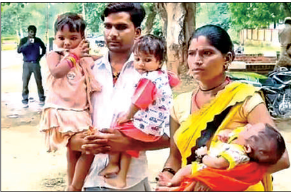
एसपी कार्यालय के बाहर बेटियों को लेकर खड़े भाई-बहन।