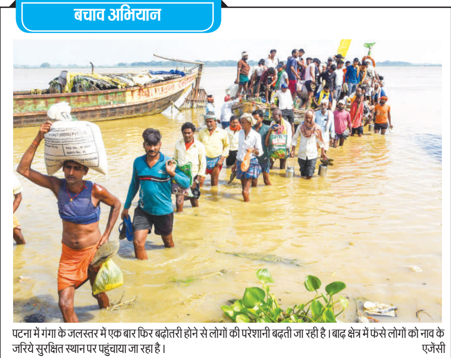
पटना में गंगा के जलस्तर में एक बार फिर बढ़ोतरी होने से लोगों की परेशानी बढ़ती जा रही है। बाढ़ क्षेत्र में फंसे लोगों को नाव के जरिये सुरक्षित स्थान पर पहुंचाया जा रहा है।

बहन और कांग्रेस महासचिव प्रियंका गांधी वाद्रा और राजद नेता तेजस्वी यादव मोटरसाइकिल पर मुजफ्फरपुर के लिए रवाना हुए थे। इस प्रकरण पर प्रतिक्रिया व्यक्त करते हुए, उपमुख्यमंत्री एवं भाजपा की बिहार इकाई के पूर्व अध्यक्ष सम्राट चौधरी ने कहा, भीड़ का व्यवहार राजद को गंदागंदी जैसा था। और कांग्रेस सत्ता की अंधी चाहत में उपद्रवी व्यवहार को बर्दाश्त कर लेती है। वीडियो क्लिप एक छोटे से मंच की है, जिस पर कोई प्रमुख नेता मौजूद नहीं था, लेकिन एक व्यक्ति माइक पर अपशब्द कह रहा था, जिसे सुना जा सकता था, लेकिन देखा नहीं जा सकता था और इस व्यक्ति को वहां खड़े लोगों ने फटकार लगाई।