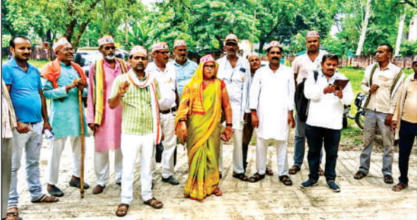
मांगों को लेकर कुलपहाड़ में प्रदर्शन करते किसान।