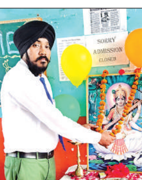
छित्र पर माल्यार्पण करते प्रिंसिपल।

नए विकासखंड में चला गया, तो लोगों को सरकारी कार्यों के लिए अतिरिक्त दूरी तय करनी पड़ेगी। ग्रामीणों ने कहा कि ग्राम पंचायत विलावा को अजीतमल विकासखंड में ही रखा जाए तथा अयाना विकासखंड में किसी अन्य नजदीकी गांव को सम्मिलित किया जाए।