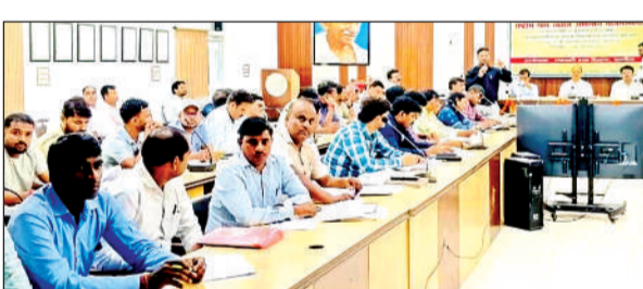
कलेक्ट्रेट सभागार में अधिकारियों की मौजूदगी में जानकारी देता ट्रेनर।