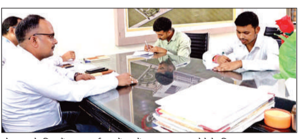
रोजगार के लिए कैपस कार्यालय में छात्रों का साक्षात्कार लेते फैलिटस्ट।