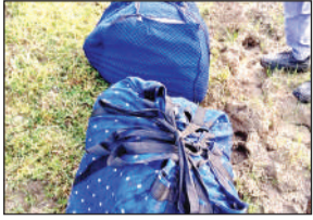
चित्रकूट एक्सप्रेस से फेंके गए बैग।