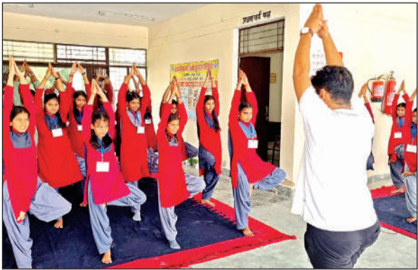
छात्राओं को योगाभ्यास कराते योग प्रशिक्षक।