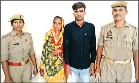
पुलिस करस्टी में दोषसिद्ध महिला व उसका प्रेमी।