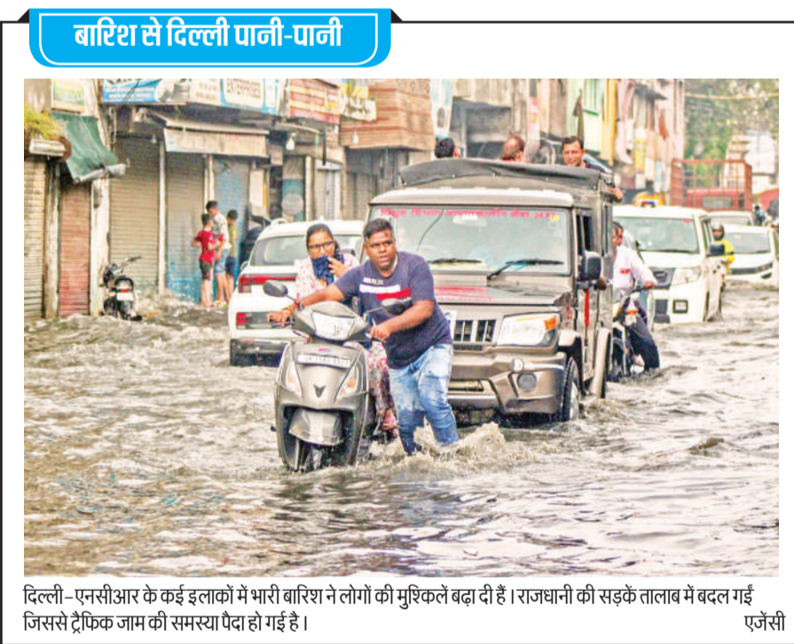
दिल्ली-एनसीआर के कई इलाकों में भारी बारिश ने लोगों की मुश्किलें बढ़ा दी हैं। राजधानी की सड़कें तालाब में बदल गईं जिससे ट्रैफिक जाम की समस्या पैदा हो गई है।