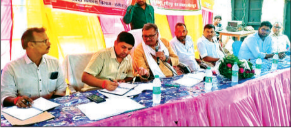
बिरखेरा गांव की ग्राम चौपाल में शिकायत सुनते सदर विधायक।