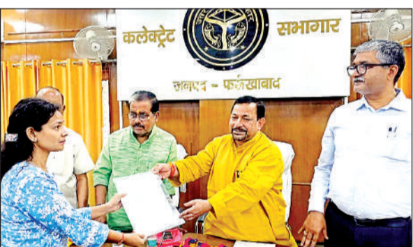
चयनित अभ्यर्थी को नियुक्ति पत्र देते सांसद मुकेश राजपूत साथ में डीएम व अन्य।