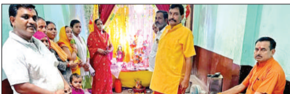
श्री गणेश की आराधना करते भक्त।

सीएचसी में भर्ती कराया। दूसरे बस चालक को पकड़ लिया और दोनों बसों सहित कोतवाली ले आए। घायल बस चालक को गंभीर हालत में तिर्वा मेडिकल कालेज के लिए रेफर कर दिया गया।