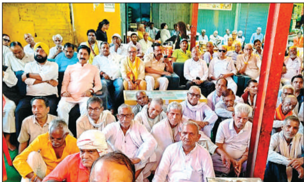
शुक्रवार को श्रीराम कथा का श्रवण करते आस्थावान।

कथावाचक ने भगवान शिव के श्रृंगार का अध्यात्मिक दर्शन बताया। शिव ने मुकुट के बदले जटाओं का मुकुट क्यों लगाया। वह इसलिए क्योंकि सिर से जटा प्रकट होती हैं और सिर से विचार प्रकट होते हैं। जब भी संसार की तरफ आगे बढ़े तो अपने बिखरे हुए केशों को यानी विचारों को एकत्र कर लेना चाहिए। बिखरे हुए विचारों के साथ गृहस्थ जीवन में प्रवेश नहीं करना चाहिए। उन्होंने कहा कि भगवान शंकर चित्ता की भस्म क्यों लगाते हैं। इसलिए लगाते हैं, क्योंकि चित्ता की भस्म का दर्शन मृत्यु की स्मृति दिलाता है और संसार में समस्त