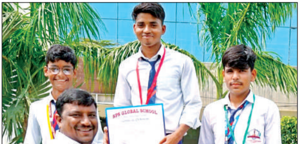
विजेताओं को पुरस्कार देते विश्वनाथ प्रताप सिंह।