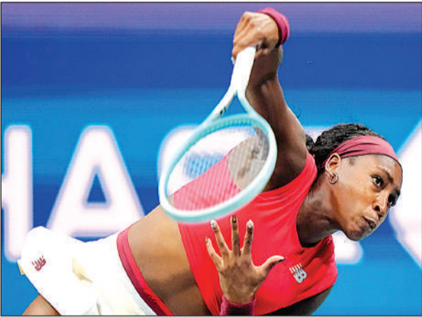
अमेरिका की कोको गौफ क्रोएशिया की डोना वेकिच के खिलाफ सर्विस करती हुई।

वहीं, जापान की नाओमी ओसाका 2021 के बाद पहली बार अमेरिकी ओपन के तीसरे दौर में पहुंच गई जिन्होंने हेली बाफिट्टे को 6-3, 6-1 से हराया। ओसाका ने अपने चारों ग्रैंडस्लैम हार्डकोर्ट पर जीते हैं जिनमें दो अमेरिकी ओपन और दो आस्ट्रेलियाई ओपन शामिल हैं। वह 2020 में आखिरी बार यहां खिताब जीती थी जिसके बाद 2021 में तीसरे, 2022 में पहले और 2024 में दूसरे दौर से बाहर हो गई थी। इस साल विंबलडन में तीसरे दौर में बाहर होने के बाद ओसाका ने कोच पैट्रिक मूराटोग्लू से अलग होने का फैसला किया और अब नये कोच टोमाज