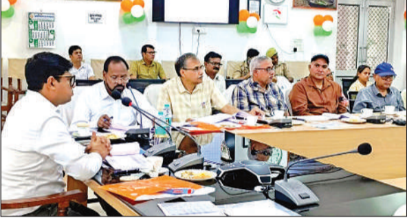
कलेक्ट्रेट सभागार में जिला स्वास्थ्य समिति की बैठक करते डीएम।

डीएम ने जननी सुरक्षा योजना, जननी शिशु सुरक्षा कार्यक्रम, राष्ट्रीय बाल स्वास्थ्य कार्यक्रम, गर्भवती महिलाओं की मंत्रा एप पर फीडिंग, चाइल्ड रजिस्ट्रेशन, प्रधानमंत्री मातृ वंदना योजना के पोर्टल पर बेनिफिशियर अपलोड करने, फैमिली प्लानिंग, संस्थागत प्रसव, आशा भुगतान, एनआरसी सेन्टर पर बच्चों की उपलब्धता, दवाओं की उपलब्धता, वीएसएचएनडी सत्र का आयोजन, टीबी, एचआईवी सचन जागरूकता अभियान, संचारी रोग नियंत्रण