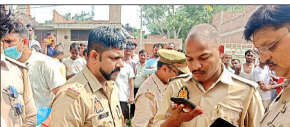
घटनास्थल पर जांच करती पुलिस।