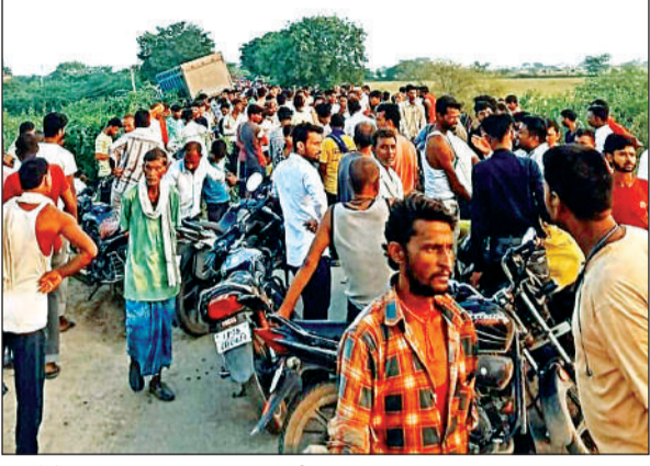
हादसे के बाद सड़क पर जाम लगाए ग्रामीण।