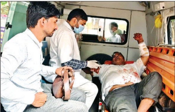
घायल चालक को उपचार के लिए ले जाते एंबुलेंस कर्मी।