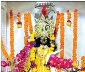
भगवान बलदाऊ की मूर्ति।