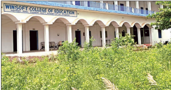
कालेज परिसर में खड़ी बड़ी-बड़ी घास।