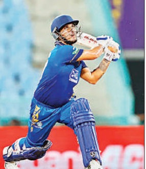
शॉट लगाता खिलाड़ी।

लखनऊ : बाबासाहेब भीमराव अंबेडकर विवि में पीजी पाठ्यक्रम हेतु विशेष अभियान शुरू किया गया है जिसकी अंतिम तिथि 25 अगस्त निर्धारित की गई है। जबकि विवि के अमेटी कैम्पस में स्नातक में अब भी सीटें खाली हैं। विश्वविद्यालय के स्नातकोत्तर पाठ्यक्रमों में रिक्त सीटों पर प्रवेश के लिए विशेष अभियान के तहत छात्रों से आवेदन आमंत्रित किए गए हैं।