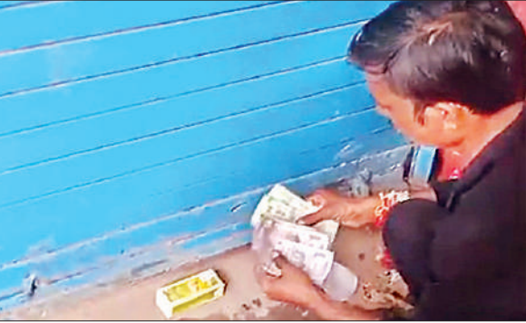
शटर के नीचे से हो रही शराब की बिक्री।

ठाकुरगंज क्षेत्र के मल्लाहीटोला में देशी शराब के ठेके पर 24 घंटे शराब बेची जा रही है। यहां रात 12 बजे तक शटर गिराकर अंदर से शराब बेची जाती है। सुबह 5 बजे से फिर ये सिलसिला शुरू हो