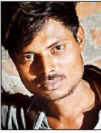
प्रदीप फाइल फोटो।

अमृत विचार: बंधरा के कटी बगिया इलाके में बाइक का पंचर बनवाने गए मजदूर का कुछ युवकों से किसी बात को लेकर विवाद हो गया। बात बढ़ने पर दबंगों ने मजदूर पर लाठी-डंडों व रॉड से हमला कर दिया। रात में तबीयत बिगड़ने पर परिजन ने अस्पताल पहुंचाया, जहां उसकी मौत हो गयी। पुलिस ने पत्नी की तहरीर पर चार नामजद व अज्ञात के खिलाफ रिपोर्ट दर्ज कर ली है।