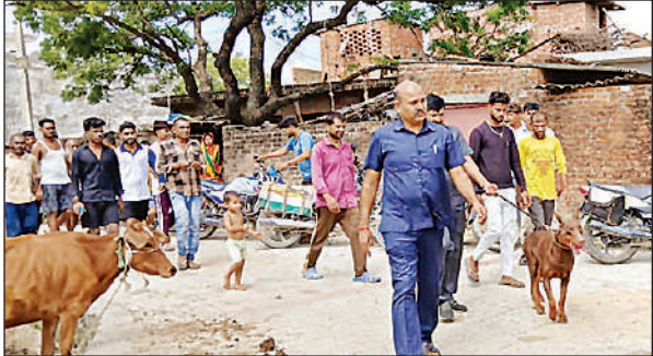
खोजी कुते को लेकर जांच करते पुलिस कर्मी।