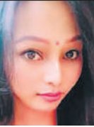
● मणिपुर हाईकोर्ट ने जारी किया ऐतिहासिक आदेश

जन्म से पुरुष, लेकिन ऑपरेशन के बाद महिला बन गई याचिकाकर्ता ने शिक्षा बोर्ड और विश्वविद्यालयों द्वारा नए नाम और लैंगिक पहचान के साथ नए प्रमाणपत्र प्रदान करने के उसके अनुरोध को स्वीकार न करने पर अदालत का रुख किया था। उसने नई पहचान के रूप में पहले ही आधार कार्ड, पैन कार्ड और मतदाता पहचान पत्र प्राप्त कर लिया है।