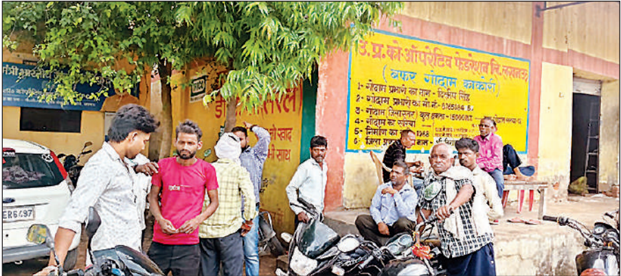
सहकारी समिति के बाहर खाद के लिए लगी किसानों की भीड़।

मामा चौराहे के पास मंगलवार सुबह करीब 5:30 बजे फेमे मेंस सैलून से आग की लपट और धुआं निकलने लगा। आसपास के लोगों की सूचना पर कुछ ही देर में एफएसओ इंदिरानगर एक दमकल के साथ मौके पर पहुंच गए। कुछ ही देर में आग पर काबू पा लिया गया। एफएसओ के मुताबिक दमकलकर्मी पहुंचते तो मीटर बोर्ड में आग लगी थी।