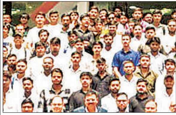
इंडियन जियोटेक्निकल सोसाइटी लखनऊ चेंटर की स्थापना के अवसर पर मौजूद शिक्षक।