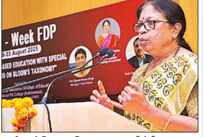
कार्यक्रम में शिक्षण अधिगम पर जानकारी देती वक्ता।