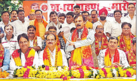
शपथ ग्रहण के दौरान मौजूद पदाधिकारी ।