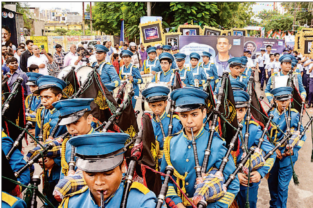
गोमती नगर सिटी मांटेसरी स्कूल के बच्चों ने बैगपाइपर बैंड की धुन से शुभांशु शुक्ला का स्वागत किया।

■ सुराों के मुताबिक, शुभांशु शुक्ला को बिना प्रोटोकॉल और जानकारी दिए कहीं जाने की अनुमति नहीं होगी। राज्य अतिथि होने के नाते उनकी हर गतिविधि सरकार और सुरक्षा एजेंसियों की निगरानी में होगी। सुरक्षा एजेंसियों ने यह भी स्पष्ट किया है कि किसी भी प्रकार का प्रोग्राम तभी होगा, जब पहले से सूचना दी जाए और सुरक्षा इंतजाम पूरे हों।