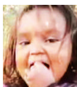
साक्षी की फाइल फोटो।