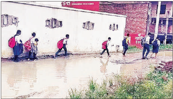
पानी से होकर निकलते हुए बच्चे ।