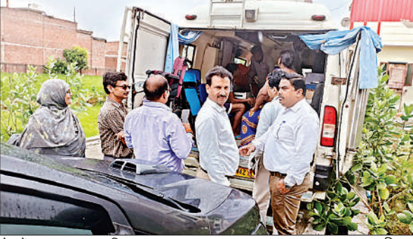
क्षेत्र में एमएमयू लगाकर किया गया इलाज ।