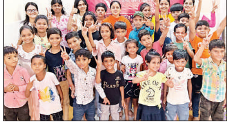
संस्कारशाला में शामिल बच्चे।