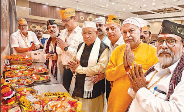
पूजन अर्चन करते सिंधी समुदाय के लोग ।