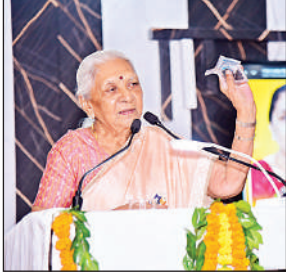
जहांगीरगंज में आयोजित कार्यक्रम को संबोधित करतीं राज्यपाल आनंदीबेन पटेल।

राज्यपाल आनंदी बेन पटेल ने अतिथियों एवं आंगनबाड़ी कार्यकत्रियों और विभिन्न योजनाओं के लाभार्थियों को बधाई देते हुए कहा