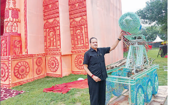
बप्पा के पंडाल के बाहर तैनात है ब्रह्मोस मिसाइल।