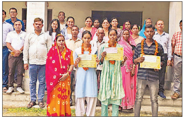
सम्मानित किए गए मेधावी।

अमृत विचार, लखनऊ : दिव्य ज्योति जाग्रति संस्थान की ओर से सोमवार को रायबरेली रोड स्थित वृन्दावन योजना में शुचिता संस्कारशाला का आयोजन किया गया। इस संस्कारशाला में बच्चों के जीवन में हर स्तर पर पवित्रता लाने की कला सिखाई गई। संस्थान ने मंथन प्रकल्प के तहत बच्चों के सम्पूर्ण विकास के लिए इस संस्कारशाला का आयोजन किया। इस कार्यक्रम में 40 बच्चों ने भाग लिया। खेल और अन्य गतिविधियों के माध्यम से बच्चों को जीवन में सदैव स्वच्छता रखने के महत्व पर जोर दिया गया। ताकि वे तन, मन एवं धन हर स्तर पर पवित्रता लाने का प्रयास करें।