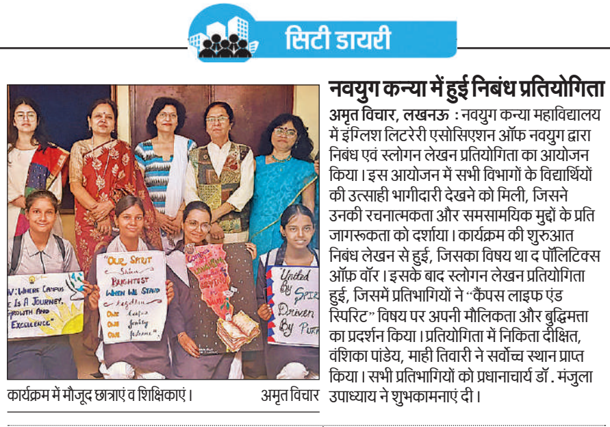
कार्यक्रम में मौजूद छात्राएं व शिक्षिकाएं।