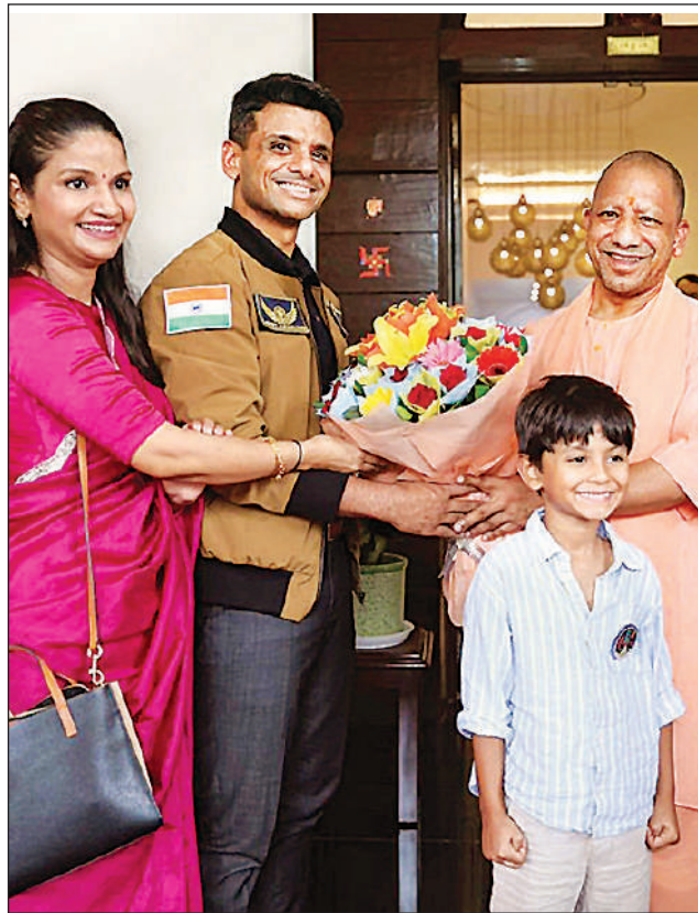
सरकारी आवास पर शुभांशु का स्वागत करते मुख्यमंत्री योगी आदित्यनाथ।