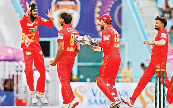
मैच जीतने के बाद खुशी जाहिर करते कानपुर सुपर स्टार्स के खिलाड़ी।