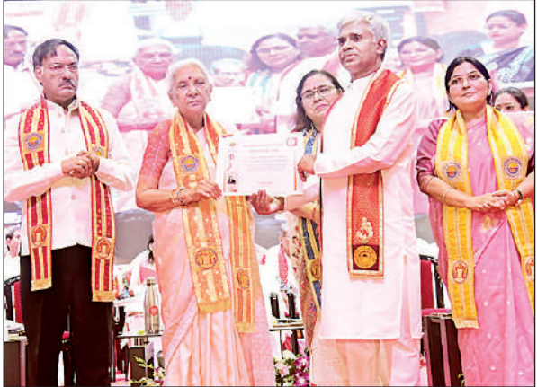
दीक्षांत समारोह में उपाधि देतीं राज्यपाल आनंदीबेन पटेल।

राज्यपाल ने सभी पदक प्राप्त करने वाले विद्यार्थियों को बधाई देते हुए कहा कि जिन छात्रों को पदक प्राप्त नहीं हुआ है, उन्हें निराश होने की आवश्यकता नहीं है। कठिन परिश्रम और निरंतर प्रयास