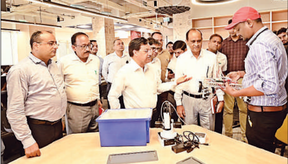
इंफोसिस मेकर्स लैब में कुलपति, मुख्यमंत्री के सलाहकर व अन्य ।