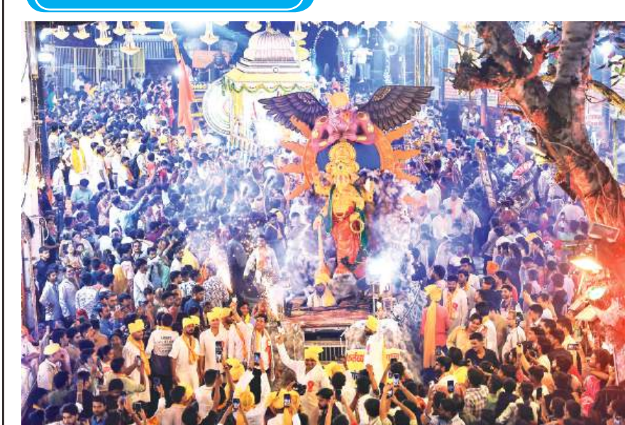
जयपुर के मोती ढूंगरी गणेश मंदिर में गणेश चतुर्थी उत्सव के समापन पर आयोजित शोभा यात्रा में हजारों लोगों ने भाग लिया।