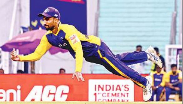
डाइव लगाकर गेंद रोकते लखनऊ फॉल्कंस के खिलाड़ी।