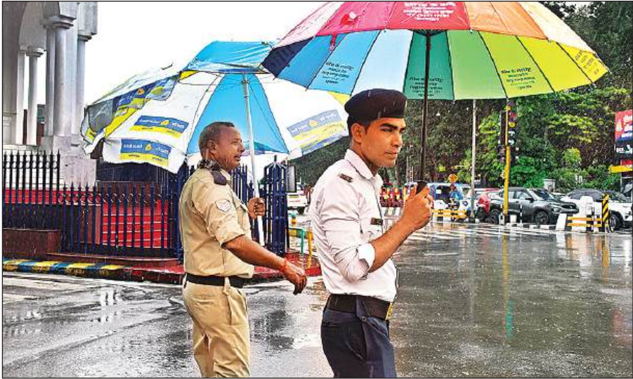
अटल चौराहे पर बारिश के बीच छाते के सहारे यातायात को नियंत्रित करते कर्मी।