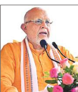
कार्यक्रम में बोलते मंत्री सुरेश खन्ना।

■ सेक्टर 1 में अवर जलाशय परिसर में 660 किलोलीटर क्षमता के सीडब्ल्यूआर का निर्माण 410 लाख से, सेक्टर 6 अवर जलाशय परिसर में 660 किलोलीटर क्षमता के सीडब्ल्यूआर का निर्माण 410 लाख, सेक्टर 4 जुराखनपुरवा/सीएमएस शहीद पथ स्थित अवर जलाशय परिसर में 660 किलोलीटर क्षमता का सीडब्ल्यूआर 410 लाख, सेक्टर 5 रामकथा पार्क के पास अवर जलाशय परिसर में 660