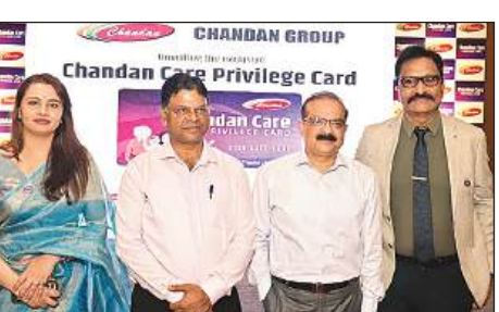
एडीजी व प्रमुख सचिव के साथ चंदन अस्पताल के अधिकारी।