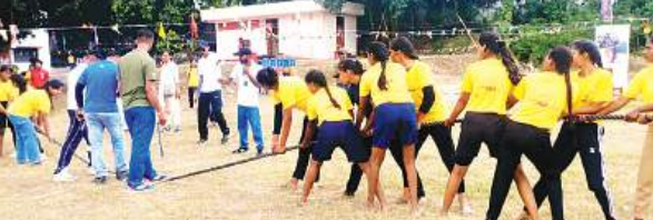
खेलकूद प्रतियोगिता में हिस्सा लेती छात्राएं।