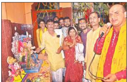
गणेश जी की पूजा करते लोग।