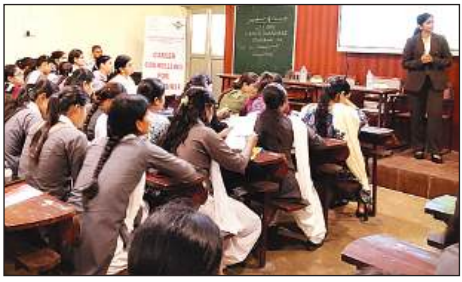
नवयुग कन्या महाविद्यालय में कार्यक्रम में छात्राएं।