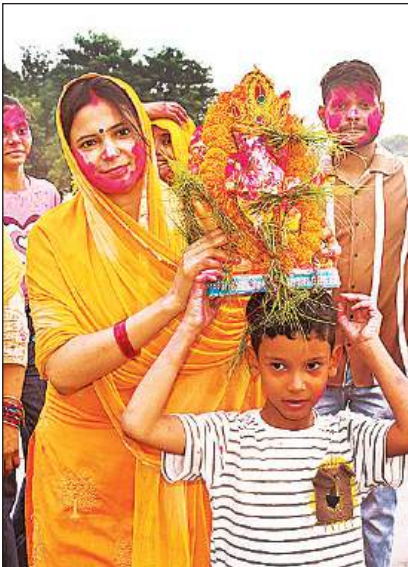
गजानन की मूर्ति विसर्जित करने जाता बालक।