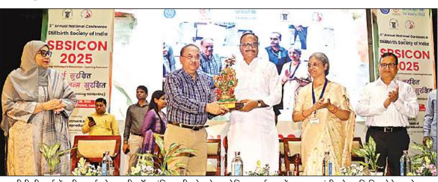
एसजीपीजीआई में स्टील बर्थ सोसायटी ऑफ इंडिया की ओर से आयोजित कार्यक्रम में उप मुख्यमंत्री को स्मृति चिह्न देते आयोजक।