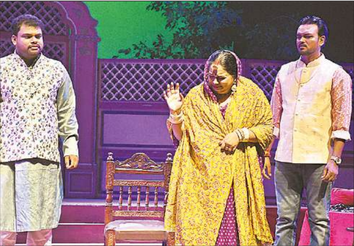
उत्तर प्रदेश संस्कृति विभाग के सहयोग से आयोजित नाटक में मंचन करते कलाकार।