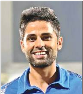
कप्तान सूर्यकुमार यादव।

14 सितंबर को दुबई में चिर प्रतिद्वंद्वी पाकिस्तान से मुकाबला करेगा भारत।