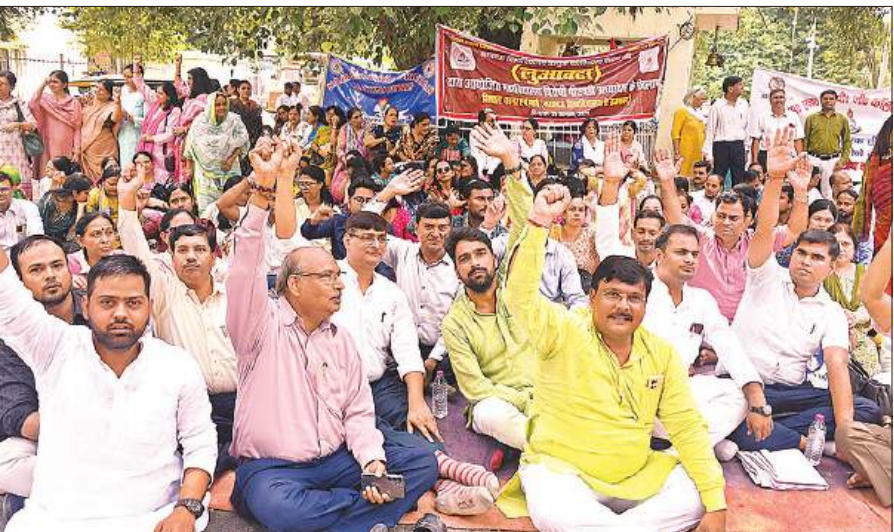
धरने में उपस्थित महिला शिक्षिकाएं।

अमृत विचार, लखनऊ : लखनऊ की सब जूनियर बालिका बास्केटबॉल टीम ने शानदार प्रदर्शन करते हुए राज्य स्तरीय समन्वय बालिका बास्केटबॉल प्रतियोगिता में चैंपियन बनने का गौरव हासिल किया। यह प्रतियोगिता खेल निदेशालय की देखरेख में मथुरा में आयोजित की गई।