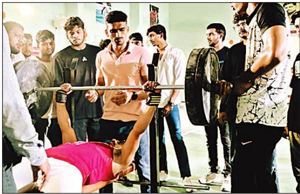
खेल प्रतियोगिता में जैरआजमाइश करता छात्र।