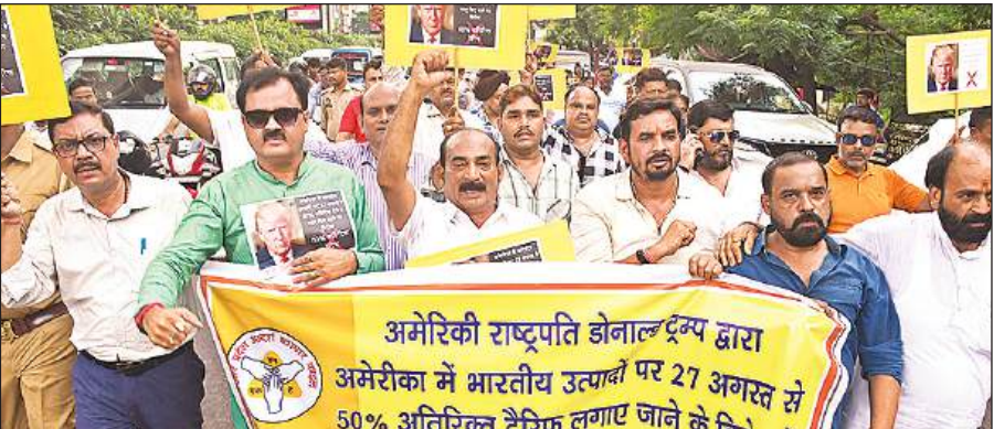
अमेरिकी टैरिफ के विरोध में मार्च निकालते उत्तर प्रदेश आदर्श व्यापार मंडल के पदाधिकारी और सदस्य।

देश के व्यापारी अन्य देशों ब्रिटेन, जापान, साउथ कोरिया, जर्मनी, फ्रांस, इटली, स्पेन, नीदरलैंड, पोलैंड, कनाडा, मेक्सिको, रूस, बेल्जियम सहित चारोंप देशों में भारत के सहयोग से अपने उत्पाद बेचने की तैयारी कर रहे हैं। भारत विपक्ष का सबसे बड़ा उपभोक्ता बाजार है। भारत को किसी से समझौता करने की आवश्यकता नहीं है। भारत के अनेक ऐसे उत्पाद हैं