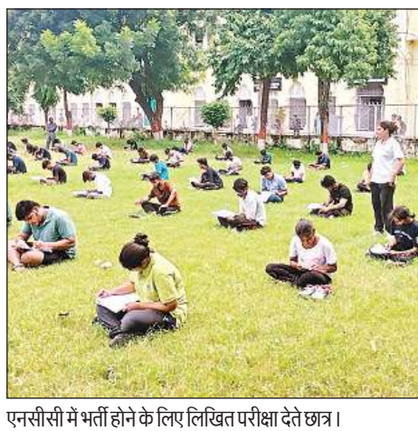
एनसीसी में भर्ती होने के लिए लिखित परीक्षा देते छात्र।

अमृत विचार, लखनऊ : लखनऊ विश्वविद्यालय में 5 यूपी एयर एनसीसी के सत्र 2025-26 के लिए नामांकन अभियान संपन्न हुआ। प्रक्रिया की शुरुआत शारीरिक परीक्षण से हुई, जिसमें दौड़, पुश-अप्स और सिटअप्स शामिल थे। कुल 119 छात्र नामांकन के लिए उपस्थित हुए। इनमें से 66 छात्र शारीरिक परीक्षण में उत्तीर्ण हुए और उन्हें लिखित परीक्षा के लिए पात्र घोषित किया गया। इनमें से 18 छात्राएं थीं, जो महिला कैडेटों की उत्साहजनक भागीदारी को दर्शाते हैं। शारीरिक मूल्यांकन के बाद योग्य उम्मीदवारों को अंतिम रूप देने के लिए लिखित परीक्षा आयोजित की गई। इसके अलावा आगरा में होने वाली आगामी अंतर-समूह प्रतियोगिता के लिए कैडेटों के चयन हेतु एक प्रश्नोत्तरी प्रतियोगिता का आयोजन किया गया। विभिन्न इकाइयों और कॉलेजों के कुल 12 छात्रों ने प्रश्नोत्तरी में उत्साहपूर्वक भाग लिया।