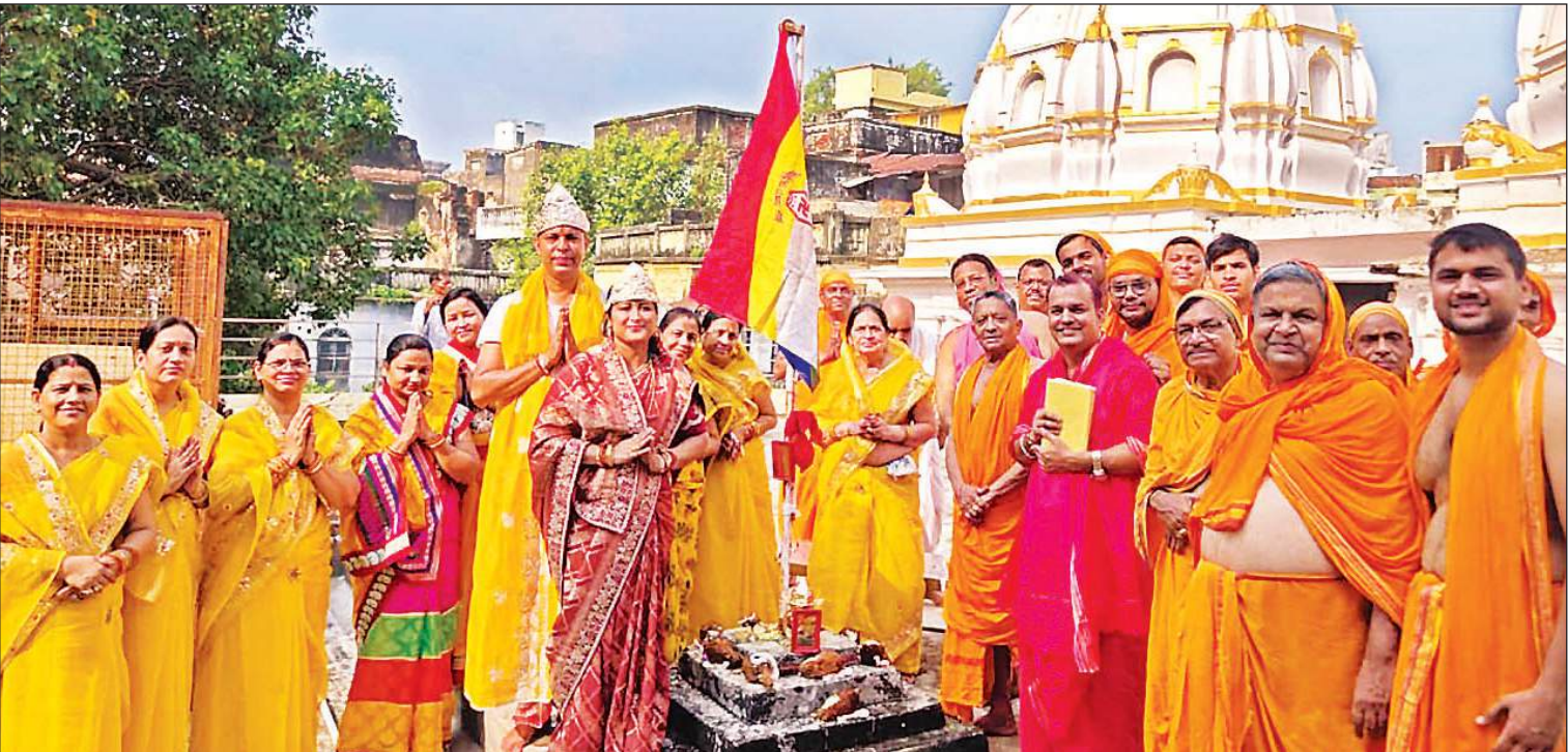
दशलक्षण पर्व पर चौक में जैन मंदिर में कलश स्थापना के दौरान मौजूद श्रद्धालु।