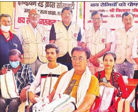
टीबी मरीजों के साथ इंडियन रेड क्रॉस सोसाइटी के पदाधिकारी।