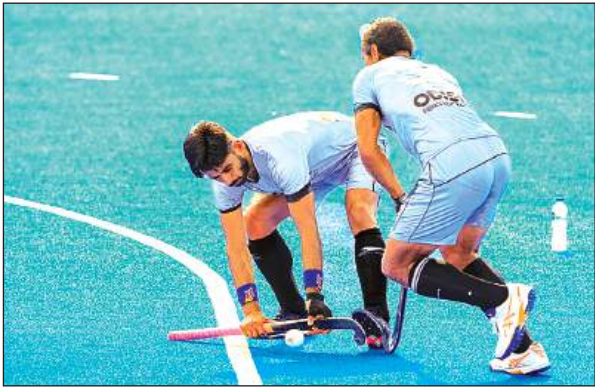
राजगीर स्पोर्ट्स कॉम्प्लेक्स में अभ्यास करते भारतीय खिलाड़ी।

लीग में सातवें स्थान पर खिसक गया। भारत ने आठ में से सिर्फ एक मैच जीता और सात मैच लगातार हारे जिससे कोच क्रेग फुल्टोन को एशिया कप में अपनी सर्वश्रेष्ठ टीम