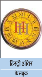
हिस्ट्री ऑवर फेसबुक

19वीं सदी के अंत में, अमेरिका के डेट्रॉइट शहर में, एक युवा मैकेनिक एक बिजली कंपनी में दिन में दस घंटे काम करके हफ्ते में केवल ग्यारह डॉलर कमाता था। यह उसका रोज का काम था।