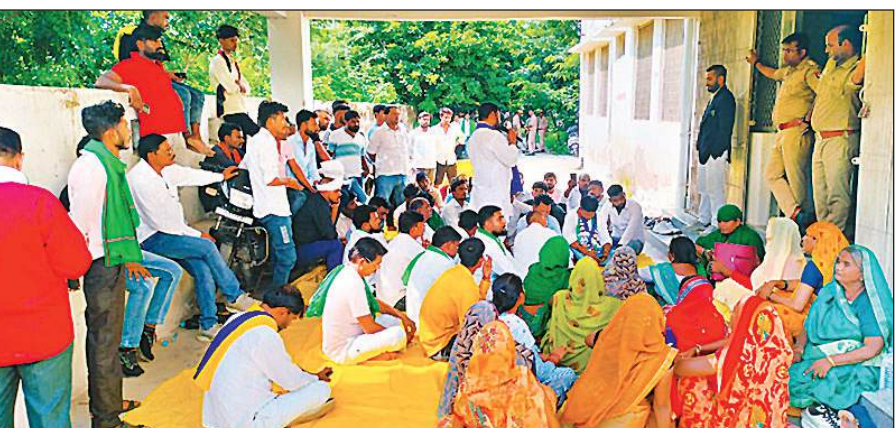
एसीपी कार्यालय के सामने घरनेपर बैठे किसान संगठन के पदाधिकारी और कार्यकर्ता।