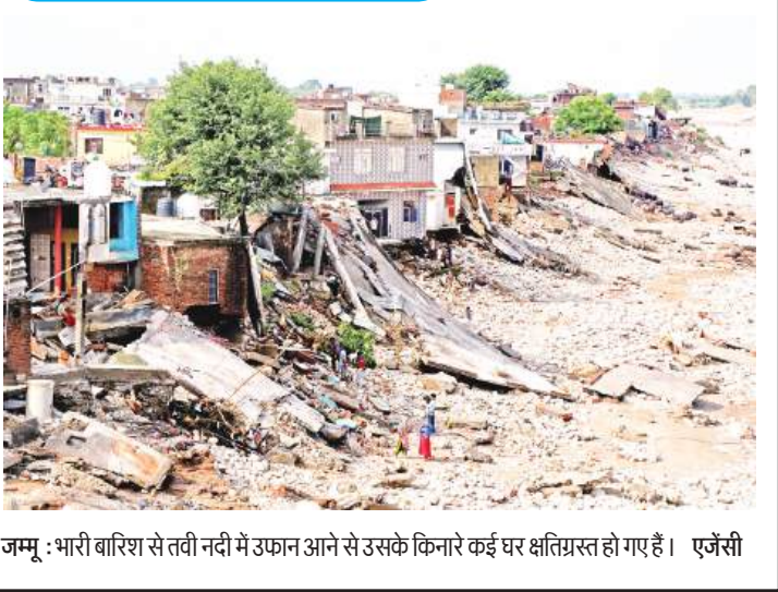
जम्मू : भारी बारिश से तवी नदी में उफान आने से उसके किनारे कई घर क्षतिग्रस्त हो गए हैं। एजेंसी