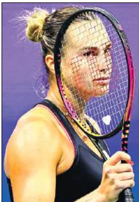
बेलारूस की आर्यना सबालेंका।

पहले सेट के टाई-ब्रेकर में कड़ी टक्कर के बाद, तीन बार की ग्रैंड स्लैम विजेता ने बुधवार को दूसरे सेट में अपनी लय और जीत हासिल की। साल के अपने पहले ग्रैंड स्लैम खिलाब जीतने की कोशिश में लगी सबालेंका ने जीत के बाद कहा पहला सेट मेरे लिए बहुत कड़ा