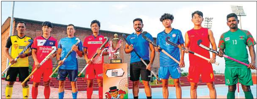
भारतीय कप्तान हरमनप्रीत सिंह अन्य प्रतिस्पर्धी टीमों के अपने समकक्षों के साथ गुरुवार को बिहार के राजगीर में पुरुष एशिया कप हॉकी टूर्नामेंट से पहले ट्रॉफी के साथ फोटो सेशन कराते हुए।

भारत और चीन को पूल ए में जापान और कजाखस्तान के साथ रखा गया है। पूल बी में पांच बार की चैंपियन दक्षिण कोरिया, मलेशिया, बांग्लादेश और चीनी ताइपे हैं। कजाखस्तान तीन दशक में पहली बार एशिया कप खेल रही है, जिसने ओमान की जगह ली है, जबकि बांग्लादेश की जगह पाकिस्तान खेल रहा है। अप्रैल में पहलगाम में आतंकवादी हमले के बाद भारत के आपरेशन सिंदूर के मद्देनजर पाकिस्तान ने सुरक्षा कारणों से नाम वापिस ले लिया। हर पूल की शीर्ष दो टीमें सेमीफाइनल खेलेंगी जबकि फाइनल सात सितंबर को होगा। यह टूर्नामेंट अगले साल 14 से 30 अगस्त तक बेल्जियम और नीदरलैंड में होने वाले विश्व कप के लिए क्वालीफाई करने का भारत के पास सर्वश्रेष्ठ और आखिरी मौका है। भारत ने पहला मौका गंवा दिया जब यूरोपीय चरण में खराब प्रदर्शन के बाद वह एकआईएच प्रो