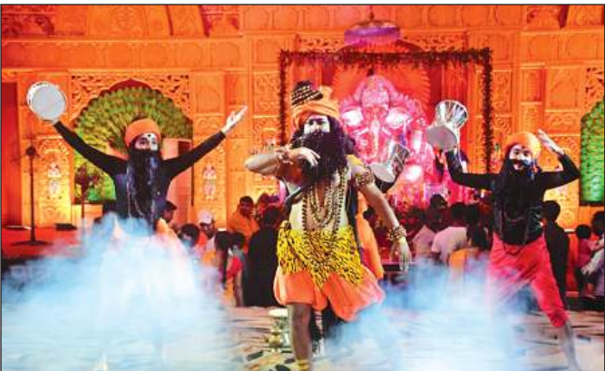
झूलेलाल वाटिका के गणेश उत्सव में सांस्कृतिक कार्यक्रम प्रस्तुत करते कलाकार।