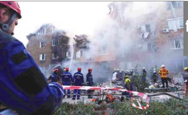
गुरुवार को यूक्रेन के कीव में रूसी हमले में नष्ट हुए एक घर पर काम कर रहा बचाव दल।

जब उनसे पूछा गया कि क्या उनका मतलब ‘पुतिन का युद्ध’ है तो नवारो ने दोहराया, मेरा मतलब मोदी का युद्ध है क्योंकि शांति का रास्ता आंशिक रूप से नई दिल्ली से होकर जाता है। ट्रंप ने रूसी तेल की खरीद के लिए भारत पर 25 प्रतिशत का अतिरिक्त शुल्क लगाया है, जो बुधवार से प्रभावी हो गया है। इसके साथ ही अमेरिका द्वारा भारत पर लगाया गया कुल शुल्क 50 प्रतिशत हो गया है। नवारो ने दावा किया कि भारत