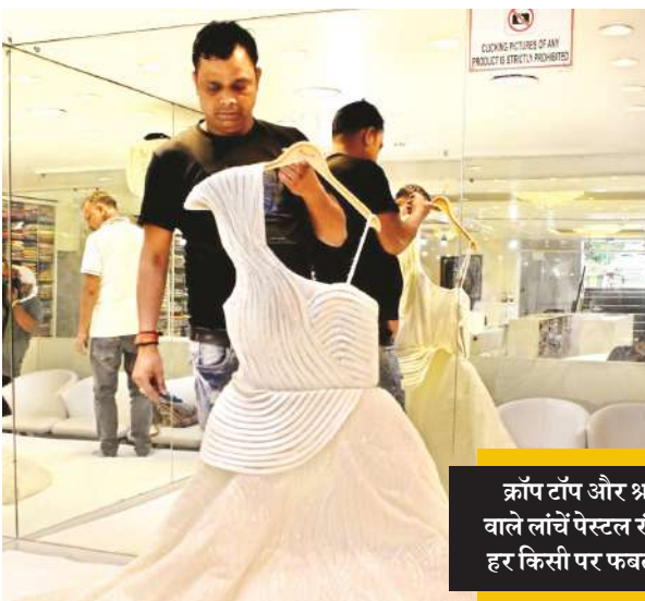
क्रॉप टॉप और श्रग वाले लॉन्ग पेस्टल रंग हर किसी पर फबता