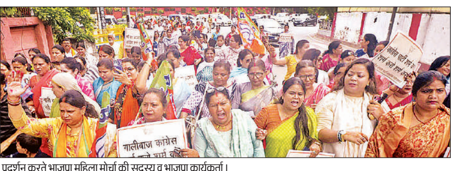
प्रदर्शन करते भाजपा महिला मोर्चा की सदस्य व भाजपा कार्यकर्ता।