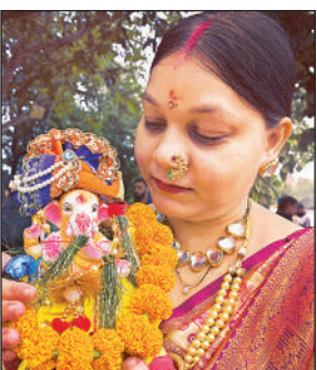
मनौतियों के राजा गणेश का पूजन करते भक्त।