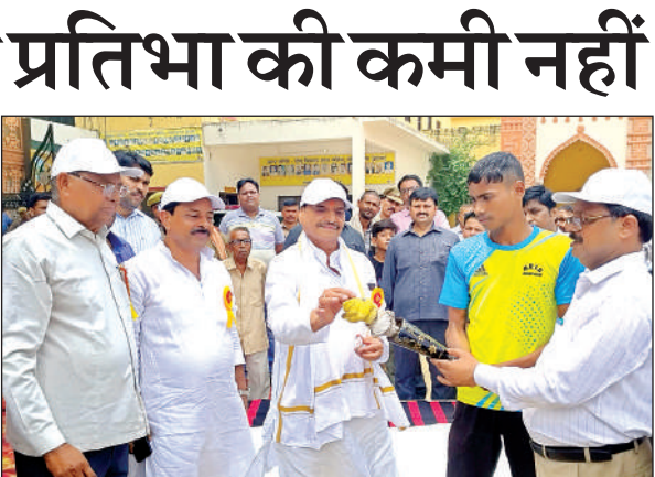
एथलेटिक्स प्रतियोगिता का शुभारंभ करते शिवपाल सिंह यादव।