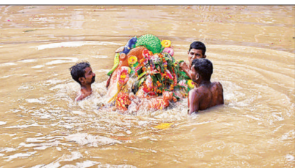
गोमती तट पर बने कुण्ड में पूजा करने के उपरान्त प्रतिमा को विसर्जित करते भक्त।