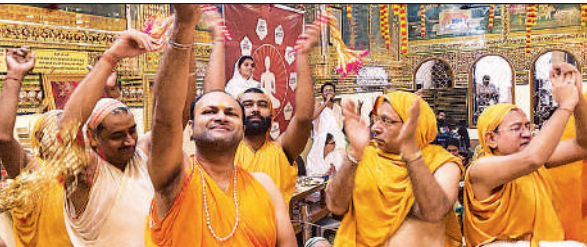
पूजन अर्चन करते जैन समाज के लोग।