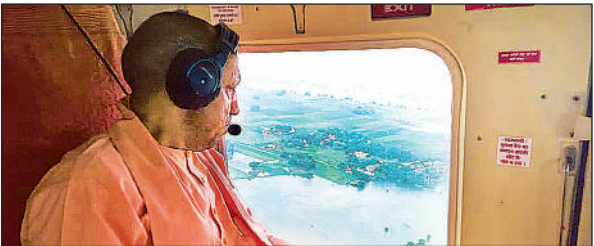
गाजीपुर के बाढ़ प्रभावित क्षेत्रों का हवाई सर्वे करते मुख्यमंत्री योगी।

अमृत विचार : मुख्यमंत्री योगी आदित्यनाथ ने शनिवार को वाराणसी प्रवास के बाद गाजीपुर में बाढ़ प्रभावित क्षेत्रों का हेलीकॉप्टर से हवाई सर्वेक्षण किया। उन्होंने हेलीकॉप्टर से बाढ़ की स्थिति का जायजा लेने के बाद जिला व मंडल स्तर के अधिकारियों को दिशा-निर्देश दिये। उन्होंने कहा कि बाढ़ प्रभावित लोगों को किसी भी प्रकार की असुविधा न हो, इसके लिए हर संभव प्रयास किए जाएं। उन्होंने यह भी निर्देश दिए कि प्रशासनिक अमला सतत निगरानी में रहे। शरणालयों में रहने