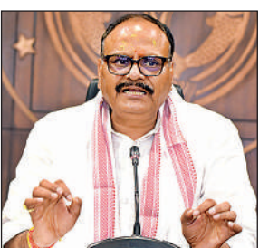
लोकभवन में पत्रकारों को जानकारी देते उप मुख्यमंत्री ब्रजेश पाठक।

अमृत विचार : उप मुख्यमंत्री ब्रजेश पाठक ने कहा कि संभल मुददे पर न्यायिक जांच आयोग ने रिपोर्ट मुख्यमंत्री को सौंप दी है। जांच रिपोर्ट अभी सार्वजनिक नहीं हुई है। हम इसे कैबिनेट में ले जाएंगे, इसके उपरांत कार्रवाई के लिए उसे आगे भेजेंगे। उप मुख्यमंत्री ने साफ तौर पर कहा कि आज की बातचीत न जांच रिपोर्ट से प्रेरित है और न ही उसका संदर्भ लिया जा रहा है। उन्होंने कहा कि आजादी के पहले और 2024 से लेकर कई बार संभल की चर्चा आई है।