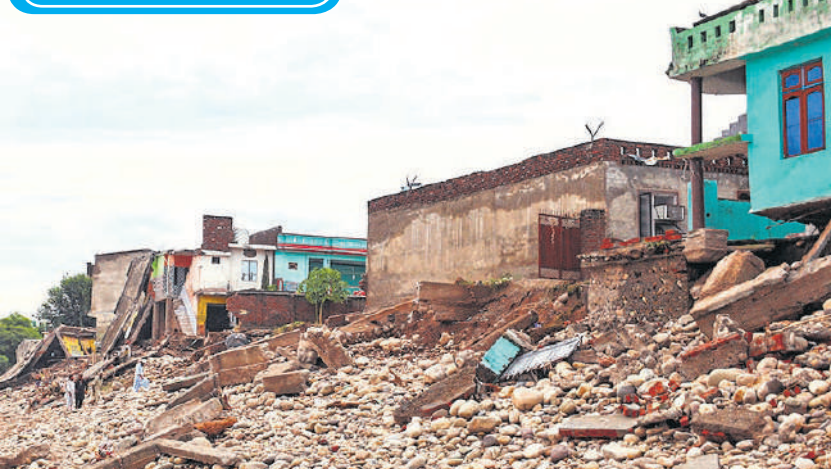
देश के पर्वतीय इलाके लगातार बारिश और भूस्खलन की आपदा से जूझ रहे हैं। शनिवार को भारी बारिश के कारण जम्मू जिले में तवी नदी के तटीय क्षेत्रों में आई बाढ़ ने कई मकानों को बुरी तरह क्षतिग्रस्त कर दिया।