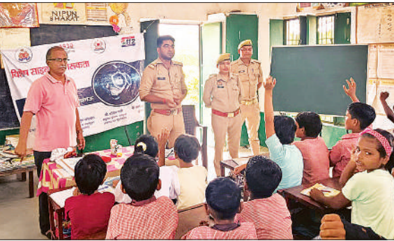
साइबर सुरक्षा के बारे में बच्चों को जानकारी देते पुलिस अधिकारी।