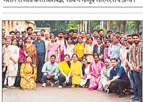
कार्यक्रम के दौरान मौजूद लोग।