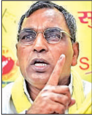
ओम प्रकाश राजभर।

अमृत विचार : जिले के प्रभारी मंत्री/पंचायती राजमंत्री ओम प्रकाश राजभर शुक्रवार रात लोक निर्माण विभाग के गेस्ट हाउस में अधिकारियों के साथ जिले की कानून-व्यवस्था और विकास परियोजनाओं की समीक्षा बैठक की। उन्होंने ने डॉ. संजय निषाद के एनडीए गठबंधन से अलग होने वाले बयान पर प्रतिक्रिया दी। राजभर ने कहा कि संजय निषाद ने