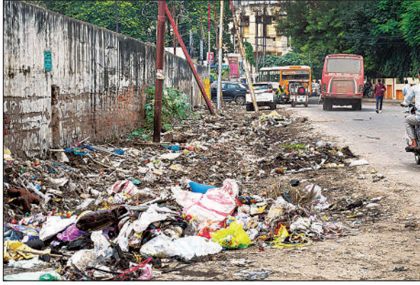
सीएमओ कार्यालय के पास रोड पर पड़ा कूड़ा।

हजरतगंज में लखनऊ क्लब के पास खुले में बने पड़ाव घर पर दिन भर कूड़ा पड़ा रहता है। इससे कालोनी के निवासी और राहगीर गंदगी और बदबू के बीच निकलने को मजबूर हैं। नगर निगम ने इन पड़ाव घरों को कागजों पर तो समाप्त कर दिया है लेकिन कूड़ा अभी भी यहीं डाला जा रहा है।