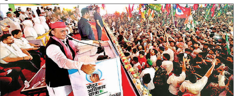
बिहार में वोट अधिकार यात्रा के दौरान आयोजित सभा के दौरान जनसमूह को संबोधित करते सपा प्रमुख अखिलेश यादव।

सपा प्रमुख शनिवार को बिहार के सिवान-छपरा-आरा में वोट