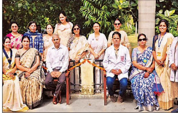
कार्यक्रम में मौजूद वलब के सदस्य और डॉक्टर।