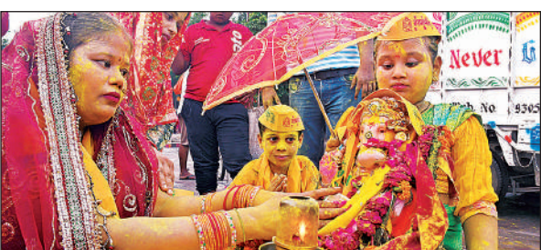
गोमती तट पर विसर्जन से पूर्व गणपति बप्पा की पूजा करते भक्त।