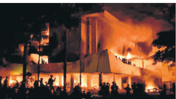
रात भर जलता रहा इंडोनेशिया की प्रांतीय राजधानी में संसद भवन।