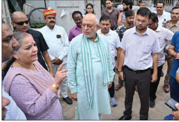
सफाई व्यवस्था का निरीक्षण करते प्रभारी मंत्री साथ में महापौर और नगर आयुक्त।

मंत्री ने अधिकारियों को चेतावनी देते हुए पार्क सही कराने का निर्देश दिया। उन्होंने कहा कि वह 9 सितंबर को दोबारा पार्क का निरीक्षण करेंगे। मंत्री ने कहा कि पार्क में 1,000 पौधे रोपे जाएंगे। गणेश गंज वाई और बशीरतगंज वाई में अतिक्रमण से