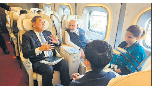
जापान के प्रधानमंत्री के साथ बुलेट ट्रेन में यात्रा करते प्रधानमंत्री मोदी।

की गई राज्य-प्रांत साझेदारी पहल के तहत कदम उठाने का आग्रह किया। मंत्रालय ने बताया कि चर्चा में प्रौद्योगिकी, नवोन्मेष, निवेश, कौशल, ‘स्टार्ट-अप’ और लघु एवं मध्यम उद्यमों के क्षेत्र में भारतीय राज्यों एवं जापानी प्रांतों के बीच बढ़ती साझेदारी को और गहरा करने के तरीकों पर ध्यान केंद्रित किया गया। विदेश मंत्रालय के बयान के अनुसार मोदी ने अपने संबोधन में इस बात पर जोर दिया कि सदियों पुराने सभ्यतागत संबंधों पर आधारित भारत-जापान संबंध नि रंतर मजबूत हो रहे हैं। उन्होंने कहा कि अब समय आ गया है कि टोक्यो और नई दिल्ली पर परंपरागत रूप से ध्यान केंद्रित करने से आगे बढ़कर राज्य-प्रांत संबंधों को नए सिरे से बढ़ावा दिया जाए। उन्होंने इस बात पर भी जोर दिया कि राज्य-प्रांत साझेदारी पहल व्यापार, प्रौद्योगिकी, पर्यटन, कौशल, सुरक्षा और सांस्कृतिक आदान-प्रदान को बढ़ावा देगी। प्रधानमंत्री ने