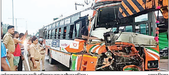
दुर्घटनास्थल पर खड़ी क्षतिग्रस्त बस व मौजूद पुलिस।