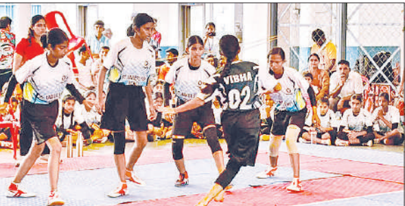
कबड्डी में प्रतियोगिता में भाग लेते खिलाड़ी।