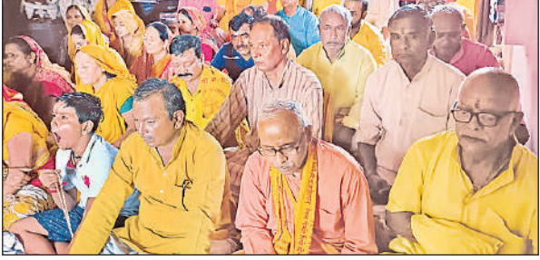
गायत्री शक्तिपीठ अमेठी में जप अनुष्ठान करते साधक।