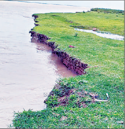
कटान करती घाघरा नदी।