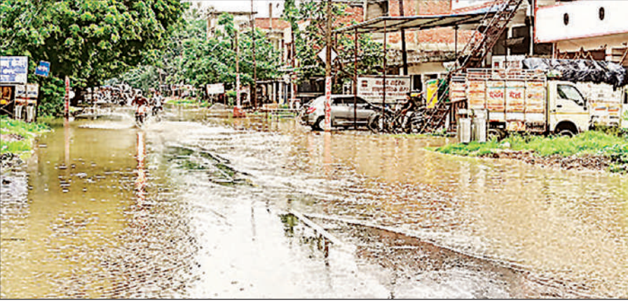
झमाझम बरसात के बाद सलोन कस्बे में एसडीएम कोर्ट के समीप सड़क पर जलभराव।

राजमार्ग के अंडरपास में घुटनों तक पानी: बरसात के कारण लखनऊ प्रयागराज राजमार्ग में बने अंदर पास पूरी तरह पानी में डूब गए हैं। हाल ही में बनाए गए इन अंडर पास में जलनिकासी की ठीक से व्यवस्था नहीं की गई। यहां पर अत्यधिक ढलान होने के कारण पानी एकत्र हो रहा है। क्षेत्र के सवैया तिराहा, बटौही होटल, पिपरहा आदि अंडर पास से आवागमन पूरी तरह बंद हो चुका है। उधर नगर के रेलवे क्रासिंग के पास ओवर ब्रिज के नीचे सर्विस रोड पर नाली का निर्माण न होने पर पूरी सड़क पानी में डूबी हुई है। इस सड़क पर बड़े बड़े गट्टे हो गए हैं।