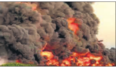
रूस के सोची में तेल डिपो से उठते धुएं के गुबार।