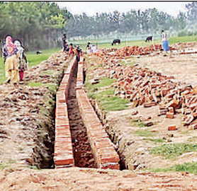
मुख्य मार्ग के किनारे होता नाला निर्माण कार्य।