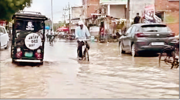
शिवगढ़ में हो रही बारिश में निकलते लोग।