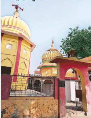
सांडी स्थित बाबा कमलेश्वर नाथ महादेव मंदिर व मंदिर में स्थापित शिवलिंग।

अमृत विचार। जिले के कस्बे में स्थित बाबा कमलेश्वर नाथ महादेव मंदिर एक प्राचीन मंदिर है, जो स्थानीय लोगों की गहरी आस्था का केंद्र है। मंदिर के इतिहास के बारे में कई मान्यताएं प्रचलित हैं। एक मान्यता के अनुसार भगवान राम जब शिव भक्ति में लीन थे तो उन्होंने शिव को एक कमल चढ़ाने का संकल्प लिया था। शिव ने उनकी परीक्षा लेने के लिए एक कमल छिपा दिया। कमल न मिलने पर भगवान राम ने अपनी एक आंख निकालकर शिव को अर्पित कर दी। इस पर