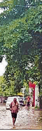
अमर सेनानी राना बेनी माधव प्रतिमा स्थल के पास भरा पानी।