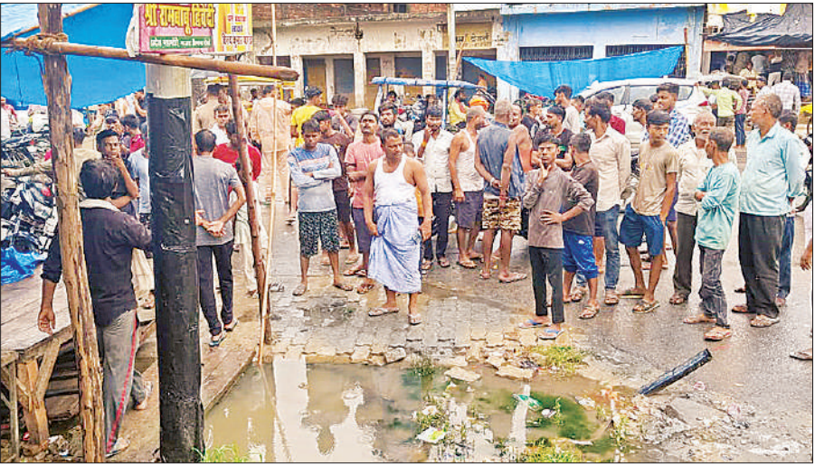
हादसे के बाद मौके पर लगी स्थानीय लोगों की भीड़।