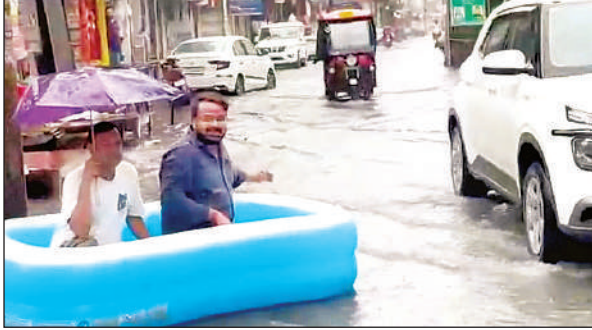
जलभराव पर टब में बैठकर आनंद लेते लोग।