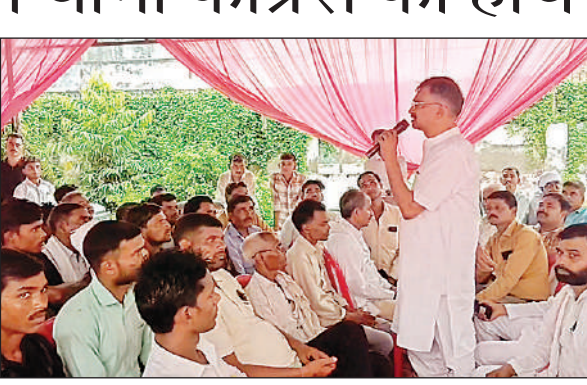
सभा को संबोधित करते सांसद राकेश राठौर।

अमृत विचार : सांसद राकेश राठौर ने बताया कि रोहिणी आयोग की सिफारिशों को लागू कराने के लिए पूरे प्रदेश में विशेष अभियान चलाया जाएगा। इसकी शुरुआत 24 अगस्त को महोली में होने वाली रैली से होगी, जिसमें प्रदेश अध्यक्ष अजय राय भी शामिल रहेंगे। कांग्रेस जिलाध्यक्ष