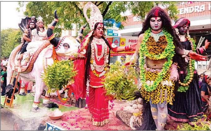
कांवड़ में जल भरकर जलाभिषेक को जाते श्रद्धालु।

को सुबह से ही कांवड़ में जल भरने के लिए निकलना शुरू हो गया। शोभायात्रा में सजी सुंदर झांकियों के साथ डीजे पर थिरकते श्रद्धालु शिव शंकर के गीतों से पर झूमते हुए पवित्र गंगा नदी पर जल लेने के लिए पहुंचे। रविवार सुबह से ही सारा माहौल शिव के गीतों से गुंजायमान हो गया। राजघाट से निकली शोभायात्रा नगर के विभिन्न मंदिरों के लिए रवाना की गई। हरदोई- बिलग्राम मार्ग पर कांवड़ियों के भोजन व जलपान के लिए श्रद्धालुओं जगह-जगह व्यवस्थाएं की। कांवड़ यात्रा की सुरक्षा को लेकर पुलिस प्रशासन भी पूरी तरह मुस्तैद रहा। रविवार को कांवड़िए पवित्र गंगा नदी से जल लेकर सावन के अंतिम सोमवार को शिव मंदिरों में जलाभिषेक करेंगे। पूरे दिन रविवार को उत्साह का माहौल नजर आया।