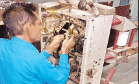
फाल्ट के बाद विद्युत व्यवस्था को दुरुस्त करता विद्युतकर्मी।