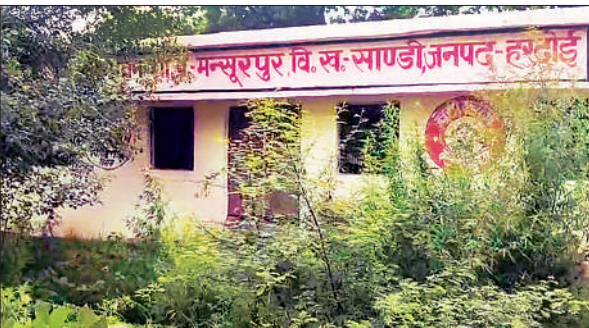
बदहाल ग्राम पंचायत भवन।

जानकारी के अनुसार साण्डी ब्लॉक के मंसूरापुर ग्राम पंचायत में बना पंचायत घर सिर्फ शोपीस बनकर रह गया है। पंचायत