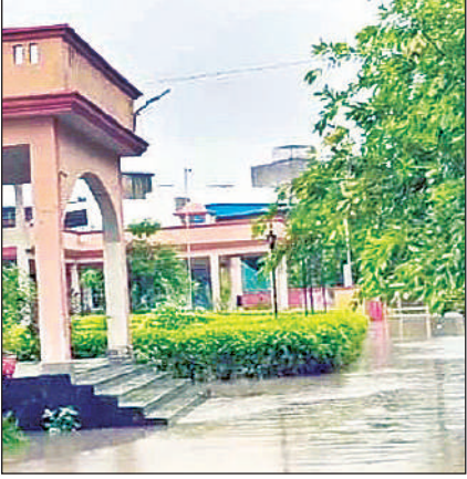
तहसील परिसर में भरा पानी।