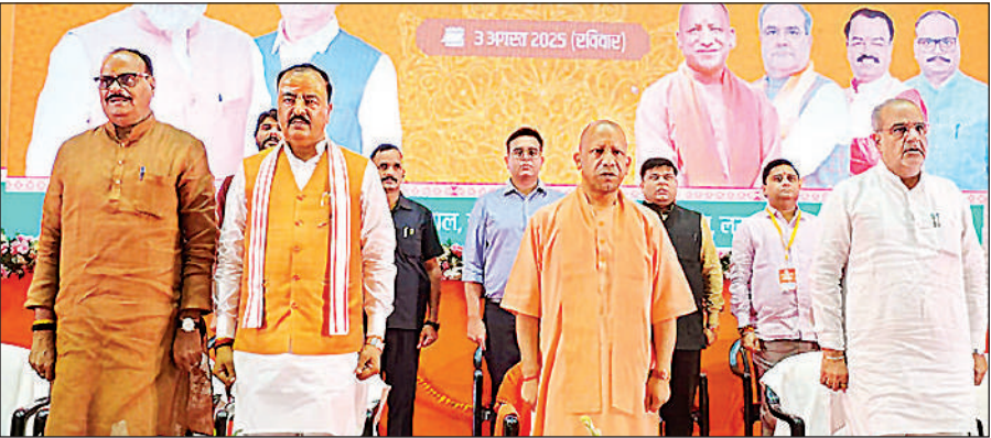
भाजपा की संगठनात्मक बैठक में उपस्थित मुख्यमंत्री योगी, प्रदेश अध्यक्ष भूपेंद्र सिंह चौधरी, उप मुख्यमंत्री केशव मौर्य व ब्रजेश पादक ।

अमृत विचार : मुख्यमंत्री योगी आदित्यनाथ ने कहा कि हर घर तिरंगा अभियान केवल झंडा फहराने का आयोजन नहीं, बल्कि जन-जन में राष्ट्रभक्ति की भावना को जागृत करने का जनांदोलन है। प्रधानमंत्री मोदी के मार्गदर्शन में लगातार चौथी बार अभियान शुरू हुआ है और इसने राष्ट्र चेतना को सशक्त अभिव्यक्ति दी है। उन्होंने हर हाथ में स्वदेशी उत्पाद का मंत्र और आत्मनिर्भर भारत की भावना को जमीन पर उतारने का भी आह्वान किया। मुख्यमंत्री रविवार को इंदिरा गांधी प्रतिष्ठान में आयोजित भाजपा की संगठनात्मक बैठक में बोल रहे थे। उन्होंने कार्यकर्ताओं से आह्वान किया कि वे अभियान से जुड़कर अपने-