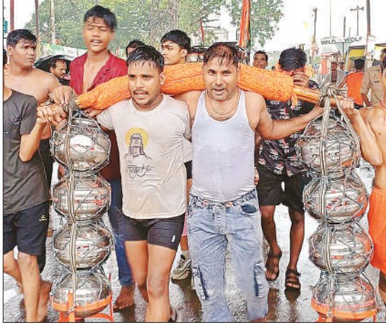
कांवड़ में जल भरकर जलाभिषेक को जाते श्रद्धालु।

अमृत विचार। सावन के आखिरी सोमवार पर अपने आराध्य को जल अर्पित करने के लिए रविवार को भारी संख्या में कांवड़िये गंगा नदी से जल लेने के लिए निकले। बरसात भी कांवड़ियों के हौसलों को कम न कर सकी। गल्ला मंडी स्थित नीलकंठेश्वर महादेव मंदिर से मंडी के व्यापारियों ने विशाल कांवड़ यात्रा निकाली। जिसमें सजी झांकियों ने लोगों का मन मोह लिया। बरसात के बावजूद श्रद्धालु सड़क के दोनों ओर इन मनमोहक झांकियों का दर्शन करने के लिए खड़े रहे। बिलग्राम स्थित राजघाट पर कांवड़ियों की भीड़ रही। शोभा यात्रा के साथ झूमते गाते कांवड़ियों का जगह-जगह लोगों ने पुष्प वर्षा कर स्वागत किया। भोजन- जलपान के साथ कांवड़ियों के विश्राम की भी जगह-जगह व्यवस्था की गई। मंडी से निकाली गई शोभायात्रा में भगवान की अनेक लीलाओं को झांकियों के रूप में प्रस्तुत किया गया। भोले के भक्ति गीतों पर झूमते हुए बरसात में कांवड़ यात्रा में शामिल हुए। सावन के अंतिम सोमवार पर शिवालियों में जलाभिषेक करने के लिए शिव भक्तों का समूह रविवार