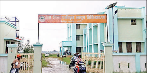
बेनीपुर स्थित 50 बेड वाला एकीकृत आयुष चिकित्सालय।