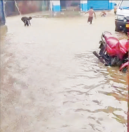
सड़क पर भरे बारिश के पानी के बीच मस्ती करते बच्चे।

वहीं बिसवां, तंबौर, महमूदाबाद, लोखरियापुर, छावनी, कटरा, काजीटोला, इंदिरा नगर सहित अन्य क्षेत्रों में भी नगर पालिका व