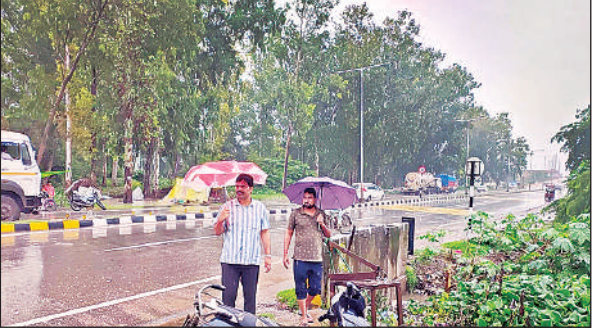
जलनिकासी की व्यवस्था को देखते अधिशासी अधिकारी।