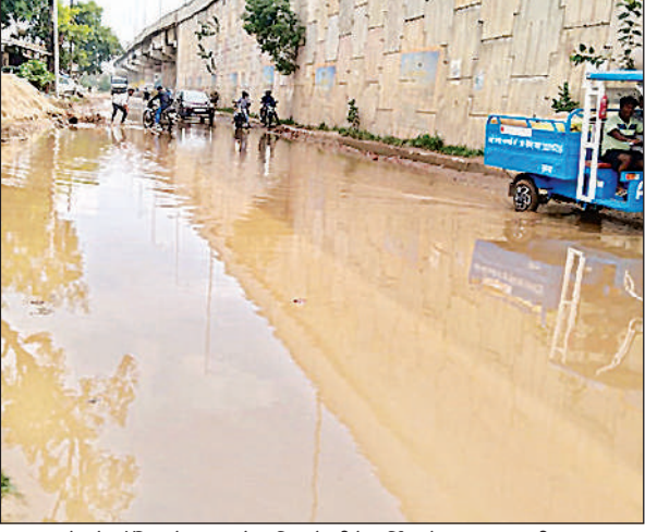
ऊंचाहार रेलवे क्रासिंग के पास ओवरब्रिज के नीचे सर्विस रोड पर भरा पानी।