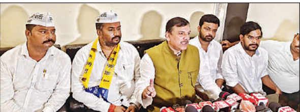
पत्रकार वार्ता करते राज्यसभा सांसद संजय सिंह।

बाद में आयोजित पत्रकार वार्ता में संजय सिंह ने कहा कि आम आदमी पार्टी उत्तर प्रदेश में शिक्षा,