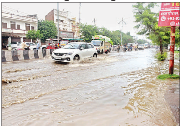
बरसात के दौरान सड़क से गुजरते वाहन।

रामसनेहीघाट, बाराबंकी, अमृत विचार : कोतवाली पुलिस ने अवैध खनन के खिलाफ अभियान के तहत बड़ी कार्रवाई की है। रविवार को पुलिस ने लखनऊ-अयोध्या राष्ट्रीय राजमार्ग पर बड़ेला नारायणपुर के पास मिट्टी लदे एक डंपर को पकड़कर सीज कर दिया। पुलिस के अनुसार, चालक से जब मिट्टी ढोने की अनुमति और वाहन से संबंधित दस्तावेज मांगे गए, तो वह कोई कागजात नहीं दिखा सका।