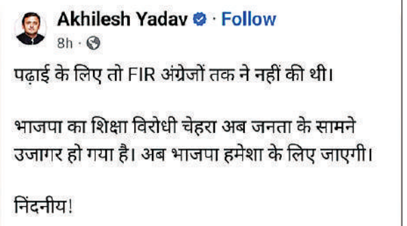
सोशल मीडिया पर सपा मुखिया अखिलेश यादव द्वारा की गई पोस्ट।