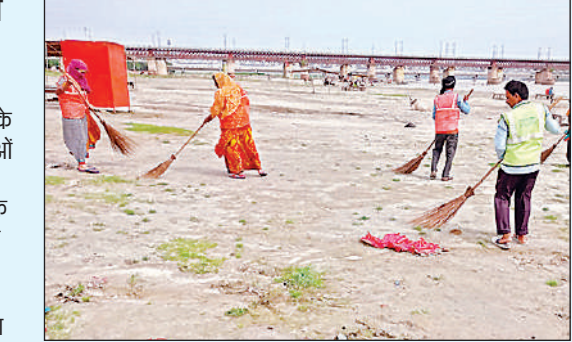
घाटों की साफ- सफाई करते पालिका के सफाई कर्मी।

आवागमन में काफी परेशानियों का सामना करना पड़ा। वहीं श्री