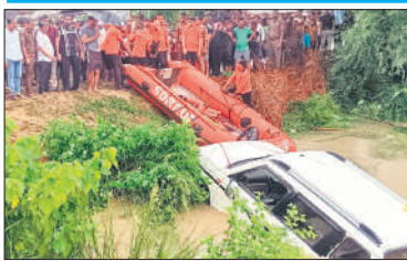
हादसे के बाद रेस्क्यू करती पुलिस व ग्रामीण।

● बोलेरो में सवार थे कुल 16 लोग आठ वर्षीय बच्ची लापता