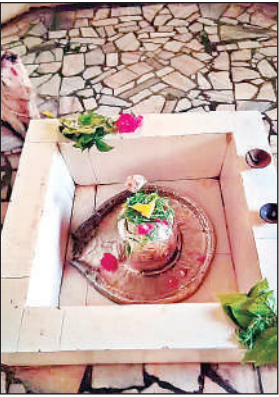
कारण इस मंदिर का नाम कमलेश्वर महादेव पड़ा।

प्रसन्न होकर शिव ने उन्हें दर्शन दिए और कमल भी लौटा दिया। इसी