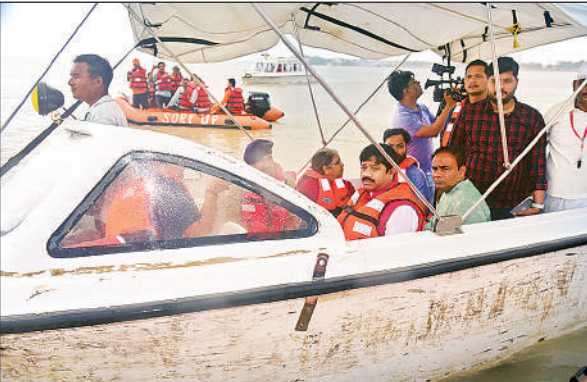
बाढ़ क्षेत्र का निरीक्षण करते कैबिनेट मंत्री नंद गोपाल गुप्ता नंदी।