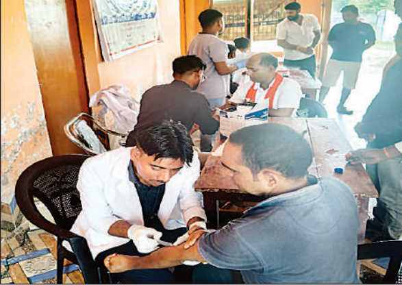
मरीजों का परीक्षण करती स्वास्थ्य विभाग की टीम।

गौरतलब है कि स्वास्थ्य विभाग की ओर से दो बार कैंप लगाकर कुल 436 लोगों की जांच की गई थी, जिसमें 28 लोग हेपेटाइटिस-बी और 68 लोग हेपेटाइटिस-सी पॉजिटिव पाए गए थे। इसके बाद सभी के सैंपल केजीएमयू लखनऊ भेजे गए, लेकिन अब तक रिपोर्ट नहीं आई है। इस बीच, संक्रमितों के