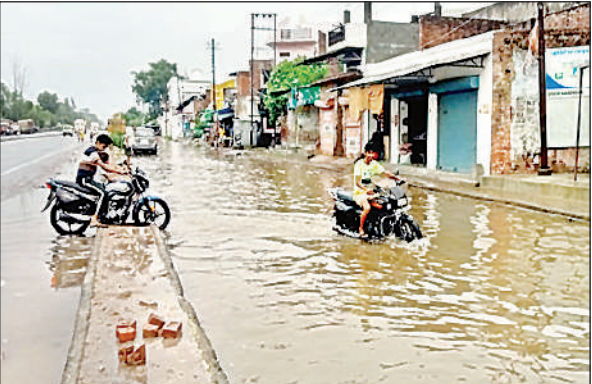
मुख्य मार्ग से सटा सर्विस लेन पर भरे पानी से जाते गाहगीर।