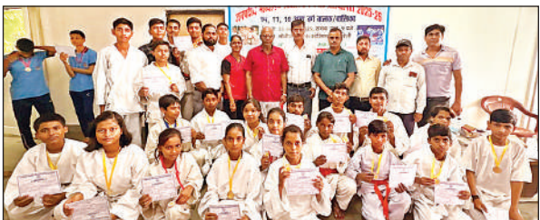
जनपदीय समिति विद्यालयीय कराटे प्रतियोगिता के विजेता खिलाड़ी व अन्य।

संवाददाता, रायबरेली,अमृत विचार। मोतीलाल नेहरू स्टेडियम में जनपदीय समिति विद्यालयीय कराटे प्रतियोगिता का आयोजन किया गया। इसमें गहात्मा गांधी इंटर कालेज, श्री गांधी इंटर कालेज बछरावां, राजकीय बालिका इंटर कालेज बछरावां, हरनारायण इंटर कालेज ऊंचाहार, सरस्वती इंटर कालेज ऊर्जा बिहार एनटीपीसी, सम्राट अशोक इंटर कालेज पुरवार, पूर्व माध्यमिक विद्यालय ऊंचाहार, महात्मा इंटर कालेज गगौली के खिलाड़ियों ने प्रतिभाग किया। इसमें 26 खिलाड़ियों ने गोल्ड मेडल जीते। ये सभी खिलाड़ी 7 अगस्त को लखनऊ में आयोजित होने वाली मण्डलीय प्रतियोगिता में रायबरेली का प्रतिनिधित्व करेंगे।