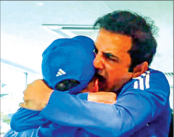
मुख्य कोच गौतम गंभीर ने ओवल में इंग्लैंड के खिलाफ पांचवें टेस्ट मैच में जीत के बाद अपने स्टाफ सदस्यों के साथ जमकर जश्न मनाया।

● कार्यभार प्रबंधन के अधिकार पर गौर कर सकता है बीसीसीआई मायने नहीं है कि कार्यभार प्रबंधन पर ध्यान नहीं दिया जायेगा। तेज गेंदबाजों का कार्यभार प्रबंधन जरूरी है लेकिन इसकी आड़ में खिलाड़ी अहम मैचों से बाहर नहीं रह सकते हैं। इंग्लैंड के खिलाफ मोहम्मद सिराज ने पांच टेस्ट में 185 . 3 ओवर डाले जिसके अलावा नेट्स पर गेंदबाजी और फील्डिंग अलग