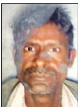
ने शव को कब्जे में लेते हुए आत्महत्या करने की वजह का पता लगाने के लिए पूछताछ करने लगी। उसका कहना है कि जांच की जा रही है।