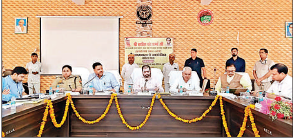
समीक्षा बैठक करते प्रभारी मंत्री ।