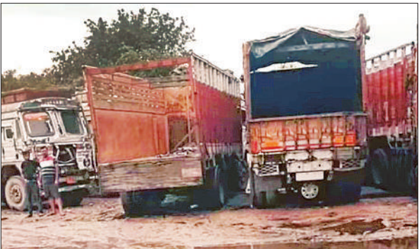
माल गोदाम पर बारिश में हुआ जलभराव व आड़े तिरछे खड़े ट्रक।

जानकारी के अनुसार माल गोदाम जाने वाले मार्ग पर बारिश में जल भराव रहता है। स्थानीय लोगों के साथ आने जाने वाले वाहनों को भी समस्या होती है। चारों ओर जल भराव और कीचड़ ही नजर आ