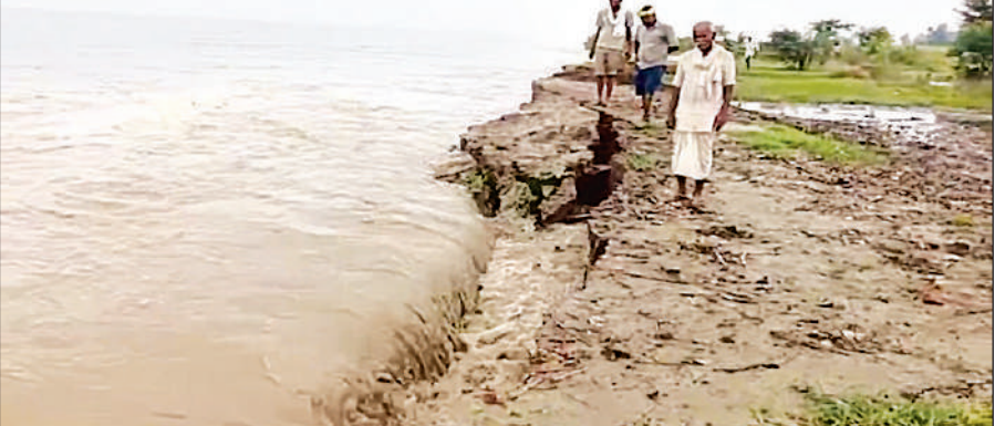
रामरूप पुरवा में कटान करती घाघरा नदी।