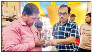
जांच करती खाद्य विभाग के अधिकारी।