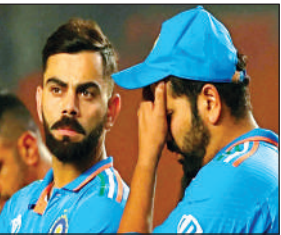
विराट कोहली व रोहित शर्मा।

बेंगलुरु, एजेंसी भारत का बेहद कड़े मुकाबले वाली एंडरसन-तेंदुलकर ट्रॉफी में इंग्लैंड को 2-2 से बराबरी पर रोकना टीम में शामिल नए क्रिकेटरों के आत्मविश्वास और देश तथा टीम के लिए अपना सब कुछ झोंकने की निडरता का जश्न था। मोहम्मद सिराज ने लगभग 200 ओवर गेंदबाजी की और अपने थके हुए शरीर को पांच टेस्ट मैच के दौरान अच्छी तरह संभाला। वाशिंगटन सुंदर कभी जिम्मेदारी से पीछे नहीं हटे। यशस्वी ने जरूरत पड़ने पर योगदान दिया, आकाश दीप और प्रसिद्ध कृष्णा प्रभावी नजर आए और साई सुदर्शन ने अपनी दीर्घकालिक उपयोगिता की झलक दिखाई। लेकिन इस शानदार प्रयास का एक और आयाम भी है। इससे सवाल उठता है कि टी20 और टेस्ट क्रिकेट से संन्यास लेने वाले विराट कोहली और रोहित शर्मा तथा चोटों से जूझने वाले जसप्रीत बुमराह जैसे सीनियर खिलाड़ियों का क्या होगा। कोहली 36 और रोहित 38 साल के हैं और ये दोनों संभवतः ऑस्ट्रेलिया में तीन मैच की एकदिवसीय श्रृंखला में तीन मैच की एकदिवसीय श्रृंखला में खेलेंगे। इसके बाद इन दोनों को जनवरी-जुलाई 2026 के बीच न्यूजीलैंड (स्वदेश) और इंग्लैंड (विदेश) के खिलाफ छह एकदिवसीय मैचों में खेलने का मौका मिलेगा। लेकिन