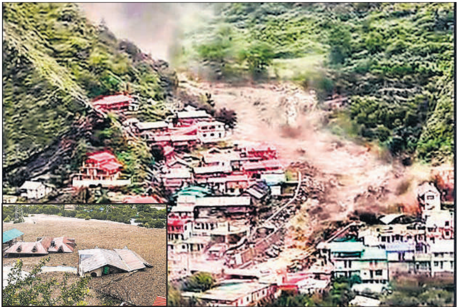
धराली में बादल फटने से अचानक आई बाढ़ में कई घर बह गए। इनसेट : कई भवन मलबे में पूरी तरह दब गए।

जिला आपातकालीन परिचालन केंद्र के अनुसार उत्तरकाशी जिले की भटवाड़ी तहसील में हर्षिल के नजदीक खीर गंगा में मंगलवार दोपहर 1:50 बजे के आसपास जलस्तर बढ़ने से धराली बाजार में भारी मलबा आ गया। कुछ ही मिनट में मलबा कई भवनों, होटलों एवं दुकानों को क्षतिग्रस्त कर गया। बाढ़