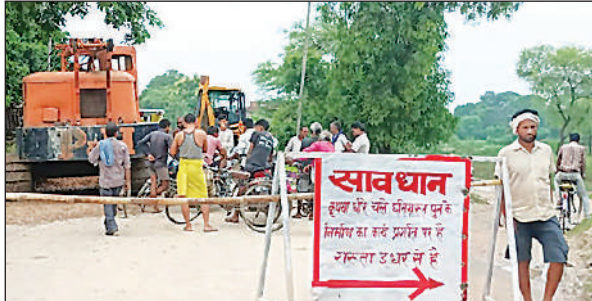
निर्माणाधीन पुल से आवागमन बाधित होने पर कार्य में लगे लोग।