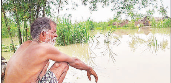
टेपरा गांव पहुंचे बाढ़ के पानी को निहारता ग्रामीण।