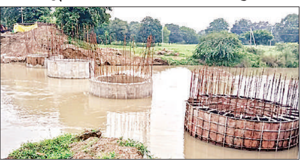
कैर गांव के पास निर्माणाधीन पुल में भरा पानी।

आठ घंटे तक बिना रुके कर सकेगा काम : रोबोट को 2 से 3