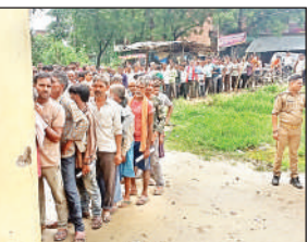
साधन सहकारी समिति सेमरवा में लगी किसानों की लंबी लाइन।