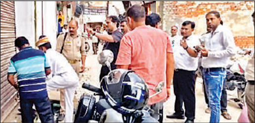
एसडीएम की मौजूदगी में चाणक्यपुरी स्थित गोदाम को सील करती संयुक्त टीम।

मंगलवार को दोपहर बाद औषधि विभाग की तीन सदस्यीय टीम ने अमेठी पहुंचकर गांधी चौक के पास