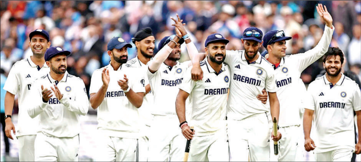
इंग्लैंड के खिलाफ पांचवां व अंतिम मैच जीतने के बाद जश्न मनाते भारतीय टीम के युवा खिलाड़ी।

गौतम गंभीर हमेशा से भारतीय क्रिकेट में मेगा स्टार संस्कृति के खिलाफ रहे हैं, लेकिन इंग्लैंड दौरे पर मोहम्मद सिराज के लगातार अच्छे प्रदर्शन से भारत के मुख्य कोच को अब अपने हिसाब से टीम कल्चर बनाने का मौका मिल गया है। इंग्लैंड से श्रृंखला 2-2 से ड्रां कराने के बाद गंभीर और चयन समिति के प्रमुख अजित अगरकर टीम में जरूर ऐसा माहौल बनाना चाहेंगे जिसमें सभी को बराबर माना जाए। समझा जाता है कि चयन समिति, गंभीर और भारतीय क्रिकेट के आला अधिकारी कार्यभार प्रबंधन के नाम पर खिलाड़ियों के मर्जी से मैच और श्रृंखला खेलने के चलन पर रोक लगाने को लेकर एकमत हैं। बीसीसीआई के एक सीनियर अधिकारी ने कहा इस पर बात हुई है और केंद्रीय अनुबंध प्राप्त खिलाड़ियों को बता दिया गया है, खास तौर पर उनको जो सभी प्रारूपों में नियमित खेलते हैं कि भविष्य में अपनी मर्जी से मैच चुनने का कल्चर नहीं चलेगा। उन्होंने कहा इसके यह