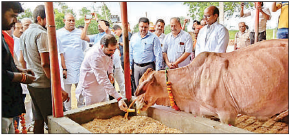
गौशाला में गाय को कैला खिलाते प्रभारी मंत्री ।