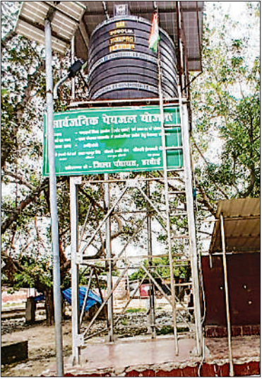
पौराणिक मंदिर पर लगी पानी टंकी।