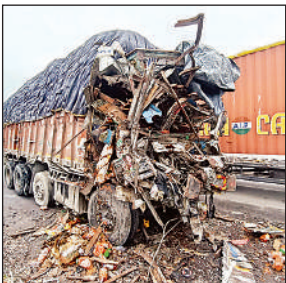
हादसे में ट्रक के उड़े परखचे।