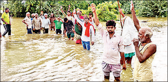
हलोर-अछई सम्पर्क मार्ग पर जलभराव, पानी में खड़े होकर आक्रोश जताते ग्रामीण।

गौरतलब हो कि क्षेत्र के हलोर-अछई सम्पर्क मार्ग पर पूरे दीना मजरे सीवन के पास बने नैय्या नाले के संकरे पुल को तोड़कर नये पुल का निर्माण कराया जा रहा है। पीडब्ल्यूडी द्वारा आवागमन के लिए अस्थायी बाईपास बनवाया गया। इस बीच तेज बारिश अस्थायी बाईपास पानी के तेज बहाव में बह गया। जिससे सम्पर्क मार्ग पूरी तरह जलमग्न होकर बंद हो गया है। यही नहीं, हजारों बीघे खेत में लगाई गई धान की फसल पानी में डूब गई है। इससे आक्रोशित किसानों और ग्रामीणों ने पीडब्ल्यूडी के खिलाफ