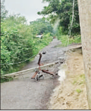
केतनापुर देवगांव मार्ग पर टूट कर गिरा पोल।