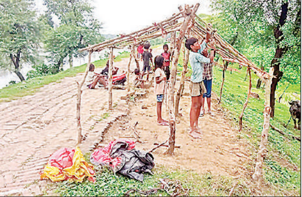
बांध पर बनाया जा रहा आशियाना।

में पानी भरने से लोगों का घरों से निकलना मुश्किल हो गया है। देर शाम कुछ देर तक थमी बारिश के बाद लोग निजी संसाधनों से घर और प्रतिष्ठानों में भरे पानी को निकलते नजर आए।