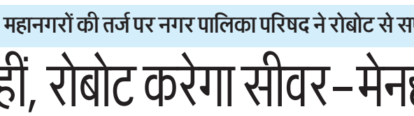
रोबोट के माध्यम से सीवर के मेनहोल से मलबा निकालते पालिका कर्म।

के साथ धान की फसल भी पानी में डूब गई है। उपजिलाधिकारी सचिन यादव ने बताया कि राजस्व टीम के साथ व्यवस्थाओं का जायजा लिया जाएगा । गांव वालों की सुविधा के लिए आवश्यक प्रयास किए जा रहे हैं।