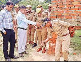
जानवर के पदचिह्नों का निशान देखती पुलिस और वन विभाग की टीम।