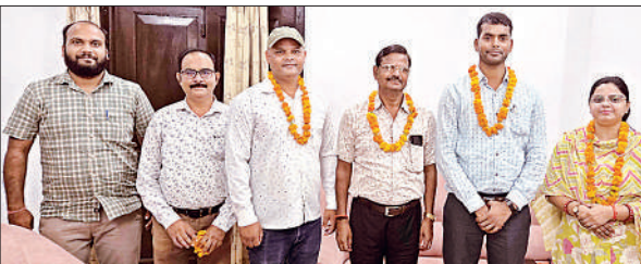
नव निर्वाचित कार्यकारिणी के सदस्य।