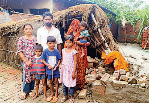
दामोदर खेड़ा वार्ड नम्बर एक मनऊ खेड़ा में गिरी झोपड़ी, माता-पिता के साथ खड़े बच्चे।

मौसम भी साथ नही दे रहा है। किसी दूसरी तरकीब से सर्विस लेन दुरस्त करने की व्यवस्था की जाएगी।