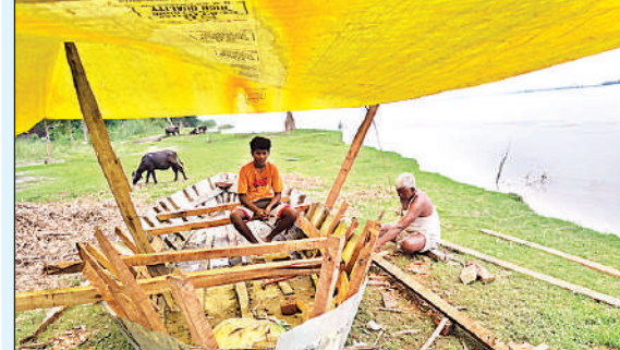
पलायन के लिये तेलवारी गांव में नाव तैयार करता ग्रामीण।