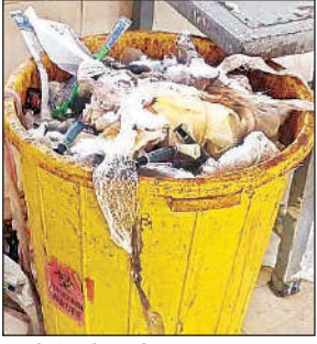
गंदगी से भरी बाल्टी।