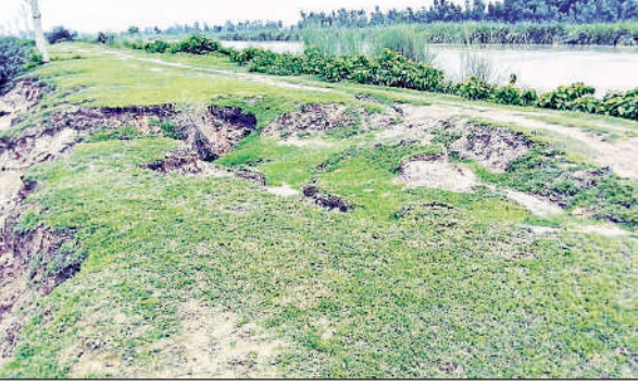
शारदा नहर की धंसी पटरी।