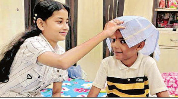
भाई को तिलक लगाती बहन ।

अमृत विचार । श्रावण मास की शुक्ल पक्ष पूर्णिमा तिथि को रक्षाबंधन का पर्व मनाया जाता है। जिले में रक्षाबंधन का पर शनिवार को हर्षोल्लास के साथ मनाया गया। शहर से लेकर ग्रामीण अंचलों तक लोगों में रक्षाबंधन को लेकर उत्साह देखने को मिला। बहनें अपने भाइयों की कलाई पर राखी बांधने के लिए सुबह से ही बाइक के अलावा बसों,टैपो,टैक्सी और ट्रेनों से निकलीं। वहीं भाई भी अपनी बहनों से राखी बंधवाने के लिए निकले। बहनों ने भाइयों के मस्तिष्क पर रोचना करके उनकी आरती उतारी, कलाई पर रक्षा सूत्र बांधा, मिठाई खिलाकर उनका मीठा कराया। भाइयों ने भी बहनों के पैर छूकर उनका आशीर्वाद लिया और उन्हें भेंट स्वरूप दान दक्षिणा व उपहार दिए। दिन भर मिठाइयों की दुकान ऊपर लोगों की भारी भीड़ दिखाई पड़ी। इस दौरान रोडवेज बस,निजी बसों