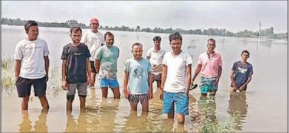
खेतों में पानी से डूबी धान की फसल में खड़े किसान।