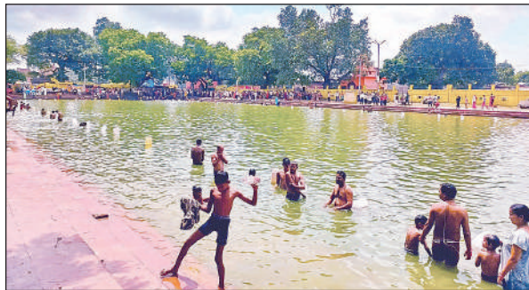
हत्याहरण तीर्थ में स्नान करते श्रद्धालु ।

अमृत विचार । विकास खंड कोथावां के अन्तर्गत पौराणिक हत्याहरण तीर्थ पर भाद्रपद मास के प्रत्येक रविवार को मेला लगाया जाता है, जिसका शुभारम्भ 10 अगस्त से हो गया। हत्याहरण तीर्थ में दूरदराज से आए श्रद्धालु भक्तों ने स्नान किया और पुरोहित को दान देकर परिवार की सलामती की दुआ मांगी। बताते चलें कि पौराणिक कथानक के अनुसार एक बार मां पार्वती शिवशंकर के साथ तपस्या करने आई थीं, मां पार्वती के झूठे जल से इस ब्रम्ह तीर्थ का उद्गम हुआ, जिसके बाद भगवान राम ने इस तीर्थ पर आकर स्नान कर गौ का दूध से किया, जिससे उन्हें ब्राम्हण हत्या से मुक्ति मिली। भाद्रपद मास के प्रथम