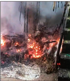
आग लगाए जाने के बाद जलता घर का छप्पर।