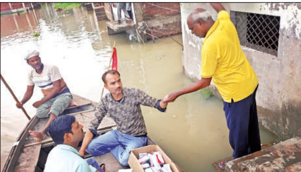
बाढ़ प्रभावित क्षेत्र में दवाएं वितरित करते स्वास्थ्य कर्मी। अमृत विचार