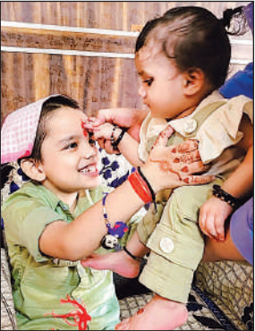
भाई को तिलक व राखी बांधकर अपना फल्ला रक्षाबंधन मनाती नन्ही बहन।

रामनगर क्षेत्र में बाढ़ के चलते विषैले जीव जन्तु-पानी से बचने के लिए जहां ऊंचे स्थानों व खुली जगहों की शरण ले रहे। वहीं पानी में रहने वाले जीव भी पानी से निकलकर खुले मैदान में आकर बैठ रहे जिससे लोगों को खतरा बना हुआ है। शनिवार की रात पुराने हाईवे पर चौकाघाट रेलवे क्रॉसिंग के निकट एक मगरमच्छ का बच्चा खुली हवा का आनंद लेने के लिए पानी से निकलकर मुख्य सड़क मार्ग पर बैठा दिखा, वह मार्ग से गुजरने वाले लोगों के लिए कौतूहल का विषय बना रहा।