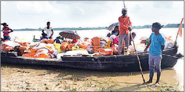
नाव पर गुनौली गांव में वितरण के लिएलादी गई सामग्री।

रामसनेहीघाट तहसील क्षेत्र में सरयू नदी का जलस्तर घट रहा है। सरयू का जलस्तर बढ़ने से बांध व नदी के बीच स्थित घर, खेत व स्कूल पानी से घिर गए थे। अब घटते जलस्तर ने ग्रामीणों की दुश्र्चारियां बढ़ा दी हैं। किसानों की सैकड़ों एकड़ धान की फसल जलमग्न है, वहीं न गांव सही दशा में हैं और न ही वापसी के रास्ते। नदी घटने के बावजूद सुरक्षित