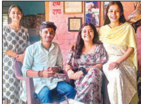
भाई की कलाई पर राखी बांधती बहन।