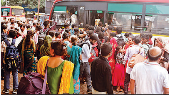
रोडवेज बस स्टॉप पर बस में चढ़ने के लिए जमा यात्रियों की भीड़।

अमृत विचार: रक्षाबंधन पर महिलाओं और बालिकाओं के लिए लापरू तीन दिन की मुफ्त यात्रा योजना का शनिवार को जमकर लाभ उठाया गया। सुबह से ही सीतापुर डिपो की 38 रोडवेज बसों में सवारियों की इतनी भीड़ रही कि कई यात्री खड़े होकर सफर करने को मजबूर हुए। दूरदराज से आने वाली बहनों की कलाई की कलाई राखी बांधने के लिए समय पर पहुंचने की कोशिश में वाहनों से रफ्तार पकड़ी, लेकिन ग्रामीण संपर्क मार्गों पर वाहनों की कमी ने परेशानी बढ़ा दी। कई जगह यात्री