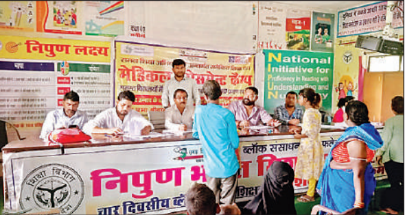
दियांग बच्चों को चिह्नित करती डॉक्टरों की टीम।