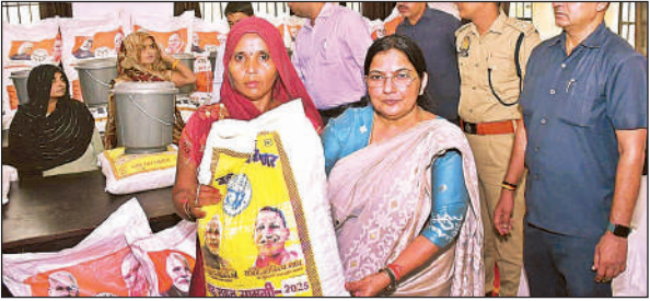
बाढ़ प्रभावित लोगों को राहत किट बांटती उच्च शिक्षा मंत्री रजनी तिवारी।