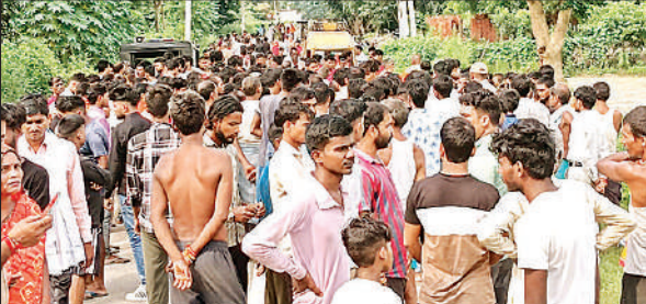
घटनास्थल पर एकत्रित परिजन और ग्रामीणों की भीड़।