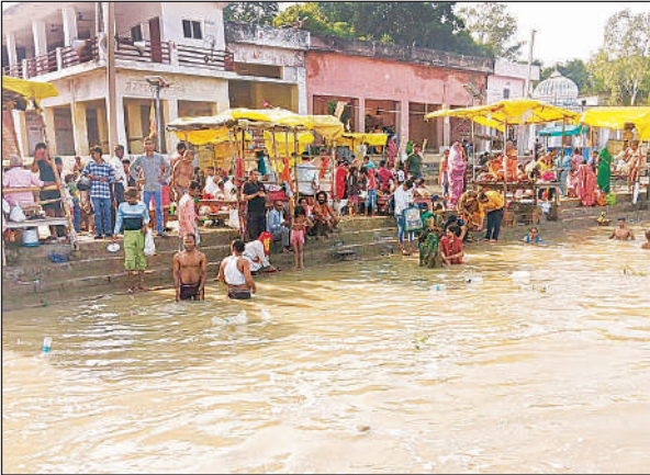
रविवार को गोकना गंगा घाट पर स्नान करते श्रद्धालु।

आम तौर पर रक्षाबंधन के दूसरे दिन भी श्रद्धालुओं की गंगा तट पर भीड़ उमड़ती है। इसका कारण यह है कि दूर दराज में ब्याही क्षेत्रीय बहन बेटियां रक्षा बंधन ने मायके आती है और वह गंगा स्नान करके अपनी ससुराल जाती है। इस बार रक्षा बंधन के दूसरे दिन भाद्रपक्ष का पहला रविवार था, इसलिए क्षेत्र के गंगा घाट पर भारी भीड़ उमड़ी और लाखों के संख्या में लोगों ने गंगा स्नान करके पूजा अर्चना की। रविवार की प्रातः करीब पांच बजे से शुरू हुआ स्नान का