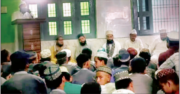
उर्स में मौजूद अकीदतमद ।