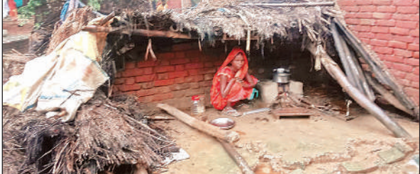
बोधी के पुरवा मजरे मनोहरगंज में बारिश में गिरा गरीब का आशियाना।