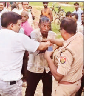
खुद पर डीजल छिड़ककर आग लगाने की कोशिश करता किसान।

● किसानों ने दिया धरना, पुलिस व पीएस ने संभाली स्थिति