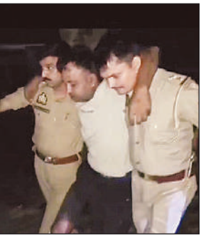
पुलिस मुठभेड़ में गोली लगने से घायल आरोपी।