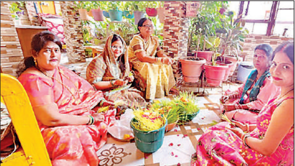
विधि-विधान से रक्षाबंधन की पूजा- अर्चना करती बहनें।

उन्हें राखी बांधी। मिठाई खिलाकर भाइयों की लंबी उम्र की कामना की। इस अवसर पर भाइयों ने भी बहनों को उपहार देकर जीवनभर उनकी रक्षा करने का संकल्प लिया। सोशल मीडिया भी रक्षाबंधन के रंग में रंगा दिखा। भाइयों और बहनों ने इस विशेष दिन को यादगार बनाने के लिए तस्वीरें और वीडियो साझा किए, जिससे पर्व की भावनाएं और अधिक व्यापक हो सकीं। जेल में बंद भाइयों की कलाई भी इस दिन सूनी नहीं रही। बाराबंकी जेल प्रशासन ने बहनों के आगमन के लिए विशेष व्यवस्था की। राज्यमंत्री को बांधी गई राखी: रामसनेहीघाट क्षेत्र अंतर्गत अटल मार्ग स्थित भिटरिया कार्यालय