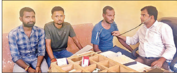
आरोग्य मेले में रोगी की जांच करते चिकित्सक।