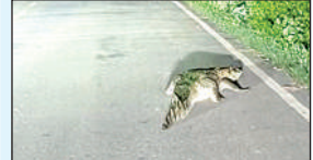
चौकाघाट रेलवे क्रॉसिंग के पास सड़क पर पहुंचा मगरमच्छ का बच्चा।।

और जनप्रतिनिधियों के समन्वय से प्रभावितों तक हरसंभव सहायता पहुंचाई जा रही है। वहीं इस दौरान एसडीएम अनुराग सिंह ने बताया कि प्रशासन की पूरी टीम राहत और बचाव कार्यों में दिन-रात लगी है। लक्ष्य है कि कोई भी प्रभावित परिवार बिना मदद के न रहे। हम जरूरत के अनुसार राशन, चिकित्सा, और सुरक्षित आश्रय की व्यवस्था लगातार कर रहे हैं।