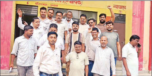
तहसील से बाहर निकलते सभासद ।

जिलाधिकारी ने अधिकारियों को निर्देशित किया कि आईजीआरएस सरकार की प्राथमिकताओं में है । इसकी गंभीरता को समझते हुए विशेष रुचि लेकर लंबित संदर्भों का निस्तारण गुणवत्तापूर्ण करें । उन्होंने कहा कि यह सुनिश्चित किया जाए कि डिफाल्टर होने से पहले ही संदर्भों का निस्तारण हो जाए । शिकायत के निस्तारण से शिकायतकर्ता संतुष्ट होना चाहिए ।