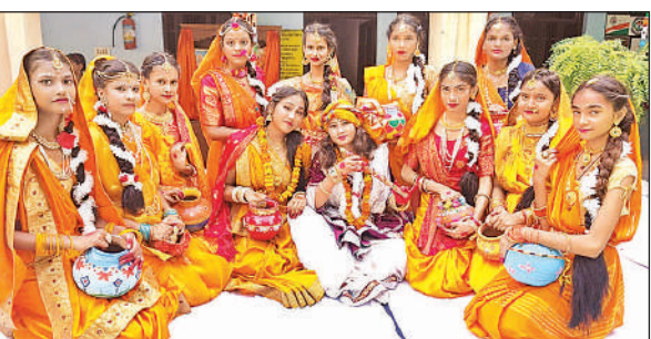
राधा कृष्ण की वेश भूषा में बैठे महते के छात्र ।