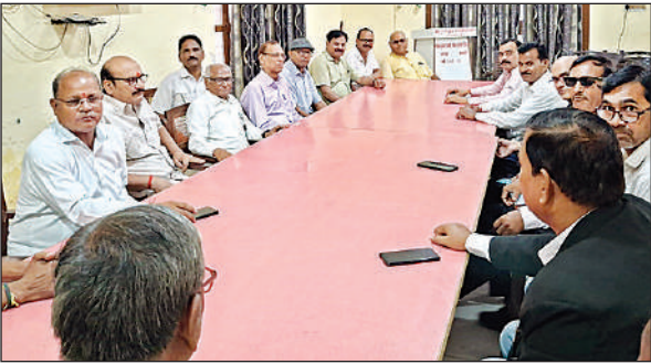
सेंट्रल बार एसोसिएशन के पुस्तकालय कक्ष में आयोजित कार्यक्रम में मौजूद लोग ।