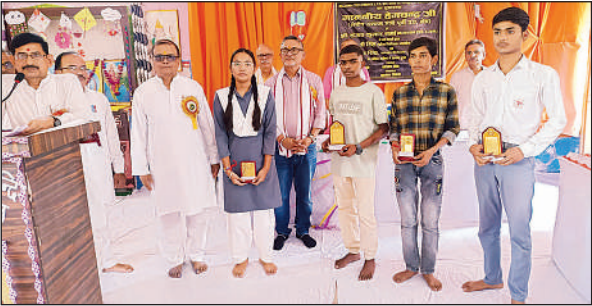
सम्मानित मेधावी छात्रों के साथ अतिथि ।