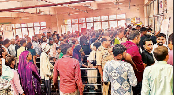
जिला चिकित्सालय के पंजीकरण काउंटर पर लगी मरीजों की भीड़ ।