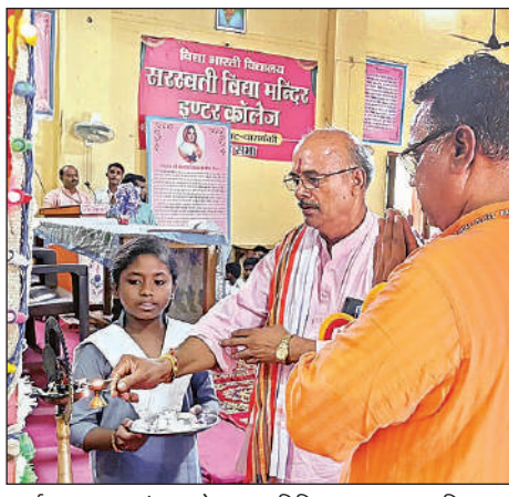
कार्यक्रम का शुभारंभ करते मुख्य अतिथि।

घटनाओं के खुलासे का दावा किया है। 14 अगस्त को थाना जैदपुर क्षेत्र में निर्माणाधीन आटामील मीरा एण्ड रज्जू इंटरप्राइज साईं इंटरट का जालेज के पास से चौकीदार को कमरे में बंद कर सामान लूट लिया गया था।