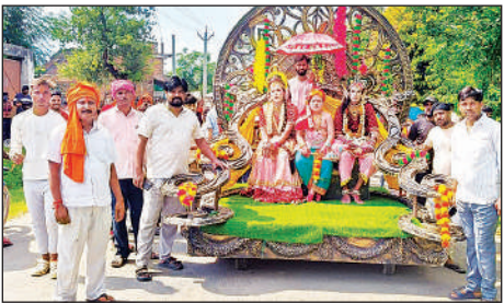
कन्हैया डोल में शामिल श्रद्धालु।