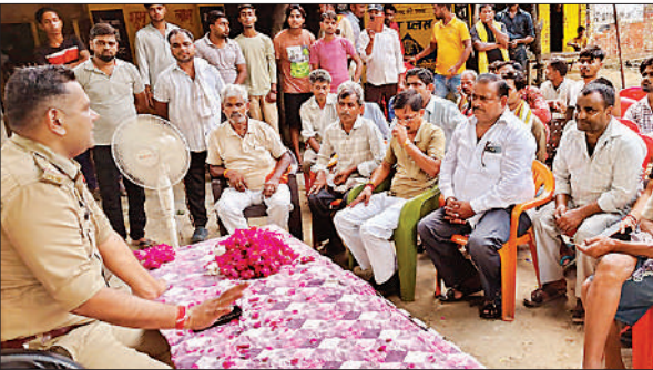
ग्राम सुरक्षा समिति की बैठक में मौजूद थाना प्रभारी व ग्रामीण।