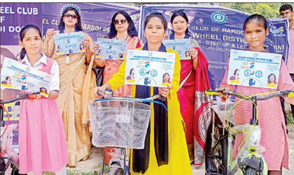
साइकिल के साथ छात्राएं।

इस अवसर पर हरदोई डीओडी की ओर से दो साइकिलें तथा शक्ति वाहिनी की ओर से एक साइकिल स्कूल जाने वाली छात्राओं को प्रदान की गई, जिससे उन्हें आने-