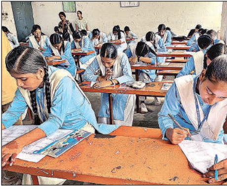
परीक्षा देती छात्राएं।