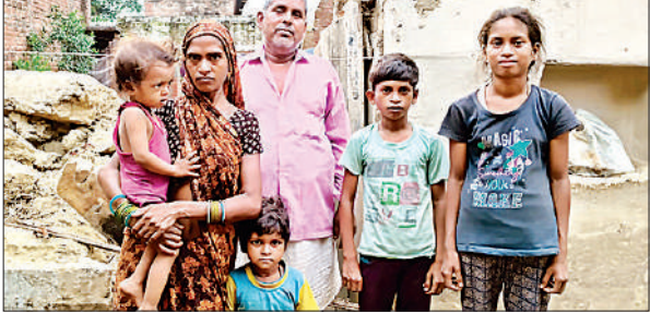
आवास के लिए गुहार लगाता पीड़ित परिवार।