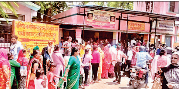
ओपीडी पर्चा बनवाने के लिए लगी मरीजों व तीमारदारों की लाइन।