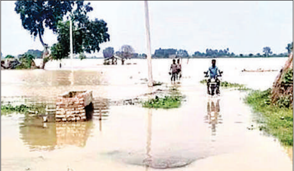
पानी में डूबे रास्ते से निकलते लोग।

सोमवार को गंगा नदी में हरिद्वार बैराज से 156015 क्यूसेक और नरौरा बैराज से 128716 क्यूसेक पानी छोड़ा गया है।गरां नदी में पीलीभीत के ड्यूनी बैराज से 15153 क्यूसेक पानी छोड़ा गया है। बाढ़ से प्रभावित लगभग 60 गांवों की करीब 25 हजार आबादी को दिक्कों का सामना करना पड़ रहा है। बाढ़ से प्रभावित गांवों में तहसील बिलग्राम के 11