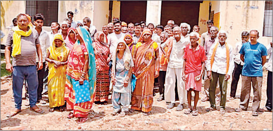
साधन सहकारी समिति बछौली में मौजूद किसान।