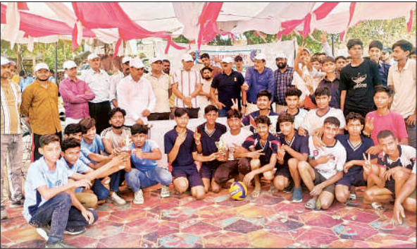
ट्राफियों के साथ विजेता और उपविजेता टीमों के खिलाड़ी।