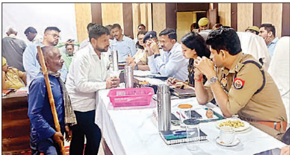
संपूर्ण समाधान दिवस में पीड़ितों की फरियाद सुनते डीएम-एसपी।

काउंटर से दवा लेने के लिए भी लोग घंटों लाइन में लगे रहे।