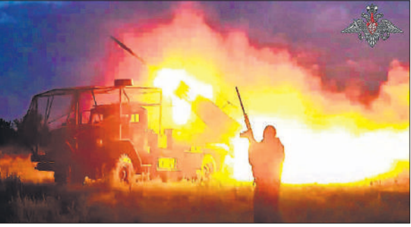
मल्टीपल रॉकेट लांचर से यूक्रेनी टिकानों पर फायर करती रूसी सेना।

ट्रंप ने क्रीमिया को वापस लेने की संभावना से भी इनकार किया। क्रीमिया 2014 में एक जनमत संग्रह के बाद रूसी संघ में शामिल हुआ था लेकिन पश्चिमी देश इसे स्वीकार नहीं करते। क्रीमिया के बारे में ट्रंप ने