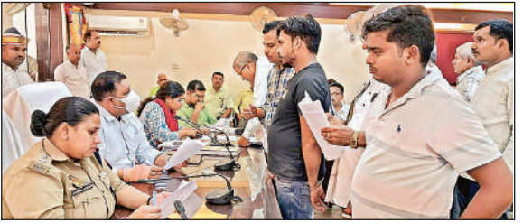
समाधान दिवस पर लोगों की शिकायतें सुनते डीएम और एसपी ।

ने आरोप लगाया कि जिला चिकित्सालय में भारी अव्यवस्था के चलते रोगी प्राइवेट डॉक्टरों से इलाज कराने को मजबूर हैं । इमरजेंसी वार्ड में बेड न होने के कारण मरीजों को फर्श पर लिटाया जाता है । पंजीकरण काउंटर पर स्टॉफ समय पर नहीं रहता और चिकित्सक समय से अपनी ओपीडी में नहीं बैठते ।