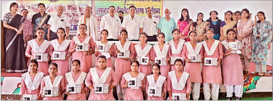
टैबलेट के साथ छात्र-छात्राएं व साथ में महाविद्यालय परिवार ।