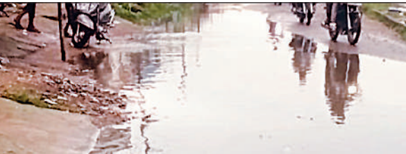
कमलापुर स्थित सर्विस लेन पर भरा पानी।