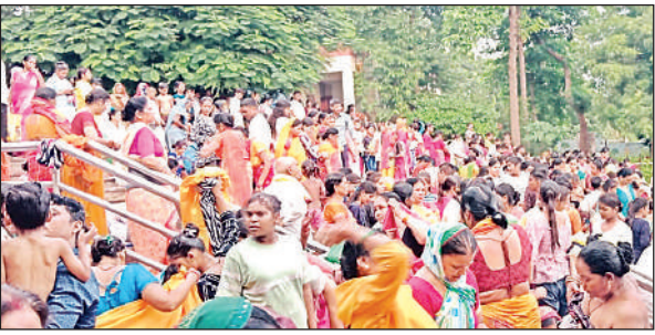
हरितालिका तीज पर नमामि गंगे घाट पर गंगा स्नान करती महिलाएं।

हिन्दू धर्म के अनुसार भाद्रपद मास के शुक्ल पक्ष की तृतीया तिथि को हरितालिका तीज का व्रत किया जाता है। यह व्रत महिला प्रधान है। इसी दिन महिलाएं पूरे दिन निर्जला व्रत रहकर अपने परिवार की सुख शान्ति तथा अखंड सौभाग्य के लिए भगवान से प्रार्थना करती हैं। व्रत करने वाले को शरीर के कष्ट सहना