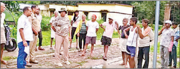
घटना के बाद जांच पड़ताल करती पुलिस।