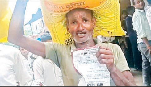
खाद के साथ जिंक लिए किसान।

अमृत विचार : जिंक लो, वरना खाद नहीं मिलेगी। दुकानदार के इस बोल के बाद किसानों ने जमकर हंगामा कर दिया। गनीमत रहा, पुलिस मौके पर पहुंच गई, इसी के बाद स्थितियां सामान्य हो सकीं। मामला विकास खण्ड क्षेत्र खैराबाद के अशरफपुर गांव का है। खैराबाद विकास खण्ड क्षेत्र के अशरफपुर गांव में एग्री जंक्शन वन स्टॉप को 150 बैग यूरिया की रैक मिली। बताते हैं कि रैक आने की खबर तेजी से आसपास गांव में पहुंच गई। बड़ी संख्या में ग्रामीण इकट्ठा हुए। किसानों ने लाइन लगाकर