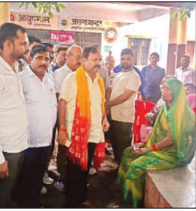
जन औषधि केंद्र के उद्घाटन के बाद लोगों से संवाद करते मिश्रिख सांसद अशोक रावत।

सांसद रावत ने कहा कि प्रधानमंत्री नरेंद्र मोदी के नेतृत्व में शुरू की गई यह योजना देशभर में गरीबों और मध्यमवर्गीय परिवारों के लिए राहत का कार्य कर रही है। उन्होंने कहा कि अब इलाज के खर्च