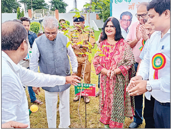
पौधरोपण करते वन राज्यमंत्री अरुण कुमार सक्सेना व अन्य।

वन राज्यमंत्री बाय-बैंक गारण्टी कार्यक्रम में शामिल होकर संबोधित कर रहे थे। उन्होंने कहा कि लखीमपुर, सीतापुर और पीलीभीत के कई स्थानों पर वन्य जीवों की संख्या अधिक है। यहां पर आमजन की सुरक्षा के लिए सौर ऊर्जा की मदद से जाल फेनसिंग लगाई जाएगी। मेगा प्लान तैयार है, इसकी मदद से ग्रामीण