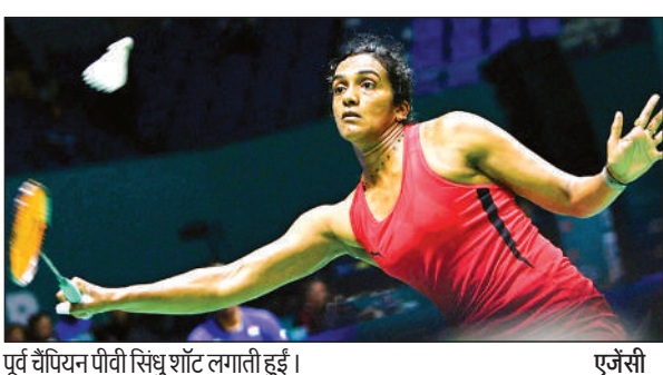
पूर्व चैंपियन पीवी सिंधु शॉट लगाती हुई।

■ प्रणय शुरुआत में थोड़ा पीछे हो गए, लेकिन जल्द ही उन्होंने अपनी लय हासिल कर ली और क्रॉस कोर्ट स्पेश से स्कोर 8-7 कर दिया। उन्होंने फोरेहैंड क्रॉस से स्कोर 10-8 किया और फिर सीधे स्पेश से दो अंकों की बढ़त बना ली। ओल्डॉर्फ ने हालांकि अच्छी वापसी करके स्कोर 16-16 से बराबर कर दिया। फिनलैंड के खिलाड़ी की लगातार गलतियों ने भारतीय खिलाड़ी को तीन गेम प्वाइंट दिला दिए।