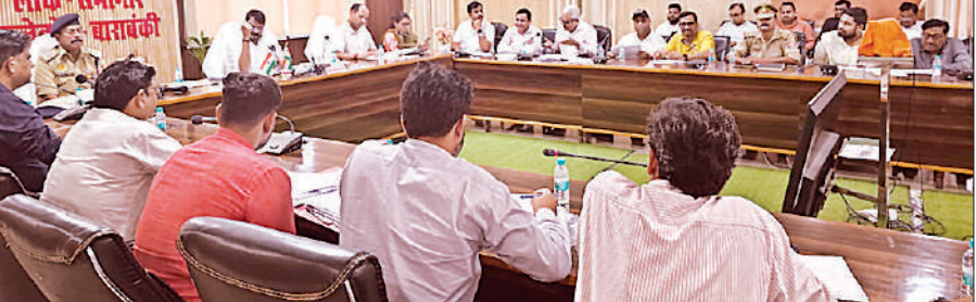
बैठक में मौजूद अधिकारी व व्यापारी।

अमृत विचार : लोक सभागार में मंगलवार को व्यापार बंधु, श्रम बंधु व जिला उद्योग बंधु की मासिक बैठक अपर जिलाधिकारी की अध्यक्षता में संपन्न हुई। बैठक में शहर की प्रमुख समस्याओं पर चर्चा हुई। व्यापारियों ने नाका सतरिख चौराहे से पल्हरी चौराहे तक डिवाइडर के बंद किए गए कटों को दोबारा खोलने की मांग की। अयोध्या नगर, कृष्णा नगर, अनाम मंडी व अंबेडकर छात्रावास के पास के कटों को आवश्यक बताते हुए कहा गया कि इनके बंद होने से