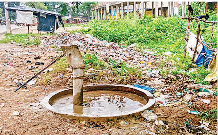
यह तस्वीर काजीकमालपुर चौराहे की है, जहां सड़क किनारे लगे इंडिया मार्का हैंडपंप के पास कूड़े का ढेर लगा है। हैंडपंप के चारों ओर गंदगी भी है। जिससे पानी प्रदूषित होने व संक्रमण फैलने का खतरा बना रहता है। इलाका वासियों ने इससे स्वच्छ और प्रयोज्य लायक बनाने की मांग की है।