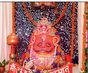
संकट मोचन हनुमान मंदिर में किया गया भव्य शृंगार।

अमृत विचार । भादौ माह के मंगल के अवसर पर नगर और ग्रामीण क्षेत्रों में स्थित हनुमान मंदिरों में बाबा का भव्य श्रंगार किया गया। इस दिन विशेष रूप से सुंदरकांड का आयोजन हुआ। भादौ के मंगल को लेकर सुबह से ही नगर में विभिन्न धार्मिक कार्यक्रमों की धूम मची रही। वहीं पोनी रोड तिराहे स्थित संकटमोचन हनुमान मंदिर में विशेष श्रंगार किया गया और बाबा के गुणगान के साथ भक्ति गीत प्रस्तुत किए गए। शाम को स्थानीय कलाकारों ने झांकी प्रस्तुत की, जिसमें मण्डलीय कलाकारों ने एक से बढ़कर एक भक्ति गीतों की प्रस्तुति दी। इस अवसर पर