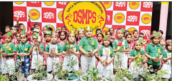
पौधरोपण के दौरान बेटे डीएसएम के बच्चे।