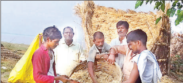
ग्रामीणों को भूसा वितरित करते राजस्वकर्मी।