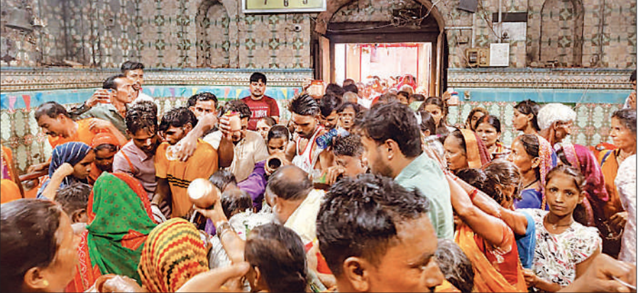
लोधेश्वर महादेवा मंदिर में जलाभिषेक करते श्रद्धालु।

अमृत विचार : लोधेश्वर महादेवा धाम में कजरी तीज पर शिवभक्तों का सैलाब उमड़ पड़ा। सोमवार रात से मंगलवार देर रात्रि तक चले पूजन-दर्शन के क्रम में करीब एक लाख से अधिक श्रद्धालुओं ने स्वयंभू शिवलिंग पर जलाभिषेक किया। अर्धरात्रि के बाद मंदिर के कपाट खुलते ही श्रद्धालुओं ने सबसे पहले श्री गणेश की पूजा कर शिवलिंग पर जल चढ़ाया। इसके बाद महिलाओं व कुंवारी कन्याओं ने मां गौरी का पूजन कर उन्हें श्रृंगार सामग्री अर्पित की। मेले में भगवा वस्त्रधारी कांवड़ियों के