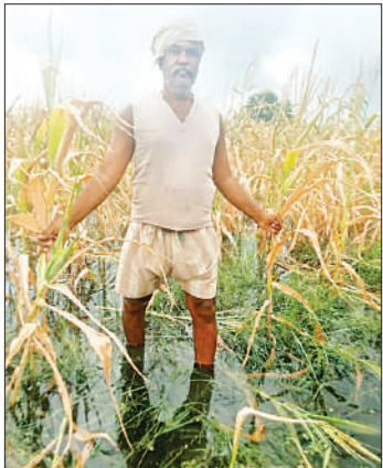
बाढ़ से बर्बाद हुई मक्का की फसल दिखाते किसान ।

अमृत विचार । अबकी बार धान, ज्वार, मक्का और मूंगफली की अच्छी पैदावार होगी तो जो लोगों से लिया-दिया है वो अदा हो जाएगा । साथ ही कुछ अपने लिए भी जोड़-बटोर कर रख लें, लेकिन क्या पता था कि इस बार की बारिश उनकी सारी उम्मीदों पर पानी फेर देगी । फत्तेपुर, जाहिदपुर, सिरौली और ठकुरी खेड़ा जैसे तमाम ऐसे गांव हैं जहां बरसात किसानों की बर्बादी लेकर आई । बुजुर्गों से सुना गया था कि सालों पहले ऐसी बाढ़ आई थी, जो सारा कुछ बर्बाद कर गई, इतने सालों बाद वही किस्सा अब हकीकत बन कर सामने है । आसाद के आते ही खेतों में हल चलने लगे, इस बार आबो-हवा को देखकर लग रहा था कि अच्छी पैदावार होगी । किसानों ने इधर-उधर से पैसा लेकर खेत में फसल लगाई थी । लेकिन ऐसी बाढ़ आई कि अपने साथ किसानों की सारी उम्मीदें अपने साथ बहा ले गई ।