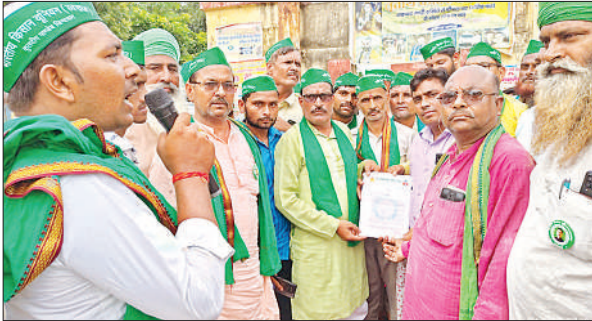
नायब तहसीलदार को ज्ञापन देते भारतीय किसान यूनियन के कार्यकर्ता ।

बल्कि पथरौली, बिरोली, बत्ती खेड़ा, कंजौरा गांव का हर कोई बाढ़ से बर्बाद हो गया है, अच्छी पैदावार का ख्वाब देखने वाली आंखों में सिर्फ और सिर्फ आंसू है ।