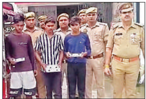
पुलिस की गिरफ्त में आरोपी।