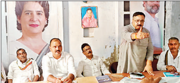
बैठक को संबोधित करते कांग्रेस के पदाधिकारी।

जिला प्रभारी ने कार्यकर्ताओं से कहा सजग प्रहरी की तरह आप सब गांवों में चल रहे पुनरीक्षण