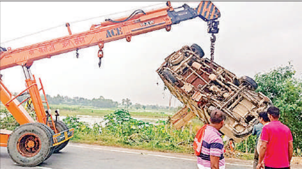
क्रेन से निकाला जाता हाफ डाला।