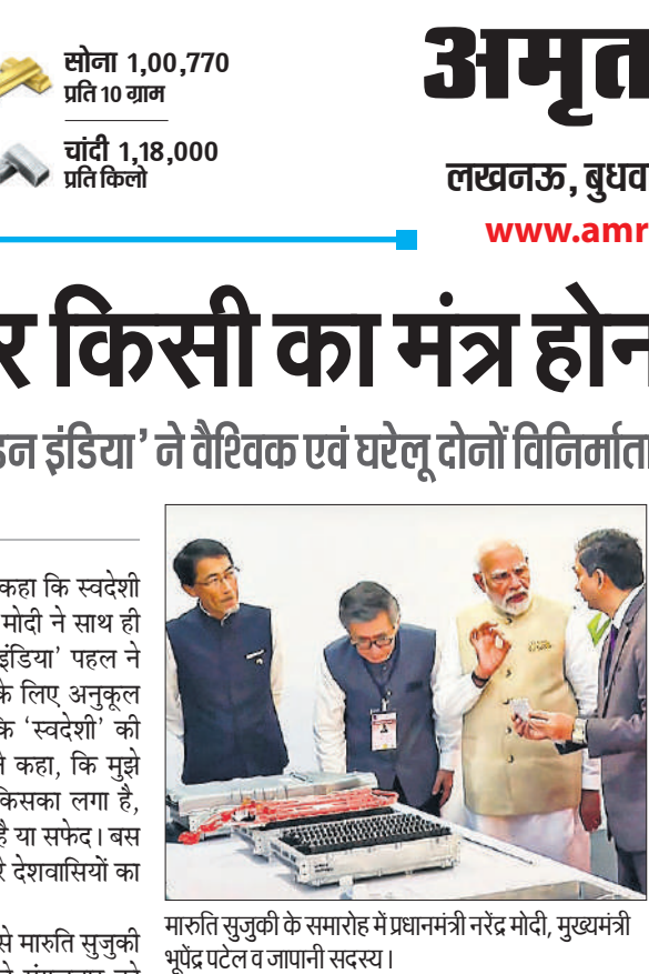
मारुति सुजुकी के समारोह में प्रधानमंत्री नरेंद्र मोदी, मुख्यमंत्री भूपेंद्र पटेल व जापानी सदस्य।

ग्रासिम ने वित्त वर्ष 2019- 20 और वित्त वर्ष 2024-25 के बीच पांच वर्षों में 67,000 करोड़ रुपये का पूंजीगत व्यय किया है। बिड़ला ने कहा कि इसमें से 51,000 करोड़ मुख्य क्षेत्रों के विकास, रणनीतिक निकटता, डिजिटल नवाचार और स्थिरता से जुड़ी परियोजनाओं के लिए निर्देशित किए गए, जिससे हमारे नेतृत्व को