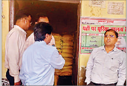
खाद वितरण केंद्रों का निरीक्षण करते प्रमुख सचिव ।

निगम और सहकारी संस्थाओं के प्रमुख अधिकारी उपस्थित रहे ।