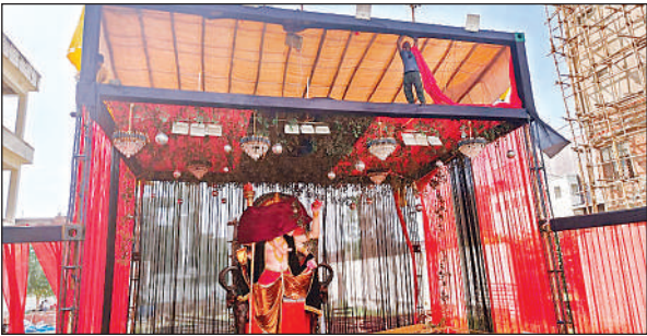
साकेतपुरी में तैयार होता पंडाल और वहां रखी गणपति की प्रतिमा।

इस अवसर पर नगर के मंदिरों, सोसाइटियों और घरों में भी गणेश प्रतिमाएं स्थापित की जाएंगी। श्री सिद्ध विनायक गणपति मंडल की ओर से साकेतपुरी नेहरू नगर में 27 अगस्त से 6 सितंबर तक गणेश महोत्सव मनाया जाएगा। वहीं अनंत चतुर्दशी के दिन प्रतिमाओं का विसर्जन किया जाएगा। कुछ श्रद्धालु नगर के बाहर गगनीखंडा झील के किनारे भी मूर्तियों का विसर्जन करेंगे। इसके अलावा श्री गणेश नवयुवक सेवा समिति की ओर से गायत्रीनगर में 29वां