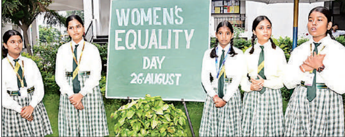
एनएसपीएस में आयोजित कार्यक्रम में शामिल बच्चे।