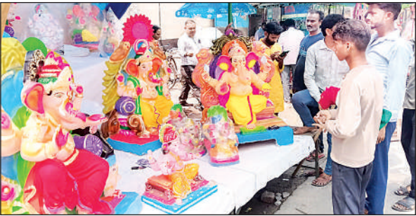
राजधानी मार्ग पर बप्पा की प्रतिमा खरीदते लोग।

किए जाएंगे। दूसरी ओर बाजारों में गणपति के प्रिय भोग मोदक की मांग बढ़ गई है। दुकानों पर चावल, गुड़, नारियल, पंजीरी और