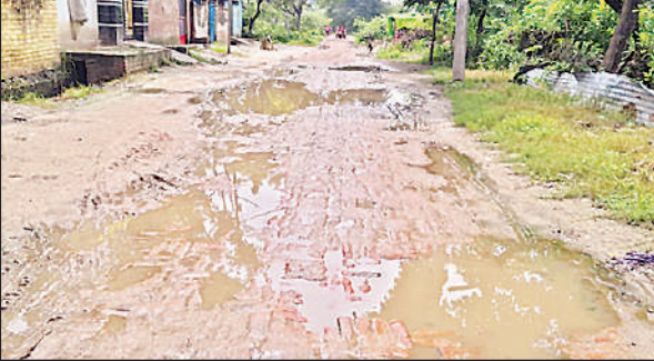
बदहाल बैती-पिपरी खड़जा संपर्क मार्ग।

अमृत विचार। क्षेत्र का बैती तकिया चौराहा वाया पिपरी खड़जा संपर्क मार्ग वर्षों से जर्जर एवं बदहाल होने से राहगीरों का चलना दुश्वार हो रहा है। इसी संपर्क मार्ग पर पूर्व माध्यमिक विद्यालय बैती, प्राथमिक विद्यालय बैती प्रथम और आंगनवाड़ी केंद्र होने के चलते छात्र-छात्राएं एवं राहगीर आए दिन दुर्घटना का शिकार होते रहते हैं। वहीं यह संपर्क मार्ग बैती, देहली, सूरजपुर, जगन्नाथपुर, पूरे तिलकराम, दुर्गा खेड़ा, गहोबर, निहाल खेड़ा आदि दर्जनों गांवों को बांदा-बहराइच करने से जोड़ने का सहाय ही सीधे नगर पंचायत शिवगढ़ को जाता है। शिवगढ़ कस्बे में