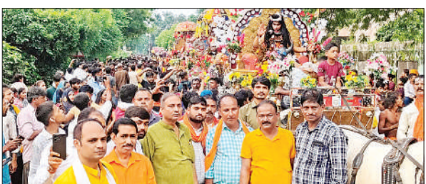
शिव बारात में शामिल श्रद्धालु।