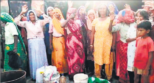
कच्ची शराब को लेकर प्रदर्शन करती महिलाएं।

शनिवार को अवैध कच्ची शराब के खिलाफ गांव दयावली खालसा की महिलाओं का गुस्सा फूट पड़ा। गांव की महिलाओं ने एकजुट होकर शराब बनाने वाले आधा दर्जन लोगों के घरों पर धावा बोला। मौके से बड़ी मात्रा में कच्ची शराब और उसे बनाने के उपकरण बरामद किए। महिलाओं ने आरोप लगाया कि गांव में लंबे समय से अवैध कच्ची शराब का कारोबार चल रहा है और पुलिस जानबूझकर इसे रोकने के लिए कोई कार्रवाई नहीं कर रही है। पुलिस