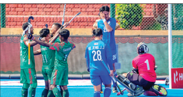
चीनी ताइपे के खिलाफ गोल करने के बाद जश्न मनाते हुए बांग्लादेश के खिलाड़ी।