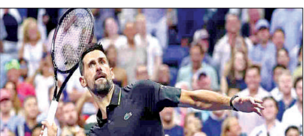
पीठ की समस्या से उबरते हुए शानदार प्रदर्शन करते हुए नोवाक जोकोविच।

सफर एलेना रयबाकिना से 6-1, 6-2 से हार के साथ समाप्त हुआ। गत चैंपियन एरिना सबालेका और 2024 की उपविजेता जेसिका पेगुला की आगेलें दौरे में जगह बनाने में सफल रही। पुरुष वर्ग में अमेरिका के खिलाड़ियों का प्रदर्शन अच्छा नहीं रहा तथा नंबर छह बेन शेल्टन और नंबर 17 फ्रांसेस टियाफो दोनों को हार का सामना करना पड़ा।