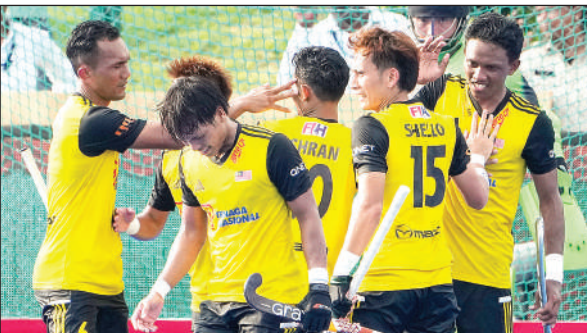
कोरिया के खिलाफ जीत दर्ज करने के बाद जश्न मनाते मलेशियाई खिलाड़ी।

यह पूछे जाने पर कि क्या चीनी टीम अंडरडॉग होगी, सात्विक ने कहा बिल्कुल नहीं। सेमीफाइनल खेल रहे हैं, कोई अंडरडॉग नहीं है। कुछ ही घंटे पहले पीवी सिंधू के क्वार्टर फाइनल में बाहर होने से भारत महिला एकल में पदक से वंचित रह गया था। जब सात्विक और चिराग कोर्ट पर उतरे तो उन पर उम्मीदों का बोझ साफ दिख रहा था।