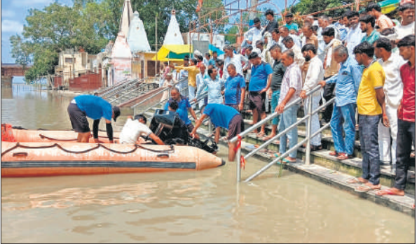
राजघाट पर युवक को तलाशने की तैयारी कर रहे पीएसी जवान।