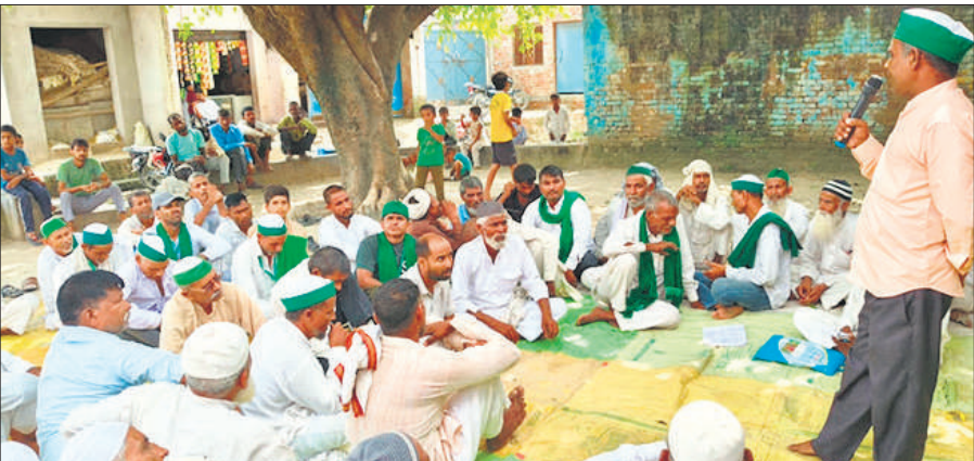
किसानों की बैठक को संबोधित करते किसान नेता।