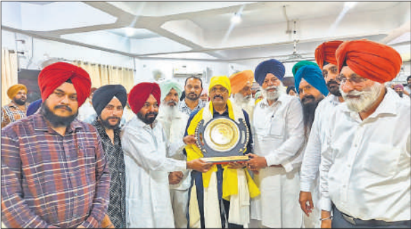
मंडलायुक्त को सम्मानित करते सिख समाज के लोग।