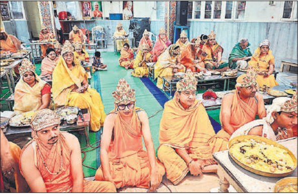
फूटा महल स्थित श्री पारसनाथ दिगंबर जैन मंदिर में पूजा अर्चना करते भक्त।

शनिवार को इंदौर और मथुरा से आए विद्वानों ने उत्तम आर्जव के महत्व से रूबरू कराया। विद्वानों ने बताया कि आर्जव का अर्थ है सरलता और निष्कपटता जिसे अपनाकर मनुष्य अपने जीवन को मोक्ष मार्ग की ओर अग्रसर कर सकता है। सांस्कृतिक बेला में वातावरण भक्ति रस में रंग