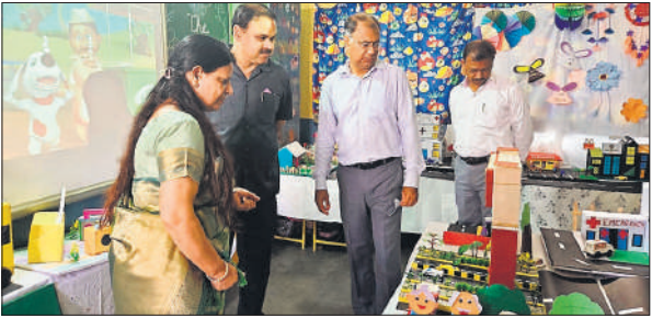
बच्चों द्वारा बनाए मॉडल देखते मुख्य अतिथि व शिक्षक।

मॉडल, कक्षा 12 कॉमर्स के एक ग्रुप ने बैंक सेंटअप, बैंक में लेनदेन, लोन लेने की क्रियाविधि और बैंकिंग सिस्टम पर आधारित मॉडल बनाया। कक्षा 12 के दूसरे ग्रुप ने इवेंट मैनेजमेंट का मॉडल प्रस्तुत किया। कक्षा 11 कॉमर्स के ग्रुप ने फैशन डिजाइनिंग पर आधारित सेंटअप तैयार किया। जिसमें फैशन क्षेत्र में विविध आयामों पर जानकारीयां दीं। कक्षा 12 विज्ञान वर्ग के ग्रुप में इंटीग्रेटेड फार्मिंग पर आधारित आकर्षक मॉडल प्रस्तुत किया। कक्षा 12 के कंप्यूटर विद्यार्थियों ने वर्चुअल आईडी, हैकिंग से बचने का तरीका और साइबर सेफ्टी के बारे में दर्शकों को बताया। कक्षा 12 विज्ञान वर्ग के