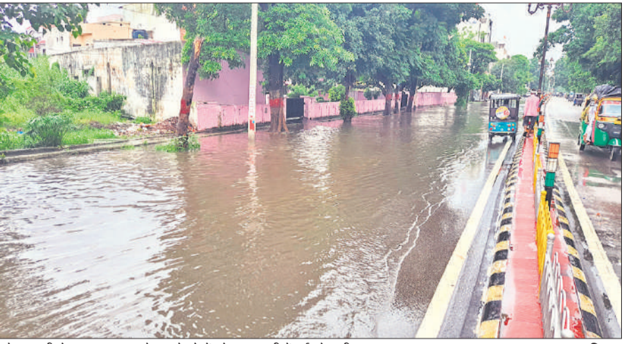
जौहर अली रोड पर जलभराव के चलते लोगों को आवाजाही में हुई परेशानी।

बारिश से सड़कों पर कीचड़ और जलभराव की स्थिति बन गई। इससे लोगों को परेशानी का सामना करना पड़ा। बारिश के कारण क्षेत्र में चल रहे कई निर्माण कार्य ठप हो गए। जुलाई माह लोग उमस भरी गर्मी से परेशान रहे, लेकिन अगस्त शुरू होते ही मौसम में बदलाव देखने को मिल रहा है। रुक-रुक के हो रही बारिश से लोगों को गर्मी से राहत मिली है। रविवार रात से फिर से मौसम बदल गया। आसमान में बादल छाने के बाद बारिश शुरू हो गई। सोमवार को सुबह से ही बारिश का मौसम रहा, जिससे तापमान में