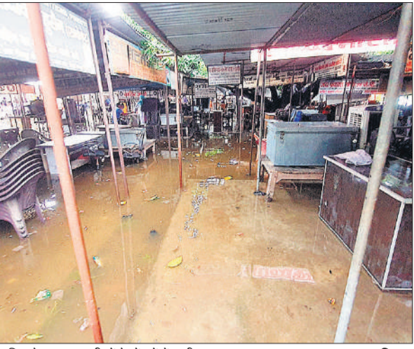
बारिश के कारण वकीलों के चेंबरों में पानी भर गया।

अधिशासी अभियंता से कहा था कि नगर के व्यापारियों के साथ एक बैठक होगी। इसमें दुकानदारों को अपना सामान हटाने के लिए दस दिन का समय दिया जाएगा। व्यापारियों ने आरोप लगाया कि बिना बातचीत के अतिक्रमण हटाने की मुनादी करा दी गई है। आगे उन्होंने बावली से टांडा होते हुए मोहनपुरा तक दुकानों और मकानों का अतिक्रमण हटाने के लिए 16 अगस्त तक का समय देने की मांग की है।