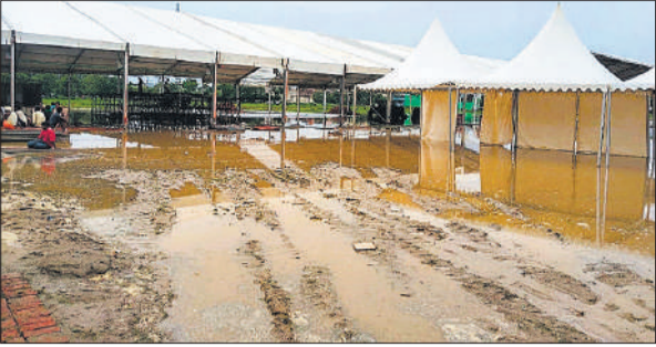
बुद्धि विहार में मुख्यमंत्री के आगमन स्थल पर बारिश के बाद भरा पानी।

● मौसम विभाग की ओर से तीन दिन मध्यम से भारी बारिश का जताया गया है अनुमान