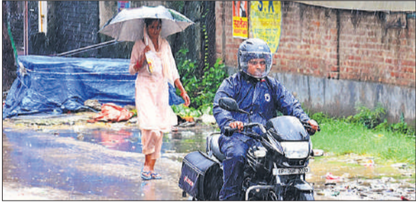
दोपहर में भीगते हुए निकले लोग।

कलेक्ट्रेट स्थित जिला आपदा प्रबंधन प्राधिकरण कार्यालय से मिली जानकारी के अनुसार जिले में सर्वाधिक बिलारी तहसील क्षेत्र में 125.5 मिलीमीटर बारिश हुई, जबकि सबसे कम ठाकुरद्वारा तहसील क्षेत्र में 30 मिलीमीटर बारिश हुई।