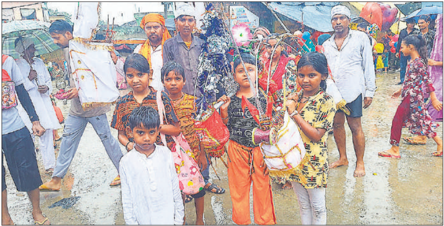
मंदिर के बाहर श्रद्धालुओं के बीच नरहं शिवभक्त कांड़ लिए नजर आए।