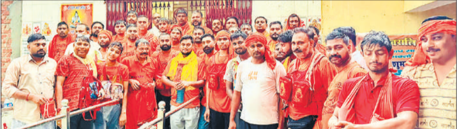
प्राचीन शिवमढ़ी मंदिर पर जलाभिषेक करने के बाद मौजूद शिव भक्त।