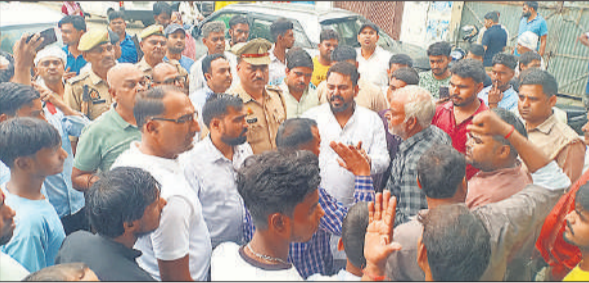
हंगामा कर रहे परिजनों को समझाते भाजपा नेता व एकत्र लोग।