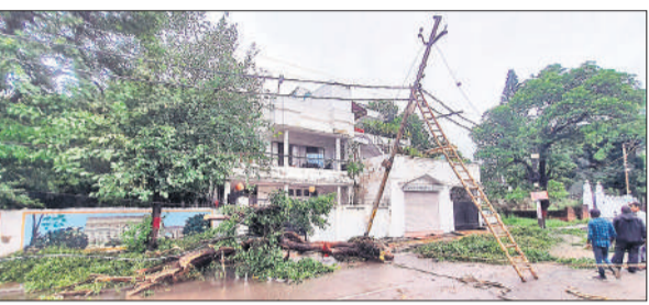
कचहरी के पास सड़क पर टूटा पड़ा पेड़।