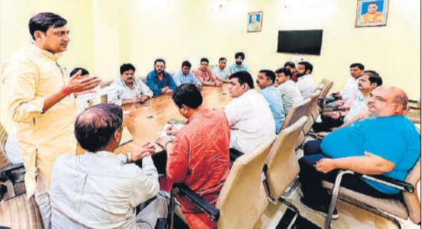
बैठक को संबोधित करते जिलाध्यक्ष।

बाबा के भजनों पर झुमे भक्त : हाईवे से मंदिरों में शिवभक्तों को जत्थे पहुंचते रहे। हरहर महादेव के जयकारे गूंजते रहे। सोमवार शाम तक भक्त कांवड़ लाते रहे। युवकों की गुप बारिश में जल लाकर मंदिरों में चढ़ाते रहे।