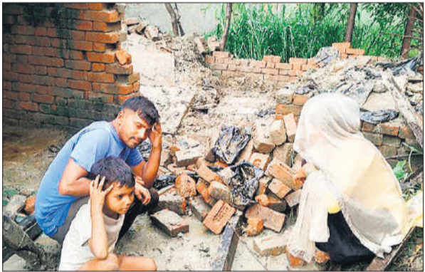
बारिश में गिरे मकान को बेवस निगाहों से देख रहे पति पत्नी और बच्चा।

25 डिग्री सेल्सियस रिकार्ड किया गया। अगले 24 घंटों में जिले के कई हिस्सों में बारिश होने की संभावना है। सोमवार को