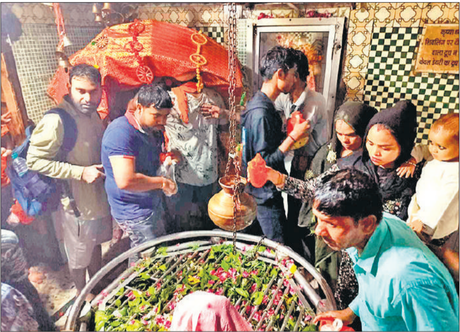
भमरौआ मंदिर में भगवान भोले बाबा को जल चढ़ाते भक्त।

इसके अलावा शहर स्थित कृष्णा मंदिर, शिव मंदिर, हरी-हर मंदिर, श्री हरि मंदिर, मनोकामना लक्ष्मी मंदिर, मिस्टंगगंज स्थित मंदिर में तड़के से ही भक्तों का पहुंचना शुरू हो गया था। इस दौरान भोले बाबा के जयकारों से मंदिर गूंज उठे। दस बजे तक शिवालयों में लोगों की कतारें लगना शुरू हो गई थीं, बड़ी संख्या में भक्तों ने भगवान भोलेनाथ पर