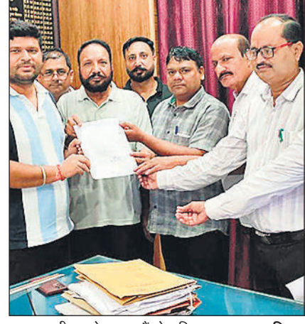
स्वार एसडीएम को ज्ञापन सौंपते अधिवक्ता।