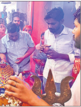
पातालेश्वर महादेव मंदिर पर जलाभिषेक करने को पहुंचे श्रद्धालु।