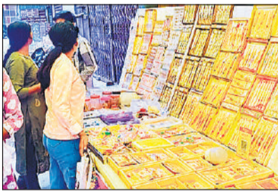
बाजार में राखियों की दुकान पर ग्राहक।