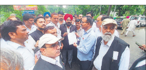
प्रशासनिक अधिकारी को ज्ञापन देते अधिवक्ता।