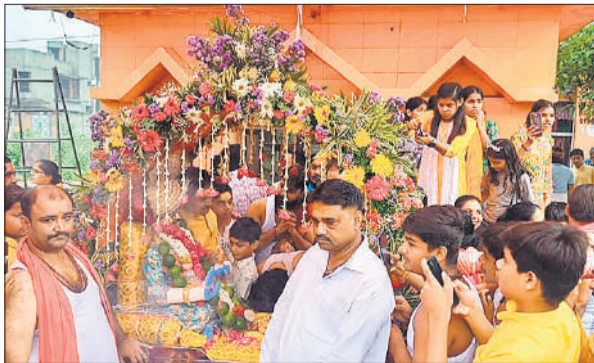
बाबा महाकाल की पालकी यात्रा का आरंभ करते आयोजक।

अमृत विचार: बहजोई में सावन के अंतिम सोमवार को बाबा महाकाल की पालकी धूमधाम से निकाली गई। पालकी यात्रा का स्वागत नागरिकों ने जगह-जगह पुष्प वर्षा कर किया। रेलवे रोड स्थित श्री हनुमान जी मंदिर से बाबा महाकाल की पालकी यात्रा का शुभारंभ महा आरती करके किया गया। पालकी यात्रा में सबसे आगे भगवान शिव की झांकी सभी को अपनी ओर आकर्षित कर रही थी। इसके बाद बाहर से आए कलाकारों ने भगवान शिव के स्वरूप में शिव भक्ति गीतों पर प्रस्तुति दी तो श्रद्धालु झूमने पर मजबूर हो गए। बाबा महाकाल की पालकी के साथ सैकड़ों श्रद्धालु यज्ञ घोष करते हुए चल रहे थे। बाबा महाकाल की पालकी यात्रा रेलवे रोड हनुमान जी के मंदिर