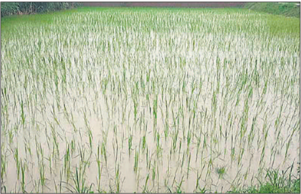
धान की फसल में भरा पानी।

लुढ़का तापमान, भरा पानी : बारिश के कारण तापमान करीब 2 डिग्री सेल्सियस तक लुढ़ककर 28 डिग्री पहुंच गया। न्यूनतम तापमान