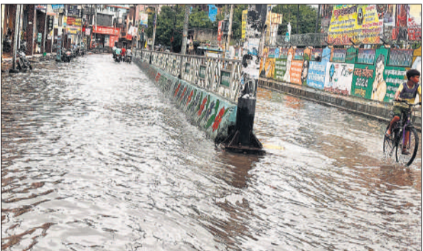
सड़क पर हुआ जलभराव बना मुसीबत।

हुई बारिश से शहर की सड़कें डूब गईं। बिजनौर रोड, कोट चौराहा, बसावन गंज, मुरादाबादी गेट, कोतवाली क्षेत्र, जट