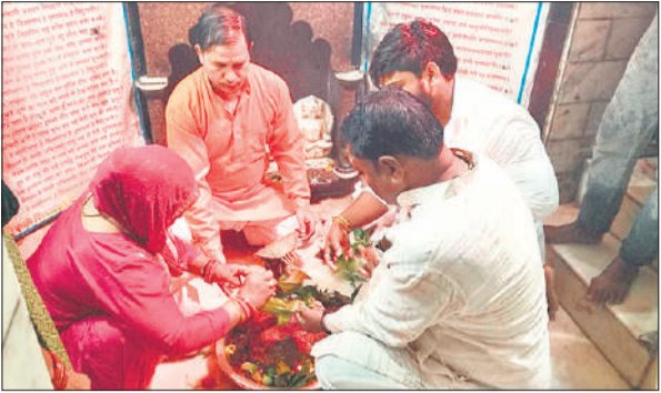
शिवाला मंदिर पर भोलेनाथ का जलाभिषेक करते श्रद्धालु।

बनी भगवान शिव समेत अन्य देवी देवताओं की प्रतिमा पर भी विधि विधान से पूजा अर्चना की गई। दोपहर तक कांवड़िये परिजनों के साथ शिवालयों में पहुंचते रहे। सबसे ज्यादा भीड़ शहर के प्राचीन वासुदेव