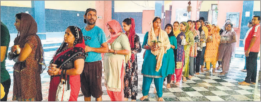
शिवाला मंदिर में जलाभिषेक करने को लगी भक्तों की लाइन।

अमृत विचार : सावन के आखिरी सोमवार के लिए श्रद्धालुओं में जबरदस्त उत्साह रहा। सोमवार तड़के से ही शिवालयों में जलाभिषेक करने के लिए कांवड़ियों के साथ श्रद्धालुओं का सैलाब उमड़ पड़ा। बम-बम भोले के जयकारों से शिवालयों संग शहर गूंज उठा। बड़ी संख्या में हरिद्वार और ब्रजघाट से गंगाजल लेकर आए शिवभक्तों जलाभिषेक कर पुण्य कमाया। भीड़ होने की वजह से दोपहर तक जलाभिषेक का सिलसिला चलता रहा। सोमवार को तड़के से ही मंदिरों में शिव लिंग पर जल चढ़ना आरंभ हो गया था। ब्रजघाट एवं हरिद्वार