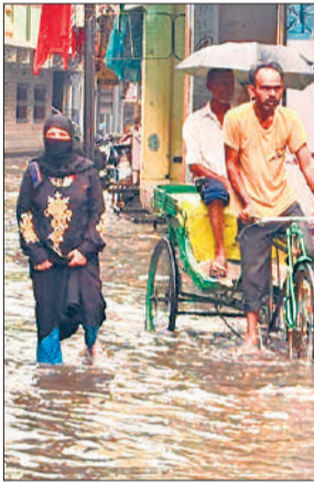
जलभराव से निकलते लोग।