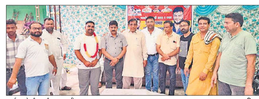
कार्यक्रम के दौरान मौजूद व्यापारी।