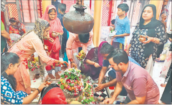
सूर्यकुंड मंदिर पर पूजा अर्चना व जलाभिषेक करते श्रद्धालु।

शिव की नगरी संभल में सावन महोने के आखिरी सोमवार को शिव भक्तों ने व्रत रखकर भगवान भोलेनाथ की पूजा व जलाभिषेक किया। रविवार रात से बरसात का सिलसिला शुरु हुआ तो सोमवार सुबह को भी बरसात जारी रही।