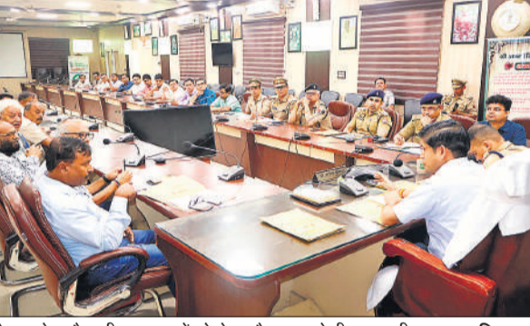
मेला गणेश चौथ की व्यवस्थाओं को लेकर बैठक करते डीएम, एसपी।

पंचासा, देहपा, असमोली, सौधन आदि जगहों पर भी श्रद्धालुओं ने सावन के आखिरी सोमवार को जलाभिषेक कर पूजा अर्चना की।