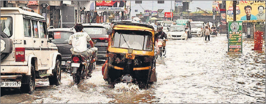
बारिश के बाद हुए जलभराव से गुजरते वाहन।

पिछले दिनों से बूंदबांदी हो रही थी, लेकिन पिछले 24 घंटे से हो रही बारिश ने शहर से लेकर देहात तक अव्यवस्था कर दी है। रविवार शाम से शुरू हुई झमाझम बारिश के चलते शहर की सड़कें जलमग्न हो गईं। जिससे राहगीरों को काफी दिक्कतों का सामना करना पड़ा। बारिश से देहात क्षेत्र में कुछ लोगों के घरों के गिरने की सूचना है। इस बारिश से लोगों ने जहां गर्मी से राहत महसूस की है। वहीं धान, सब्जी व बाजरा की खेती को लाभ हुआ है। इससे किसानों के चेहरे पर रौनक आ गई। सोमवार शाम तक आसमान में बादल छाप रहे और बारिश होती रही।