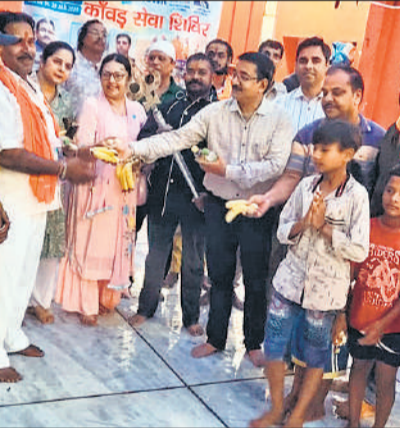
सूर्यकुंड मंदिर पर कांवड़ियों को फल बांटते क्लब के पदाधिकारी।