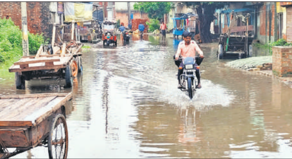
जलभराव से होकर गुजरते लोग।

परेशानी उठानी पड़ी। हयातनगर से बीडी इंटर कॉलेज की तरफ जाने वाले रास्ते पर बेहद खराब हालात नजर आए। वहीं तेज हवा व बारिश के चलते जगह-जगह पेड़ टूट गए। चाचू नागल मुख्य चौराहे के नजदीक बिजली के पोल पर नीम का पेड़ जा गिरा। बिजली का पोल गिरा तो इलाके की बिजली पूरी रात गुल रही।