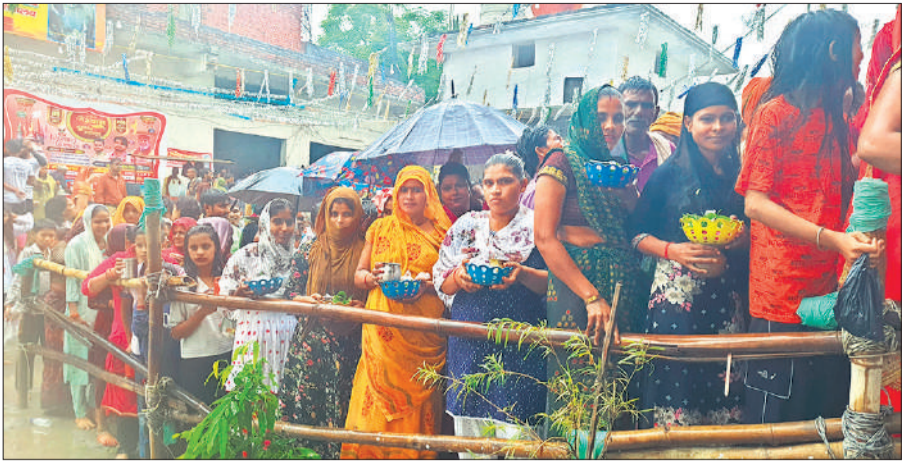
सावन के आखिरी सोमवार को भमरौआ मंदिर के बाहर लगी भक्तों की कतार।