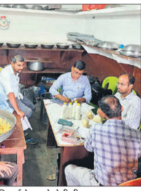
मिठाई के नमूने लेती टीम।