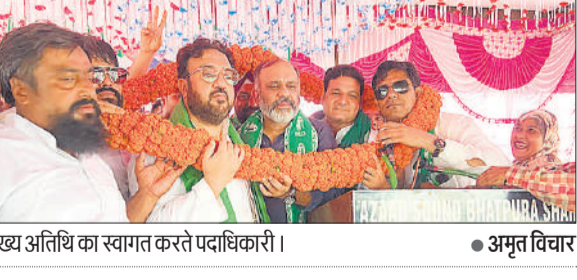
मुख्य अतिथि का स्वागत करते पदाधिकारी।