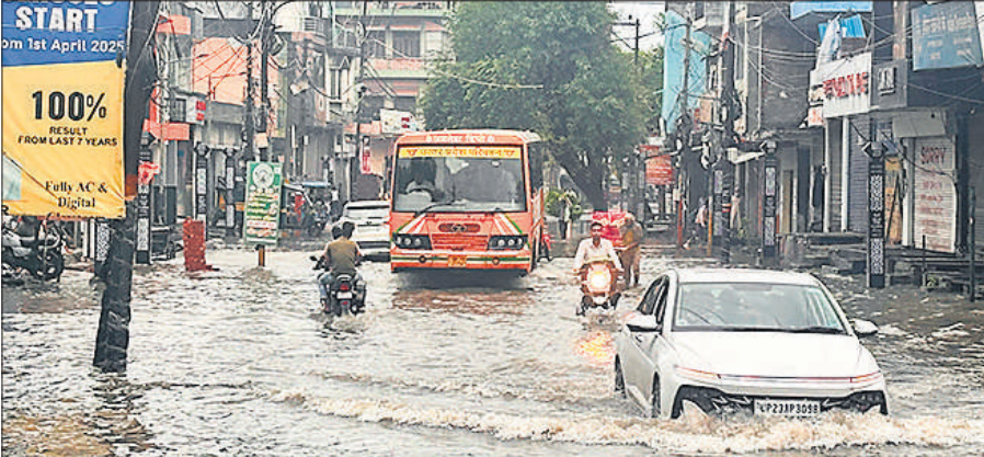
बारिश के बाद बिजनौर मार्ग पर भरे पानी से होकर निकलते वाहन।

दुकानदार और लोगों को दिक्कतों का सामना करना पड़ा। वहीं किसानों के चेहरे पर खुशी दिखा। बारिश के चलते बिजली आपूर्ति ठप हो गई। जिससे लोगों को परेशानी का सामना करना पड़ा। बारिश ने रूकने का नाम नहीं लिया। मंगलवार की सुबह करीब 4 बजे बारिश शुरू हो गई। जो सारा दिन होती रही। कभी धीमे