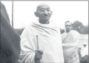
रामपुर आने पर ली गई महात्मा गांधी त।

10 दिसंबर 1878 को जन्मे भारत के महान स्वतंत्रता संग्राम सेनानी मौलाना मोहम्मद अली जौहर भारत की आजादी के लिए बीमारी की हालत में 1930 में गोल मेज कांग्रेस में भाग लेने लंदन पहुंचे। गोल मेज कांग्रेस में उन्होंने करीब ढाई घंटे अंग्रेजों से जिरह की और 19 नवंबर