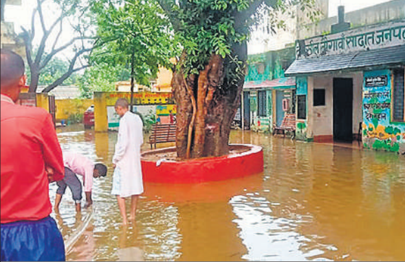
तहसील में भरा पानी।