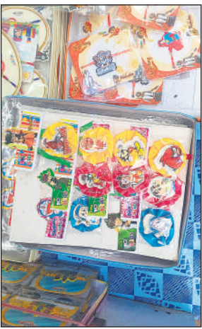
बाजार में बिक रही राखियां।

डोरेमॉन, हनुमान, दीपा पिपा, बेन टेन ब्रदर और की-चेन की राखियां उपलब्ध हैं। जो 20 से 50 रुपये तक की हैं।