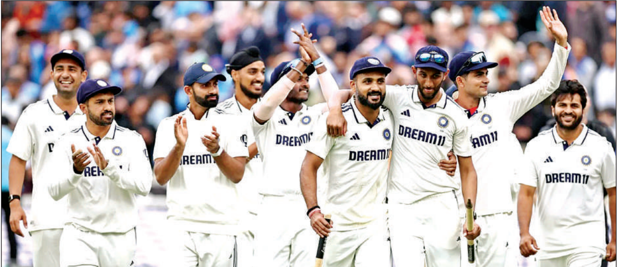
इंग्लैंड के खिलाफ पांचवां व अंतिम मैच जीतने के बाद जश्न मनाते भारतीय टीम के युवा खिलाड़ी।

भारत ने दो मैच गंवाए, लीड्स में पहला मैच और लॉड्स में तीसरा टेस्ट। इन मैच में भी भारत जीत सकता था लेकिन यही वह सबक है जो युवा खिलाड़ियों को मिला है। भारतीय टीम की सबसे बड़ी विशेषता यह रही कि उसने किसी भी मैच में आखिर तक हार नहीं मानी और दो मैच में शानदार वापसी की। इससे टीम के जज्जे का पता चलता है। इस श्रृंखला में यह भी साबित हो गया कि भारतीय टीम का भविष्य सुरक्षित हाथों में है। गिल ने श्रृंखला में चार शतक की मदद से सर्वाधिक 754 रन बनाकर आगे बढ़कर नेतृत्व किया। इससे अन्य खिलाड़ियों को भी