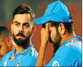
विराट कोहली व रोहित शर्मा।

वाशिंगटन सुंदर कभी जिम्मेदारी से पीछे नहीं हटे। यशस्वी ने जरूरत पड़ने पर योगदान दिया, आकाश दीप और प्रसिद्ध कृष्णा प्रभावी नजर आए और साई सुदर्शन ने अपनी दीर्घकालिक उपस्थिति की झलक दिखाई। लेकिन इस शानदार प्रयास का एक ओर आयाम भी है। इससे सवाल उठता है कि टी20 और टेस्ट क्रिकेट से संन्यास लेने वाले विराट