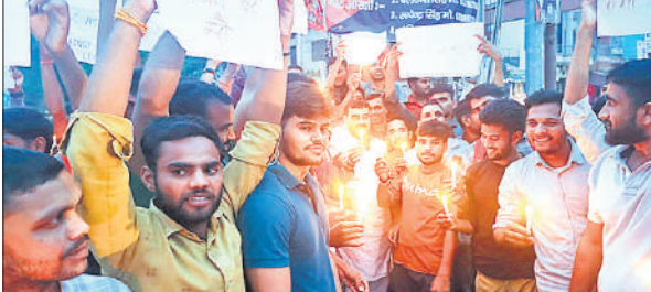
बबराला में कैंडल मार्च निकालते युवा।