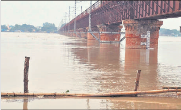
बबराला राजघाट पर उफनाई नजर आती गंगा।

सभा स्थल ,पार्किंग स्थल का निरीक्षण कर तैयारी को समय से पूरा करने के निर्देश दिए। वहीं सुरक्षा व्यवस्था को लेकर अलर्ट पर रहने की बात।