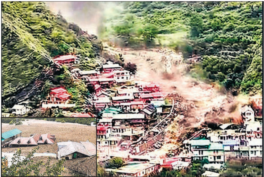
धराली में बादल फटने से अचानक आई बाढ़ में कई घर बह गए। इनसेट : कई भवन मलबे में पूरी तरह दब गए।

जिला आपातकालीन परिचालन केंद्र के अनुसार उत्तरकाशी जिले की भटवाड़ी तहसील में हर्षिल के नजदीक खीर गंगा में मंगलवार दोपहर 1:50 बजे के आसपास जलस्तर बढ़ने से धराली बाजार में भारी मलबा आ गया। कुछ ही मिनट में मलबा कई भवनों, होटलों एवं दुकानों को क्षतिग्रस्त कर गया। बाढ़