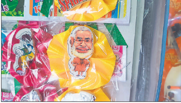
दुकान पर रखी प्रधानमंत्री नरेंद्र मोदी के मुखौटे वाली राखियां।

अमृत विचार : रक्षाबंधन का पर्व नजदीक आते ही बाजारों में अब धीरे-धीरे करके रौनक बढ़ गई है। बाजार में राखियों की दुकानें सजने लगी हैं। इस बार कई तरह की राखियां बाजार में आई हैं। इनमें प्रधानमंत्री नरेंद्र मोदी के मुखौटे की राखी बच्चों को काफी लुभा रही है। 9 अगस्त को भाई बहन के प्रेम और स्नेह का पर्व रक्षाबंधन करीब आ चुका है। जिसको देखते हुए अब बाजार धीरे-धीरे गुलजार होने लगा हैं। ज्वालानगर से लेकर अजीतपुर सड़क के दोनों ओर राखियों की दुकानें लगाई जा रही है। बारिश के मौसम को देखते हुए पन्नियों से दुकानों को पैक किया जा रहा है। इसके अलावा शहर में मिस्टनगंज और राजद्वारा में भी दुकानें लग रही है। सराफा कारोबारियों का कहना है कि चांदी की राखियों की मांग भी जोरों पर हैं। बाजार में महिलाओं के लिए