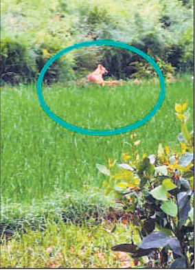
खेत में बैठा तेंदुआ।