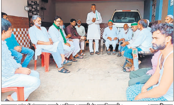
खानपुर गांव में पंचायत करते भाकियू असली के पदाधिकारी।