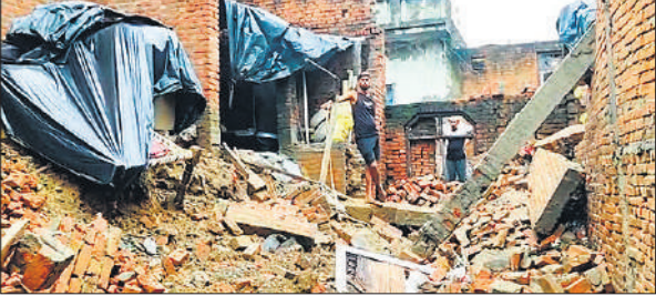
बरसात के चलते अमरोहा में गिरा कच्चा मकान।