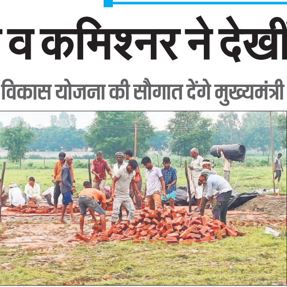
मुख्यमंत्री के कार्यक्रम के लिए हेलीपैड बनाने में जुटे मजदूर।