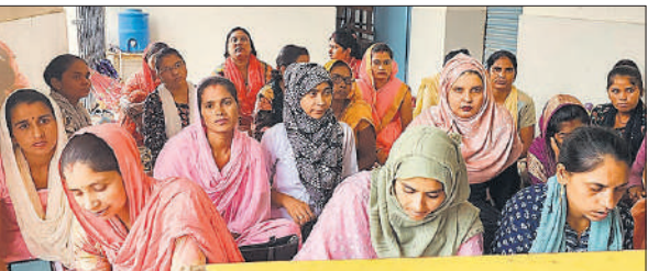
बैठक में मौजूद आंगनवाड़ी कार्यकर्त्री।