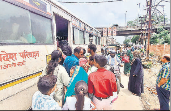
बसों में चढ़ती सवारियां।