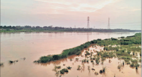
रामगंगा नदी खतरे के निशान के आसपास बह रही है।