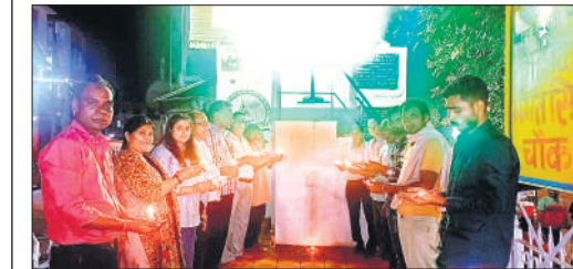
काकोरी एक्शन डे पर शहीदों को श्रद्धांजलि देते लोग।

बबराला, अमृत विचार : रक्षाबंधन की सुबह शनिवार को दिल्ली-बदायूं रोड पर गांव सैजना मुस्लिम के पास रोडवेज बस और आई को कार की टक्कर हो गई। ईको सवारों ने रोडवेज बस चालक से मारपीट की और पथराव कर शीशा तोड़ दिया, जिससे बस यात्रियों में दहशत फैल गई। इस दौरान मेरट बदायूं स्टेट हाईवे पर करीब आधा घंटा तक हंगामा चलता रहा जिससे यातायात बाधित रहा। पुलिस ने मौके पर पहुंचकर जाम खुलवाया।