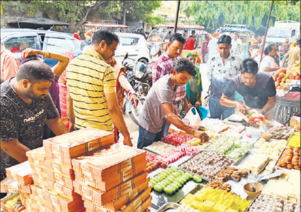
सड़क किनारे सजी मिठाई की दुकान व खरीदारी करते लोग।

रक्षाबंधन त्योहार को लेकर बहनों ने एक दिन पहले से ही अपनी तैयारियां कर ली थीं। सुबह से ही दूर दराज से बहनें भाइयों के घर आने लगीं। त्योहार मनाने का सिलसिला शनिवार को सुबह घरों पर पूजा अर्चना के साथ शुरू हुआ। सुबह से ही बहनों ने राखी