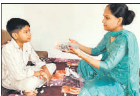
भाई की आरती उतारती बहन।

रक्षाबंधन त्योहार के लिए काफी संख्या में बहनों ने पहले ही राखी व मिठाई खरीदकर रख ली थी लेकिन शनिवार को त्योहार के दिन भी राखी व मिठाई की जमकर बिक्री दिखाई दी। घर से रवाना होने के बाद जहां भी सड़क किनारे मिठाई की दुकान नजर आई वहीं पर रुक कर बहनों ने भाई को देने के लिए मिठाई खरीदी। इसी तरह बहनों ने राखी भी खरीदी। राखी और मिठाई की बिक्री से दुकानदार भी उत्साहित नजर आए। बताया कि इस बार त्योहार का लेकर उत्साह के बीच अच्छा कारोबार हुआ है।