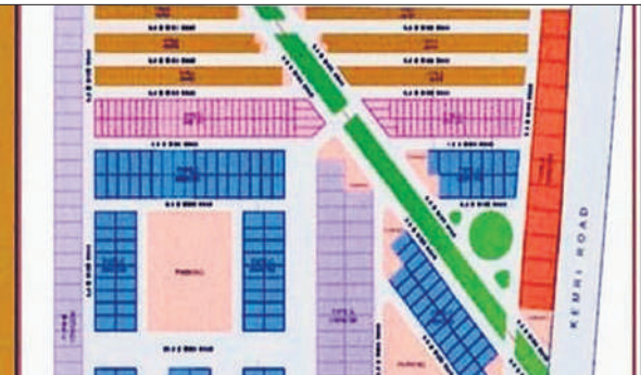
केमरी रोड पर प्रस्तावित टीपीनगर का नक्शा।

जिलाधिकारी ने बताया कि आरंभ से पहले योजना को विकसित करने के लिए भूखंडों की मांग को लेकर डिमांड सर्वे हो रहा है। डिमांड सर्वे में आवेदन करने वाले आवेदकों को आवंटन में प्राथमिकता दी जाएगी। उन्होंने बताया कि भूखंड आवंटन के लिए ट्रांसपोर्ट से जुड़े बड़े, व छोटे व्यापारियों का पूरा ध्यान रखा गया है। इसमें 24 वर्ग मीटर से लेकर 400