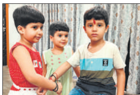
भाई को राखी बांधती बहन।

संभल के अलावा असमोली, सिरसी, सौंधन, पंवासा, बहजोई, धनारी, बबराला, गुन्नौर,