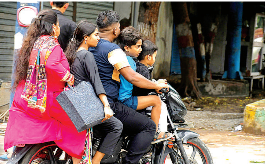
एक गाड़ी पांच सवारी : अब इससे मजबूरी कहे या आदत ? रक्षाबंधन पर पांच सदस्यों का एक परिवार एक ही बाइक पर जाता नजर आया ... हेलमेट भी नहीं। यह नजारा शनिवार को हजरतगंज चौराहे से राजभवन मार्ग का है। वैसे तो राजधानी में यातायात अभियान भी चल रहा है, लेकिन त्योहार पर व्यवस्था की संवेदनशीलता का फायदा परिवार को खतरे में डाल कर उठाना कहां की समझदारी है ?