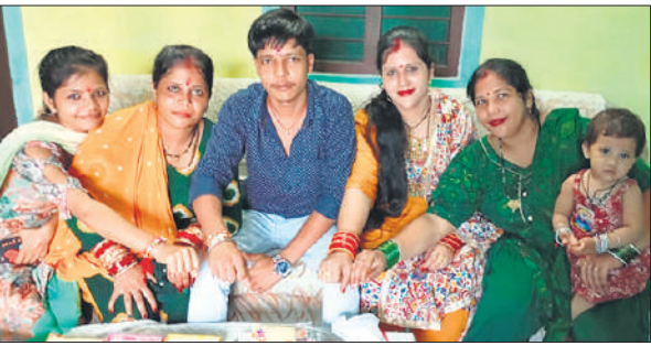
रक्षाबंधन का त्योहार मना खुशी मनाती बहनें और भाई।