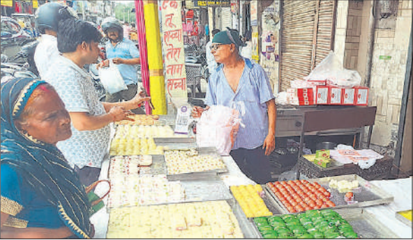
मिठाई खरीदते लोग।

रामपुर, अमृत विचार : रक्षाबंधन पर सुबह से ही मिठाई और राखी की दुकानों पर भीड़ रही। सात बजे से ही बहनों का अपने भाइयों के घर पहुंचना शुरू हो गया था। इस दौरान बहनों ने पहले भाइयों के लिए राखी और मिठाई खरीदी। उसके बाद घरों के लिए रवाना हो गई। मिठाई और राखी की दुकानों पर काफी भीड़ रही। देर शाम तक लोग मिठाइयों की खरीदारी करते रहे।