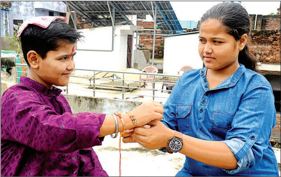
रक्षाबंधन के पर्व पर भाई को राखी बांधती बहन।