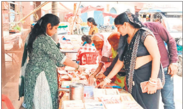
रक्षाबंधन पर राखी खरीदती बहनें।

रक्षाबंधन का त्यौहार मनाया : रहरा, अमृत विचार: गंगेश्वरी क्षेत्र में शनिवार को बहनों ने अपनी भाई की कलाई पर राखी बांधकर रक्षाबंधन का पर्व स्नेह