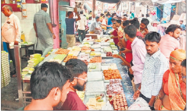
हसनपुर में मिठाई की दुकान पर लगी भीड़।

क्योंकि तट बांध के भीतर के खेतों में डूबाऊ पानी खड़ा है। गांव गंगानगर में बाढ़ का पानी घरों में घुस गया है। उम्मीद व्यक्त की जा रही है कि जिस तरह से गंगा का जलस्तर