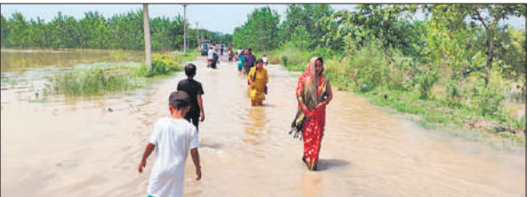
गांव सुल्तानपुर में सड़क पर भरे पानी को पार कर भाई को राखी बांधने जाती बहनें।

जैतपुर बिसाहट, दौलारी, मनकरा, सुल्तानपुर, भीतखेड़ा, जैतवाड़ा,