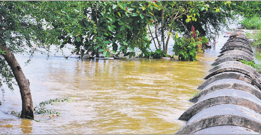
कल के मुकाबले आज काम हुआ रामगंगा का जलस्तर।

ग्रामीण क्षेत्रों में कई घर और कच्ची सड़कें क्षतिग्रस्त हो गई हैं।