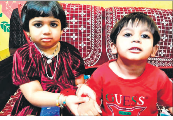
रक्षाबंधन पर भाई को राखी बांधती बहन।