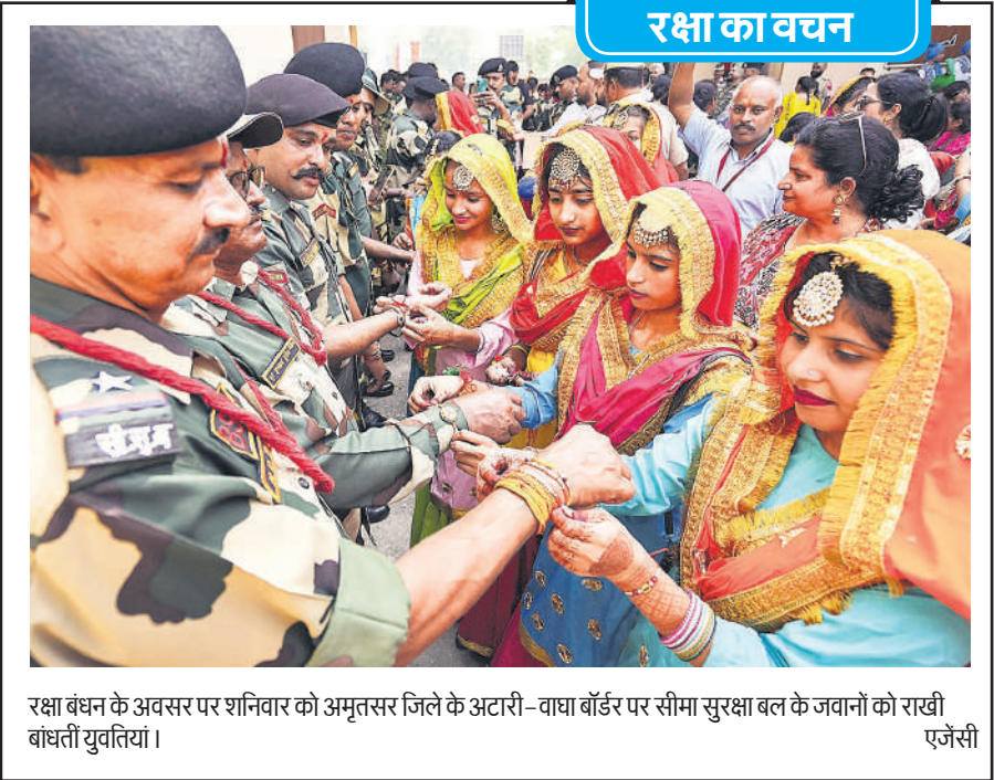
रक्षा बंधन के अवसर पर शनिवार को अमृतसर जिले के अटारी-वाघा बॉर्डर पर सीमा सुरक्षा बल के जवानों को राखी बांधती युवतियां।