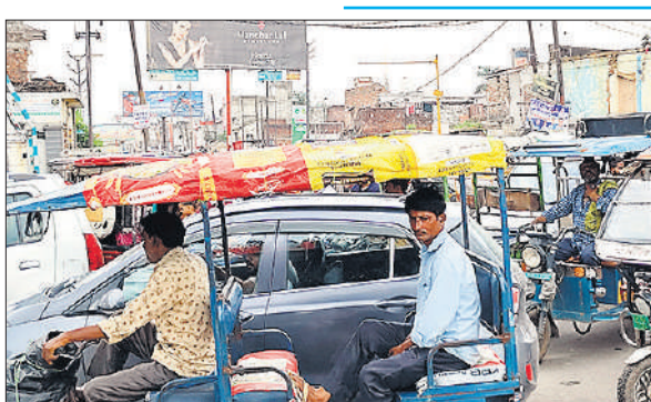
चंदौसी चौराहा पर जाम में फंसे वाहन।