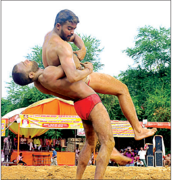
कैंट सदर क्षेत्र के हरीचंद इंटर कॉलेज के खेल मैदान में 138वें अखिल भारतीय मस्ता पहलवान गुरुजी श्रीराम चन्द्र स्मारक ईनामी दंगल में कुश्ती लड़ते पहलवान।