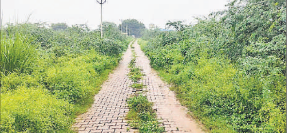
आईटीआई जाने वाले रास्ते पर दोनों ओर झाड़ियां।