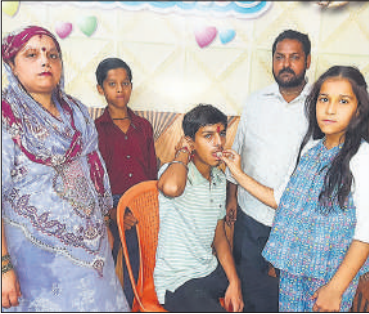
राखी बांधने के बाद भाई को मिठाई खिलाती बहन।