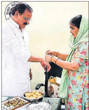
राखी बंधवाते सदर विधायक व लोक