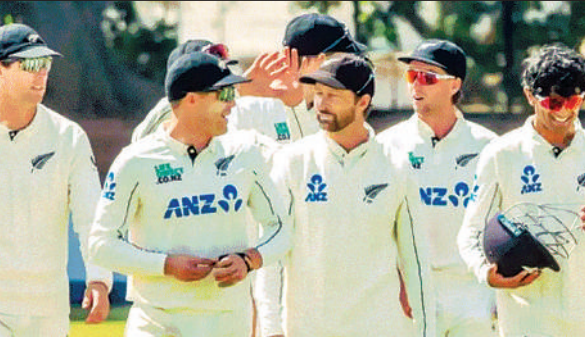
जीत दर्ज करने के बाद जश्न मनाती न्यूजीलैंड की टीम।