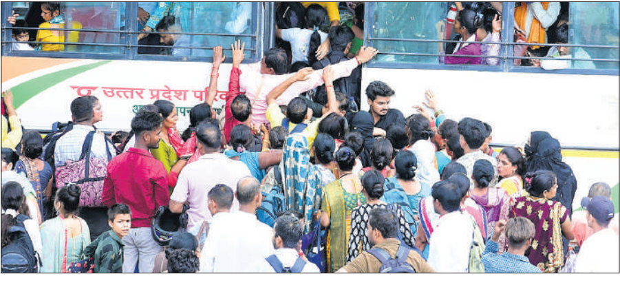
पीतल नगरी डिपो पर बस में चढ़ने की जद्दोजहद करती बहनें।