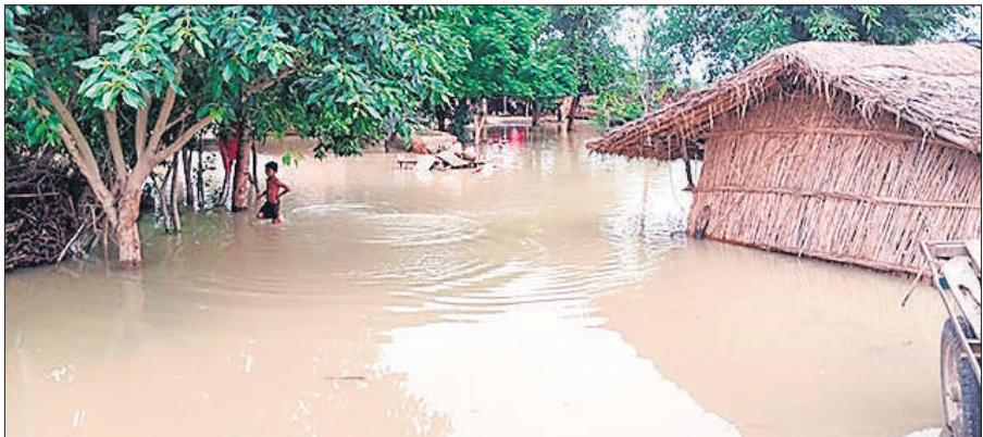
घरों में घुसा गंगा में बाढ़ का पानी।

और हर्षोल्लास से मनाया गया। रिमझिम बारिश के दौरान बहनों ने अपने भाई के घर पहुंच कर उनकी कलाई पर राखी बांधकर उनकी लंबी उम्र की कामना की। उधर भाइयों ने भी अपनी बहन से राखी बंधवा कर उनकी रक्षा करने का वचन दिया।