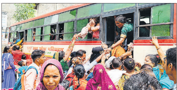
रोडवेज बस अड्डे पर बस में सवार होने के लिए जूझती बहनें।