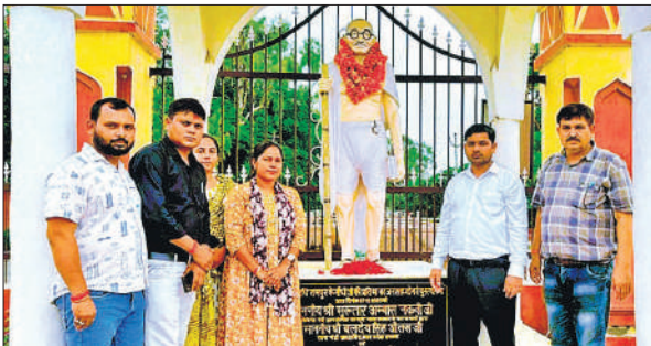
गांधी जी प्रतिमा पर पुष्प चढ़ाने के दौरान मौजूद लोग।

उन्होंने महिला पर कार चढ़ाने का प्रयास किया। जिससे महिला बाल-बाल बच गई। उसके बाद महिला के पति ने कार से निकलकर अपनी पत्नी को पीट दिया। उसके बाद मोबाइल को तोड़ कर फरार हो गए। पीड़ित ने थाने में शिकायत की। जिसके बाद पुलिस ने महिला के पति सहित दो लोगों पर रिपोर्ट दर्ज कर ली है।