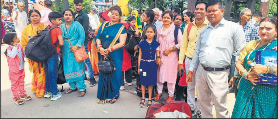
बसों का इंतजार करती महिलाएं।