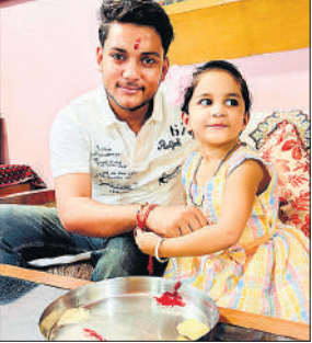
भाई को राखी बांधती बहन।

अमृत विचार : नगर पंचायत में भाई बहन के अटूट बंधन के पवित्र पर्व रक्षा बंधन को उल्लास के साथ मनाया गया। दूर दराज से आने वाली बहनों को कई जगह दुश्वारियां का सामना करना पड़ा। नगर पंचायत अगवानपुर में भी सुबह से ही बहनों के आने का सिलसिला जारी रहा। हाथ में भाई के लिए मिठाई और राखियां लिए बहनों को आते जाते देखा गया। शनिवार को बहनों की मंजिल भाई