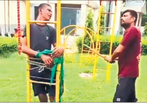
मजदूर को बांधकर पीटाया युवक।