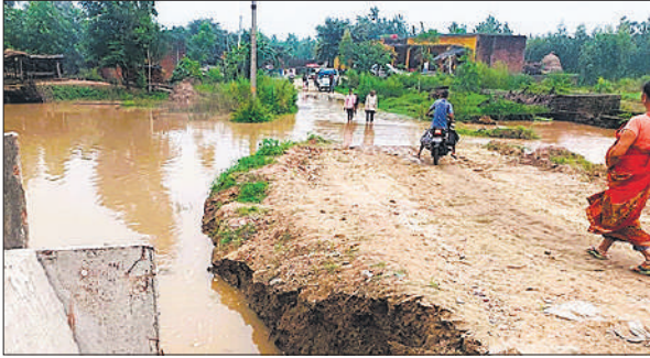
पानी के बीच से निकलते ग्रामीण।

कट गई। रौंडा से मूंढापांडे जाने वाले मार्ग पर रझेड़ा पुल के पास तीन से चार फीट पानी उतर आया था। जिससे आवागमन अब तक बंद है। गोविंदपुर कला से जैतवाड़ा होते हुए कुंदरकी जाने वाले मार्ग पर भी कई फीट पानी भरने से रास्ता अब तक बंद है। इससे क्षेत्र के करीब 50 हजार लोगों का जिला मुख्यालय से संपर्क पूरी तरह टूट गया है। बाढ़ ने किसानों की सैकड़ों बीघा फसल को बर्बाद कर दिया है। जिला बेसिक