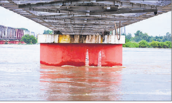
कटघर पुल के नीचे तेज गति से बहता रामगंगा का पानी।

अमृत विचार: कई दिनों से नदियों के बढ़े जलस्तर से जिले में बाढ़ की स्थिति से लोगों को काफी नुकसान हुआ। घरों में रखा सामान नुकसान होने के साथ ही हजारों बीघा फसल नष्ट होने से किसानों के माथे पर चिंता की लकीरें खिंच गई हैं। हालांकि शनिवार को रामगंगा का जलस्तर घटते क्रम में रिकॉर्ड किया गया। जिससे बाढ़ बचाव व राहत कार्य में जुटे अधिकारियों व कर्मचारियों को सहूलियत मिली। बाढ़ खंड विभाग के अधिशासी अभियंता के अनुसार शुक्रवार रात दो बजे से चार बजे तक रामगंगा का जलस्तर 191.45 से 191.46 मीटर के बीच स्थिर रहा। सुबह 4 बजे से पानी का स्तर धीरे-धीरे कम होना शुरू हुआ। सुबह 8 बजे तक