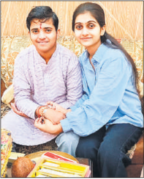
राखी बांधने के बाद प्रसन्न भाई-बहन।

अमृत विचार : रक्षाबंधन का पावन पर्व नगर व क्षेत्र में हर्षोल्लास से मनाया गया। बहनों ने अपने भाइयों की कलाई से राखी बांधकर चिरायु होने की कामना की। तहसील क्षेत्र में हर्षोल्लास के साथ रक्षाबंधन का पर्व मनाया गया। बहनों ने अपने भाइयों की कलाई से राखी बांधकर चिरायु होने की कामना की। भाइयों ने बदले में बहनों को रक्षा का वचन दिया। रक्षाबंधन पर्व पर रोडवेज की बसों में भारी भीड़ रही। महिला और पुरुष चलती बसों में डाले पर लटकने के लिए मजबूर थे। बाजार में महिलाओं ने मिष्ठान व राखियां खरीदीं। मिष्ठान विक्रेताओं की काफी चांदी रही। बहनों ने अपने भाइयों का मंगल तिलक कर उनके हाथों में राखी बांध चिरायु होने की ईश्वर से कामना की तथा बदले में रक्षा का वचन लिया। सड़कों पर अधिक वाहनों के कारण अनेक स्थानों पर जाम जैसी स्थिति देखने को मिली।