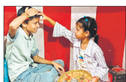
बहजोई में भाई को राखी बांधती बहन।

बहजोई, अमृत विचार : नगर व ग्रामीण अंचलों में बहन के प्यार का त्योहार रक्षाबंधन पर परंपरागत तरीके से मनाया गया। बहनों ने भाइयों की कलाई पर राखी सूत्र बांधा। रक्षाबंधन त्योहार को लेकर भाई-बहनों में उत्साह दिखाई दिया। सुबह से ही बहनों का भाइयों के घर पहुंचना प्रारंभ हो गया। रोडवेज बसों में पैर रखने को जगह नहीं मिली, वहीं ट्रेनों में भी बुरा हाल था। बहुत सी बहनें तो डगमगार वाहन का सहारा लेकर पहुंचीं। भाइयों ने बहनों को उपहार भेंट करते हुए सुरक्षा का वचन दिया।