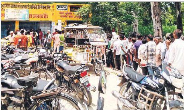
भल्लिया बुजुर्ग समिति पर यूरिया लेने वालों की लगी लंबी लाइन। ● अमृत विचार