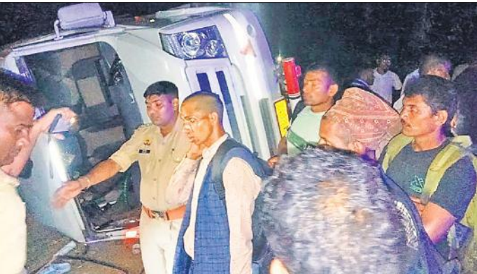
नेपाली यात्रियों को सड़क किनारे करती पुलिस।

गुरुवार की देर शाम करीब साढ़े नौ बजे के आस-पास रुपईडीहा से एक निजी बस लखीमपुर की तरफ आ रही थी। बस में नेपाल के रहने वाले करीब 30 यात्री सवार थे। बताते हैं कि बस काफी तेज रफ्तार में थी। थाना खीरी के गांव चहमलपुर के पास एक साइकिल