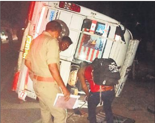
दुर्घटना के बाद टाच की रोशनी में बस में फंसे यात्रियों को देखती पुलिस।