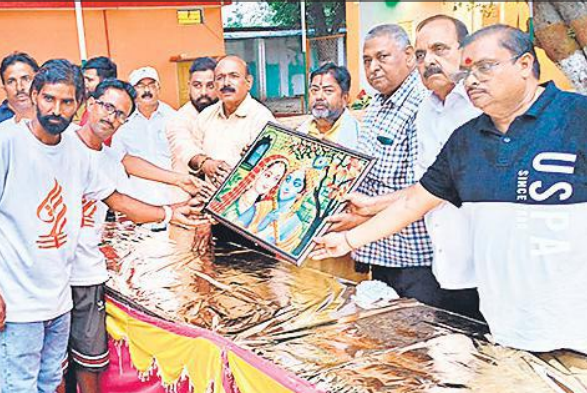
कांवड़ियों को स्मृति चिह्न देते पूर्व नगर पंचायत अध्यक्ष।