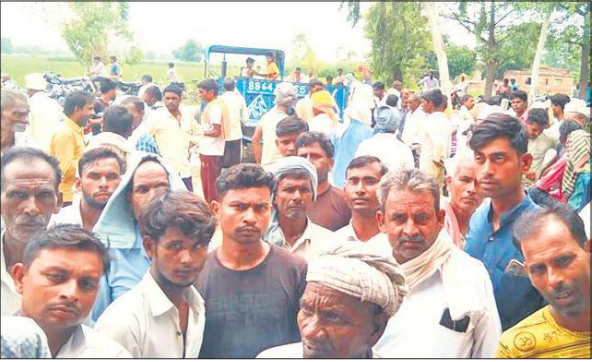
नवदिया रोहनिया साधन सहकारी समिति पर खाद लेने के लिए पहुंचे ग्रामीण।