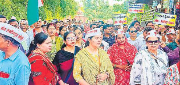
विलोबी मेमोरियल हॉल से विराट रोष मार्च निकालते शिक्षक व शिक्षिकाएं ।