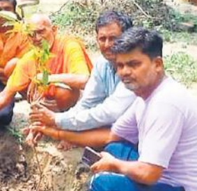
जड़ौरा में ग्राम प्रधान के साथ पौधरोपण करते ग्रामीण।