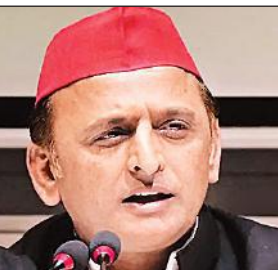
अखिलेश यादव, राष्ट्रीय अध्यक्ष, सपा

अमृत विचार : भाजपा के प्रदेश अध्यक्ष भूपेंद्र सिंह चौधरी ने सहारनपुर में समाजवादी पार्टी द्वारा शुरू की गई ‘पीडीए पाठशाला’ में बच्चों को ‘ए फॉर अखिलेश यादव’ और ‘डी फॉर डिंपल यादव’ जैसे पाठ पढ़ाए जाने की कड़ी निंदा की है। उन्होंने इसे बच्चों की कोमल मन में राजनीतिक विष घोलने की साजिश करार देते हुए कहा कि यह शिक्षा नहीं, समाजवादी ब्रेनवॉश है। चौधरी ने शुक्रवार को स्पष्ट किया कि बच्चों की शिक्षा को राजनीति की प्रयोगशाला नहीं बनने दिया जाएगा और इस विकृत