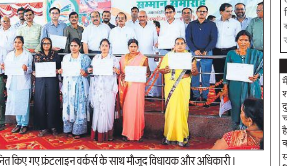
सम्मानित किए गए फ्रंटलाइन वर्कर्स के साथ मौजूद विधायक और अधिकारी।