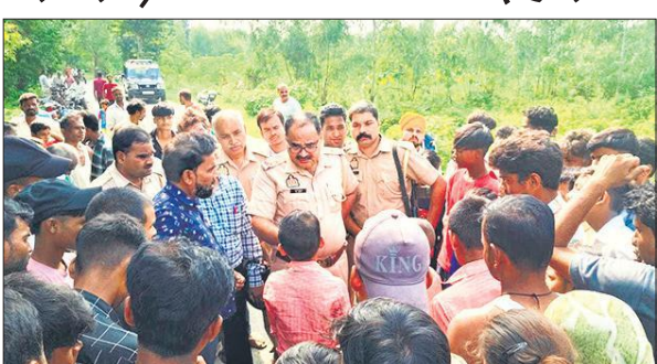
घटना की जानकारी करती सूचना मिलने पर पहुंची पुलिस।