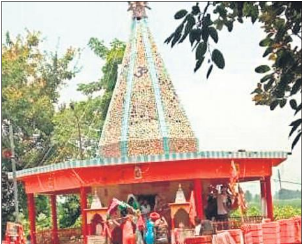
गांव अहमदनगर का क्लेशहरण मंदिर ।

अहमदनगर स्थित क्लेशहरण मंदिर के बारे में कहा जाता है कि वह गोला के भोला के छोटे भाई हैं। क्लेशहरण मंदिर पर यूं तो पूरे सावन भर श्रद्धालुओं की भीड़भाड़ रहती है, लेकिन सोमवार और शुक्रवार को ग्रामीण महिलाओं, बच्चों, युवतियों की अपार भीड़ उमड़ने से उनकी महिमा बढ़ती ही जा रही है। पीलीभीत-बस्ती मार्ग से गुजरने वाले कांवड़िया बाबा