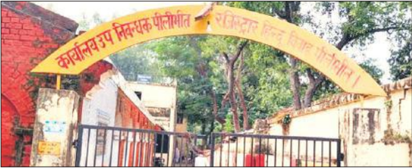
पीलीभीत का रजिस्ट्री कार्यालय।

बता दें कि रजिस्ट्री विभाग में लगाए गए पुराने सॉफ्टवेयर में इस तरह की जालसाजी को पकड़ने के लिए कोई सिस्टम नहीं था। जनपद