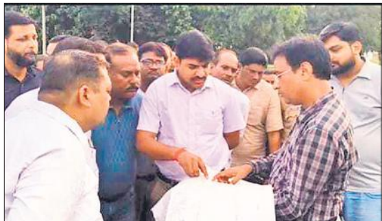
बिलसंडा में ट्रस्ट की जमीन के बारे में लेखपाल से जानकारी लेते हुए एसडीएम।