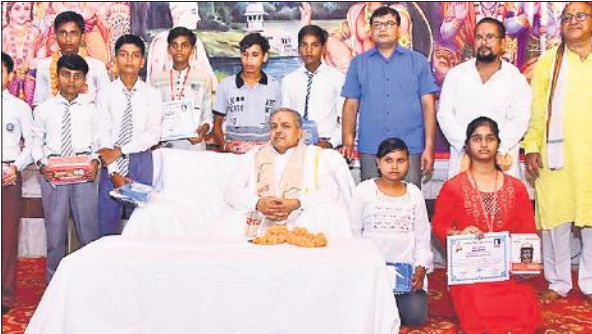
गोला में प्रश्नोत्तरी प्रतियोगिता के पुरस्कृत प्रतिभागी और साहित्यकार ।