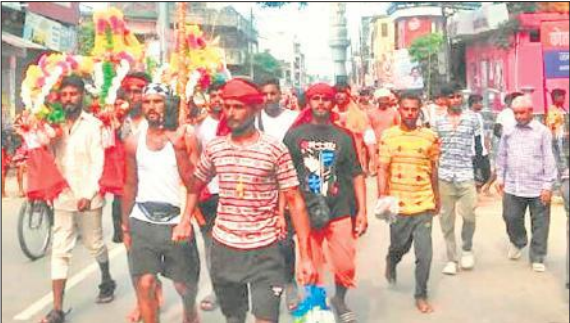
गोला की सड़कों पर जाते कांवड़िया और श्रद्धालु ।

सावन के 22 दिन बीत गए हैं। शनिवार नौ अगस्त रक्षाबंधन के दिन सावन का समापन हो रहा है। ऐसे में कम समय रह जाने से श्रद्धालुओं, कांवड़ियों की आवक बढ़ती जा रही है। नगर की सभी प्रमुख सड़कों पर कांवड़िया बम-बम भोले, हर-हर महादेव के जयकारे लगाते हुए डीजे, ढोल नगाड़ों की धुन पर नाचते, गाते