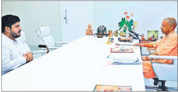
लखनऊ में मुख्यमंत्री योगी आदित्यनाथ से शिष्टाचार भेंट करते बिलाल खान।