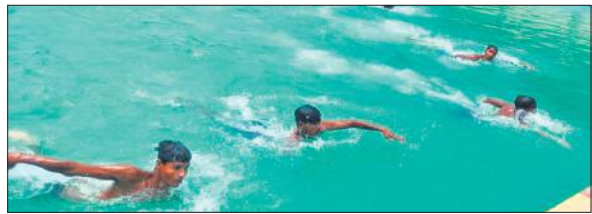
तरण ताल में तैराकी प्रतियोगिता में भाग लेते खिलाड़ी।