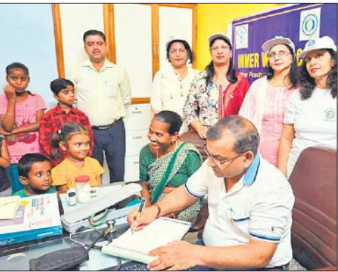
कैप में मरीजों का चेकअप करते डॉक्टर।