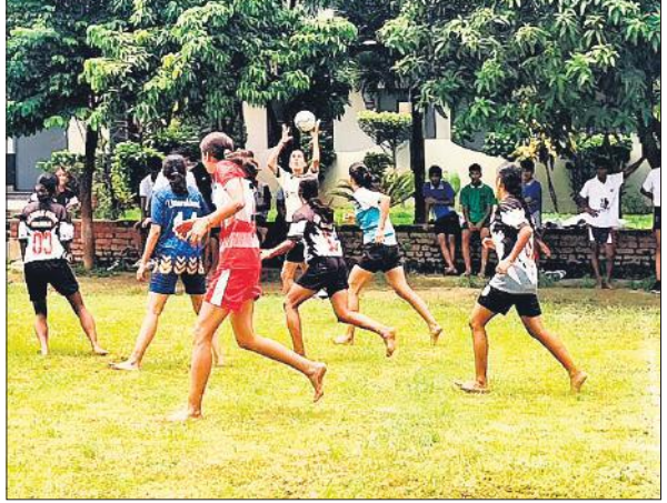
बॉलवाल में प्रतिभाग करती बालिका टीम।

प्रतियोगिता में उधम सिंह नगर, नैनीताल, अल्मोड़ा, हरिद्वार, चंपावत और पिथौरागढ़ की टीमें उतरीं। बालक वर्ग में उधम सिंह नगर विजेता और अल्मोड़ा उपविजेता रहा। बालिका वर्ग में उधम सिंह नगर ने प्रथम स्थान प्राप्त किया, जबकि नैनीताल उपविजेता रहा। विजेताओं को मेडल और प्रशस्ति पत्र देकर