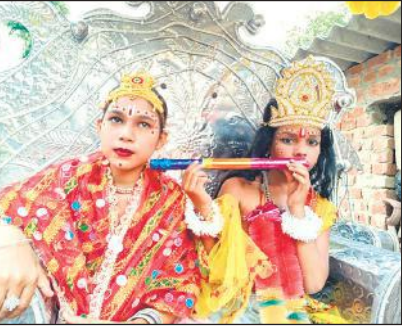
शोभायात्रा में सजी राधा कृष्ण की झांकी।