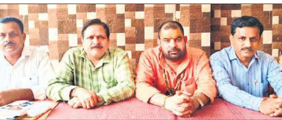
श्रीराम कथा के विषय में जानकारी देते आयोजक।