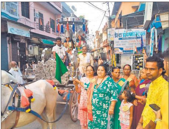
दधिकांधौ की शोभायात्रा को हरी झंडी दिखाकर रवाना करती मुख्य अतिथि।

मां, बालाजी दरबार, खाटू श्याम और काल भैरव समेत तमाम मनमोहक झांकियां शामिल रही। शोभायात्रा चौक बाजार, जेपी रोड, मोतीराम चौराहा,सुनहरी