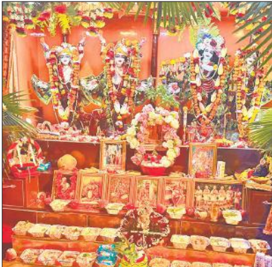
इस्कॉन मंदिर में सजी राधाकृष्ण की झांकी और छप्पन भोग।