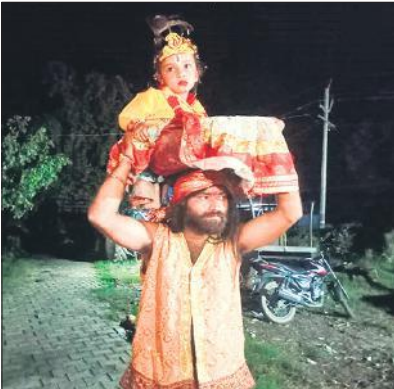
शेरपुर में झांकी प्रस्तुत करते कलाकार।