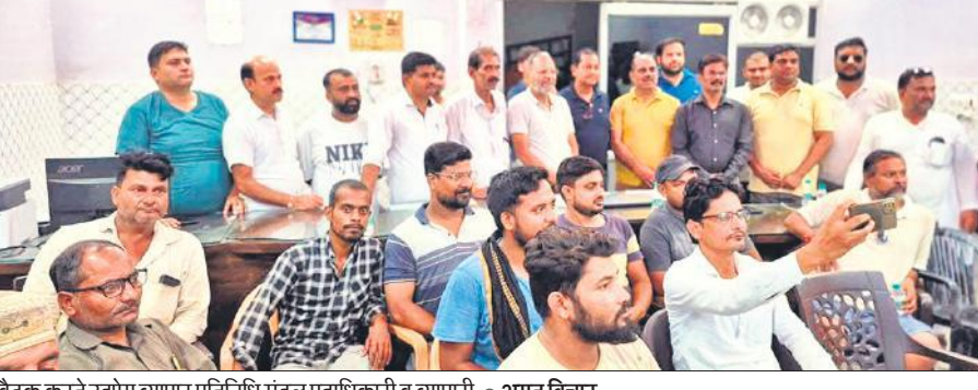
बैठक करते उद्योग व्यापार प्रतिनिधि मंडल पदाधिकारी व व्यापारी