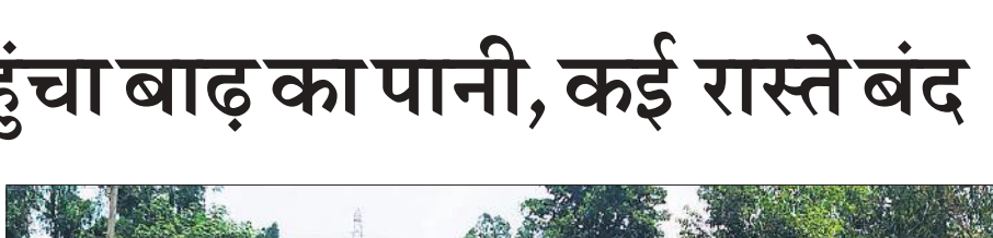
प्राथमिक विद्यालय बड़ेपुरा धारम में घुसा बाढ़ का पानी।

कॉलोनी, सुनगढ़ी, विनायक बिहार कॉलोनी, राजाबाग, रामलीला रोड, नौगांव चौराहा समेत विभिन्न इलाकों की बिजली गुल रही। काम के चलते सुबह दस से ढाई बजे तक बिजली बंद रखी गई। छह घंटे से अधिक ठप रही बिजली सप्लाई के चलते लोगों के इनवर्टर भी डाउन हो गए। इसके अलावा सनराइज कॉलोनी, चौक बाजार, डालचंद, बेनी चौधरी, मोहल्ला भुरे खां समेत कई अन्य मोहल्लों में बिजली की ट्रिपिंग जारी रही। देर शाम तक यह स्थिति बनी रही। हालांकि जिम्मेदार सोशल मीडिया पर स्थानीय लोगों को जवाब देकर संतुष्ट करने में लगे रहे।