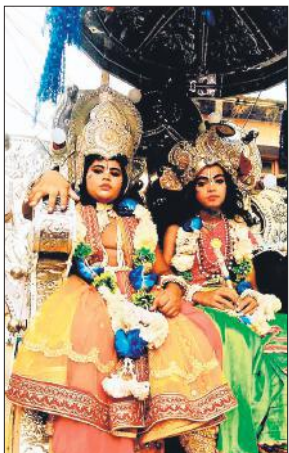
दधिकांधौ पर सजी झांकी।

अमृत विचार : कान्हा जन्मोत्सव को लेकर शहर में श्रीकृष्ण जन्माष्टमी के दूसरे दिन रविवार को 350 वर्ष से निकाली जा रही ऐतिहासिक श्रीकृष्ण नवमी दधिकांधौ शोभायात्रा निकाली गई। यात्रा में भगवान के स्वरूपों की विभिन्न झांकियां शामिल रहीं। बैड बाजों के साथ शोभायात्रा शहर के विभिन्न मार्गों से निकाली गई। जगह-जगह पुष्पवर्षा कर भव्य स्वागत किया गया। चौक बाजार स्थित ऐतिहासिक श्री लक्ष्मी नारायण देवी प्रसाद धाम मंदिर से दधिकांधौ शोभायात्रा शुरू हुई। सर्वप्रथम बलराम की आरती उतारकर सिंहासन निकाला गया। यात्रा में भगवान के स्वरूप गणेश, राम दरबार, शिव परिवार, काली