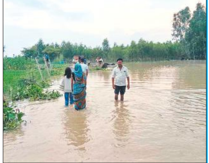
सड़क पर भरने के बीच से जाते ग्रामीण।

● चारों ओर पानी से घिरे ग्रामीण, चारा और खाद्यान्न की किल्लत ● रविवार को कुण्डरी गांव का रास्ता तीन फीट पानी में डूबा