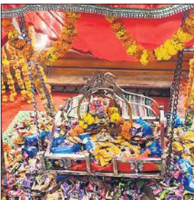
गोला में श्रीराम जानकी मंदिर में सजी झांकी।

गोला गोकर्णनाथ, अमृत विचार : श्रीकृष्ण जन्माष्टमी का पर्व नगर सहित क्षेत्र में श्रद्धा और उल्लास के साथ मनाया गया। रात में श्रीकृष्ण जन्म होते ही नगर के मंदिरों, घरों, कोतवाली में शंखनाद, घंटाघ्वनि की गूंज से छोटी काशी का माहौल श्रीकृष्ण मय हो गया। हाथी घोड़ा पालकी, जय कन्हैया लाल की आदि के जयकारों की आवाज से वातावरण कृष्ण भक्ति में सराबोर हो गया। नगर के प्रमुख मंदिरों, कोतवाली में भगवान श्रीकृष्ण की भव्य झांकियां सजाई गई। श्रीकृष्ण जन्मोत्सव पर नगर के लखीमपुर रोड स्थित हनुमान मंदिर, खुदरा रोड पर श्रीराम जानकी मंदिर, बजाज चीनी मिल परिसर में श्री लक्ष्मी नारायण मंदिर, बाकेंगंज रोड पर ब्रजधाम, लक्ष्मी नगर कॉलोनी में श्री धर्मेश्वर नाथ मंदिर, पंजाबी कॉलोनी में राम मंदिर सहित कोतवाली के मंदिर को रंग-बिरंगी आकर्षक बिजली की झालरों, फूलों की लडियों से सजाया गया। भक्तिमय संगीत से सजी भगवान श्रीकृष्ण की सुंदर झांकियां आकर्षण का केंद्र रही। घरों में नन्हें-मुन्ने बच्चों की