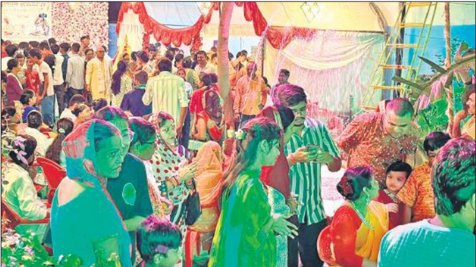
इस्कॉन मंदिर में मौजूद श्रद्धालु।