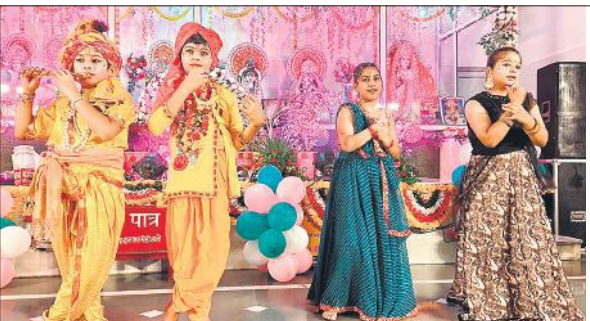
पंजाबी कॉलोनी स्थित मंदिर में आकर्षक झांकियों प्रस्तुत करते बाल कलाकार।