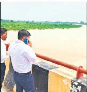
निरीक्षण एडीएम वित्त।

उन्होंने बताया इस समय गरां नदी का पानी तिलहर तहसील के खुदागंज क्षेत्र के चितआबोधि एवं बुनड्डा गांव में बढ़ रहा है, जबकि बीसलपुर एवं पीलीभीत क्षेत्र में जलस्तर कम होने लगा है। तहसील सदर के किसी भी गांव में अभी तक बाढ़ की स्थिति नहीं है। शनिवार की रात 12 बजे से सभी अधिकारी, राजस्व स्टाफ तथा आपदा मित्र विभिन्न स्थानों पर सक्रिय इयूटी पर तैनात हैं। राजस्व लेखपाल, राजस्व निरीक्षक व अन्य स्टाफ तथा आपदा मित्रों द्वारा विभिन्न क्षेत्रों में की जा