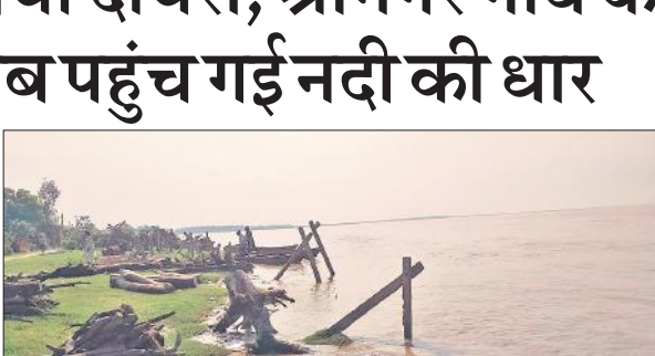
श्रीनगर गांव की ओर बढ़ती शारदा नदी की तेज धार।

दो दिन नदी का जलस्तर थोड़ा कम हुआ था, जिससे ग्रामीणों ने राहत की सांस ली थी, लेकिन रविवार को अचानक नदी का बहाव तेज हो गया। उत्तराखंड और नेपाल के पहाड़ों पर हुई भारी वर्षा को इसकी वजह बताया जा रहा है। इसके चलते ग्राम मेला घाट, आजाद नगर, श्रीनगर, जंगल नंबर 7 और