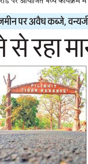
पीलीभीत टाइगर रिजर्व का प्रवेश द्वार ।

टाइगर रिजर्व अपनी जैव विविधता और बाघों के लिए प्रसिद्ध है। कई नदी-नहरें भी टाइगर रिजर्व से होकर गुजरती हैं। बाघ संरक्षण के नाम पर जनपद के जंगल को नौ जून 2014 को टाइगर रिजर्व का दर्जा तो दे दिया गया, मगर संरक्षण के नाम पर यह कुछ खास नहीं हुआ। आधा अधूरा स्टॉफ और चंद संसाधन मुहैया कराकर बाघ संरक्षण का दावा लंबे समय से अफसर और जनप्रतिनिधि करते आ रहे हैं। नतीजतन पीलीभीत टाइगर रिजर्व में बाघों का कुनबा बढ़कर 71 पार कर गया। यहीं नहीं टाइगर रिजर्व के जंगलों पर हो रहे अवैध कब्जे की वजह से बाघों के रहने-घूमने की समस्या भी पैदा होने लगी। इसी वजह से मानव-वन्यजीव संघर्ष की घटनाएं भी आम हो चुकी हैं, जो आज भी लगातार जारी हैं। अफसर इस पर अंकुश