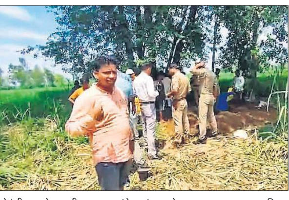
गोवंशीय पशु के वध की सूचना पर पहुंचे बजरंग दल के सदस्य ।