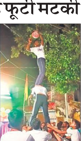
मटकी फोड़ती युवाओं की टोली ।