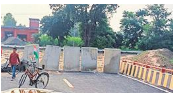
पथर लगाकर बंद किया गया नवनिर्मित बाइपास।

शहर को जाम से मुक्त रखने के लिए टनकपुर हाईवे से असम हाईवे को जोड़ने के लिए 11 किमी लंबा बाइपास स्वीकृत किया था। करीब 116 करोड़ की लागत से बनने वाले बाइपास का निर्माण वर्ष 2016 में शुरू कराया गया था। शुरुआती दौर में ही बाइपास की सड़क भी बना दी गई। इस बाइपास