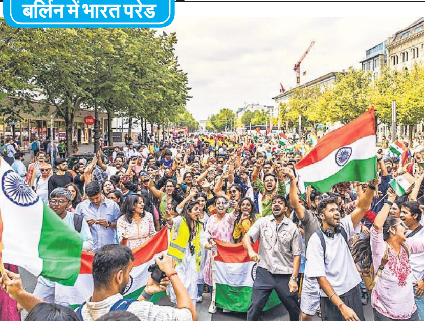
भारत का 79वें स्वतंत्रता दिवस का उत्सव दुनिया के कई और देशों में भी मनाया गया। बर्लिन के ब्रैंडेनबर्ग गेटन में रविवार को भारतीय समुदाय के लोगों ने पूरे जोशोखरोश के साथ भारत परेड निकाली।