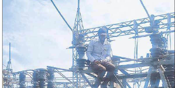
फीडर पर फॉल्ट ठीक करते बिजली कर्मचारी।

● शहर में अधिकांश जगह लाइट रही गुल, जिम्मेदार सोशल मीडिया पर दे रहे जवाब