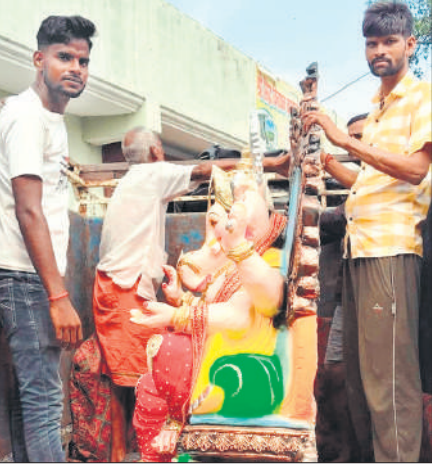
● अमृत विचार

मूड़ा सवारान, अमृत विचार : गणेश चतुर्थी का उत्सव बुधवार से प्रारंभ हो गया। पंडालों में भगवान गणेश की स्थापना की गई। मंगलवार शाम से ही क्षेत्र में उत्सव का माहौल रहा, ग्रामीण क्षेत्र में पंडाल सजाए गए हैं, जहां एक सप्ताह तक कीर्तन, भजन संध्या, सांस्कृतिक कार्यक्रम और धार्मिक आयोजन किए जाएंगे। क्षेत्र के भदेड, भैटिया, भटपुरवा कॉलोनी, कुसमी कॉलोनी, वसलीपुर, बिजुआ, भीरा आदि स्थानों पर बुधवार को पूजा पंडालों में विधि विधान और उल्लास के साथ प्रतिमाओं की स्थापना की गई है। जहां गणेश उत्सव एक सप्ताह तक धूमधाम से मनाया जाएगा। गणपति स्थापना में महिलाएं पुरुष और बच्चे शामिल हुए। पूरा क्षेत्र गणपति बप्पा मोरिया के जयकारों से गुंजायमान हो उठा। श्रद्धालुओं ने बैड बाजों की धुन पर जयकारे लगाए। भजन कीर्तन के मध्य रंग गुलाल की होली खेली गई।