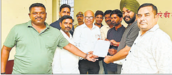
एसडीएम को ज्ञापन सौंपते ग्राम प्रधान।