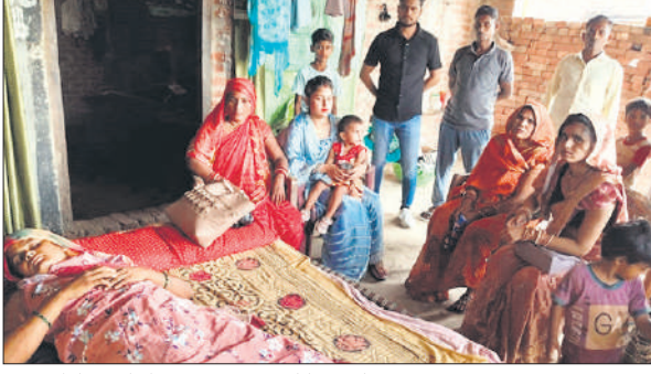
बदमाशों के हमले से घायल महिला व मौके पर मौजूद महिलाएं।