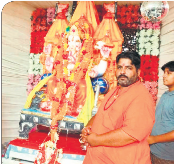
द्वारिकाधीश मंदिर चौक बाजार में की गई गणपति की स्थापना।