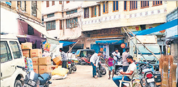
शहर की गल्ला मंडी। ● अमृत विचार

अमृत विचार: जिले में पहली सितंबर से सर्किल रेट बढ़ जाएगा। ऐसे में आवासीय और व्यावसायिक दोनों तरह की जमीनों को खरीदना महंगा होगा। जमीनों के रेट 15 प्रतिशत तक बढ़ा दिए गए हैं, जिसकी प्रस्तावित सूची जारी कर दी गई है। साथ ही 28 अगस्त तक आपत्तियां मांगी गई हैं। दो दिनों में आपत्तियों के निस्तारण के बाद एक सितंबर से नए सर्किल रेट चालू कर दिए जाएंगे। शहर में जमीनों के रेट सड़क की चौड़ाई के हिसाब से निर्धारित किए गए हैं यानी जितनी चौड़ी सड़क है, उतने महंगे जमीन के रेट हैं। शहर में गुड़ मंडी, पुरानी गल्ला मंडी और रानीगंज क्षेत्र की जमीन सबसे महंगी है। छह से नौ मीटर तक चौड़ी सड़क वाली जमीन का रेट 30 हजार से