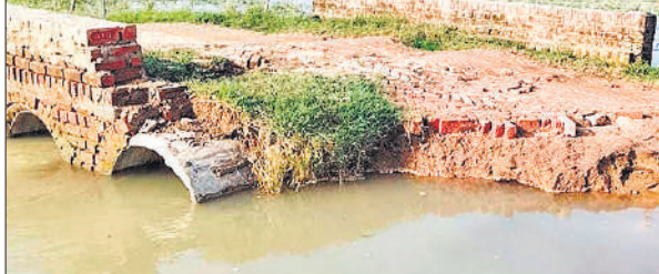
बाढ़ के पानी से कटी पुलिया।