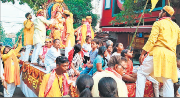
गोला में स्थापना के लिए गणेश प्रतिमा ले जाते भक्त।