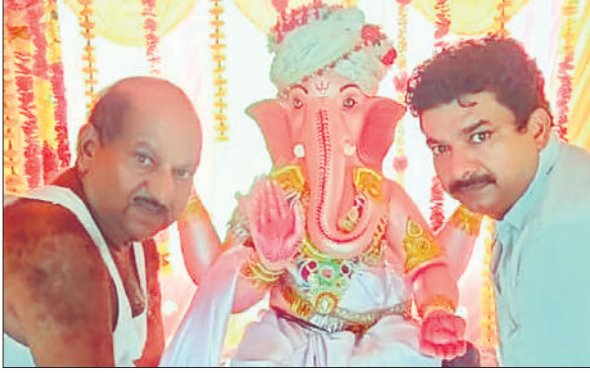
श्री गणेश जी का पूजन करते श्रद्धालु।