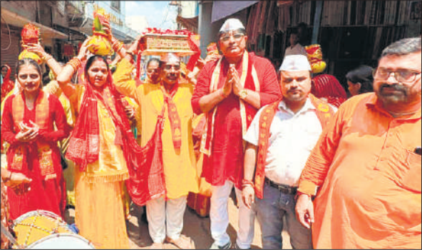
पूरनपुर में निकाली गई यात्रा में शामिल भक्त।