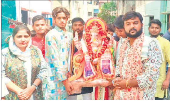
कांशीराम कॉलोनी ईदगाह में बप्पा को ले जाते भक्त।