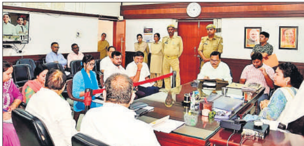
लंबित वादों की समीक्षा करती डीएम दुर्गा शक्ति नागपाल।