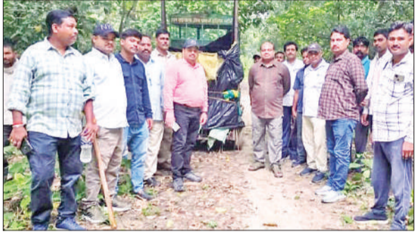
पिंजड़ा सहित बाघिन ले जाने के लिए पहुंचे वन अधिकारी और कर्मचारी।