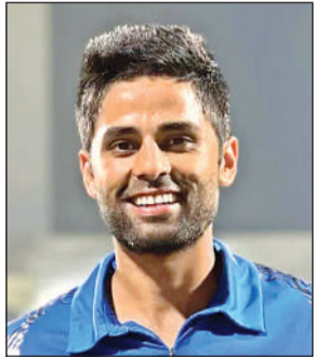
कप्तान सूर्यकुमार यादव।

14 सितंबर को दुबई में चिर प्रतिद्वंद्वी पाकिस्तान से मुकाबला करेगा भारत।