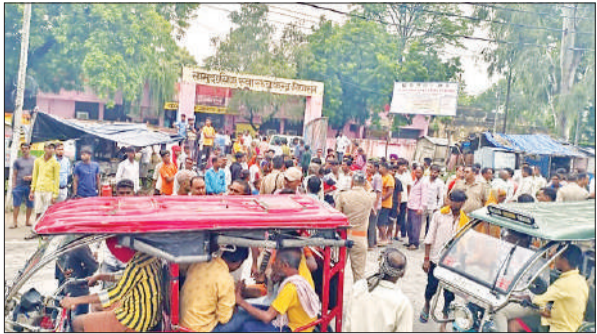
सीएचसी पर उमड़ी लोगों की भीड़।