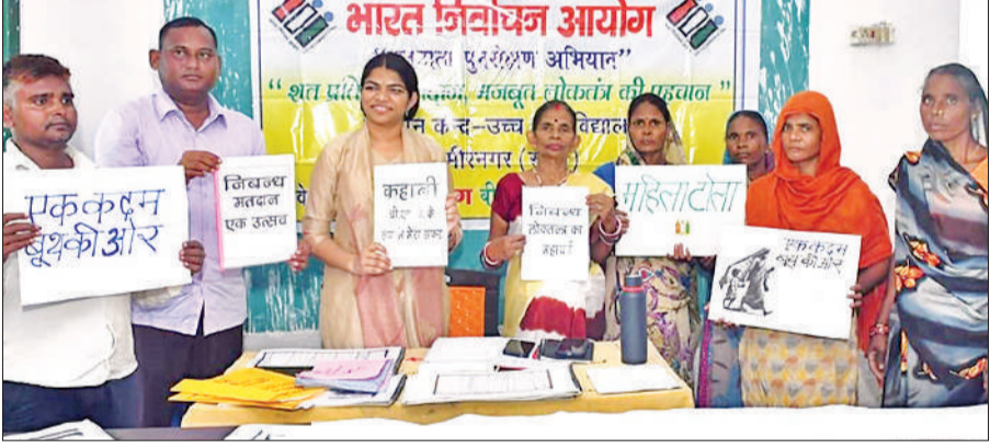
अमीरनगर बूथ पर स्लोमन लिखे पोस्टर दिखाते बीएलओ मित्र और महिला टीम।