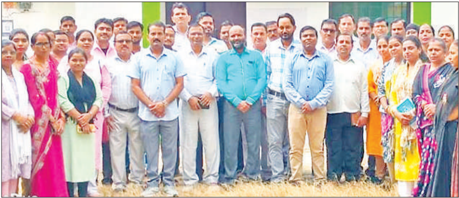
ब्लॉक संसाधन केंद्र कंजा में प्रशिक्षण में मौजूद शिक्षक।

अमृत विचार: बिजली विल में खेल कर और कनेक्शन काटने और जोड़ने के नाम पर वसूली करने और उपभोक्ताओं के साथ अमर्यादित भाषा का उपयोग करने के आरोपी तिकुनिया बिजली उपकेंद्र के जेई के बचाव में निधासन विद्युत वितरण खंड तृतीय के अधिकारी आ गए हैं और आरोपों पर लीपापोती करना शुरू कर दी है। इससे उपभोक्ताओं में रोष है। उपभोक्ताओं ने निष्पक्ष जांच न होने पर ऑडोलन की चेतावनी प्रबंध निदेशक मध्यांचल विद्युत वितरण निगम को दी है।