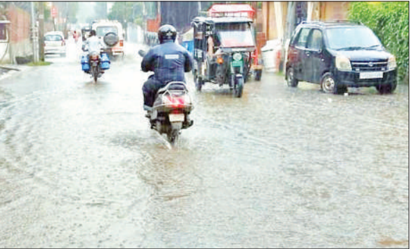
छतरी चौराहा से रेलवे स्टेशन जाने वाले मार्ग पर जलभराव से गुजरते राहगीर।

बारिश के बाद जलभराव की दिक्कत रही। वहीं, आधे अधूरे निर्माण कार्य और जर्जर सड़कों की वजह से दिक्कत हुई। हाईवे से लेकर शहर के भीतर कई रास्तों पर गहरे गड्ढे हैं। जिनमें पानी भरने के बाद राहगीरों को हादसे का डर बना रहा। कुछ राहगीर गड्ढों का अंदाजा न लगने पर गिर भी गए।