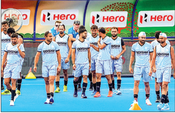
राजगीर स्पोर्ट्स कॉम्प्लेक्स में अभ्यास करती भारतीय पुरुष हॉकी टीम।

लीग में सातवें स्थान पर खिसक गया। भारत ने आठ में से सिर्फ एक मैच जीता और सात मैच लगातार हारे जिससे कोच क्रेग फुल्टन को एशिया कप में अपनी सर्वश्रेष्ठ टीम