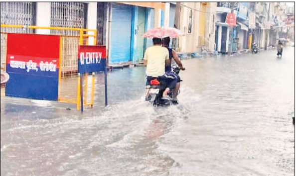
सुनहरी मस्जिद चौराहा के पास मुख्य मार्ग पर भरा पानी।

व्यवस्था नहीं सुधर सकी। गुरुवार सुबह से ही मौसम बदला रहा। तेज बारिश हुई और कुछ ही देर में सड़कें तालाब का रूप ले गईं। बारिश से कई दिनों से पड़ रही गर्मी से कुछ राहत मिली। अधिकतम तापमान 30.1 डिग्री सेल्सियस और न्यूनतम 25.5 डिग्री सेल्सियस दर्ज किया गया। नाले-नालियां चोक होने के चलते बारिश के दौरान ही