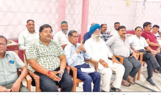
बैठक में व्यापार मंडल व सामाजिक संगठनों के मौजूद पदाधिकारी। ● अमृत विचार

● व्यापार मंडल व सामाजिक संगठनों ने बैठक में आवाज की बुलंद ● कोर कमेटी का गठन करने पर बनी सहमति हैं और लोगों को भारी दिक्कतों का सामना करना पड़ रहा है। लोगों की इस परेशानी को देखते हुए एक कोर कमेटी की गठन की बात की गयी। वर्षों से मीटर गेज पर अटक रही रेलवे व्यवस्था को अब ब्रॉड गेज में बदला जाए और नियमित ट्रेनों का संचालन जल्द शुरू हो। बैठक में एक कोर कमेटी के गठन की बात कही गई, जो रेल विभाग से लेकर रेल