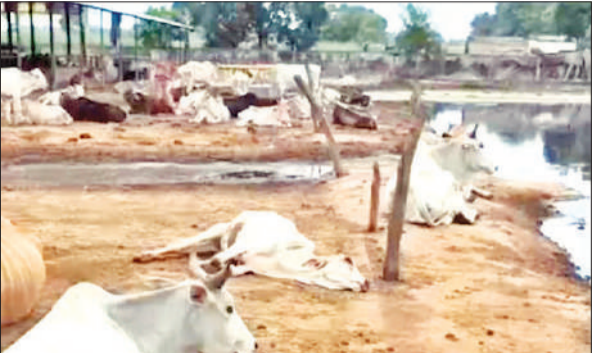
गोशाला में भूख-प्यास से तड़पते पशु।