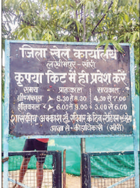
लाल स्टेडियम में लगा बोर्ड।