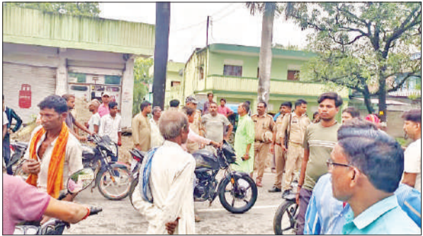
शांति व्यवस्था बनाए रखने के लिए तैनात पुलिस बल।

सूचना पर पीआरवी के जवान मौके पर पहुंचे और उसे सीएचसी भेजा, जहां डॉक्टर ने उसे मृत घोषित कर दिया। इसकी खबर