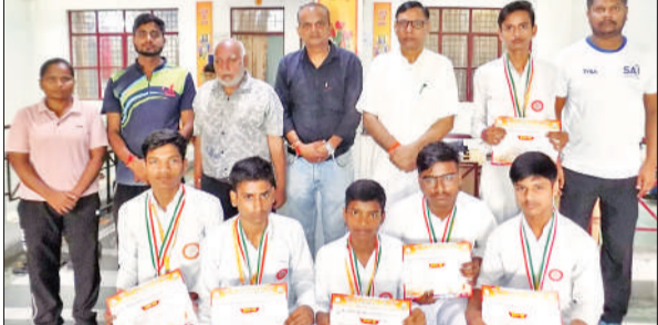
मेडल और प्रशस्ति पत्र के साथ उपविजेता टीम।