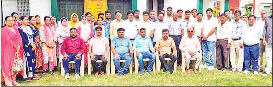
बांकेगंज बीआरसी में प्रशिक्षण के समापन अवसर पर मौजूद शिक्षक/शिक्षिकाएं।