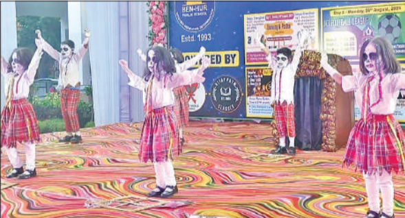
जेसीआई वीक के तहत ग्रुप डांस करते बच्चे।

स्कूल और लॉर्ड कृष्णा स्कूल संयुक्त रूप से प्रथम स्थान पर रहे। उसके पब्लिक स्कूल मझोला ने द्वितीय स्थान और बेनहर पब्लिक स्कूल व स्पर्श वर्ल्ड स्कूल ने तृतीय स्थान प्राप्त किया। जूनियर वर्ग में स्पर्श वर्ल्ड स्कूल प्रथम, अवध पब्लिक स्कूल और उसके पब्लिक स्कूल मझोला द्वितीय, ज्ञान