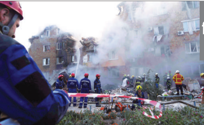
गुरुवार को यूक्रेन के कीव में रूसी हमले में नष्ट हुए एक घर पर काम कर रहा बचाव दल।

जब उनसे पूछा गया कि क्या उनका मतलब 'पुतिन का युद्ध' है तो नवारो ने दोहराया, मेरा मतलब मोदी का युद्ध है क्योंकि शांति का रास्ता आंशिक रूप से नई दिल्ली से होकर जाता है। ट्रंप ने रूसी तेल की खरीद के लिए भारत पर 25 प्रतिशत का अतिरिक्त शुल्क लगाया है, जो बुधवार से प्रभावी हो गया है। इसके साथ ही अमेरिका द्वारा भारत पर लगाया गया कुल शुल्क 50 प्रतिशत हो गया है। नवारो ने दावा किया कि भारत