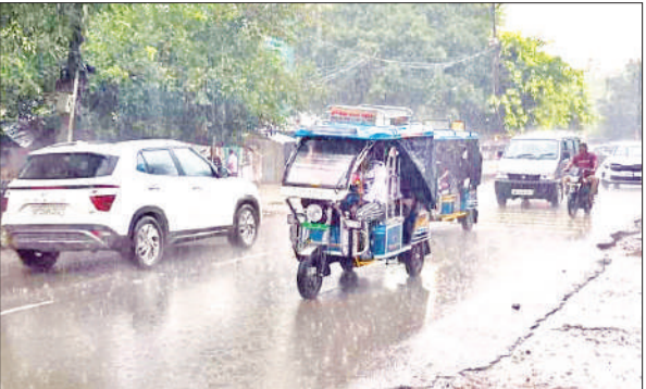
नकटादाना चौराहा पर बारिश के बीच गुजरते वाहन।