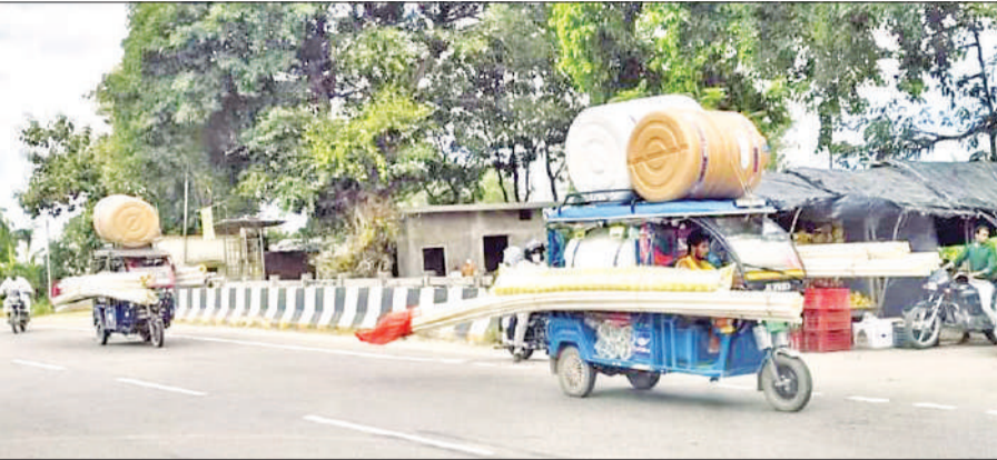
पीलीभीत-पूरनपुर हाईवे पर जरा पुलिस चौकी के सामने से सामान लादकर गुजरते ई-रिक्शा।

जनपद में ई-रिक्शा चालक बेलगाम होते जा रहे हैं। बता दें कि जनपद में करीब साढ़े तीन हजार ई-रिक्शा पंजीकृत हैं, जबकि सच्चाई यह है कि सड़कों पर करीब 10 हजार से अधिक ई-रिक्शा दौड़ रहे हैं। इनमें कई तो नाबालिग चला रहे हैं। जिससे जाम के अलावा हादसे का डर बना हुआ है। इसको कहीं न कहीं जिम्मेदार भी दबी जुबान स्वीकार करते हैं। पिछले महीनों में मुख्यमंत्री ने अवैध रूप से संचालित इन वाहनों पर कार्रवाई के आदेश दिए थे।