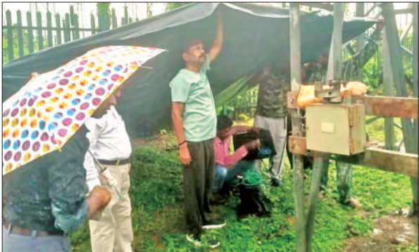
बारिश के बीच नकटादाना लाइन की खराबी ठीक करती पावर कॉरपोरेशन की टीम।

इधर, ठेकेदार ने लेबर लगाकर इसका आनन-फानन में सुधार शुरू करा दिया। ये तर्क दिया जाता रहा कि ढहने वाला हिस्सा एक दिन पहले ही बनवाया गया था। फिर स्थानीय लोगों ने घर के आगे की मिट्टी डाल दी, जिसके बाद ये हिस्सा गिर गया था। फिलहाल मामला चर्चा का विषय बना हुआ है।