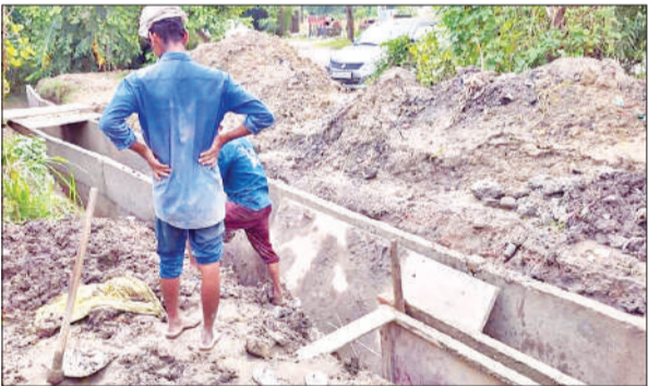
बनकटी रोड पर गिरे निर्माणाधीन नाले का सुधार करती लेबर।