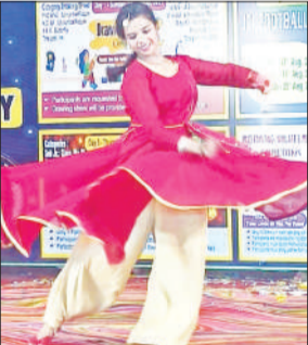
डांस की प्रस्तुति देती छात्रा।

अमृत विचार: जेसीआई वीक के दूसरे दिन बुधवार रात रंगारंग कार्यक्रम आयोजित किए गए। बच्चों ने रंग-बिरंगी पोशाकों में सजकर जोश से भरपूर प्रस्तुतियों के साथ ग्रुप डांस किया। जिसे खासा सराहा गया। किड्स वर्ग में अवध पब्लिक स्कूल ने प्रथम स्थान प्राप्त किया द्वितीय स्थान पर बेनहर पब्लिक स्कूल और ज्ञान इंटरनेशनल स्कूल संयुक्त रूप से रहे। तृतीय स्थान बेनहर किड्स वर्ल्ड और शेमरॉक किरण स्कूल को मिला। सब-जूनियर वर्ग में लिटिल एंजल्स