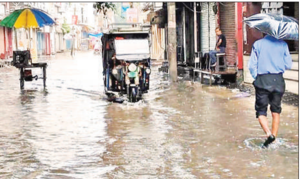
मुख्य बाजार में छीपियान चौराहा के पास जलभराव।

मानसून में शहर की सड़कों पर जलभराव न हो, इसके लिए नगर पालिका की ओर से कई नए नाले बनवाए गए हैं। वहीं, नालों की तली झाड़ सफाई में लाखों का खर्च किया