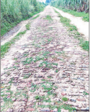
दो विधानसभा क्षेत्र को जोड़ने वाला रोड।

बिहारी में दो साप्ताहिक बाजारों को सैकड़ों महिलाएं, पुरुष दैनिक जीवन का सामान लेने जाती हैं। दोनों विधानसभाओं के मध्य लगभग तीन किलोमीटर