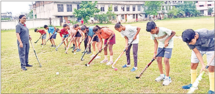
हॉकी खिलाड़ी : हर रोज दिखाता है जहान जीत लेने का जज्बा।