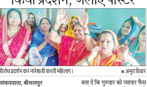
विरोध प्रदर्शन कर नारेबाजी करती महिलाएं।