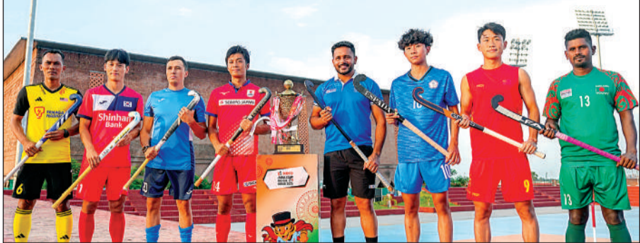
भारतीय कप्तान हरमनप्रीत सिंह अन्य प्रतिस्पर्धी टीमों के अपने समकक्षों के साथ गुरुवार को बिहार के राजगीर में पुरुष एशिया कप हॉकी टूर्नामेंट से पहले ट्रॉफी के साथ फोटो सेशन कराते हुए।

मैंने मैच की शुरुआत में कुछ लक्ष्य बनाए थे, और मैं पहली गेंद से लेकर आखिरी गेंद तक उन पर अमल करने की कोशिश कर रहा हूं। इसी चीज ने मुझे मैच में बने रहने, सकरात्मक बने रहने, हर समय आक्रामक बने रहने में बहुत मदद की। -कार्लोस अल्काराज