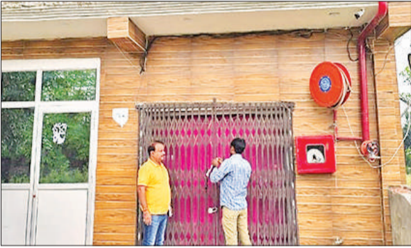
अस्पताल में सील लगाते कर्मचारी।