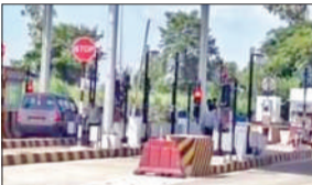
पीलीभीत-बीसलपुर मार्गपर स्थित टोल प्लाजा।

ज्ञापन में उन्होंने कहा कि बीसलपुर के ग्राम सिमरा अकबरगंज के समीप नेशनल हाईवे द्वारा टोल प्लाजा का निर्माण कराकर वाहन चालकों से शुल्क वसूलना शुरू कर दिया गया है। यह टूलेन मार्ग है। मार्ग के मध्य में जगह-जगह आबादी वाले गांव व कस्बे हैं। नेशनल हाईवे द्वारा पूर्व में निर्मित नाले तोड़ दिए गए हैं। नेशनल हाईवे द्वारा बनाए गए नाले अभी अधूरे हैं। बीसलपुर से खुदागंज को जाने वाला मार्ग घुंड़ीघाट के पक्के पुल का निर्माण अभी अधूरा है। इन तमाम खामियों के बावजूद टोल प्लाजा संचालित कर दिया गया है। टूलेन मार्ग पर वाहन चालकों से शुल्क न लिए जाने की घोषणा भी की जा चुकी है। ऐसे में उक्त टोल प्लाजा पर रोक लगाने की मांग की।