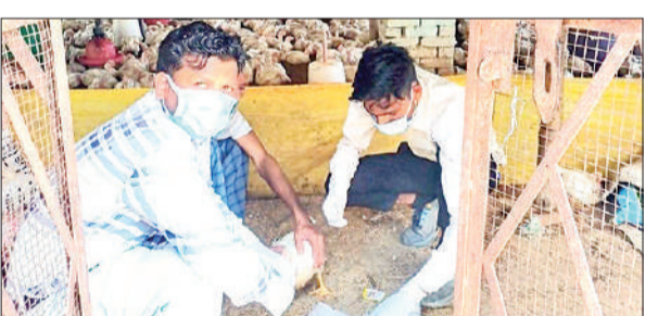
पोल्ट्री फार्म से सैंपल लेती टीम।