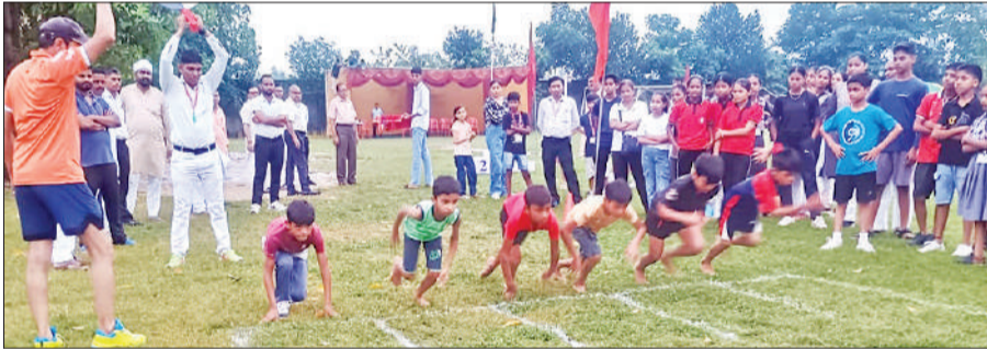
दौड़ प्रतियोगिता में प्रतिभाग करते बच्चे।