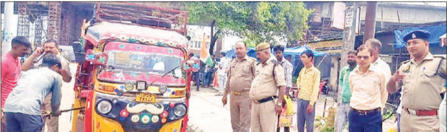
असम चौराहा पर वाहन में अलग से लगाई गई सीट हटवाती टीम।