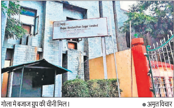
गोला में बजाज गुप की चीनी मिल।