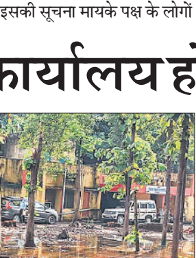
डीआईओएस कार्यालय का जर्जर भवन।