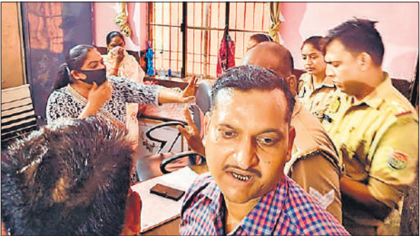
संविदा स्टाफ नर्स को समझाती पुलिस।