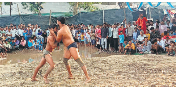
बरखेड़ा मेले में दंगल में भिड़ते पहलवान।