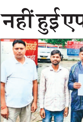
सुनगढ़ी थाने में ज्ञापन देने पहुंचे पंचायत राज सफाई कर्मचारी संघ के पदाधिकारी।

फार्म संचालक से पूरी जानकारी ली। सुरक्षा की दृष्टि से सभी पोल्ट्री उत्पाद को केजीएन पोल्ट्री फार्म पर उतरवाकर संचालक की सुपुर्दगी में दे दिए। टीम ने सैंपल लेकर जांच के लिए आईवीआरआई बरेली भेजा हैं।