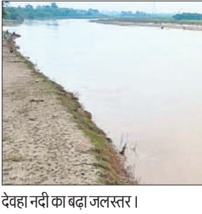
देवहा नदी का बढ़ा जलस्तर।