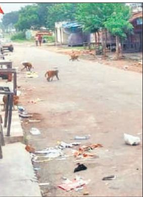
मैलानी बाजार में उत्पात मचाते बंदर।