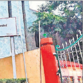
गोला में बजाज गुप की चीनी मिल।

मार्च तक चीनी मिल ने 137.99 लाख क्विंटल गन्ना खरीदा, जिसका भुगतान 50681.84 लाख रुपया हुआ। चीनी मिल द्वारा 14 दिन के अंदर भुगतान न करने पर किसानों का आर्थिक शोषण हुआ, जिसके लिए किसान संगठनों ने आवाज बुलंद की, लेकिन मिल प्रबंधन पर कोई असर नहीं हुआ। जिला गन्ना अधिकारी के कई पत्र