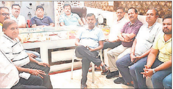
बैठक में मौजूद अखिल भारतीय उद्योग व्यापार मंडल के पदाधिकारी।