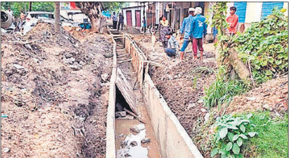
बनकटी रोड पर चल रहा नाला निर्माण कार्य।

गुरुवार को बारिश के बाद नाले की 20 मीटर दीवार ढह गई थी। इसका आनन-फानन में सुधार शुरू