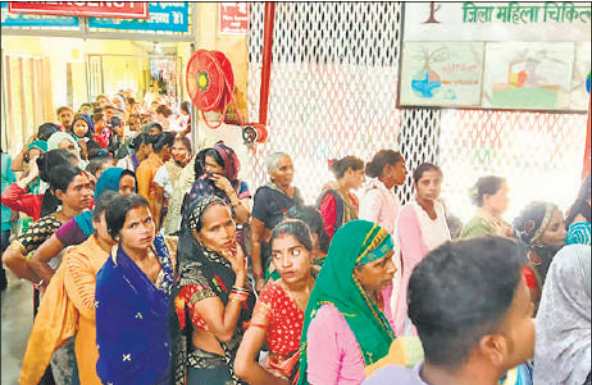
महिला दवा काउंटर पर लगी मरीजों की लाइनें।

इसके अलावा एंटी रैबीज के इंजेक्शन लगने वाले मरीजों की तादाद भी तेजी से बढ़ रही है। कुत्ते, बिल्ली और बंदर काटे हुए के करीब 100 से अधिक मरीज इंजेक्शन लगवाने के लिए पहुंचे। सीएमएस डॉ. रमाकांत सागर ने बताया कि बारिश की वजह से ओपीडी में बुखार से संबंधित मरीजों की