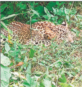
खेत में पकड़ा गया शावक।