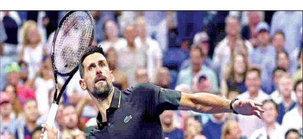
पीठ की समस्या से उबरते हुए शानदार प्रदर्शन करते हुए नोवाक जोकोविच।