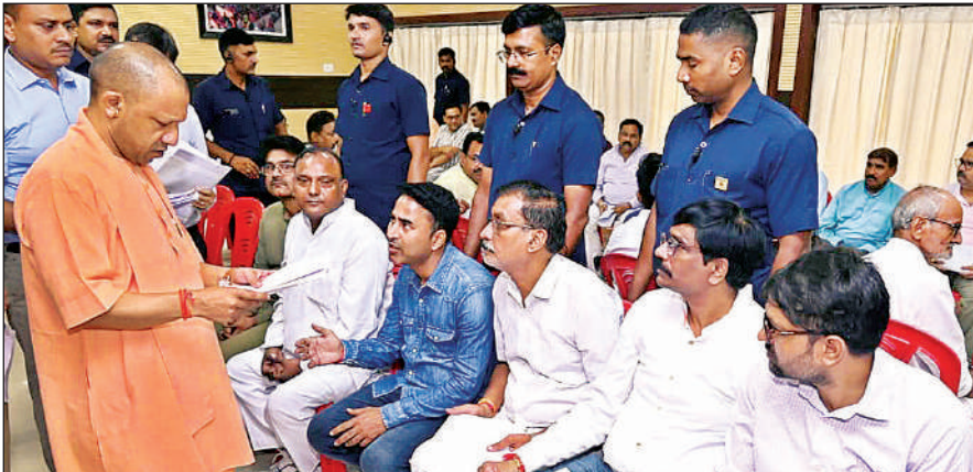
वाराणसी में आयोजित जनता दर्शन में फरियादियों की समस्या सुनते मुख्यमंत्री योगी।

जनता दर्शन में पहुंचे एक दिव्यांग फरियादी ने नेत्रहीनों के लिए डिजिटल लाइब्रेरी व एक कलाकार ने प्रदर्शनी लगाने के लिए उचित दर पर हॉल की मांग की। सीवर कनेक्शन, कच्ची