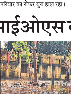
डीआईओएस कार्यालय का जर्जर भवन।