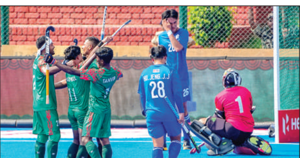
चीनी ताइपे के खिलाफ गोल करने के बाद जश्न मनाते हुए बांग्लादेश के खिलाड़ी।