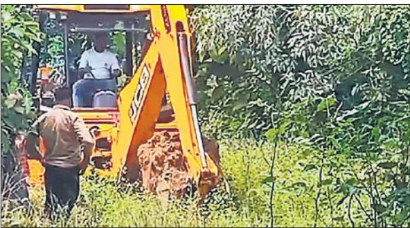
मृत मुर्गों को जेसीबी से गड्ढा खोदकर दफन करते कर्मचारी।