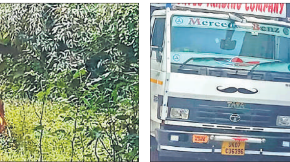
टीम द्वारा पकड़ी गई डीसीएम।

एक डीसीएम पोल्ट्री उत्पाद सप्लाई करने आ रही है। सूचना मिलते ही पशुपालन विभाग अलर्ट हो गया। मुख्य पशु चिकित्सा अधिकारी ने पुलिस अधिकारियों से संपर्क साधा। जानकारी मिली कि डीसीएम पोल्ट्री उत्पाद लेकर टनकपुर हाईवे से होते हुए शहर की ओर आ रही है। इस पर मुख्य पशु चिकित्साधिकारी समेत विभागीय कर्मचारियों ने पुलिस के सहयोग से शहर में सदर पशु चिकित्सालय के सामने डीसीएम को पकड़ने का प्लान बनाया। टीम को सुबह करीब 9.45 बजे टनकपुर हाईवे पर न्यूरिया की ओर से आती हुई एक डीसीएम दिखी। टीम ने पुलिस के सहयोग से