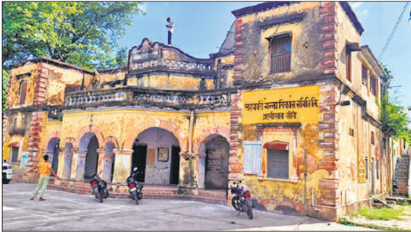
सहकारी गन्ना विकास समिति लिमिटेड, अरनीखाना का भवन।