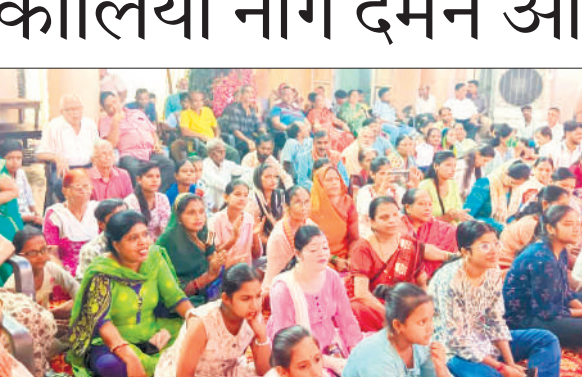
कार्यक्रम में मौजूद श्रद्धालु।