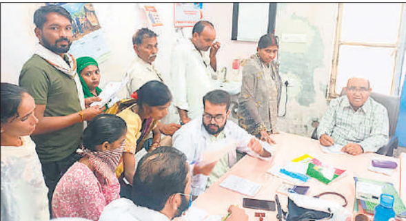
मेडिकल कॉलेज की ओपीडी में मरीजों का चेकअप करते डॉक्टर।

अलावा नेत्र विशेषज्ञ के कक्ष में भी मरीजों की भीड़ देखने को मिल रही। जिससे मरीजों को काफी दिक्कतों का सामना करना पड़ा। बारिश के बाद मौसम में बदलाव से ओपीडी में बुखार, खांसी, जुकाम, बदन दर्द, उल्टी दस्त के अलावा बच्चों और