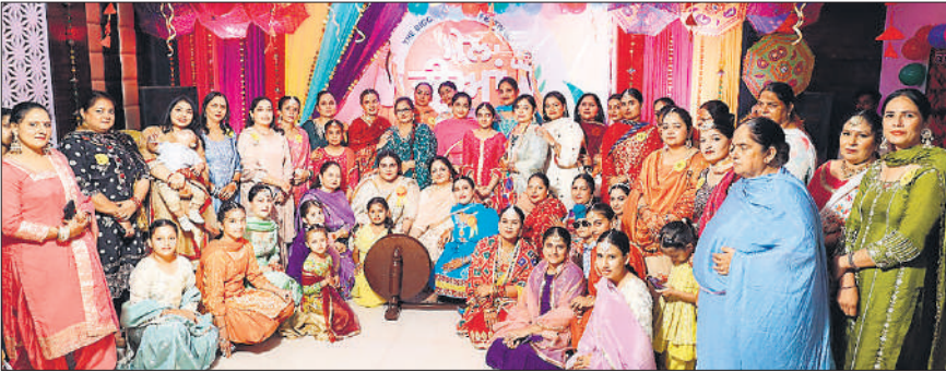
पूरनपुर के होटल में हुए तिया दा मेले में शामिल महिलाएं।