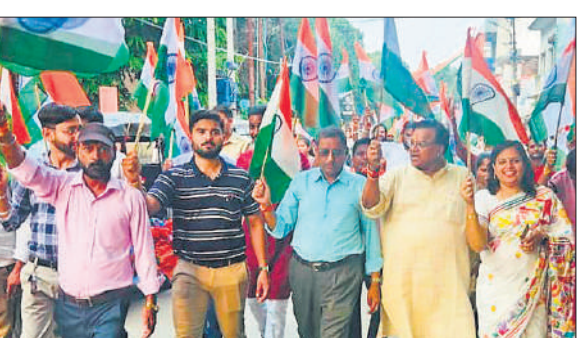
शहर में निकाली गई तिरंगा यात्रा में मौजूद भाजपा नेता।