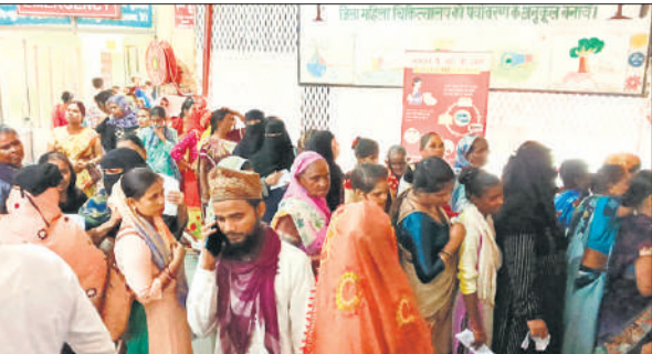
महिला दवा काउंटर पर उमड़ी भीड़।

बुधवार सुबह 8 बजे से ही ओपीडी पचां काउंटर पर मरीजों