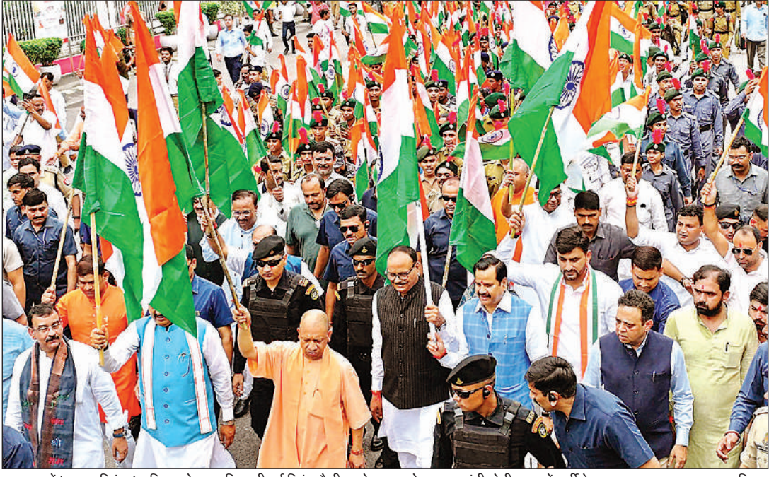
लखनऊ में 'हर घर तिरंगा' अभियान के तहत निकाली गई तिरंगा रैली का नेतृत्व करते हुए मुख्यमंत्री योगी, साथ में पार्टी नेता व अन्य।

सपा प्रमुख ने बुधवार को जारी बयान में कहा कि भाजपा सरकार के पास प्रदेश की जनता के लिए कोई