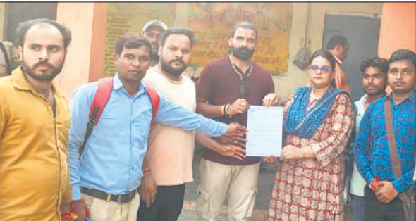
एसडीएम को ज्ञापन देते अखिल भारत हिंदू महासभा कार्यकर्ता।

जिला मुख्यालय से माधोटांडा रोड पर पांच किमी दूर स्थित देवीपुरा