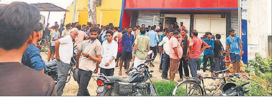
जच्चा-बच्चा की मौत के बाद अस्पताल के बाहर लगी भीड़।