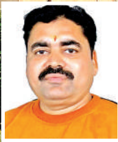
लेखक : लालजी बाजपेयी

हाल ही में राज्यों के आधार पर जारी आईआईआरएफ रैंकिंग 2025 में चंद्रशेखर आजाद कृषि एवं प्रौद्योगिकी विश्वविद्यालय (सीएसए) ने देश भर के कृषि विश्वविद्यालयों की सूची में चौथा और उत्तर प्रदेश में पहला स्थान हासिल किया है। इस रैंकिंग में देश के सभी राज्य विश्वविद्यालय को शामिल किया गया था।