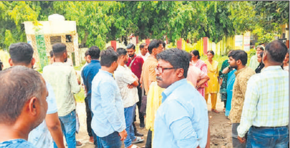
पुलिस अधीक्षक कार्यालय के बाहर लगी हिंदू संगठनों के लोगों की भीड़। ● अमृत विचार

प्रतिबंधित मांस काटने में दो गिरफ्तार: रोजा। रामचंद्र मिशन पुलिस को बुधवार की सुबह छह बजे सूचना मिली कि कसाइयों वाली पुलिसा के पास दो लोग प्रतिबंधित मांस काट रहे हैं। पुलिस ने मौके पर दो लोगों को पकड़ लिया।