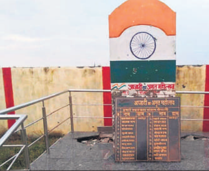
स्वतंत्रता सेनानियों की स्मृति में बनाया गया स्मारक।

देश जब आजादी की लड़ाई अंग्रेजों से लड़ रहा था और अंग्रेज हिंदुस्तानियों पर जुल्म पर जुल्म दार रहे थे। इसी समय जनपद के तहसील बीसलपुर के गांव खांडेपुर में मौजूद रणबांकुरों के दिलों में भी आजादी की आग भड़क उठी और वह देश को आजाद कराने के लिए एकत्र होकर अंग्रेजी हुकूमत के विरुद्ध जंग छेड़ी थी। उन्होंने