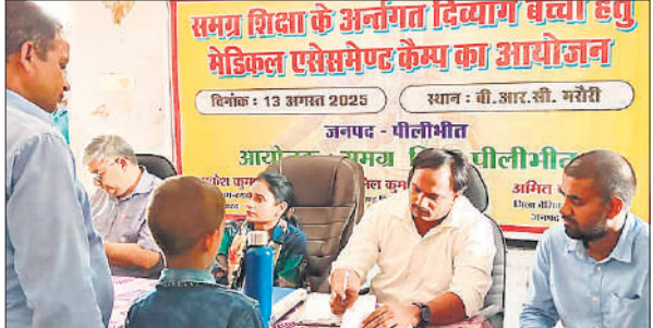
बीआरसी मरौरी में मौजूद टीम।