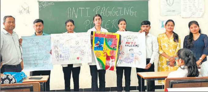
एंटी रैगिंग को लेकर बनाए गए पोस्टर दिखाते छात्र-छात्राएं।

समापन दिवस पर कम्युनिटी मेडिसिन विभाग के इंटरन डॉक्टर ने जागरूकता नाटक प्रस्तुत किया। नाटक में यह संदेश दिया गया कि रैगिंग किस प्रकार विद्यार्थियों के आत्मविश्वास और शैक्षणिक प्रगति को प्रभावित करती है। छात्रों ने बताया कि यह परंपरा न केवल कानूनन अपराध है बल्कि मानवता और शिक्षा दोनों के लिए घातक