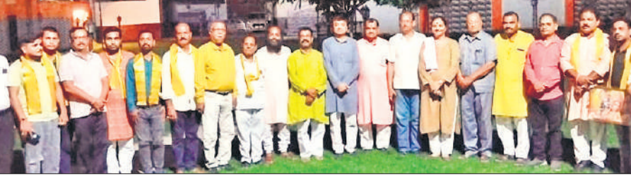
शहर के एक लॉन में आयोजित उत्तर प्रदेश व्यापार मंडल की बैठक के बाद मौजूद पदाधिकारी व कार्यकर्ता।

अमृत विचार : पिछले कई दिनों से मौसम साफ रह रहा है। सुबह की धूप खिल रही है। मौसम साफ होने से उमस बढ़ गई है। उमस बढ़ने से लोग गर्मी से परेशान होने लगे हैं। धूप खिलने से तापमान में भी वृद्धि हो रही है। सोमवार को अधिकतम तापमान 36 व न्यूनतम 27 डिग्री दर्ज किया गया। हवा की गति 13 किलोमीटर प्रति घंटा रही। वातावरण में नमी की मात्रा 72 प्रतिशत रही। रविवार के मुकाबले सोमवार को अधिकतम तापमान दो डिग्री बढ़ा है। कृषि विभाग के अधिकारियों की मानें तो यह मौसम खरीफ की फसलों के लिए प्रतिकूल माना