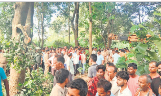
मौके पर लगी ग्रामीणों की भीड़।

● खुटार क्षेत्र के कई गांवों में फैली थी दहशत, लोग रातभर जागकर कर रहे थे रखवाली