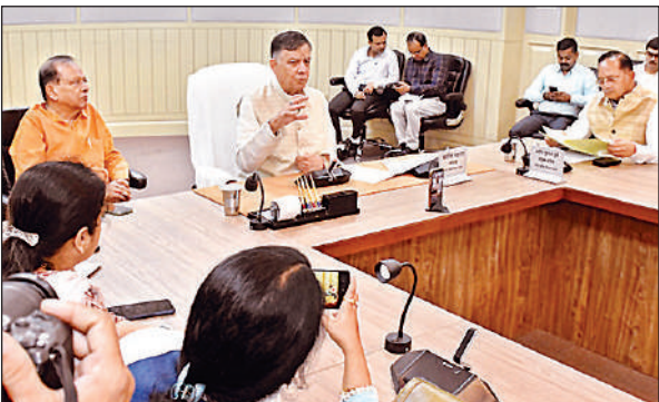
विधान भवन में पत्रकारों से वार्ता करते विधानसभा अध्यक्ष सतीश महाना।

सोमवार को विधानभवन में पत्रकारों से मुख्यातिब राज्य विधानसभा अध्यक्ष सतीश महाना ने कहा कि उप्र. अठारहवीं विधानसभा का वर्ष 2025 का द्वितीय सत्र अपने रचनात्मक विमर्श और अनुशासित कार्यवाही के लिए स्मरणीय बन गया। इस सत्र में विकसित भारत–विकसित उत्तर प्रदेश, आत्मनिर्भर भारत–आत्मनिर्भर उत्तर प्रदेश, विषय पर लगातार दो दिनों तक निरंतर चर्चा हुई, जिसने लोकतांत्रिक परंपरा को और अधिक मजबूती मिली।