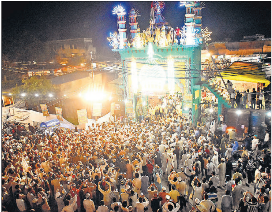
इस्लामियां गेट पर जायरीन।

मंत्री ने रामगंगा और उसकी सहायक नदियों के जलस्तर पर भी चर्चा की। अफसरों ने बताया कि बरेली में बाढ़ खंड की ओर से नौ कटान निरोधक प्रोजेक्ट पूरे किए गए हैं, जिससे कई गांव और तटबंध सुरक्षित हुए हैं। मंत्री ने तटबंधों की सख्त निगरानी करने और मौके पर ड्यूटी बढ़ाने के निर्देश दिए। मानसून