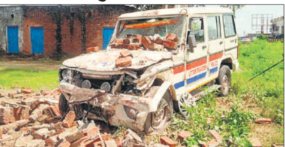
हादसे के बाद क्षतिग्रस्त पुलिस की गाड़ी।