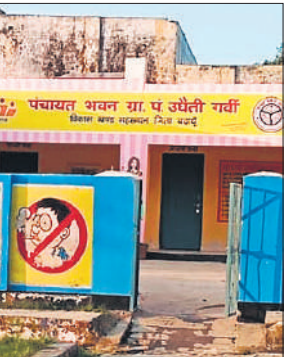
बंद पड़ा उधैती गर्वी का पंचायत भवन।

● ब्लॉक और तहसील स्तर के चक्कर लगाने को ग्रामीण मजबूर