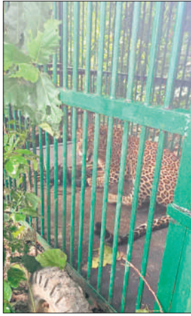
पिंजरे में कैद हुआ तेंदुआ।

कि उच्चाधिकारियों के निर्देश पर तय किया जाएगा कि तेंदुए को कहाँ छोड़ा जाएगा तेंदुए की दहशत चांदपुर, चतुरपुर, लड़ती, हरिहरपुर, हरनाई, बरगदिया, टोंडरपुर, बालागंज, सराय, नवदिया ओरीलाल, धनसिंहपुर, भीखमपुर और प्रीतमपुर समेत