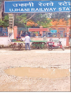
रेलवे स्टेशन के निकट गहरा गड्ढा ।

कस्बे में रेलवे स्टेशन के ठीक सामने वाले रोड काफी समय से जर्जर है। सड़क पर जगह जगह गहरे गड्ढे हो गए हैं जिनमें बारिश का पानी भरा रहता है। गड्ढों में पानी भरा होने से ई रिक्शा और ऑटो पलटते रहते हैं जिससे लोग चोटिल होते हैं। रेलवे स्टेशन के निकट पंजाबी कॉलोनी, मिल कंपाउंड