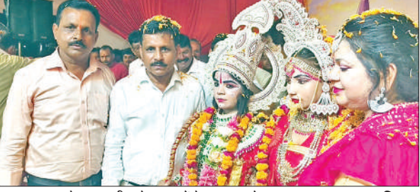
भगवान राम और माता सीता के स्वरूपों के साथ आयोजक।

उन्होंने बताया कि जब जनकपुरी में धनुष यज्ञ के अवसर पर भगवान श्रीराम ने शिवधनुष को सहजता से उठाकर प्रत्यंचा चढ़ाई, तभी वह धनुष भंग हो गया। उसी क्षण मिथिला नगरी आनंदमग्न हो उठी और माता सीता ने स्वयंवर के नियम अनुसार प्रभु श्रीराम के गले में जयमाला डाल दी। आकाश से पुष्पों की वर्षा होने लगी और देवगण “जय श्रीराम” के उद्घोष करने लगे। कथा वाचक ने कहा कि यह विवाह केवल एक युगल का नहीं,