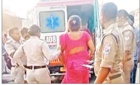
महिला को अस्पताल भिजवाती जीआरपी।