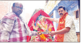
भगवान गणेश का पूजन करते श्रद्धालु ।