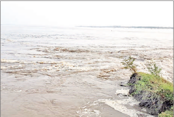
उसहैत क्षेत्र में कटान करती गंगा नदी।

● गंगा में बढ़ते जलस्तर पर नजर बनाए हुए है जिला प्रशासन