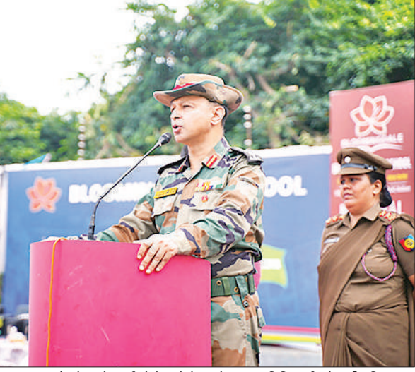
छात्र-छात्राओं को उनके कर्तव्यों के बारे में बताते मुख्य अतिथि कर्नल देवाशीष सिंह ।

दुकानदार यूरिया के साथ अन्य उर्वरकों की टैगिंग कर अधिक कीमत पर बेच रहे हैं। जिला कृषि अधिकारी ने दोपहर बाद तहसील सहसवान क्षेत्र की आधा दर्जन से अधिक दुकानों का निरीक्षण किया। निरीक्षण के दौरान अधिकारी को दुकानों पर कमियां मिली। जिस पर कृषि अधिकारी ने दुकानदारों को तीन दिन में स्थिति सुधारने का निर्देश दिया। साथ ही अपनी मौजूदगी में किसानों में यूरिया का वितरण कराया।