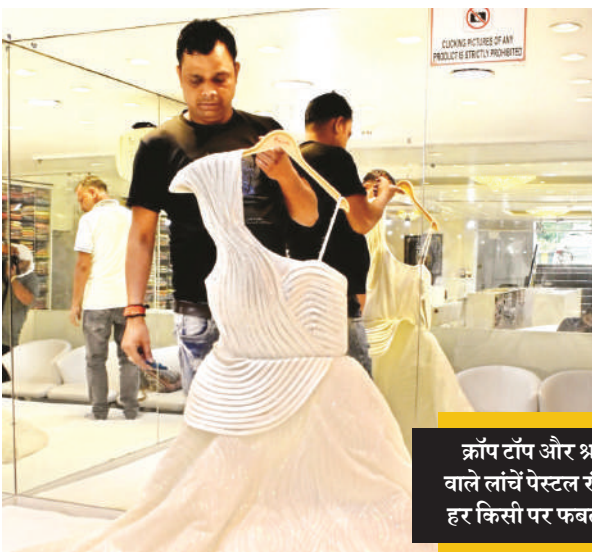
क्रॉप टॉप और श्रग वाले लॉन्ग पेस्टल रंग हर किसी पर फबता