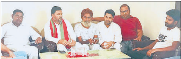
ग्राम तिरकुनिया नसीर पहुंचे सपा नेता।