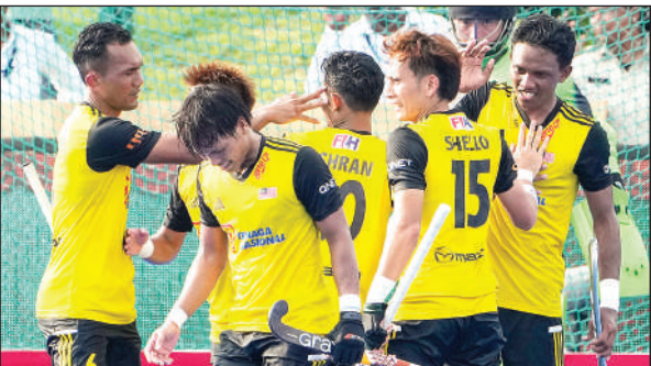
कोरिया के खिलाफ जीत दर्ज करने के बाद जश्न मनाते मलेशियाई खिलाड़ी।

यह पूछे जाने पर कि क्या चीनी टीम अंडरडॉग होगी, सात्विक ने कहा बिल्कुल नहीं। सेमीफाइनल खेल रहे हैं, कोई अंडरडॉग नहीं है। कुछ ही घंटे पहले पीवी सिंधू के क्वार्टर फाइनल में बाहर होने से भारत महिला एकल में पदक से वंचित रह गया था। जब सात्विक और चिराग कोर्ट पर उतरे तो उन पर उम्मीदों का बोझ साफ दिख रहा था।