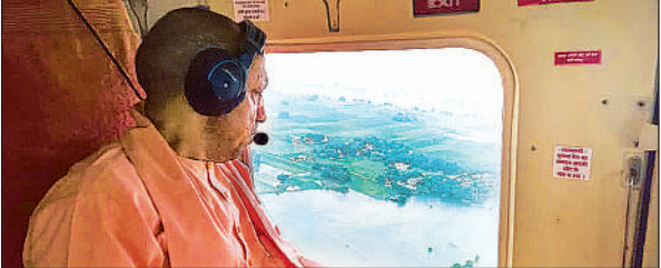
गाजीपुर के बाढ़ प्रभावित क्षेत्रों का हवाई सर्वे करते मुख्यमंत्री योगी।

उन्होंने कहा कि बाढ़ प्रभावित लोगों को किसी भी प्रकार की असुविधा न हो, इसके लिए हर संभव प्रयास किए जाएं। उन्होंने यह भी निर्देश दिए कि प्रशासनिक अमला सतत निगरानी में रहे। शरणालयों में रहने