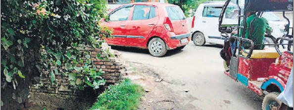
वन विभाग के इसी मोड़ पर हुआ था हादसा।