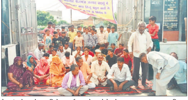
फैजगंज बेहटा गेट पर विरोध प्रदर्शन करते कस्बे के लोग।

नगर पंचायत फैजगंज बेहटा में शनिवार को सभासदों व कस्बा के लोगों ने गेट के आगे अनशन पर बैठ गए। उनके द्वारा नगर पंचायत फैजगंज बेहटा प्रशासन के खिलाफ नारेबाजी की जाने लगी। अनशन पर बैठे सभासदों का कहना था कि नगर पंचायत प्रशासन ने हिन्दू बस्तियों में सड़कें टूटी पड़ी हैं। सड़कों और नालियों में गंदगी बजबजा रही है। जिसकी शिकायत