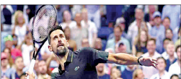
पीठ की समस्या से उबरते हुए शानदार प्रदर्शन करते हुए नोवाक जोकोविच।

69वीं बार किसी ग्रैंड स्लैम टूर्नामेंट के अंतिम 16 में जगह बनाई। इस तरह से उन्होंने रोजर फेडरर की बराबरी कर ली। अब उनका मुकाबला जेसिका पेगुला के खिलाफ़ापर जान-लेनार्ड स्ट्रफ़ से होगा। सातवीं वरीयता प्राप्त जोकोविच ने मैच के बाद कहा मैं अच्छा हूं। मैं पहले जितना ही जवान और मजबूत हूं। इस बीच महिला वर्ग में 2021 की चैंपियन एम्मा राडुकानू का