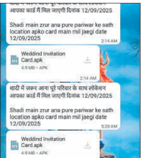
युवक को भेजे गए मैसेज का स्क्रीनशॉट।