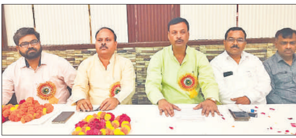
शिविर में मौजूद वरुण अर्जुन मेडिकल कॉलेज एंड रोहिलखंड हॉस्पिटल के लोग।

ठोस अवशिष्ट प्रबंधन नीति के विषय पर जागरूकता शिविर का आयोजन