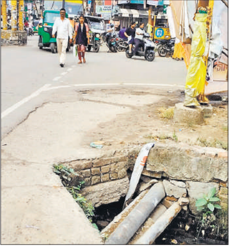
इंद्राचौक स्थित गिरिजाघर के सामने मोड़ पर खुला नाला।

इंद्राचौक पर गिरिजाघर के सामने एक ट्रांसफार्मर लगा हुआ है। जिसके किनारे पर नाले का मोड़ खुला हुआ है। पालिका ने नाले पर तो पटिया रखवा दी लेकिन इस मोड़ पर नहीं लगवाई। इसके चलते आए दिन यहां हादसे होते हैं। इसके अलावा भामाशाह चौक से कलेक्ट्रेट जाने वाले मार्ग किनारे नाला खुला हुआ है। टेंपो और ई-रिक्शा सड़क किनारे सवारियां उतारते हैं। कई बार टेंपा, ई-रिक्शा सवारियों के साथ नाले में गिर चुके हैं।