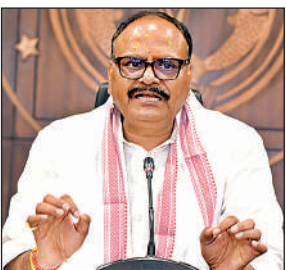
लोकभवन में पत्रकारों को जानकारी देते उप मुख्यमंत्री ब्रजेश पाठक।

अमृत विचार : उप मुख्यमंत्री ब्रजेश पाठक ने कहा कि संभल मुददे पर न्यायिक जांच आयोग ने रिपोर्ट मुख्यमंत्री को सौंप दी है। जांच रिपोर्ट अभी सार्वजनिक नहीं हुई है। हम इसे कैबिनेट में ले जाएंगे, इसके उपरांत कार्रवाई के लिए उसे आगे भेजेंगे। उप मुख्यमंत्री ने साफ तौर पर कहा कि आज की बातचीत न जांच रिपोर्ट से प्रेरित है और न ही उसका संदर्भ लिया जा रहा है। उन्होंने कहा कि आजादी के पहले और 2024 से लेकर कई बार संभल की चर्चा आई है।