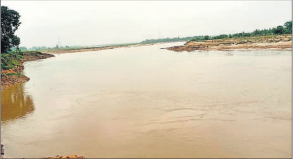
गर्ग नदी का जलस्तर शनिवार को स्थिर देखा गया।

शारदा नहर खंड के कंट्रोल रूम की जानकारी के अनुसार शनिवार दोपहर तक गर्ग का जलस्तर अजीजगंज पुल पर 144.500 मीटर तथा खन्जौत नदी का जलस्तर लोधीपुर पुल पर 142.500 मीटर रिकॉर्ड किया गया। वहीं कपना नदी भी 1150 क्यूसेक डिस्चार्ज के साथ गर्ग में मिल रही है। अनुमान है कि 2 सितंबर तक पानी का असर जिले में दिखेगा और गर्ग का जलस्तर करीब 1 मीटर बढ़ सकता है। हालांकि खतरे के निशान से अभी 3 मीटर नीचे रहेगा। गंगा और रामगंगा नदी का जलस्तर