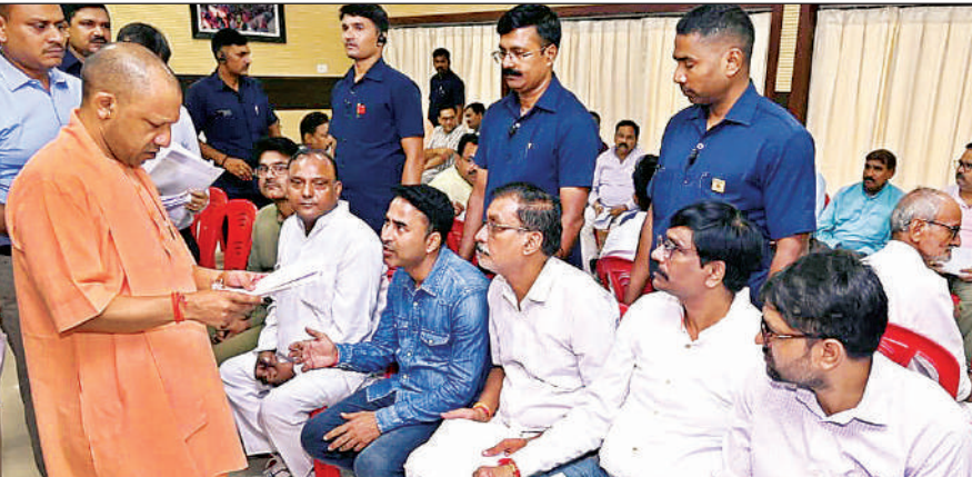
वाराणसी में आयोजित जनता दर्शन में फरियादियों की समस्या सुनते मुख्यमंत्री योगी।

जनता दर्शन में पहुंचे एक दिव्यांग फरियादी ने नेत्रहीनों के लिए डिजिटल लाइब्रेरी व एक कलाकार ने प्रदर्शनी लगाने के लिए उचित दर पर हॉल की मांग की। सीवर कनेक्शन, कच्ची