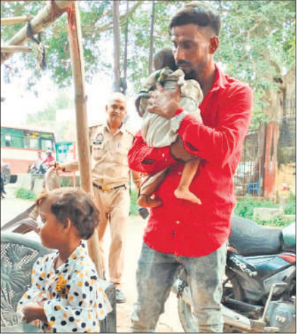
नाले में गिरे बच्चे को टंकी पर नहलाने के बाद गोद में लिया युवक।