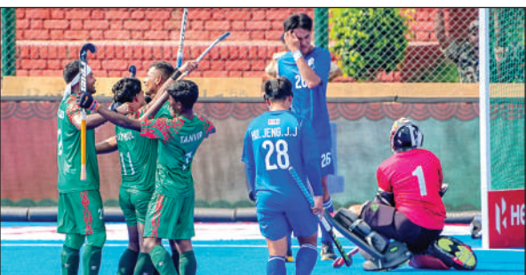
चीनी ताइपे के खिलाफ गोल करने के बाद जश्न मनाते हुए बांग्लादेश के खिलाड़ी।