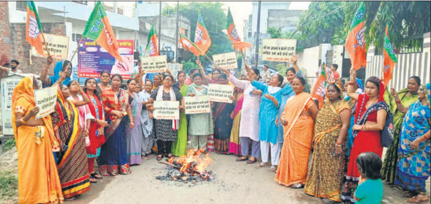
नेकपुर में कांग्रेस कैप कार्यालय के सामने राहुल गांधी का पुतला फूंकती भाजपा महिला मोर्चा की पदाधिकारी।