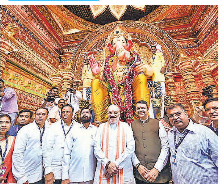
केंद्रीय गृह मंत्री अमित शाह, महाराष्ट्र के मुख्यमंत्री देवेंद्र फडणवीस और उपमुख्यमंत्री एकनाथ शिंदे ने मुंबई में भगवान गणेश की लालबागवा राजा मूर्ति के दर्शन किए।