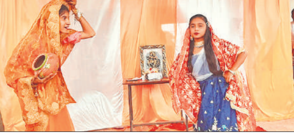
सांस्कृतिक कार्यक्रम प्रस्तुत करती छात्राएं।

यह कोर्स पिछड़ा वर्ग द्वारा कराया जा रहा है। जिले के सभी सरकारी विद्यालयों में बच्चों को ओ लेवल कोर्स की पढ़ाई कराने को लेकर तैयारी चल रही है। जिले में राजकीय माध्यमिक विद्यालयों की संख्या 39 है। इनमें कक्षा 9 से 12 तक 20 हजार के आस पास बच्चों ने प्रवेश लिया है। इन बच्चों