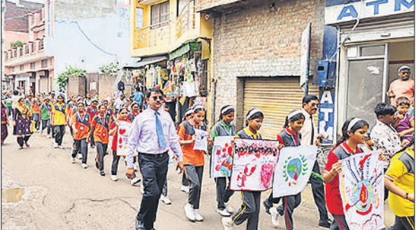
बिल्सी में जागरुकता रैली निकालते बाबा इंटरनेशनल स्कूल के बच्चे।