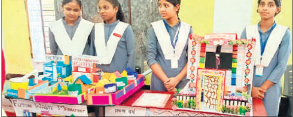
विज्ञान प्रतियोगिता में मॉडल दिखाती छात्राएं।