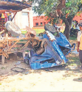
हादसे के बाद क्षतिग्रस्त टेंपो।