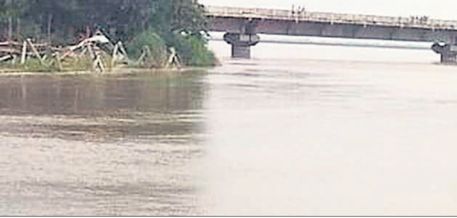
रैपुरा इलाके में गंगा का रौद्र रूप।

मंगलवार को नरौरा से 80 हजार क्यूसेक से अधिक पानी गंगा में डिस्चार्ज किया गया। पिछले कई दिनों से गंगा का जलस्तर बढ़ा हुआ है। तीन दिन से हो रही बारिश ने तटवर्ती गांवों को घेरना शुरू कर दिया है। उसहैत क्षेत्र के ग्राम जटा, प्रेमी नगला, रैपुरा, दल नगला, कदम नगला, कमलईया पुर, अहमदनगर बछौरा, असमिया रफतपुर, भकरी, बेहटी, भुंडी, पथरामई आदि गांवों में पानी घुस चुका है। इन बाढ़ प्रभावित क्षेत्रों में रविवार से मंगलवार शाम तक दो फीट तक गंगा का जलस्तर बढ़ा है। बेहटी व भकरी में जलस्तर तेजी से बढ़ रहा है। गंगा का पानी