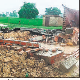
हादसे के बाद मकान का मलबा।