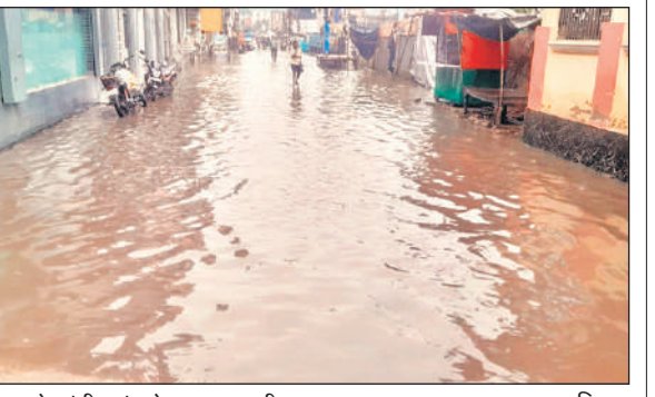
शहर के गांधी ग्राउंड रोड पर भरा पानी।