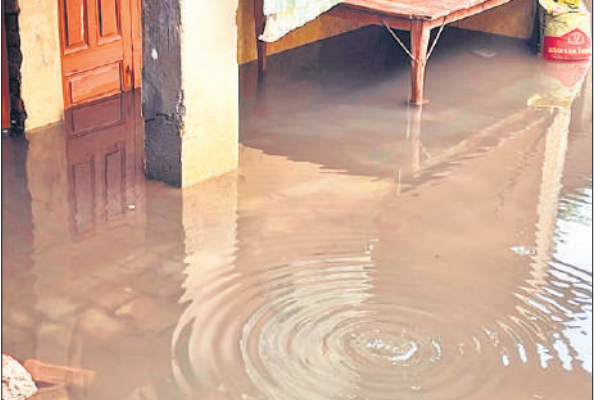
गांधी कॉलोनी में जलभराव से घर में घुसा पानी।