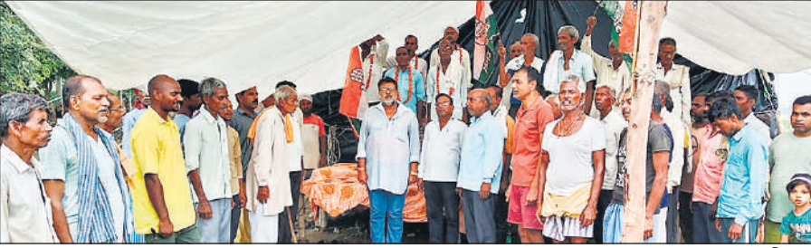
नगर पालिका के खिलाफ प्रदर्शन करते ग्रामीण और कांग्रेस पदाधिकारी।

पशुओं को चारा और ग्रामीणों को राशन की व्यवस्था की जाएगी। उन्होंने ग्रामीणों को सतर्क रहने को कहा है।