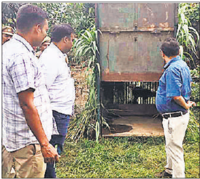
चांदपुर में लगाया गया पिंजरा।