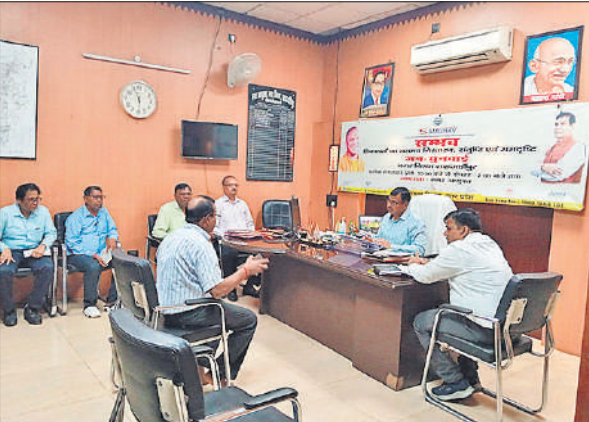
नगर आयुक्त शिकायतें सुनते हुए।