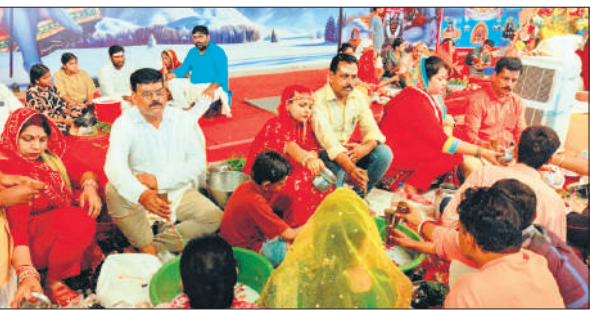
रुद्राभिषेक करते हुए भक्त।