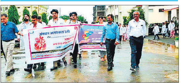
रैली निकालते वरुण अर्जुन विवि के छात्र।

● चिकित्सकों और छात्रों ने उठाया सामाजिक जिम्मेदारी का बीड़ा