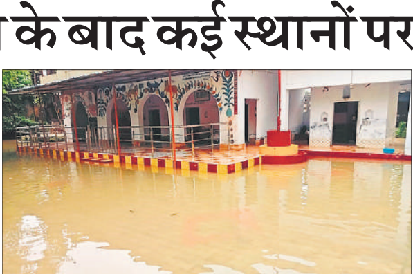
श्री पंचायती अखाड़ा आश्रम में भरा बारिश का पानी।

गांवों के प्रभावित व्यक्तियों के ठहरने आदि के लिए अटल बिहारी इण्टर कॉलेज दनियापुर में राहत शिविर की स्थापना की गयी है।