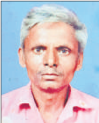
मृतक छोटे लाल।

अमृत विचार : तीन दिन से हो रही लगातार बारिश के दौरान दातागंज कोतवाली क्षेत्र के गांव कांसू नगला में एक किसान का कच्चा मकान अचानक भरभराकर गिर गया। ग्रामीणों ने किसान और उसके परिवार के सदस्यों को मलबा से बाहर निकाला। हादसे में किसान की मौत हो गई, जबकि पत्नी व बेटा गंभीर रूप से घायल हो गए। हादसे के दौरान किसान घर में खाना खा रहा था। पत्नी पास में बैठी थी और बेटा खेल रहा था। पुलिस ने शव को पोस्टमार्टम के लिए भेजा और घायलों को जिला अस्पताल में भर्ती कराया गया है। एसडीएम व कोतवाल ने मौका मुआयना किया।