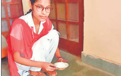
● अमृत विचार