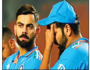
विराट कोहली व रोहित शर्मा।

वाशिंगटन सुंदर कभी जिम्मेदारी से पीछे नहीं हटे। यशस्वी ने ज़रूरत पड़ने पर योगदान दिया, आकाश दीप और प्रसिद्ध कृष्णा प्रभावी नजर आए और साई सुदर्शन ने अपनी दीर्घकालिक उपस्थिति का झलक दिखाई। लेकिन इस शानदार प्रयास का एक ओर आयाम भी है। इससे सवाल उठता है कि टी20 और टेस्ट क्रिकेट से संन्यास लेने वाले विराट