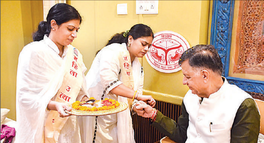
लखनऊ में विधानसभा अध्यक्ष सतीश महाना को रक्षा सूत्र बांधती महिला उथान मंडल की बहनें।

अमृत विचार, लखनऊ : नगर विकास एवं ऊर्जा मंत्री एके शर्मा की अध्यक्षता में बाढ़ व वर्षा से उत्पन्न परिस्थितियों पर अधिकारियों के साथ समीक्षा की गई। राज्य में बाढ़ और अतिवृष्टि से उत्पन्न स्थिति के संबंध में जानकारी ली, जिस पर जिलाधिकारी ने अवगत कराया कि बाढ़ की स्थिति से निपटने के लिए सभी अधिकारी अलर्ट मोड पर हैं। इस दौरान एके शर्मा ने पीडब्ल्यूडी और नगर विकास के अधिकारियों को निर्देशित किया कि सड़कों पर जलजमाव की स्थिति में जलनिकासी की व्यवस्था करने के साथ ही त्वरित गति से सड़कों की मरम्मत कराई जाए। सभी अधिशासी अधिकारी को निर्देशित किया कि गड्ढा मुक्ति और नाली आदि को दकने का काम सुनिश्चित कर लिया जाए।