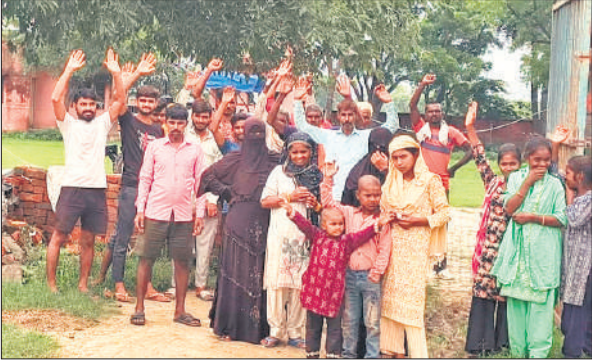
अस्पताल के बाहर प्रदर्शन करते ग्रामीण।

रास्ता खराब होने से स्वास्थ्य केंद्र में सेवारत स्टाफ के वाहन भी पीएचसी के भवन तक नहीं पहुंच पा रहे हैं। उन्हें असुविधा का सामना करना पड़ रहा है। इस कारण स्वास्थ्य सेवाएं एवं टीकाकरण अभियान भी प्रभावित हो रहा है। उल्लेखनीय है कि राज्य सरकार ने करोड़ों रुपये के बजट से पीएचसी का भवन तो बनवा दिया, परंतु भवन की ओर जाने वाले कच्चे रास्ते का