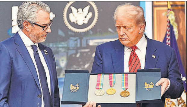
हाइट हाउस में एक कार्यक्रम में ट्रंप को ओलंपिक 1984 के पदकों सेट प्रदान किया गया।

भारत पर 25 प्रतिशत और टैरिफ लगाने की घोषणा से ऐन पहले अमेरिकी राष्ट्रपति ने कहा कि वह जल्द ही उन देशों पर टैरिफ लगाने का फैसला करेंगे जो रूसी ऊर्जा खरीद रहे हैं। ट्रंप ने भारत पर यह आरोप भी लगाया कि वह बड़ी मात्रा में रूसी तेल खरीद रहा है और उसे मुनाफे में बेच रहा है। भारत ने रूस से कच्चे तेल की खरीद के लिए नई दिल्ली को अनुचित और अविवेकपूर्ण तरीके से निशाना बनाने पर सोमवार को अमेरिका और यूरोपीय संघ पर जोरदार पलटवार किया था। ट्रंप ने रूस से ऊर्जा खरीदने वाले चीन समेत सभी देशों पर 100 प्रतिशत शुल्क लगाने की धमकी देने