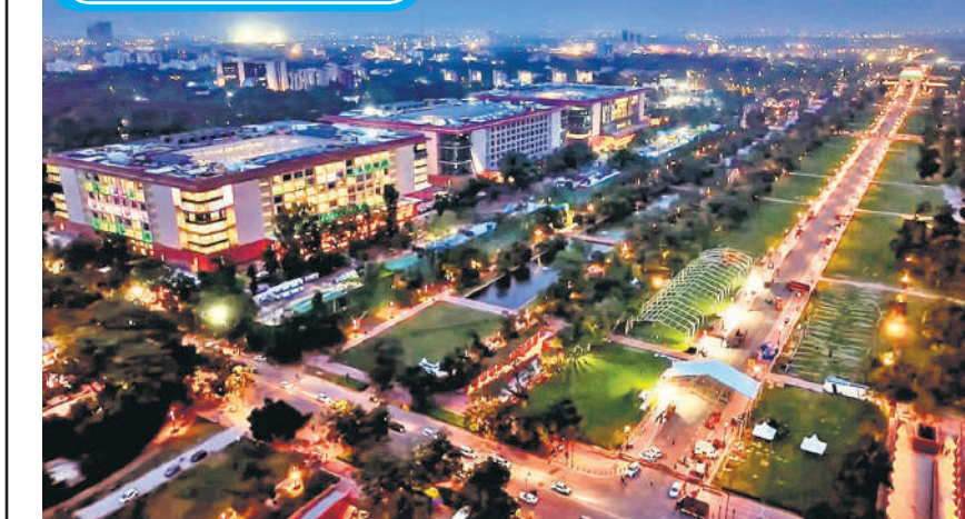
प्रधानमंत्री नरेंद्र मोदी ने बुधवार को नई दिल्ली में नवनिर्मित कर्तव्य भवन का उद्घाटन किया। इस दौरान उनकी उपस्थिति में आयोजित एक सार्वजनिक कार्यक्रम के दौरान कर्तव्य पथ को प्रकाशित किया गया।

चेन्नई। तमिलनाडु के तिरुचिरापल्ली जिले के कट्टुर में 33 वर्षीय गृहिणी सेल्वा वृंदा ने 22 महीने में 300 लीटर से अधिक ब्रेस्ट मिल्क (मां का दूध) दान कर समयपूर्व जन्मे और गंभीर बीमार हजारों शिशुओं की जान बचाने में मदद की। दो बच्चों की मां सेल्वा ने महान्मा गांधी मेमोरियल सरकारी अस्पताल मिल्क बैंक को अप्रैल 2023 से फरवरी 2025 के बीच 300.17 लीटर ब्रेस्ट मिल्क दान किया। वित्तीय वर्ष 2023-24 में इस मिल्क बैंक को दान किए गए कुल ब्रेस्ट मिल्क में लगभग 50 फीसदी योगदान वृंदा का था।