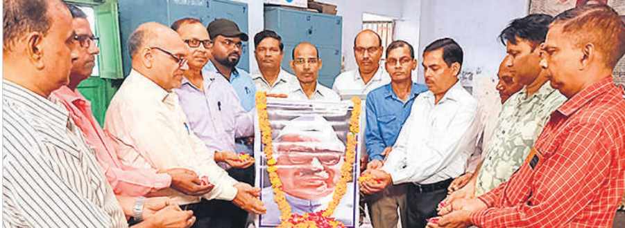
पूर्व प्रधानमंत्री जगजीवन राम के चित्र पर पुष्प अर्पित करते सोसायटी पदाधिकारी।