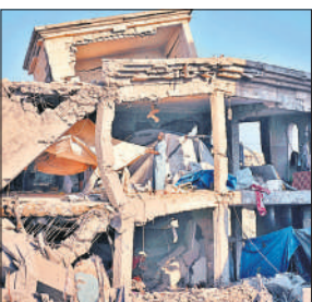
वहां अपनी अवैध उपस्थिति को जल्द समाप्त करे।

उन्होंने कहा, इस संबंध में अंतरराष्ट्रीय कानून स्पष्ट है। गाजा फलस्तीनी राज्य का एक अभिन्न अंग है और उसे बना रहना चाहिए। उन्होंने कहा कि जैसा कि अंतरराष्ट्रीय न्यायालय ने जुलाई 2024 में कहा था कि इजराइल का दायित्व है कि वह सभी नई बस्तियां बसाने की गतिविधियों को तुरंत बंद करे और कब्जे वाले फलस्तीनी क्षेत्र से सभी बसने वालों को निकाले और