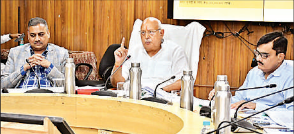
लखनऊ स्थित कृषि भवन में समीक्षा बैठक करते कृषि मंत्री सुर्य प्रताप शाही।

उपलब्ध कराया जाए। इसमें किसी की लापरवाही बर्दाश्त नहीं की जायेगी। कृषि मंत्री ने उर्वरक