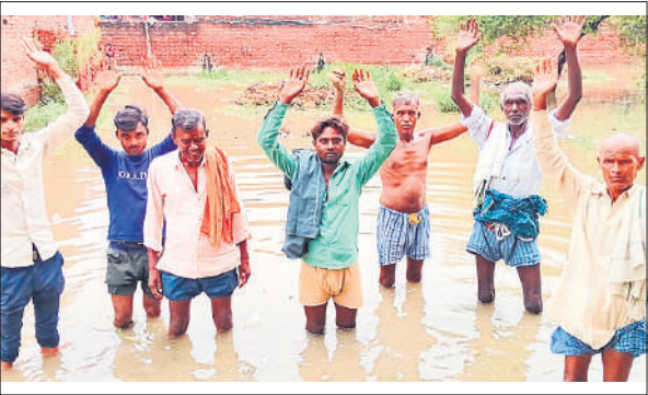
जलभराव के दौरान पानी में घुसकर प्रदर्शन करते ग्रामीण।

विजय नगला, अमृत विचार : अनियंत्रित डंपर ने रेलवे क्रासिंग के बूम में फंस गया। जिससे लगभग दो घंटों तक जाम लग गया। जीआरपी ने डंपर को निकलवाकर जाम खुलवाया। चालक को हिरासत में लेकर रिपोर्ट दर्ज कर ली है। कोतवाली सिविल लाइन क्षेत्र में दातागंज मार्ग