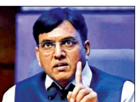
खेलमंत्रि मनसुख मांडविया।

खेलमंत्रि मनसुख मांडविया ने 23 जुलाई को लोकसभा में यह बिल रखा जिसके प्रावधान 15 (2) में कहा गया है कि किसी मान्यता प्राप्त खेल संगठन को इस अधिनियम के तहत अपने कार्यों, कर्तव्यों और शक्तियों के प्रयोग के संबंध में सूचना का अधिकार (आरटीआई) अधिनियम, 2005 के तहत एक सार्वजनिक प्राधिकरण माना जाएगा। आरटीआई बीसीसीआई के लिए एक पेचीदा मुद्दा रहा है जिसने इसके अंतर्गत आने का लगातार