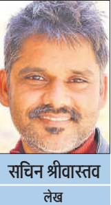
सचिन श्रीवास्तव लेख

6 अगस्त को हम हिरोशिमा पर हुए उस विनाशकारी परमाणु बम विस्फोट को याद करते हैं, जिसने 1945 में न केवल एक शहर को तबाह कर दिया, बल्कि असंख्य लोगों की जindगियों की भी बदल कर रख दिया। इस दिन मुझे 'हिरोशिमा माई लव' याद आ रही है। अब तक की देखी गई कुछ सबसे बेहतरीन फिल्मों में से एक। जे