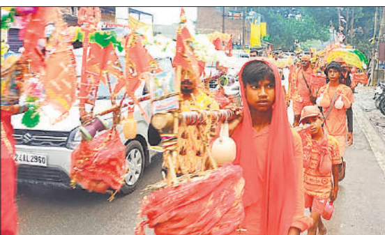
कांवाड़ लेकर जाते शिवभक्त।

अमृत विचार : श्रावण मास में सोमवार के साथ शिव तेरस का भी महत्व है। शिव तेरस पर भगवान शिव का जलाभिषेक करने से श्रद्धालुओं को पुण्य लाभ मिलता है। शुक्ल पक्ष की शिवतेरस पर भगवान शिव का जलाभिषेक करने के लिए कांवाड़ियों की टोलियां कछला गंगा घाट से शिव धामों की ओर जाती दिखाई दें। डीजे पर बजे रहे भजनों पर शिव भक्तों के कदम तेजी से मंदिरों की ओर बढ़ रहे हैं। सावन में सोमवार को भगवान शिव का लाखों लोगों ने जलाभिषेक किया। इस मास की