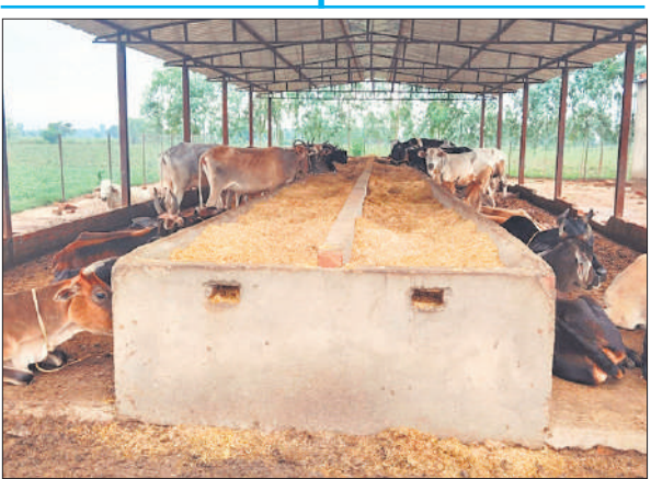
गोशाला में गोवंशों को दिया जा रहा सूखा भूसा।