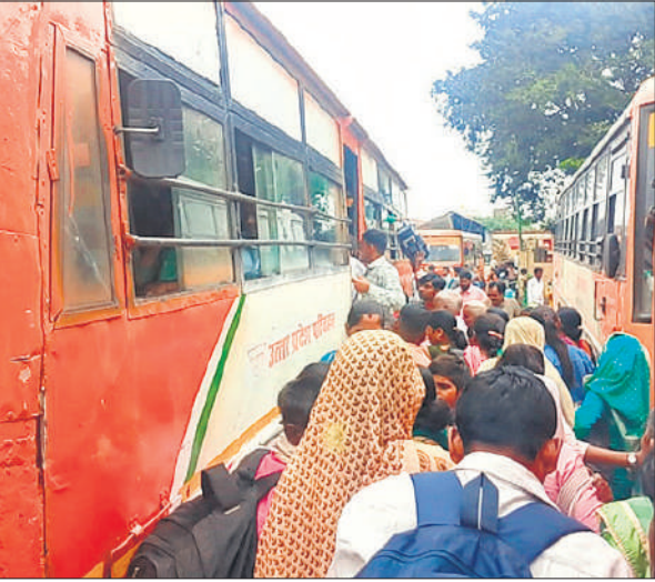
रोडवेज बस के गेट पर लगी यात्रियों की भीड़।

रक्षाबंधन पर शासन की ओर से रोडवेज निगम की बसों में बहनों के लिए दो दिनों तक फ्री यात्रा का लाभ दिया गया। शनिवार को रक्षाबंधन मनाने के लिए भाईयों के घर गई बहनों की वापसी हुई। यात्रियों की