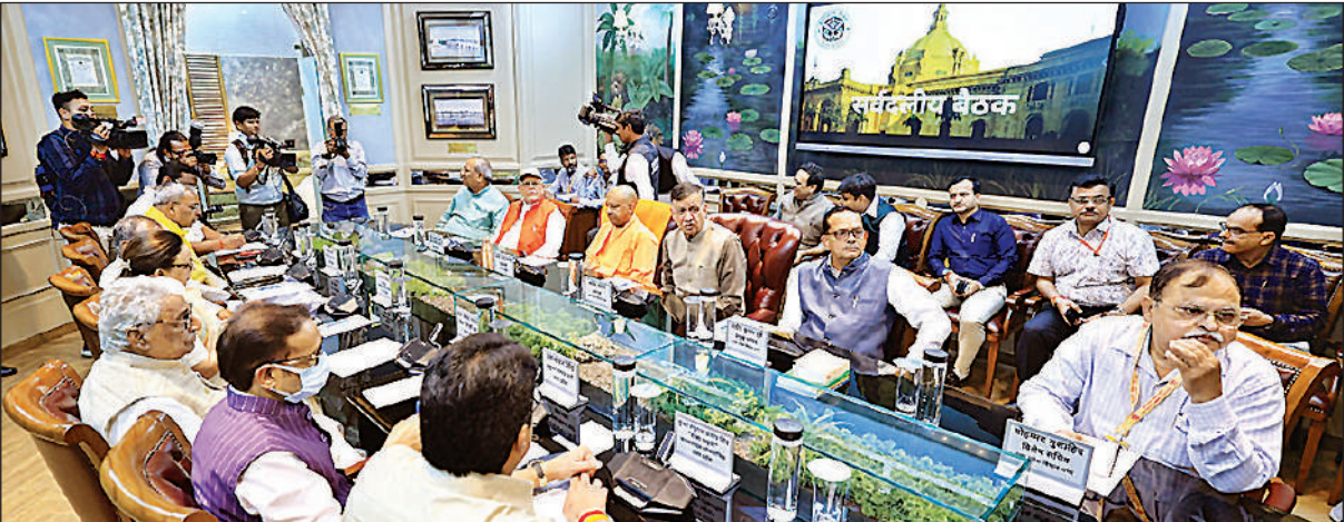
विधानभवन में आयोजित सर्वदलीय बैठक के दौरान उपस्थित विधानसभा अध्यक्ष सतीश महाना. मुख्यमंत्री योगी व अन्य दलों के नेता।