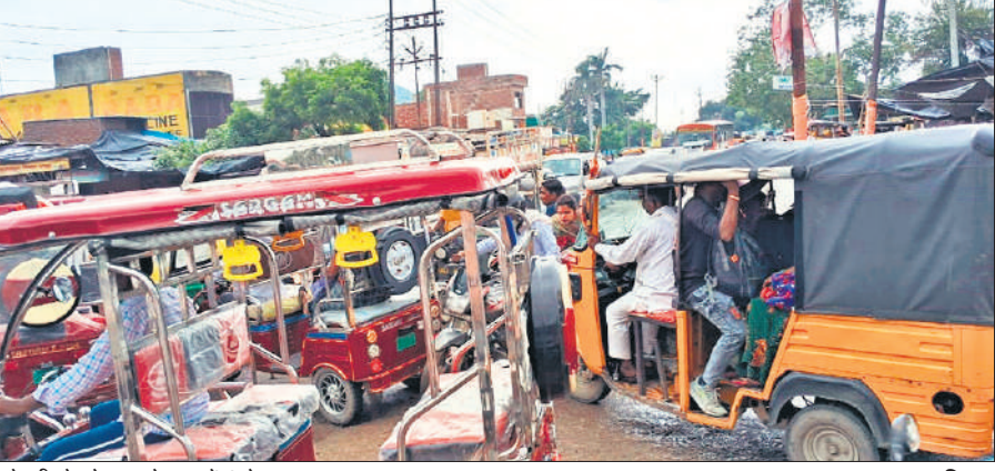
ओरछी चौराहे पर लगे जाम में फंसे वाहन।

तक ऐसी ही स्थिति बनी रही। इसके बाद वाहनों की संख्या कम होने पर जाम की स्थिति से निपटा जा सका।