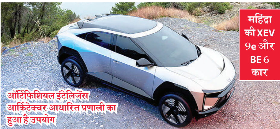
ऑटोफिशियल इंटेलेजेंस आर्किटेक्चर आधारित प्रणाली का हुआ है उपयोग

महिंद्रा एंड महिंद्रा यूएसवी के क्षेत्र में एक के बाद एक बड़ा धमाका कर रही है। कंपनी की इलेक्ट्रिक कार XEV 9e और BE 6 में बेहतरीन सस्पेंशन, एडवांस एडीएस और 500 किमी से अधिक की सिंगल चार्ज रेंज मिल रही है। दोनों एसयूवी में उपलब्ध ऑटो पार्क, एमएआईए नामक इंटीग्रेटेड एआई फ्रीजर ग्राहकों को काफी पसंद आ रहे हैं।