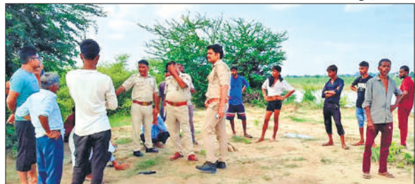
युवक के देवहा नदी में डूबने की सूचना पर पहुंची पुलिस।