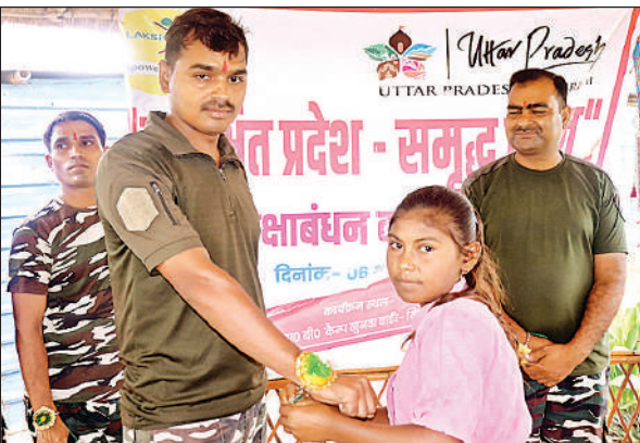
प्रदेश की सीमा पर तैनात जवानों को राखी बांधती बच्ची।

योगी ने इसे लेकर अफसरों को निर्देशित भी किया कि जिन लोगों को उपचार में आर्थिक सहायता की आवश्यकता है, उनके