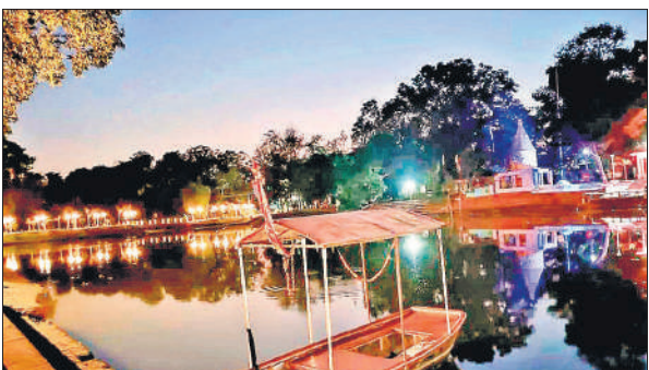
माधोटांडा स्थित मां गोमती उद्गम स्थल।

अमृत विचार: भविष्य में माधोटांडा के कलानगर तहसील स्थित गोमती का उद्गम स्थल अयोध्या के राम मंदिर की तरह ही भव्य दिखेगा। राम मंदिर का सौंदर्यीकरण करने वाली संस्था ने इसकी जिम्मेदारी संभाली है। उद्गम स्थल के टैंपल प्लाजा में आकर्षक पेंटिंग्स के साथ पंचवटी वाटिका से लेकर मेडिटेशन सेंटर आदि सब कुछ देखने को मिलेगा। संस्था के डायरेक्टर ने गोमती उद्गम स्थल का प्रोजेक्ट तैयार कर जल शक्ति मंत्रालय को सौंपा है। उम्मीद है आने वाले दिनों में गोमती उद्गम स्थल भी प्रदेश के अन्य धार्मिक स्थलों