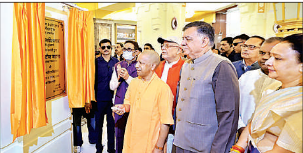
विधान भवन के प्रवेश द्वार के नवीनीकृत गुंबद का लोकार्पण करते मुख्यमंत्री योगी।

सत्र में तकनीकी विशेषज्ञों ने बताया कि कैसे एआई का उपयोग वॉइस-टू-टेक्स्ट, भावना विश्लेषण, अनुवाद और दस्तावेज तैयार करने में किया जा सकता है। प्रस्तावित एआई समाधानों में एकीकृत डेशबोर्ड और चैटबॉट शामिल हैं, जो विधायकों और जनता दोनों के लिए सूचनाओं को तुरंत उपलब्ध कराएंगे।