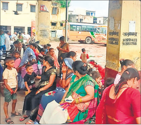
बस स्टैंड पर बसों का इंतजार करते यात्री।

हजार से अधिक छुट्टा गोवंश हैं, जो गांव देहात से लेकर शहर कस्बों में लोगों को खतरा बने हुए हैं। गांवों में छुट्टा गोवंश फसलें चट कर रहे हैं तो शहरों में सड़कों से गुजरने वाले वाहन चालकों पर हमले कर रहे हैं। पिछले एक सप्ताह में छुट्टा गोवंश की चपेट में आने से एक महिला और दो पुरुषों की जान जा चुकी है। इसके साथ ही आधा दर्जन लोग घायल हो चुके हैं। फिर भी छुट्टा गोवंश को गोशालाओं में नहीं पहुंचाया जा रहा है। शासन के आदेशों को पशुपालन विभाग हवा में उड़ा रहा है। शहर में करीब 500 से अधिक छुट्टा गोवंश हैं। इनमें करीब 180 से अधिक सांड हैं। शहर में परशुराम चौक से कचहरी तक जाने वाली सड़क पर कई जगह छुट्टा गोवंश खड़े रहते