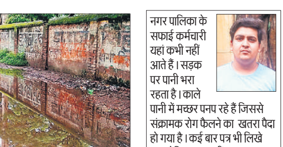
कलेक्ट्रेट परिसर को जाने वाली सड़क पर भरा बारिश का पानी।

अस्सी मीटर की जर्जर सड़क की मरम्मत कराने को लोक निर्माण विभाग और नगर पालिका को कई