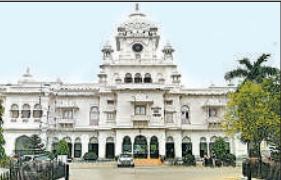
आठ सदस्य तो रखने ही चाहिए। वो शिक्षक भी कुलपति से नामित न हो, बल्कि शिक्षक वर्ग स्वयं चयनित करें और कार्य परिषद में प्रतिनिधित्व को भेजा जाए।

अमृत विचार: केजीएमयू में सर्वशक्तिमान 22 सदस्यीय कार्य परिषद में दो सदस्य आरक्षित वर्ग यानी एससी, एसटी व पिछड़ा वर्ग का प्रतिनिधित्व करेंगे। जबकि 2014 तक पूर्व में चार सदस्य प्रतिनिधित्व करते रहे हैं। राज्य सरकार के इस फैसले से आरक्षित वर्ग के शिक्षक संतुष्ट नहीं हैं। शिक्षकों का कहना है कि अगर केजीएमयू में आरक्षित वर्ग के अधिकारों को सुरक्षित रखना है तो कार्यपरिषद में केजीएमयू के अधिनियम के अनुसार कम से कम