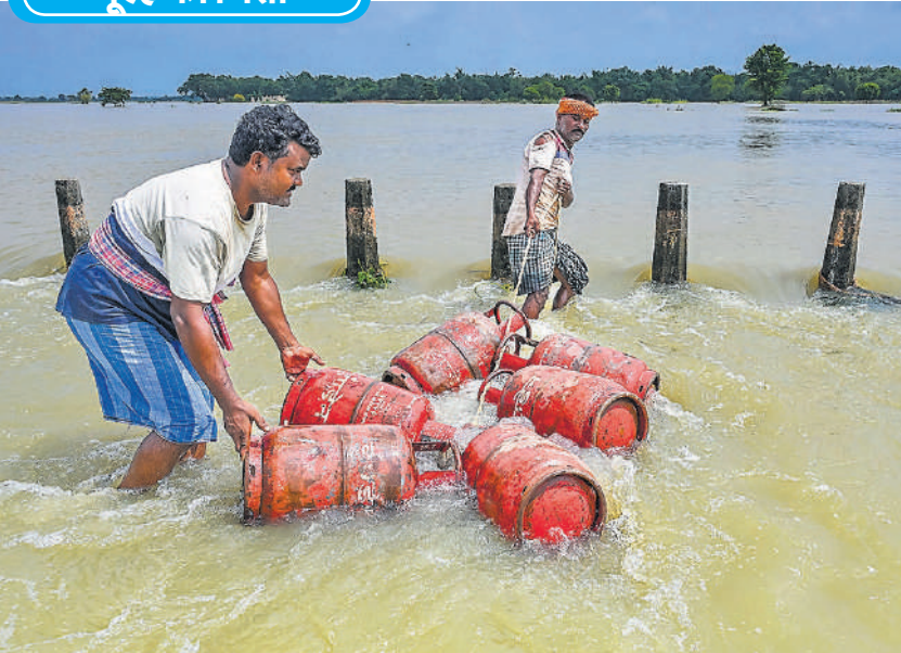
हुगली नदी की बाढ़ से पश्चिम बंगाल के कई जिलों में जनजीवन प्रभावित है। रविवार को नादिया जिले के शांतिपुर ब्लॉक क्षेत्र में रसोई गैस सिलेंडर खींचकर घर की ओर ले जाते हुए उफनती नदी के पानी से घिरे इलाके के लोग।

मैड्रिड। स्पेन के वालेंसिया क्षेत्र में एक छोटे विमान के दुर्घटनाग्रस्त होने से दो लोगों की मौत हो गई। क्षेत्रीय सरकार ने इसकी पुष्टि की। सरकारी की ओर से जारी बयान में बताया गया है कि यह दुर्घटना रेवेनना शहर के पास शनिवार को पूर्वाह्न लगभग 11 :25 बजे हुई। विमान उड़ान भरने के तुरंत बाद तेज रफ्तार से गोला लगाकर पास के खेतों में जा गिरा, जिससे उसमें मौजूद दोनों यात्रियों की मौत हो गई। विमान आग से पूरी तरह नष्ट हो गया। कारणाों की जांच की जा रही है।