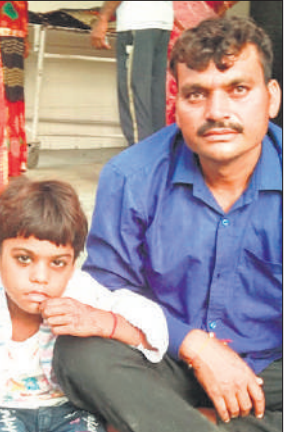
जिंदा बचे बाप बेटी ।

जन मानस को अधिक से अधिक जागरूक करने के उद्देश्य से सावधानी एवं बचाव के उपायों का जनपद में प्रचार-प्रसार की आवश्यकता है।