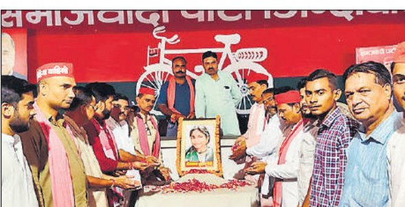
सपा कार्यालय पर पूर्व सांसद फूलन देवी के चित्र पर पुष्प अर्पित करते सपाईं।