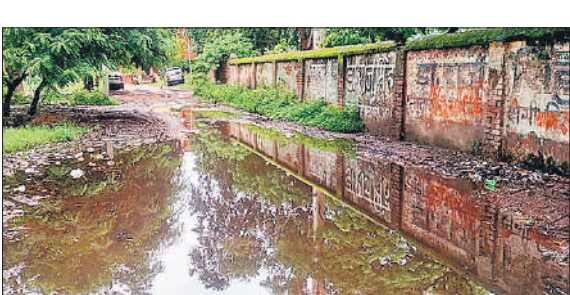
कलेक्ट्रेट परिसर को जाने वाली सड़क पर भरा बारिश का पानी। ● अमृत विचार

वन विभाग कार्यालय के निकट कलेक्ट्रेट कर्मियों के सरकारी आवास हैं। करीब दर्जन भर आवासों तक पहुंचने वाले रास्ता जर्जर है। सड़क टूटी हुई है। जिस पर हर समय पानी भरा रहता है। कर्मचारियों के परिवारों को घर से बाहर निकलने में परेशानी होती है। गंदे पानी में घुस कर बच्चे और महिलाएं बाहर निकलती हैं। इससे उनके कपड़े खराब होते हैं। गंदगी का आलम यह है कि बारिश के पानी में मच्छर पनप चुके हैं। बड़ी बड़ी झाड़ियां उग रही हैं। कर्मचारियों का कहना है कि इस