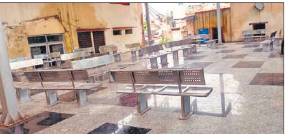
प्लेटफार्म एक पर बना पैसेंजर हॉल।