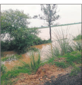
खेतों में भरा रामगंगा का पानी।

हजरतपुर से गढ़िया रंगीन को जाने वाली सड़क पानी में डूब गई है। इस रोड पर वाहनों का आवागमन बंद है। बाढ़ के चलते जनजीवन प्रभावित हो रहा है। रामगंगा पार के गांव लाल पुर खादर, पूरन भेडा, पट्टी विजा, हररामपुर, शेरपुर, नवादा वदन, कलाकंद, धम्पी पट्टी ,आदि गांव रामगंगा के पानी से घिरे हुए हैं। इन गांवों के लोगों ने तहसील प्रशासन से स्टीमर की मांग की है। ग्रामीणों ने बताया कि गांव से बाहर निकलने