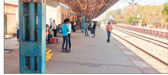
रेलवे स्टेशन पर पसरा सन्नाटा।

भर से जारी बारिश का सिलसिला रविवार को थम गया। सुबह से ही मौसम साफ रहा। मौसम साफ होने से बाजार में चहल पहल रही। मौसम साफ होने पर आर्द्रता अधिक होने से उमस बढ़ गई। इससे लोग पसीने से तरबतर होते रहे। मौसम साफ होने के बाद भी तापमान में वृद्धि नहीं हुई। अधिकतम तापमान 32 और न्यूनतम तापमान 27 डिग्री सेल्सियस दर्ज किया गया। कृषि विभाग के अधिकारियों के अनुसार आने वाले दिनों में तेज बारिश होगी। जिसकी संभावना बनी हुई है। बताया कि मौसम साफ होने से आर्द्रता अधिकतम 65 और न्यूनतम 45 प्रतिशत दर्ज की गई है। आर्द्रता बढ़ने की वजह से उमस में इजाफा हुआ है।