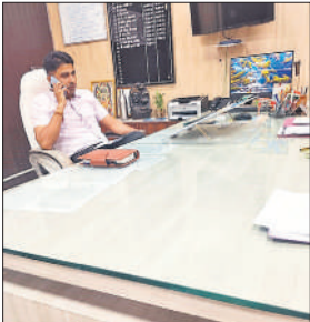
एडीएम प्रशासन निर्देश देते हुए।

अमृत विचार : त्रिस्तरीय पंचायत चुनाव के कार्यों को गति देने के लिए प्रशासन स्तर से तैयारियों युद्धस्तर पर चल रही है। जिसमें तहसीलवार बीएलओ की नियुक्ति पर जोर दिया जा रहा है। 18 अगस्त तक सभी बीएलओ की नियुक्ति होनी अनिवार्य है, जिसके बाद नियुक्त बीएलओ 19 से 29 सितंबर तक घर घर जाकर मतदाता सर्वेक्षण, संशोधन, विलोपन आदि कार्य करेंगे। इसी को ध्यान में रखते हुए एडीएम प्रशासन रजनीश कुमार मिश्रा ने बीएलओ नियुक्ति सूची पंचायत चुनाव कार्यालय से तलब कर समीक्षा की। जिसमें तहसीलों में बीएलओ की नियुक्ति में तेजी लाने