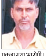
पकड़ा गया आरोपी।