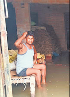
घर में घुसा पानी।

पर शरण लिए हुए हैं। रामगंगा का पानी भी कुण्डरी, गहवरा, सोहड़, दाहिलिया, कोलापुर, मौजमपुर, अतरी, हरिहरपुर, बीघापुर तक फैल चुका है और मिर्जापुर कस्बे