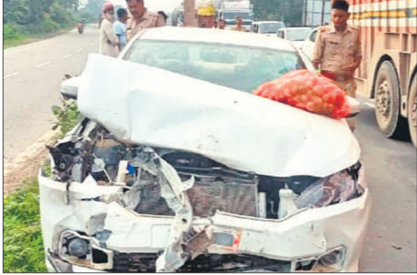
हादसे में कार बुरी तरह क्षतिग्रस्त हो गई।

हादसे के बाद गुस्साए मृतक के परिजन और स्थानीय लोग हाईवे पर जुट गए। नाराज भीड़ ने कार में तोड़फोड़ की और चालक को मारने का प्रयास किया। मौके