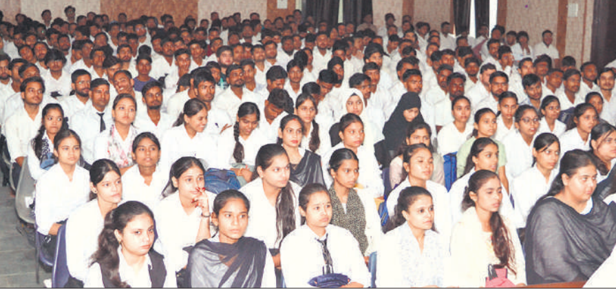
कार्यक्रम में प्रतिभाग करते छात्र-छात्राएं।