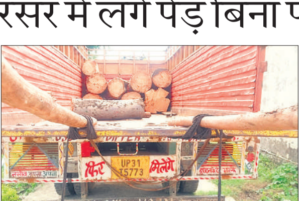
गन्ना किसान डिग्री कॉलेज परिसर से लकड़ी लादकर ले जाती ट्रक।