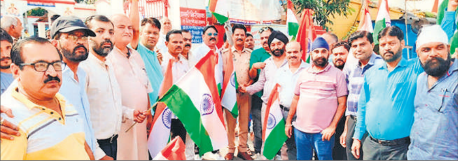
संगठन की ओर से व्यापारियों को तिरंगा देते व्यापार मंडल पदाधिकारी।

सांसद ने दिल्ली में मंत्री से मुलाकात कर हाईवे चौड़ीकरण, औद्योगिक केंद्रों को हाईवे से जोड़ने, भारतमाला परियोजना के तहत बस स्टैंडों पर डिजिटल टिकटिंग और यात्री प्रतीक्षालय जैसी सुविधाएं विकसित करने की मांग की थी। मंत्री गडकरी ने इन मांगों को गंभीरता से लेते हुए संबंधित अधिकारियों को पत्र लिखकर आवश्यक कार्रवाई के निर्देश दिए हैं। सांसद ने बताया कि समस्याओं के समाधान के लिए वह लगातार दिल्ली और लखनऊ में मंत्रियों से संपर्क बनाए हुए हैं।