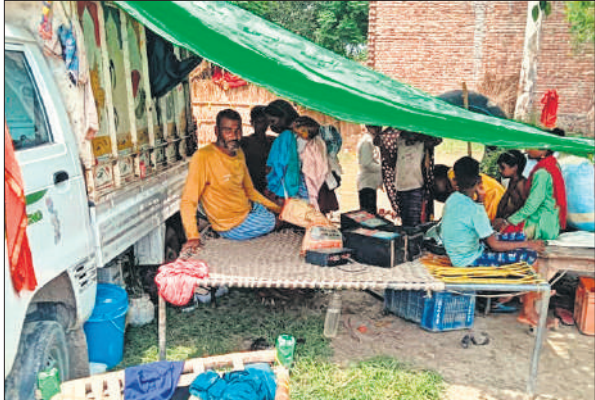
सड़क पर तंबू लगाकर बैठे लोग।

गंगा नदी के खादर में बसे भरतपुर, पैलानी, काटेला नगला, लोहार नगला, आजादनगर, इस्लामनगर, मस्जिद नगला, पंखिया नगला, शरीफपुर, बटन नगला, धोबी नगला, मोहकमपुर, गुटेटी, बख्तवरगंज, निबिया नगला