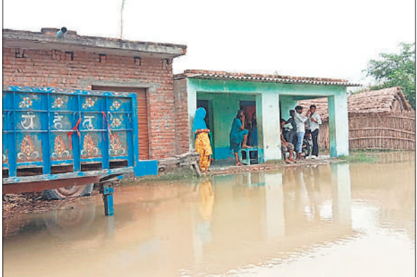
बाढ़ का पानी गांव में घुस गया है, जिसको लेकर ग्रामीण चिंतित हैं।

वन विभाग ने कहा कि पेड़ समिति की जमीन पर खड़े थे और कार्रवाई समिति प्रबंधन को ही करनी होगी। स्थानीय सूत्रों के अनुसार, इस मामले में कॉलेज के एक प्रोफेसर का नाम चर्चा में है। बताया जा रहा है कि इस प्रोफेसर ने रामलीला कमेटी से माफी मांगकर काटी गई लकड़ी वापस करने की बात भी कही है।