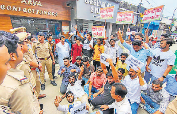
टाउनहाल में भारतीय राष्ट्रीय छात्र संगठन के लोग प्रदर्शन करते हुए।