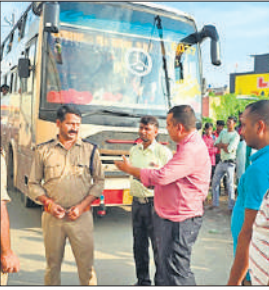
चालान करते हुए एआरटीओ।