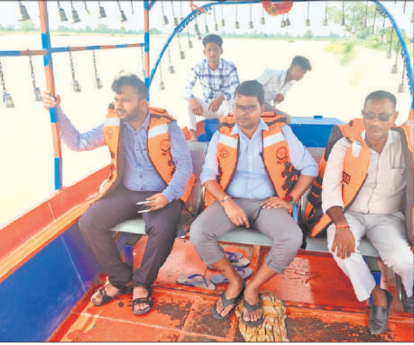
एसडीएम व तहसीलदार मोटरबोट से बाढ़ का निरीक्षण करते हुए।

शमशाबाद-फरुखाबाद मार्ग के दोनों ओर से पूरी बेरीकेडिंग कर रुट पर आवागमन पूरी तरह बंद कर दिया गया है। रोड के थोड़ी देर