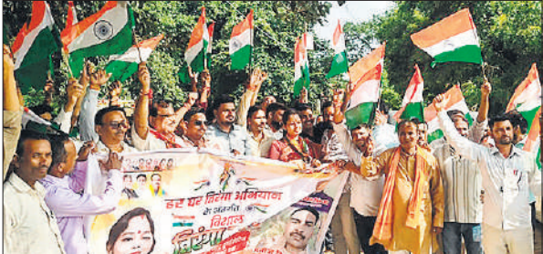
हर घर तिरंगा यात्रा निकालते भाजपाई।

सरथौली में निकाली तिरंगा यात्रा, गुंजे देशभक्ति के नारे