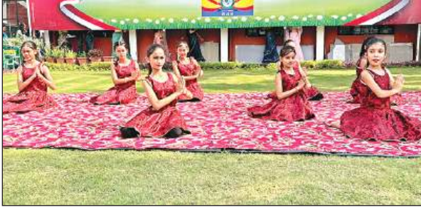
कार्यक्रम में प्रस्तुति देते बच्चे।