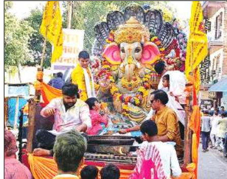
हमीरपुर में धूमधाम से निकली विसर्जन यात्रा।

व बेतवा नदी का खतरे का निशान 104.54 मीटर है। यमुना खतरे के निशान से 2 मीटर व बेतवा नदी 3.48 मीटर पर बह रही है।