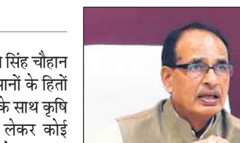
● केंद्रीय मंत्री बोले- किसानों के हितों की रक्षा की जाएगी

जीएसटी छूट होने के कारण, उद्योग को इनपुट टैक्स क्रेडिट (आईटीसी) का लाभ नहीं मिल पाता।