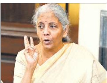
● बोलीं- दरों में कटौती का लाभ आमजन को देने के लिए उद्योगों से कर रहे बात

सिगरेट, तंबाकू और अन्य संबंधित वस्तुओं को छोड़कर नई कर दरें 22 सितंबर से प्रभावी हो जाएंगी। दरों को युक्तिसंगत बनाये जाने के तहत टेलीविजन एवं एयर कंडीशनर जैसे उपभोक्ता वस्तुओं के अलावा खानपान और रोजमर्रा के कई सामानों समेत करीब 400 वस्तुओं पर दरें