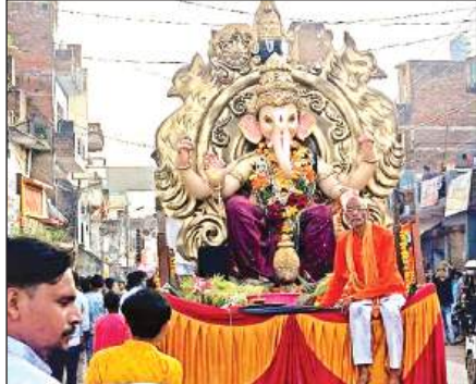
राठ में विसर्जन के लिए प्रतिमा ले जाते लोग।