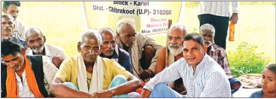
गोष्ठी में मौजूद विशेषज्ञ और किसान।