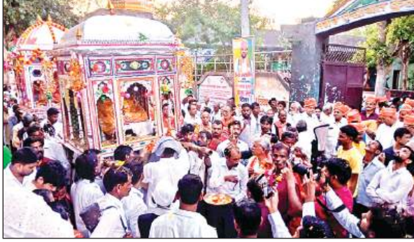
शोभायात्रा के दौरान आरती के लिए जुटी श्रद्धालुओं भीड़।