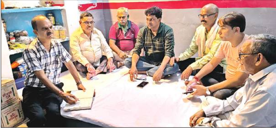
व्यापारियों को योजनाओं के बारे में जानकारी देते श्रम प्रवर्तन अधिकारी।