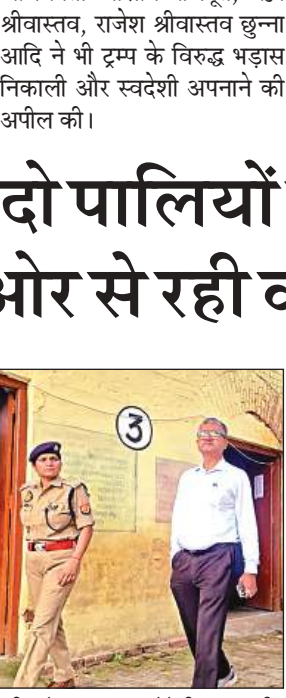
परीक्षा केंद्र का जायजा लेते डीएम व एसपी।

अमृत विचार। यूपी पीईटी के लिए 20 परीक्षा केंद्र बनाए गए हैं। शनिवार और रविवार को दो पालियों में परीक्षा आयोजित की जा रही है। शनिवार की पहली पाली के लिए अभ्यर्थी शुक्रवार रात से ही जिले में पहुंचने लगे थे। सुबह 7 बजे से केंद्रों पर अभ्यर्थियों की आवाजाही शुरू हो गई। प्रवेश से पहले दो स्तरों पर चेकिंग की गई। मेटल डिटेक्टर से जांच के साथ आधार कार्ड और प्रवेश पत्र का मिलान किया गया।