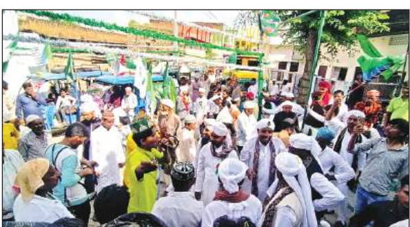
जुलूस-ए-मोहम्मदी में शामिल लोग।

ग्राम ग्योडी के ग्रामीणों द्वारा संपूर्ण समाधान दिवस में मौजूद अधिकारियों को दिए शिकायती पत्र में बताया कि मुख्य सड़क पर बारिश के चलते पानी भर गया, जिससे सड़क में जलभराव के साथ साथ कीचड़ भरा हुआ है। सड़क पर कीचड़ पानी के चलते ग्रामीणों को निकलने में परेशानी उठानी पड़ रही है। इतना ही नहीं इस मार्ग पर विद्यालय होने के कारण बच्चों को कीचड़ से होकर गुजरना पड़ता है। इससे बच्चों की यूनिफार्म और बैग में रखी कापी किताबें पानी पड़ने से खराब हो जाती हैं साथ ही बच्चे समय से स्कूल नहीं पहुंच पाते हैं। ग्रामीणों ने बताया कि सड़क निर्माण