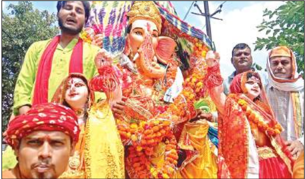
शोभायात्रा में शामिल भवत।