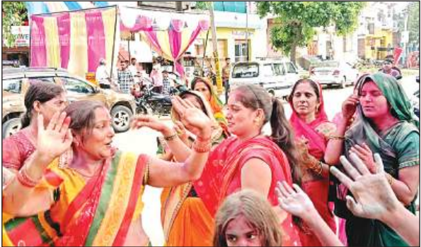
गणेश प्रतिमा विसर्जन के दौरान नृत्य करते श्रद्धालु।

किया गया। विसर्जन यात्रा के दौरान जगह-जगह श्रद्धालुओं ने आरती की और पुष्पवर्षा कर गणपति बप्पा को भावभीनी विदाई दी। मोहल्ले के लोग सुबह से ही विसर्जन यात्रा की तैयारियों में जुटे रहे। जैसे ही गाजे-बाजे और डीजे की थाप बजी, श्रद्धालु उत्साह से नाचते-गाते निकल पड़े। शोभायात्रा में महिलाओं, युवाओं, बच्चों और बुजुर्गों ने बड़ी संख्या