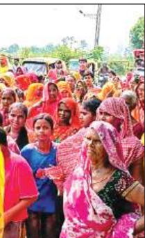
जलालाबाद में भी विसर्जन यात्रा में उमड़े श्रद्धालु।

खत्म हो रही है और दोनों देशों के बीच व्यापारिक रिश्ते मजबूत हो रहे हैं। रूस तो पहले ही भारत का फेवरिट था। ट्रम्प ने दोनों के रिश्तों में फेवीकाल का काम किया है। वरिष्ठ अधिवक्ता ने कहा कि चीन संदेव भारत का संयुक्त राष्ट्र सुरक्षा परिषद का स्थायी सदस्य बनने में रोड़ा अटकाता था, अब भारत चीन को वीटो लगाने से रोक सकता है। उन्होंने कहा भारत को अमेरिका की दवंगई से प्रताड़ित देशों से प्रगाढ़ता