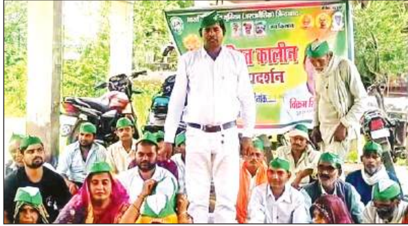
राठ तहसील परिसर में सुबह से धरना देते रहे किसान।