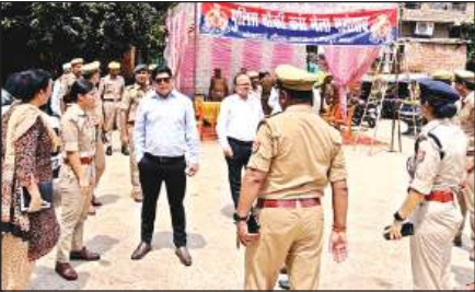
मेलास्थल का निरीक्षण करते डीएम व एसपी।