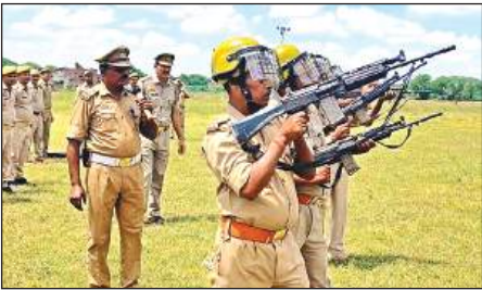
दंगा नियंत्रण का पूर्वाभ्यास करते पुलिस कर्मी।