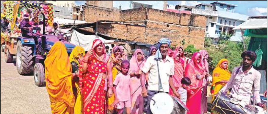
गणेश प्रतिमा को विसर्जन करने जाते भक्त।

गणेश प्रतिमाओं को ट्रैक्टर व अन्य वाहनों में रखते हुए गाजे-बाजे और डीजे की धुन के बीच ले जाकर बेलासागर में विसर्जित किया गया। इससे पूर्व पंडालों में हवन पूजन किया गया। साथ ही भंडारे का आयोजन कर लोगों को प्रसाद ग्रहण कराया गया। तालाब में गणेश प्रतिमाओं का विसर्जन गणपती बप्पा मोरिया अगले बसर तू जल्दी आना के उद्घोष के साथ किया गया। विसर्जन के मौके पर श्रद्धालुओं में विशेष उत्साह दिखाई दिया। नवयुवक शोभायात्रा में अबीर गुलाल उड़ते हुए चल रहे थे। जैतपुर कस्बे में आधा दर्जन स्थानों