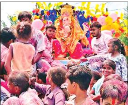
गुरसहायगंज में प्रतिमा को विसर्जित करने ले जाते श्रद्धालु।