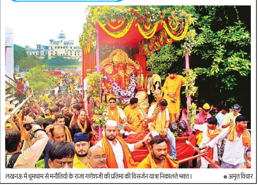
लखनऊ में धूमधाम से मनीतियों के राजा गणेशजी की प्रतिमा की विसर्जन यात्रा निकालते भक्त।