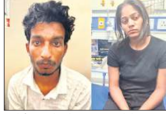
आरोपी राज और सोनम (फाइल फोटो)

रशीद (58) को 2017 के आतंकी वित्तपोषण मामले में गैरकानूनी गतिविधियां (रोकथाम) अधिनियम के तहत राष्ट्रीय अवैधपण अभिकरण (एनआईए) ने गिरफ्तार किया था। वह 2019 से दिल्ली के तिहाड़ जेल में बंद हैं। रशीद ने 2024 लोकसभा चुनाव में उमर अब्दुल्ला को बारामूला से हराया था। उनपर जम्मू-कश्मीर में अलगाववादियों और आतंकवादी समूहों का वित्तपोषण का आरोप है।