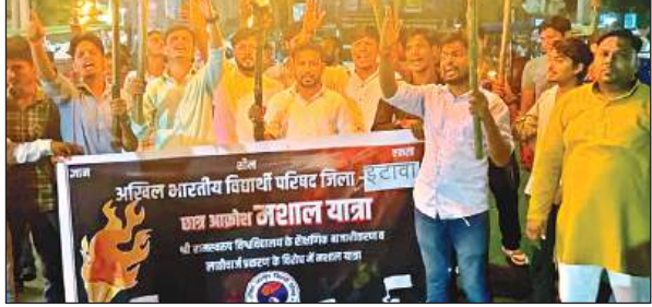
मशाल जुलूस निकालते अखिल भारतीय विद्यार्थी परिषद के कार्यकर्ता।