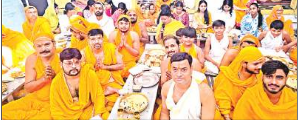
कार्यक्रम में शामिल भक्तगण।