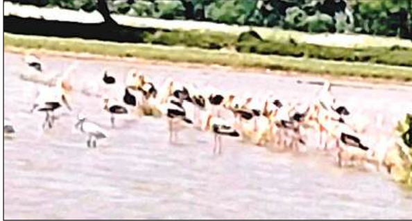
यमुना-बेतवा के संगम तट के पास मौजूद साइबेरियन पक्षी।

मौहदा बांध के सहायक अभियंता सर्वजीत वर्मा ने बताया कि शनिवार की सुबह 8 बजे ओखला बैराज से यमुना नदी में 209439 क्यूसेक, कोटा बैराज से चंबल नदी होते हुए यमुना नदी में 21002 क्यूसेक, माताटीला बांध से बेतवा नदी में 43080 क्यूसेक एवं लहचूरा बांध से धसान नदी में 26300 क्यूसेक पानी छोड़ा गया है। यमुना का जलस्तर खतरे के निशान तक जा सकता है। अभी तक 943.2 एमएम बारिश हुई है। शनिवार की