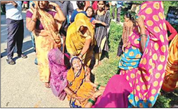
युवक का शव मिलने पर रोती-बिलखती रहीं परिवार की महिलाएं।

● देर रात तक युवक की खोजबीन करते रहे परिवार के लोग