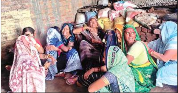
हादसे के बाद रोते बिलखते परिजन ।