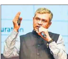
● बोले- आम लोगों को फायदा होने के साथ देश की अर्थव्यवस्था को मिलेगा बढ़ावा

माल एवं सेवा कर (जीएसटी) परिषद का अहितकर और विलासिता वगीय परिवारों के लिए और इस देश के 140 करोड़ नागरिकों के लिए एक नयी खुशी लेकर आएगा। जीएसटी सुधार देश के आर्थिक विकास को बढ़ावा देने का काम करेगे। सूचना एवं प्रसारण के पहले दिन से लागू होगा। भाजपा मुख्यालय में वैष्णव ने कहा कि 22 तारीख, नवरात्रि का पहला