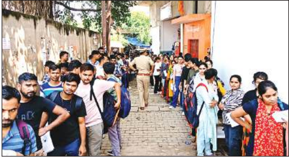
केकेसीएन इंटर कालेज ग्वाल मैदान परीक्षा केंद्र पर कतार में खड़े परीक्षार्थी व मौजूद अमृत विचार अधिकारी।

अमृत विचार। जिले के 17 परीक्षा केंद्रों पर पीईटी (प्रारंभिक अर्हता परीक्षा) प्रशासन ने सीसीटीवी की निगरानी में सम्पन्न कराई। अधिकारी लगातार केंद्रों का निरीक्षण करते रहे। परीक्षार्थियों की स्कैनिंग करा कर केंद्र में प्रवेश दिया गया। जिले में शनिवार को दो पालियों में प्रारंभिक अर्हता परीक्षा हुई। खास बात यह रही कि इस बार की परीक्षा में स्कैनिंग भी कराई गई। पगले दिन प्रथम पाली में 6624 परीक्षार्थियों में से 5043 उपस्थित तथा 1581 अनुपस्थित तथा द्वितीय पाली में 6624 परीक्षार्थियों में 5175 उपस्थित रहें तथा 1449