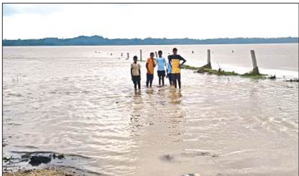
खेतों में भरे पानी में खड़े बच्चे।

यमुना नदी में आई बाढ़ ने अयाना क्षेत्र के 12 गांवों में जनजीवन प्रभावित कर दिया था। बाढ़ जाने के बाद लोगों का जीवन पटरी पर लौटना शुरू हो पाया था तभी नदी ने तीसरी बार उफनाना शुरू कर दिया है। हथिनी कुंड से यमुना नदी में छोड़े गए पानी से यमुना नदी तीसरी बारा उफनाने लगी लगी है। शुक्रवार दोपहर