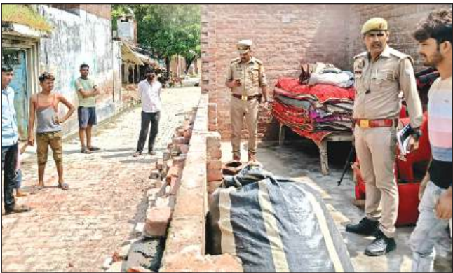
घटनास्थल पर जांच पड़ताल करती पुलिस।