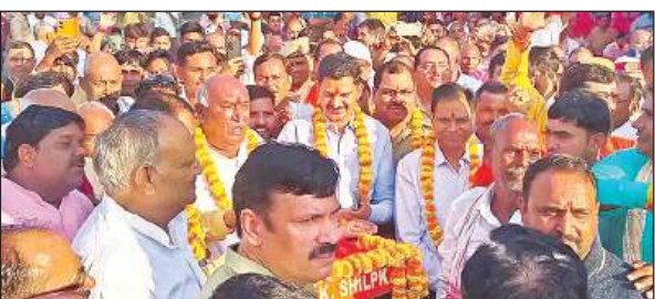
महाराणा प्रताप की प्रतिमा के अनावरण के मौके पर मौजूद एमएलसी व अन्य।