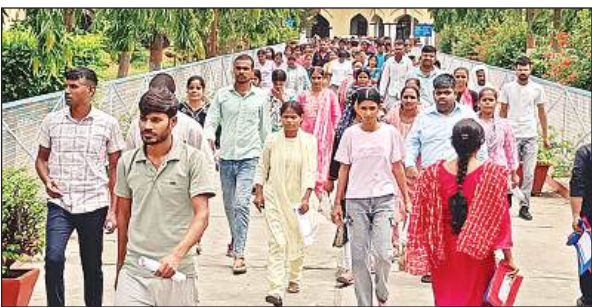
पीईटी परीक्षा देकर वाहर आते अभ्यर्थी।

अमृत विचार। पीईटी 2025 परीक्षा प्रथम पाली कड़ी सुरक्षा व्यवस्था के बीच सकुशल संपन्न हुआ। दो दिनों तक दो पालियों में 93024 परीक्षार्थी परीक्षा देंगे। उत्तर प्रदेश अधीनस्थ सेवा चयन आयोग की ओर से आयोजित हो रही प्रारंभिक अर्हता परीक्षा पीईटी 2025 गोरखपुर में 49 परीक्षा केंद्र पर 7 सितंबर को 93 हजार 24 अभ्यर्थी प्रत्येक दिन 2-2 पाली में शामिल होंगे। प्रथम पाली की परीक्षा सुबह 10 से 12 बजे तक और दूसरे पाली की परीक्षा दोपहर बाद 3 से शाम 5 बजे तक प्रथम पाली की परीक्षा में शामिल होने वाले अभ्यर्थियों को सुबह 8 बजे से 9:30 बजे तक प्रवेश दिया