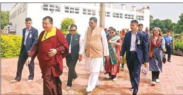
लुंबिनी का भ्रमण करते सर्वोच्च न्यायालय के मुख्य न्यायाधीश।