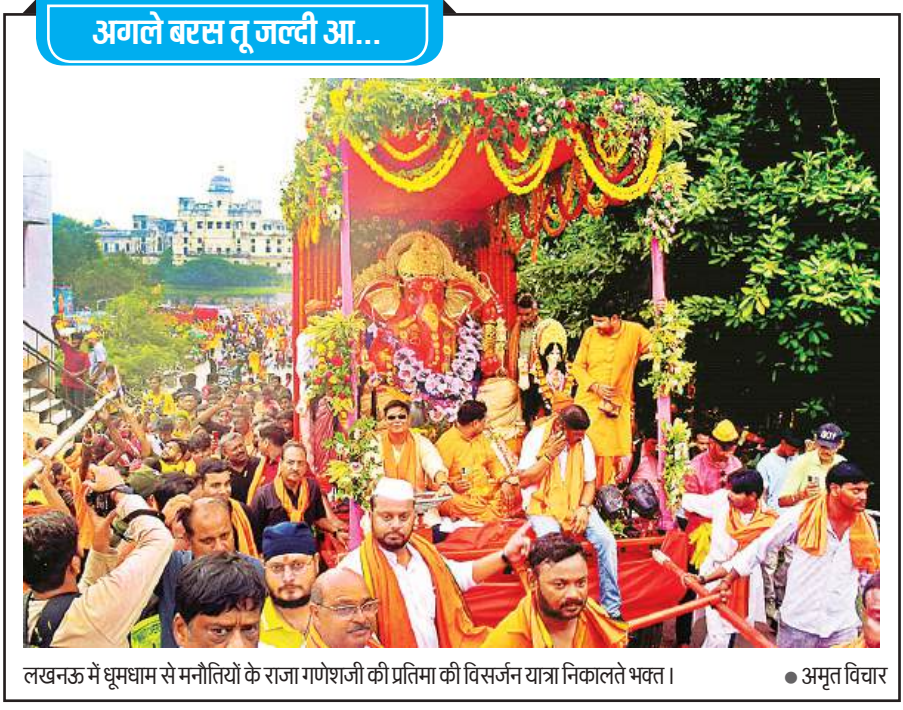
लखनऊ में धूमधाम से मनीतियों के राजा गणेशजी की प्रतिमा की विसर्जन यात्रा निकालते भक्त।