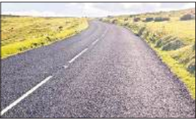
●आज भी जिले में करीब 300 गांवों तक नहीं बनी हैं सड़क

इनमें बहनजोत ब्लाक में 27 गांवों को सड़क मार्ग से जोड़ने की तैयारी है। इसी तरह पंडरी कृपाल ब्लाक में 21 गांव, रुपईडीह में 17, बेलसर में 13, छपिया में 13, करनैलगंज में 9, इटियाथोक में 31, झंझरी में