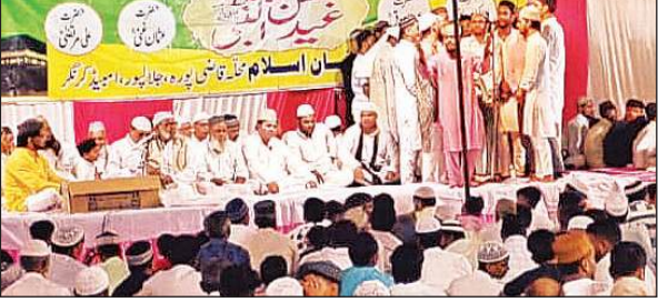
अकीदतमंदों की उमड़ी भारी भीड़।

नगर के मीरानपुर, शाहजहांपुर, अब्दुल्लाहपुर, शहजादपुर, गदायां, सिंझौली, लोपुरा ताजन में तकरीर व नातखानी का सिलसिला जारी रहा। विभिन्न स्थानों पर नातिया अंजुमनों की ओर से झालरों से सुसज्जित गेट, खानाए काबा, गुंबदे गलाए, रोजए रसूल, मेम्बरे रसूल, रीजा मौला अली तथा इस्लाम धर्म के रक्षक इमाम हुसैन की पवित्र