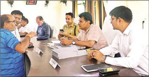
संपूर्ण समाधान दिवस पर शिकायत सुनते जिलाधिकारी।