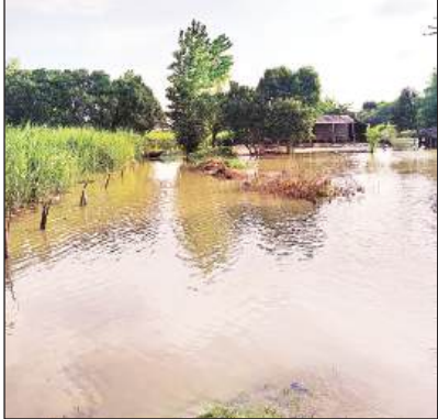
उमरी क्षेत्र के गांव में भरा पानी, रास्ते डूबे।