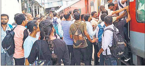
एसी कोच का जबरन दरवाजा खुलवाकर घुसते परीक्षार्थी।