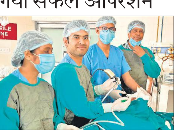
बरेली के युवक की एंडोस्कोपिक सर्जरी करती ईएनटी टीम।