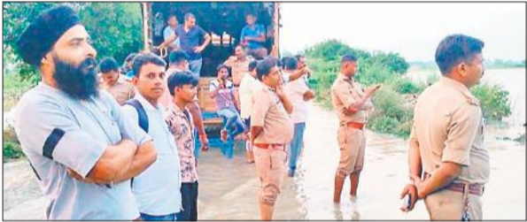
बाढ़ से निपटने के लिए तैनात पीएस-1-पुलिसकर्मी।

राहत शिविरों में 500 लोग पहुंचे : जिला प्रशासन की ओर से