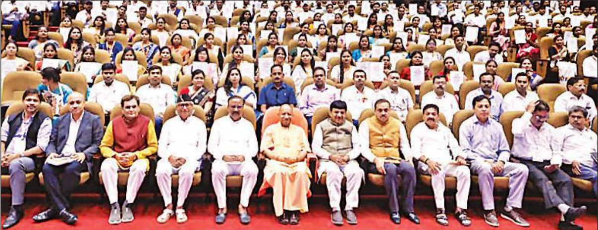
लोक भवन में नवचयनित अनुदेशकों के नियुक्ति पत्र वितरण कार्यक्रम में उपस्थित मुख्यमंत्री योगी, साथ में अन्य।