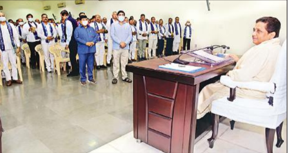
लखनऊ में बसपा के वरिष्ठ नेताओं के साथ बैठक के दौरान पार्टी प्रमुख मायावती।

बसपा प्रमुख रविवार को माल एवन््यू रोड स्थित पार्टी कार्यालय में संगठन पदाधिकारियों व कार्यकर्ताओं के साथ समीक्षा बैठक कर रही थीं। उन्होंने पार्टी संगठन के