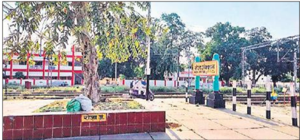
रोजा रेलवे स्टेशन।