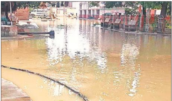
मेडिकल कालेज परिसर में बाढ़ का पानी रविवार को कम रहा।

राजकीय मेडिकल कालेज के ओपीडी गेट के सामने सड़क पर शुक्रवार की सुबह नाले से गरा नदी का बाढ़ का पानी आ गया था। बाढ़ आने की आशंका को देखते हुए मरीजों को अन्य स्थानों पर शिफ्ट कर दिया गया था। शनिवार की सुबह 9 बजे बाढ़ का पानी मेडिकल कॉलेज परिसर में भर गया। ट्रामा सेंटर, वार्ड और ओपीडी में ताला डाल दिया गया था। मेडिकल कॉलेज पूरी तरह खाली कर लिया गया था। सरकारी कॉलोनी में प्रथम