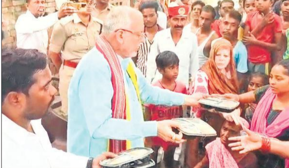
वित्त मंत्री और एडीएम वित्त बाढ़ पीड़ितों को लंच पैकेट देते हुए।