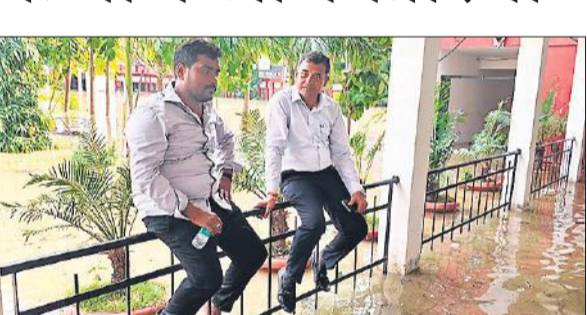
परीक्षा कक्ष के बाहर ड्यूटी पर तैनात अधिकारी।

एडीएम वित्त अरविंद कुमार ने परीक्षा केंद्र धर्मानंद सरस्वती इंटर कॉलेज का जिक्र कर