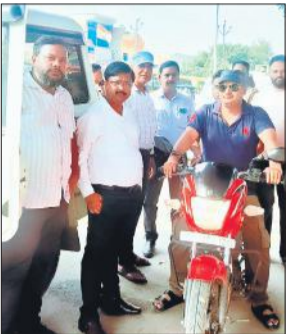
लेखपाल बाइक से परीक्षार्थी को परीक्षा केंद्र ले जाते हुए।

पीईटी का आयोजन बाढ़ जैसी स्थिति में जिले में कराना एक चुनौती थी। जिसे प्रशासनिक अधिकारियों की कड़ी मेहनत से सकुशल कराया गया। नायब तहसीलदारों, लेखपालों द्वारा भी परीक्षार्थियों को परीक्षा केंद्र तक पहुंचाने में अहम भूमिका निभाई गई है। सभी परीक्षार्थियों को शुभकामनाएं।