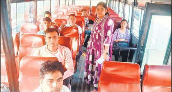
बस स्टैंड से परीक्षा केंद्र के लिए परीक्षार्थियों को रवाना करती नायब तहसीलदार।