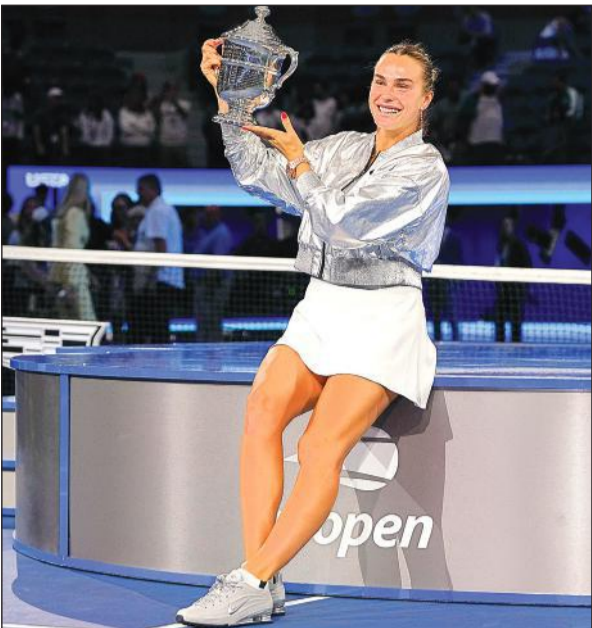
बेलारूस की एरिना सबालेंका यूएस ओपन की ट्रॉफी के साथ जश्न मनाती हुईं। एर्जेसी

के स्कोर पर सबालेंका की सर्विस के दौरान लड़खड़ाने का फायदा उठाया, जिससे उनका नियमित ओवरहेड नेट में चला गया। इससे अनिसिमोवा ने सर्विस ब्रेक की और टाईब्रेकर कराया।