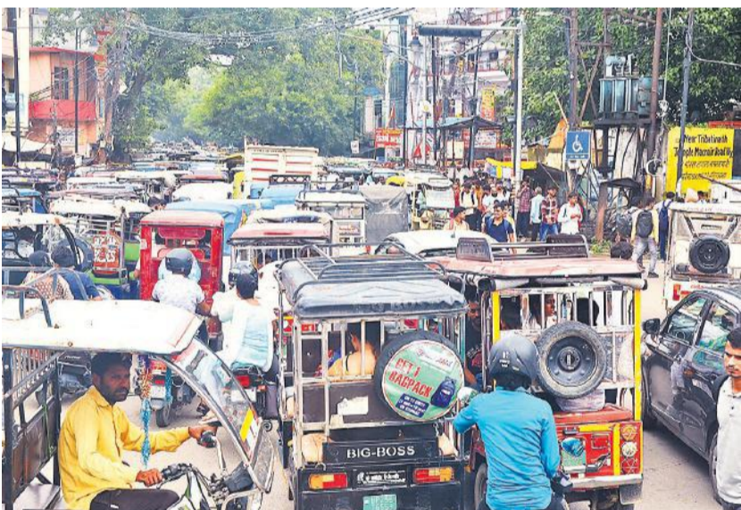
प्रारंभिक अर्हता परीक्षा छूटने के बाद दूसरे दिन बाद भी शहर में जाम के हालात बन गए। बरेली कॉलेज से कालीबाड़ी रोड पर भीषण जाम में फंसे वाहन।