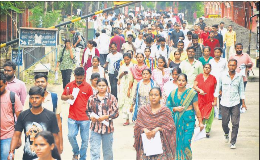
बरेली कॉलेज में प्रारंभिक योग्यता परीक्षा देकर बाहर आते अभ्यर्थी।