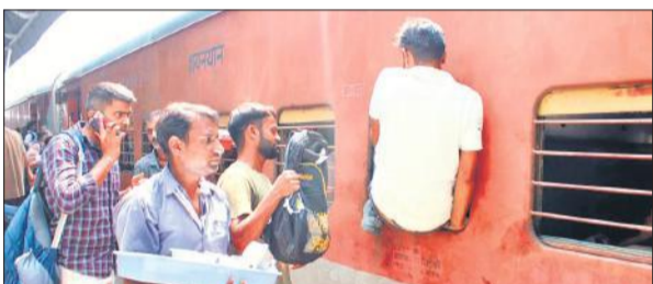
गेट से जगह नहीं मिली तो खिड़की से ट्रेन में घुसे अभ्यर्थी।