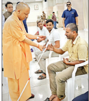
दिव्यांग को इलेक्ट्रॉनिक वॉकिंग स्टिक देते मुख्यमंत्री योगी।

प्रदेश के विभिन्न जिलों से आए 50 से अधिक फरियादियों ने मुख्यमंत्री से अपनी समस्याएं साझा की। ‘जनता दर्शन’ में जमीन से जुड़े विवादों