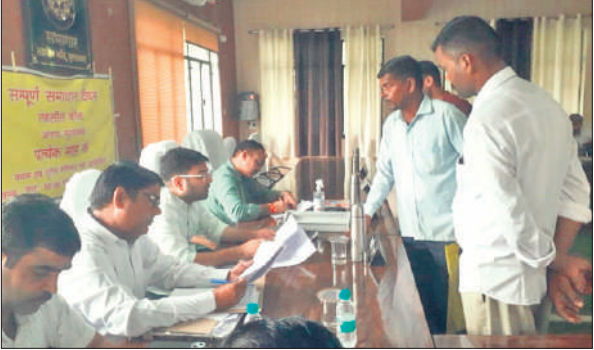
फरियादियों की समस्याएं सुनते अधिकारी।