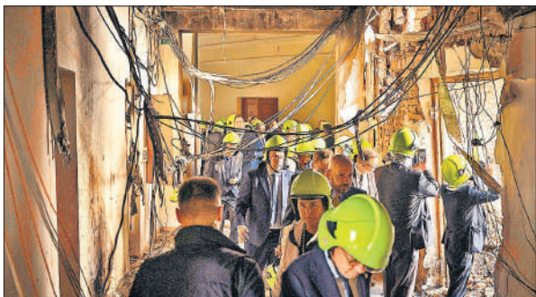
रूस के झेन हमले में क्षतिग्रस्त हुई कैबिनेट की इमारत का जायजा लेने पहुंचे जेलेंस्की ।

अमेरिका के राष्ट्रपति डोनाल्ड ट्रंप ने भारतीय वस्तुओं पर टैरिफ लगाया करके 50 प्रतिशत कर दिया है, जिसमें रूसी कच्चे तेल की भारत द्वारा खरीद पर 25 प्रतिशत अतिरिक्त शुल्क भी शामिल है।