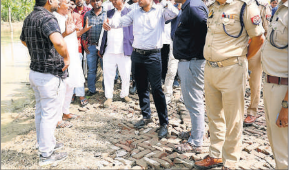
ग्रामीणों से वार्तालाप करते डीएम और एसपी।