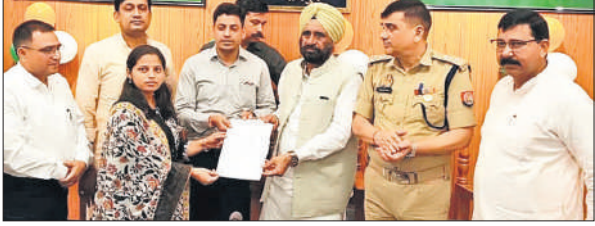
नियुक्ति पत्र देते राज्यमंत्री बलदेव सिंह औलख एवं जिलाधिकारी।