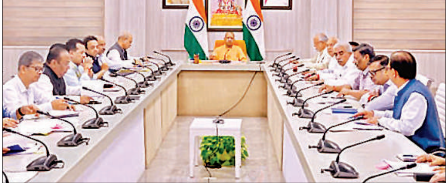
लखनऊ में अपने सरकारी आवास पर अंतरराष्ट्रीय व्यापार मेले के संबंध में बैठक करते मुख्यमंत्री योगी आदित्यनाथ।

मुख्यमंत्री योगी आदित्यनाथ ने आवास पर देर शाम तैयारियों की समीक्षा करते हुए कहा कि ट्रेड शो प्रदेश की वैश्विक ब्रांडिंग और निर्यात को नई पहचान देगा। आईटी/आईटीईएस, एमएसएमई, स्टार्टअप, शिक्षा, कृषि, स्वास्थ्य, पर्यटन, ऊर्जा और ओडीओपी सेक्टरों के उद्यमियों को वैश्विक मंच मिलेगा। उन्होंने मुख्यमंत्री