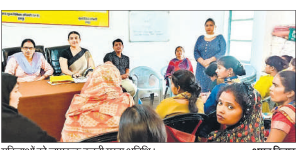
महिलाओं को जागरूक करती मुख्य अतिथि।