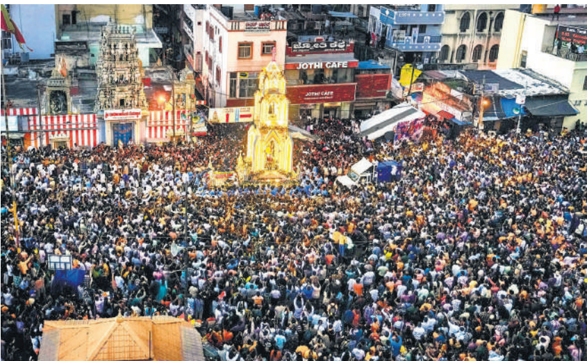
कर्नाटक के बेंगलुरु में सोमवार को सेंट मैरी बैसिलिका में सेंट मैरी के वार्षिक भोज और उत्सव के समापन के दौरान मदर मैरी के रथ जुलूस में भाग लेने के लिए भारी संख्या में इकट्ठे हुए लोग।