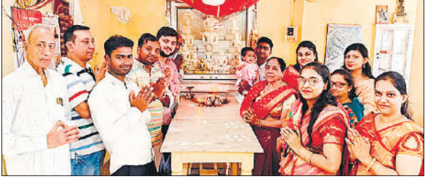
मंदिर में पूजा-अर्चना करते जैन समाज के लोग।