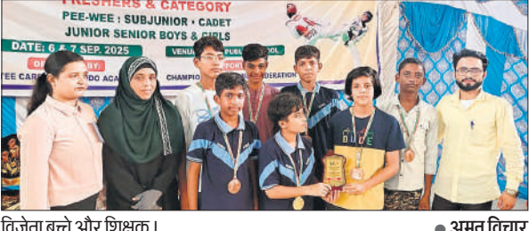
विजेता बच्चे और शिक्षक।