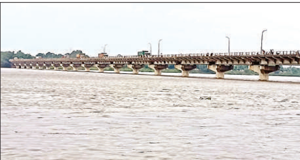
बाढ़ से पुल के करीब पहुंचा गंगा का लेवल।