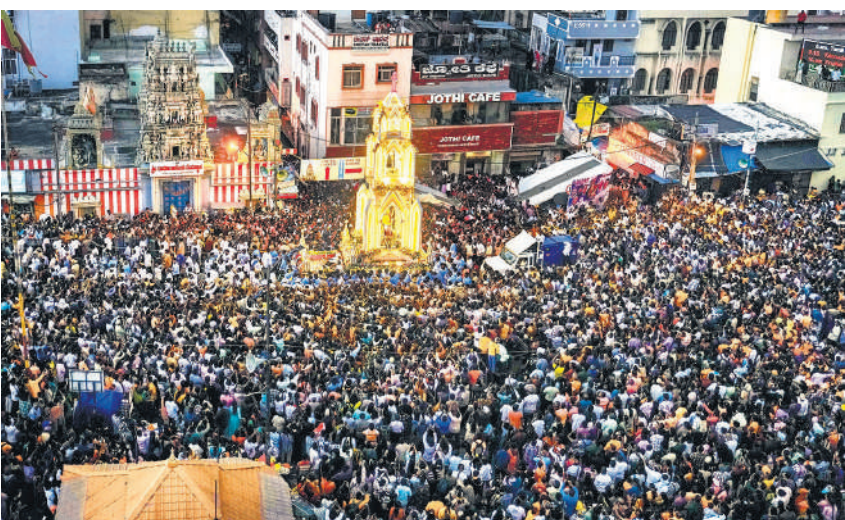
कर्नाटक के बेंगलुरु में सोमवार को सेंट मैरी बैसिलिका में सेंट मैरी के वार्षिक भोज और उत्सव के समापन के दौरान मदर मैरी के रथ जुलूस में भाग लेने के लिए भारी संख्या में इकट्ठे हुए लोग।