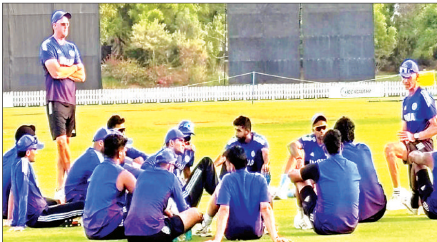
अबू धाबी में अभ्यास सत्र के दौरान भारतीय टीम।

भारत का एशिया कप में रिकॉर्ड अच्छा रहा है और इस बार तो पूरा शक्ति संतुलन उसके पक्ष में झुका हुआ नजर आ रहा है। ऐसे में उसे हराना किसी भी टीम के लिए सबसे बड़ी चुनौती होगी। भारतीय टीम को लेकर आत्मविश्वास इतना अधिक