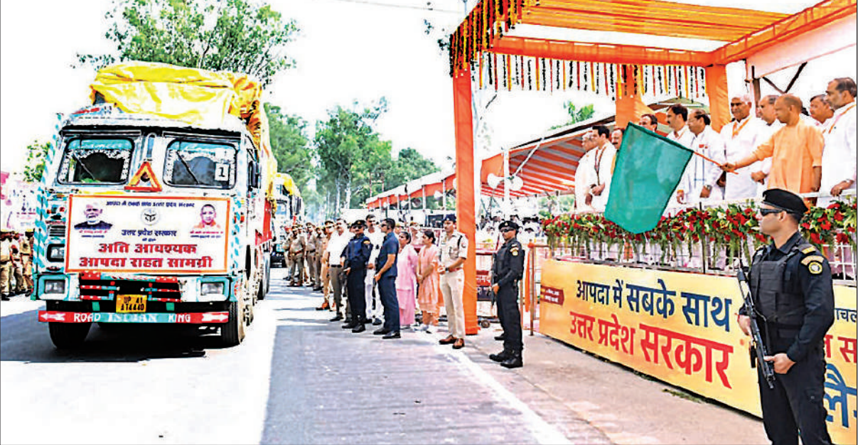
सहारनपुर में पंजाब, हिमाचल प्रदेश और उत्तराखंड के बाढ़ पीड़ितों की सहायता के लिए वाहनों को पलेग ऑफ करते मुख्यमंत्री योगी आदित्यनाथ।