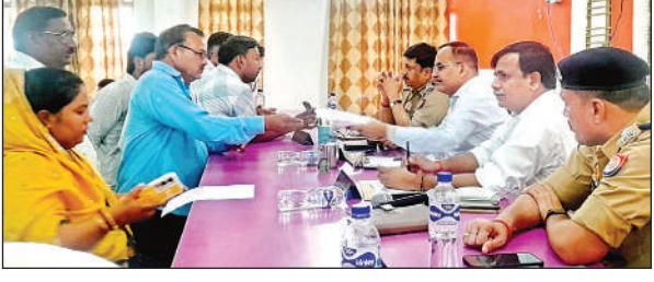
तहसील समाधान दिवस में शिकायतें सुनते डीएम और एसएसपी ।

● संपूर्ण समाधान दिवस में फिरयाद लेकर पहुंचे लोग