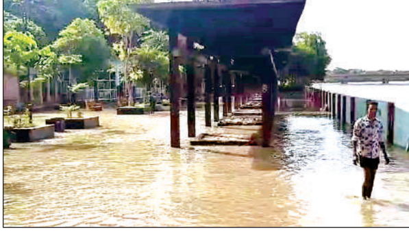
श्मशान स्थल पर भरा पानी ।

जसवंत नगर प्रतिनिधि के अनुसार तहसील क्षेत्र के कचौरा