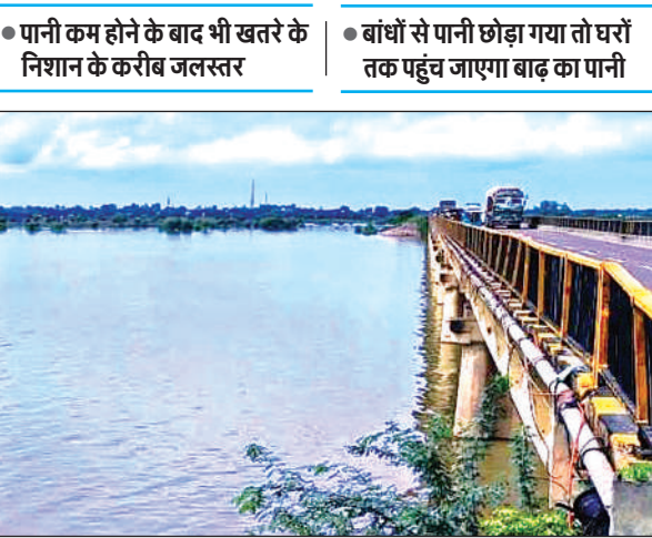
बेतवा नदी का जलस्तर कम होने लगा है।

राजस्थान, हरियाणा, दिल्ली, आगरा, मथुरा व मध्य प्रदेश में लगातार हो रही बारिश से वहां की आबादी वाले क्षेत्रों में बाढ़ का पानी भर गया है। मुख्यालय से होकर गुजरी यमुना और बेतवा नदियों का जलस्तर भी उफान पर है। सोमवार की सुबह 08 बजे यमुना नदी का 102.010 मीटर वहीं बेतवा नदी का जलस्तर 101.450 मीटर पर