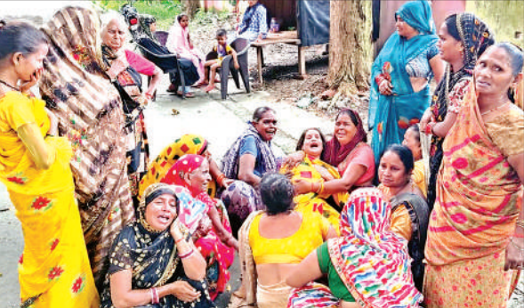
रोते बिलखते मृतक के परिजन।