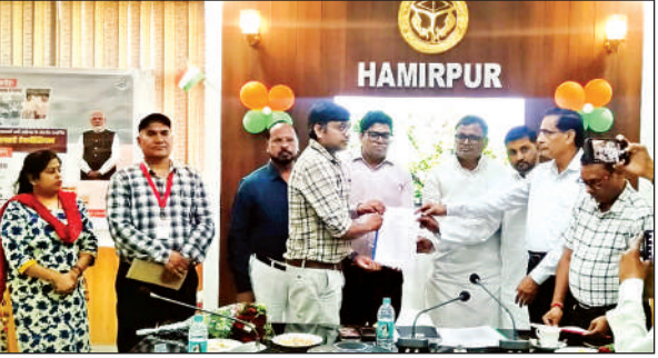
नवनियुक्त कनिष्ठ सहायक को नियुक्ति पत्र देते सदर विधायक।