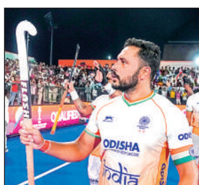
कप्तान हरमनप्रीत सिंह।

हरमनप्रीत सिंह ने कहा सभी खिलाड़ी पूरी तरह से एकाग्र थे। हम जानते थे कि हमें यह मैच जीतना है और हमने खुद से कहा कि विश्व कप के लिए क्वालीफाई करने का यही एकमात्र रास्ता है। आज एशिया की नंबर एक टीम के रूप में टूर्नामेंट में उतरते हुए, हम अपनी उम्मीदों पर कुछ सोख मिलती है। कोरिया हमने अपनी उम्मीदों के मुताबिक शुरुआत नहीं की, खासकर पिछले