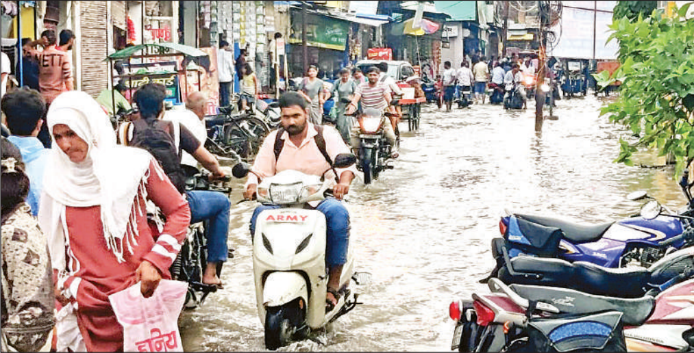
नगर पालिका व नगर पालिका रोड पर भरा पानी।

■ छिबरामऊ। दोपहर बाद आसमान में अचानक काली घटाएं छा गईं और मूसलाधार बारिश हुई। इससे मुख्य मार्ग समेत नगर की अधिकांश गलियों में घुटनों तक पानी भर गया। बरसात के बाद हुए जलभराव से जनजीवन जहां का तहां थम गया। बरसात बंद होने के बाद गलियों में भरा पानी निकलने में एक घंटे का समय लग गया। सोमवार को हुई जोरदार बरसात से कई जगह जलभराव हो गया। नवीन मंडी सहित सरकारी कार्यालयों में भी बारिश का पानी भर गया। मुख्य मार्ग समेत पीपल वाली गली, डाकघर तिराहा, तिरंगा तिराहा, सक्की मंडी, बजरिया गली, मोहल्ला बिरतिया, इंद्रानगर, गमा देवी मंदिर रोड, ताजपुर रोड समेत नगर की अधिकांश गलियां जलमग्न हो गईं। इसके अलावा विकास खंड परिसर, बिजलीघर, डाउट, तहसील परिसर व नवीन मंडी पूरी तरह से तालाब में तब्दील हो गए। यहां तक कि घरों में भी भरा पानी निकालने में लोगों को घंटों तक मशक्कत करनी पड़ी।