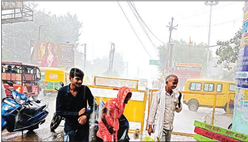
सरायमीरा में बारिश के दौरान निकलते लोग व मूसलाधार बरसात का नजारा।

यह बरसात थमने के करीब आधे घंटे बाद निकल सका। इसके साथ ही जिले भर में बरसात हुई जिसमें से तालग्राम में 55.5. कन्नौज में 59, तिरवां में 29 जबकि जलालाबाद में 15.5