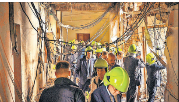
रूस के झेन हमले में क्षतिग्रस्त हुई कैबिनेट की इमारत का जायजा लेने पहुंचे जेलेंस्की ।

अमेरिका के राष्ट्रपति डोनाल्ड ट्रंप ने भारतीय वस्तुओं पर टैरिफ लगाया करके 50 प्रतिशत कर दिया है, जिसमें रूसी कच्चे तेल की भारत द्वारा खरीद पर 25 प्रतिशत अतिरिक्त शुल्क भी शामिल है।