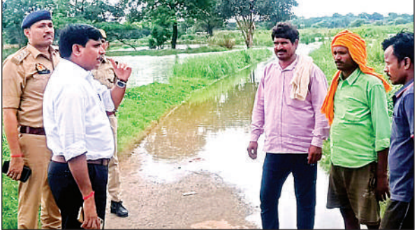
चकरनगर क्षेत्र के रास्तों में भरे पानी का निरीक्षण करते एसडीएम व सीओ ।

उन्होंने कहा कि अधिकारीगण सम्बंधित कर्मचारियों के साथ मौके पर जाकर शिकायतकर्ता का पक्ष सुनते हुए उसका निस्तारण करना सुनिश्चित करें। उन्होंने अधिकारियों को निर्देश दिये कि प्रकरणों की गंभीरता से जांच की जाये साथ ही जबाबदेह लोगों के विरुद्ध कार्यवाही की जाये। उन्होंने कहा कि जब भी अधिकारीगण गावों के भ्रमण पर जाये अपने विभाग से संबंधित