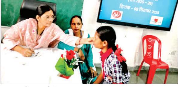
छात्रा का परीक्षण करती डॉक्टर ।

चकरनगर प्रतिनिधि के अनुसार तहसील क्षेत्र के खिरीटी, ककरैया, रानियाँ, निभी, भरेह और चकरपुरा छह गांव के पिछले चार दिनों से बाढ़ के कारण रास्ते बंद हैं। इन गांवों के मुख्य रास्तों में पानी भरा होने से लोगों को आवाजाही में भारी कठिनाई हो रही है। गांववासियों का कहना है कि लगभग एक हजार