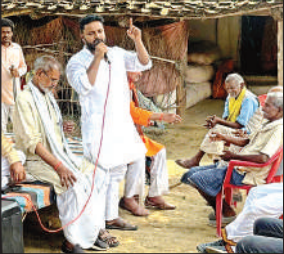
चौपाल को संबोधित करते वकता।

प्रमुख ग्राम पंचायत बरदाहा, हरलापुर, महमूदपुर, कुंडौरा, दरियापुर, नरायनपुर, मुंडेरा, टेढ़ा, पचखुरा, गुरदहा, पारा, पंधरी एवं चंदौली सहित गांवों में चौपाल संवाद एवं जागरूकता कार्यक्रम किया गया। समाज के लोगों ने कहा कि अब हम लोगों के अधिकार दबाएं नहीं जायेंगे। हम सभी संगठित होकर आगे बढ़ेंगे। जागरूकता अभियान में महिलाओं ने अध्यक्ष को तिलक