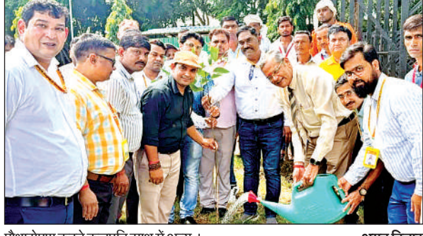
पौधारोपण करते कुलपति साथ में अन्य ।