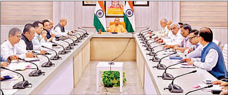
लखनऊ में अपने सरकारी आवास पर अंतरराष्ट्रीय व्यापार मेले के संबंध में बैठक करते मुख्यमंत्री योगी आदित्यनाथ।

मुख्यमंत्री योगी आदित्यनाथ ने आवास पर देर शाम तैयारियों की समीक्षा करते हुए कहा कि ट्रेड शो प्रदेश की वैश्विक ब्रांडिंग और निर्यात को नई पहचान देगा। आईटी/आईटीईएस, एमएसएमई, स्टार्टअप, शिक्षा, कृषि, स्वास्थ्य, पर्यटन, ऊर्जा और ओडीओपी सेक्टरों के उद्यमियों को वैश्विक मंच मिलेगा। उन्होंने मुख्यमंत्री