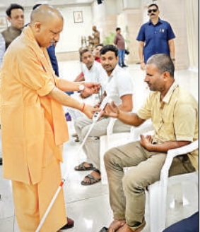
दिव्यांग को इलेक्ट्रॉनिक वॉकिंग स्टिक देते मुख्यमंत्री योगी।

प्रदेश के विभिन्न जिलों से आए 50 से अधिक फरियादियों ने मुख्यमंत्री से अपनी समस्याएं साझा की। ‘जनता दर्शन’ में जमीन से जुड़े विवादों