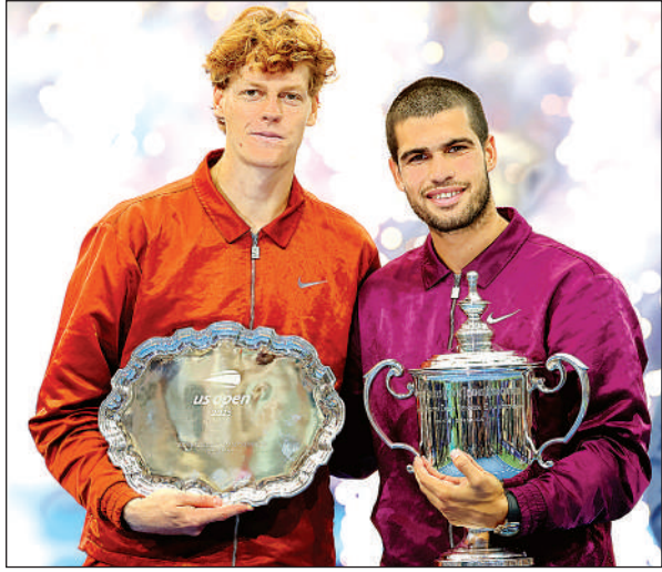
यूएस ओपन की ट्रॉफी के साथ कार्लोस अल्काराज। (दाएं) व उपविजेता यानिक सिनर।

मैच की शुरुआत लगभग आधे घंटे देर से हुई, जबकि हजारों प्रशंसक आर्थर ऐश स्टेडियम के बाहर फंसे रहे और उन्हें अतिरिक्त सुरक्षा से गुजरना पड़ा, क्योंकि राष्ट्रपति डोनाल्ड ट्रंप मैच देखने के लिए प्रायोजक के सुइट में बैठे थे।