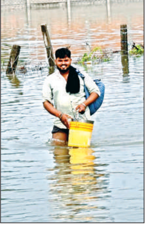
शुरू हो गया पलायन।

भगवानदीनपुरवा, भोपालपुरवा, लक्ष्मनपुरवा, दुर्गापुरवा के हैं। यहां चार फीट तक पानी भरा है और घरों के भीतर तक घुस गया है। गांवों से लोग पलायन कर गए हैं। कई ग्रामीणों ने बाढ़ से बचने के लिए अपनी गृहस्थी घर की दूसरी मंजिल या छत पर रख ली है। पशुओं को लाकर गंगा बैराज पर बांध दिया है। लक्ष्मनपुरवा के सरकारी स्कूल और आंगनबाड़ी केंद्र में करीब तीन से चार फीट तक पानी भरा है। सरकारी