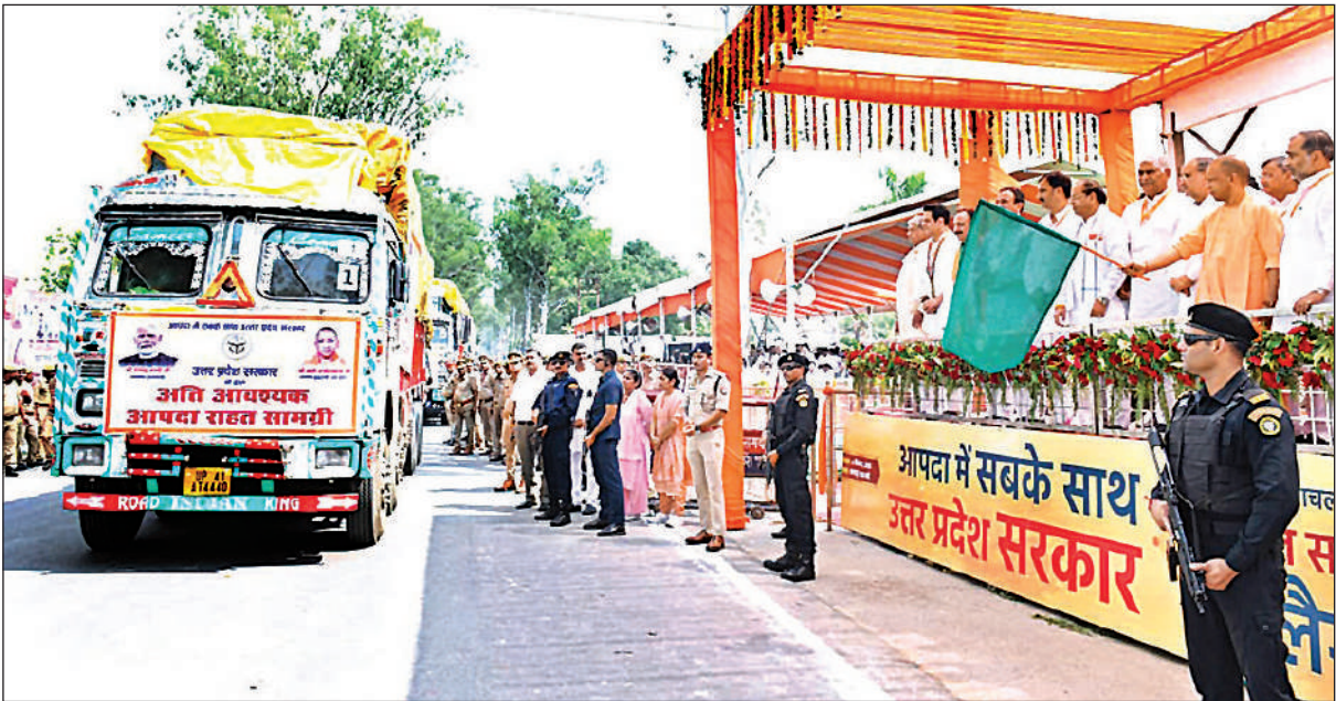
सहारनपुर में पंजाब, हिमाचल प्रदेश और उत्तराखंड के बाढ़ पीड़ितों की सहायता के लिए वाहनों को पलेग ऑफ करते मुख्यमंत्री योगी आदित्यनाथ।

समय पर तैयारी से बाढ़ से बचा यूपी : योगी प्रदेश में बाढ़ को सबसे बड़ी चुनौती बताते हुए योगी ने विभिन्न क्षेत्रों का जिक्र किया, जहां बाढ़ आई है। बताया कि इस वर्ष बाढ़ से अपेक्षाकृत कम क्षति हुई है, जिसका श्रेय समय पर की गई तैयारियों और मजबूत आपदा प्रबंधन को जाता है। उन्होंने बताया कि यमुना, गंगा, सरयू, घाघरा, रामगंगा और हिडन जैसी नदियों के किनारे बाढ़ प्रबंधन की मजबूत व्यवस्था की गई, जिससे जन-धन की हानि रोकੀ जा सकी।