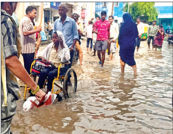
हैलट अस्पताल परिसर में भी भरा पानी।