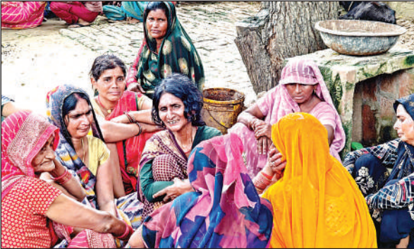
सोमवार सुबह शव मिलने के बाद रोती-बिलखती रही महिलाएं।