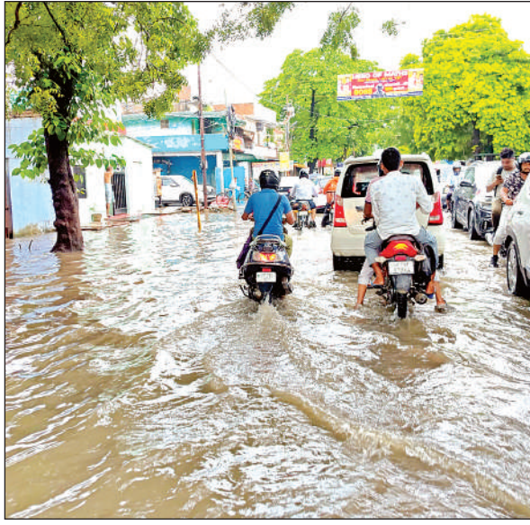
नीरक्षीर काकादेव में भरा पानी।

■ कानपुर। सोमवार दोपहर हुई तेज बारिश और अन्य कारणों की वजह से 50 से अधिक क्षेत्रों में बिजली तीन से चार घंटे तक गुल रही, जिसकी वजह से करीब 50 हजार लोगों को परेशानी का सामना करना पड़ा। आलुमंडी के मंजूश्री की बिजली ओवरहेड केबिल बॉक्स क्षतिग्रस्त से रात 11 बजे से तीन बजे तक और किंदवई नगर एच ब्लॉक व चालिस दुकान की बिजली आउटडोर केबिल बॉक्स में फॉल्ट होने पर रात दो बजे से सुबह पांच बजे तक बिजली नहीं थी। चकरी-2 में भूमिगत केबिल क्षतिग्रस्त होने से सोमवार सुबह 10 बजे से दोपहर दो बजे तक, शास्त्री नगर में जंपर क्षतिग्रस्त होने से दोपहर एक बजे से शाम पांच बजे तक और सर्वोदय नगर में तेज बारिश में ट्रिपिंग की वजह से दोपहर एक बजे से शाम पांच बजे तक बिजली गुल रही। नमक फैक्ट्री के आरपीएच-1 फीडर की बिजली तेज बारिश में इंजुलेटर क्षतिग्रस्त होने से दोपहर एक बजे से शाम पांच बजे तक बिजली व्यवधान रहा। इसके अलावा नयागंज, जुही, आर्य नगर, गोविंद नगर समेत 40 से अधिक क्षेत्रों में बिजली व्यवधान रहा। वहीं, शटडाउन के कारण भी उपभोक्ताओं को दिक्कतों का सामना करना पड़। केस्कू मीडिया प्रभारी देवेंद्र वर्मा के मुताबिक बारिश के कारण बिजली व्यवधान हो गया था, टीम ने मरम्मत कार्य के बाद आपूर्ति बहाल की।