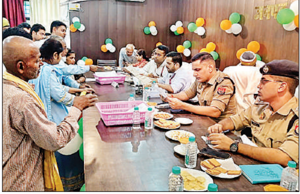
फरियादियों की समस्याएं सुनते डीएम, एसपी व अन्य अधिकारी।