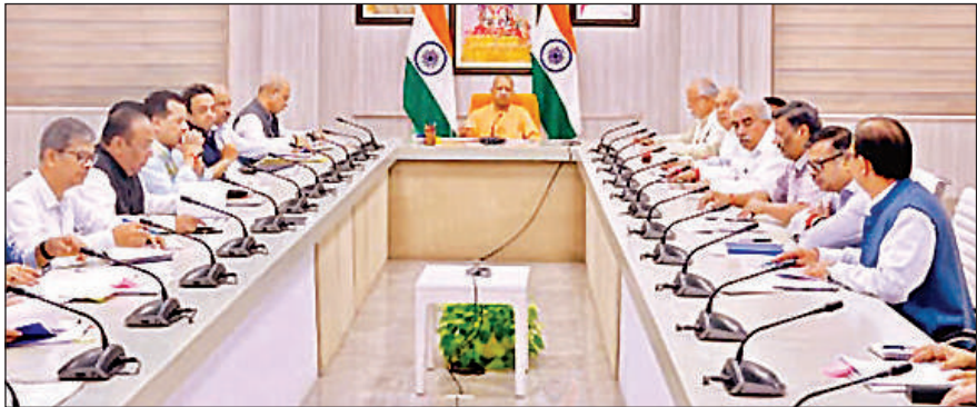
लखनऊ में अपने सरकारी आवास पर अंतरराष्ट्रीय व्यापार मेले के संबंध में बैठक करते मुख्यमंत्री योगी आदित्यनाथ।

राज्य ब्यूरो, लखनऊ अमृत विचार : उत्तर प्रदेश के ‘क्राफ्ट, कुजीन और कल्चर’ को दुनिया के व्यापारियों और उद्यमियों के सामने पेश करने वाला उत्तर प्रदेश इंटरनेशनल ट्रेड शो (यूपीआईटीएस) तीसरे संस्करण के साथ 25 से 29 सितंबर तक ग्रेटर नोएडा में आयोजित होगा। तैयारियों की समीक्षा करते हुए मुख्यमंत्री योगी आदित्यनाथ ने बताया कि इसका उद्घाटन प्रधानमंत्री नरेंद्र मोदी करेंगे। इस बार रूस भागीदार देश के रूप में शामिल है।