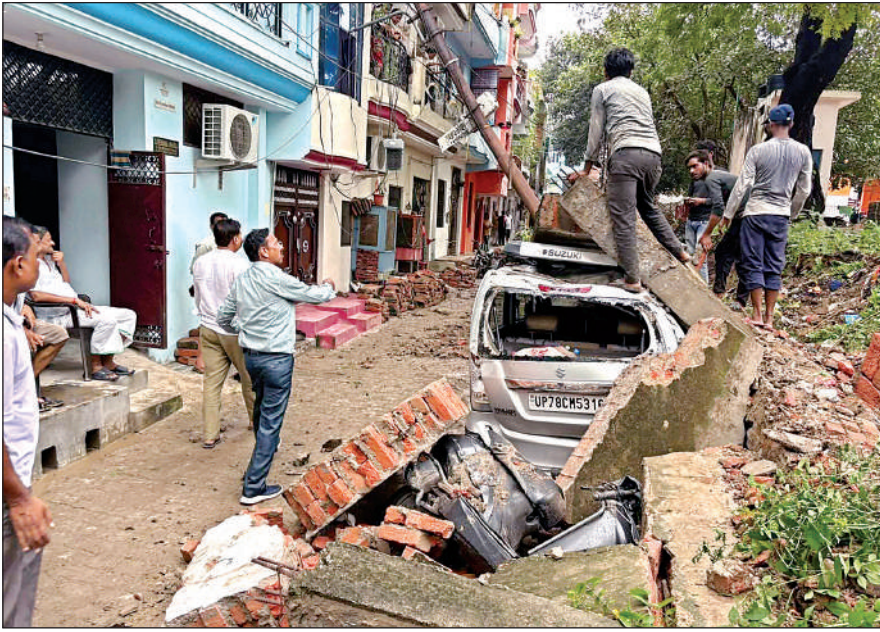
आवास विकास केशवपुरम ई सेक्टर स्थित भूतेश्वर मंदिर की दीवार गिरने से कई वाहन दब गए।