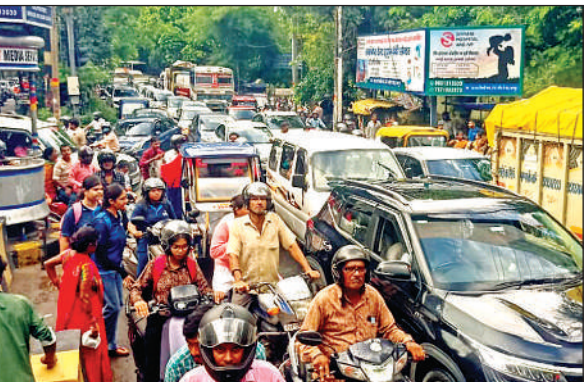
जेके मंदिर रोड पर ट्रैफिक जाम रहा।

सोमवार दोपहर एक बजे के बाद शहर में जबरदस्त बारिश हुई जिससे आरटीओ मार्ग पर घुटनों तक जलभराव हो गया। कई वाहन फंसकर खराब हुए और जाम लगा रहा। फजलगंज चौराहा के पास मरियमपुर की ओर मुख्य मार्ग पर भीषण जलभराव हो गया जिससे कई वाहन खराब हो गए। फजलगंज चौराहा से मरियमपुर होते हुए हैलट पुल तक भीषण जाम