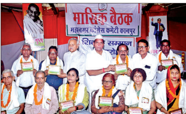
तिलक हाल में शिक्षकों को सम्मानित करते कांग्रेसी नेता।