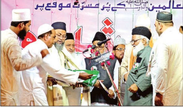
नातिया मुशायरा में कलाम पेश किए गए।