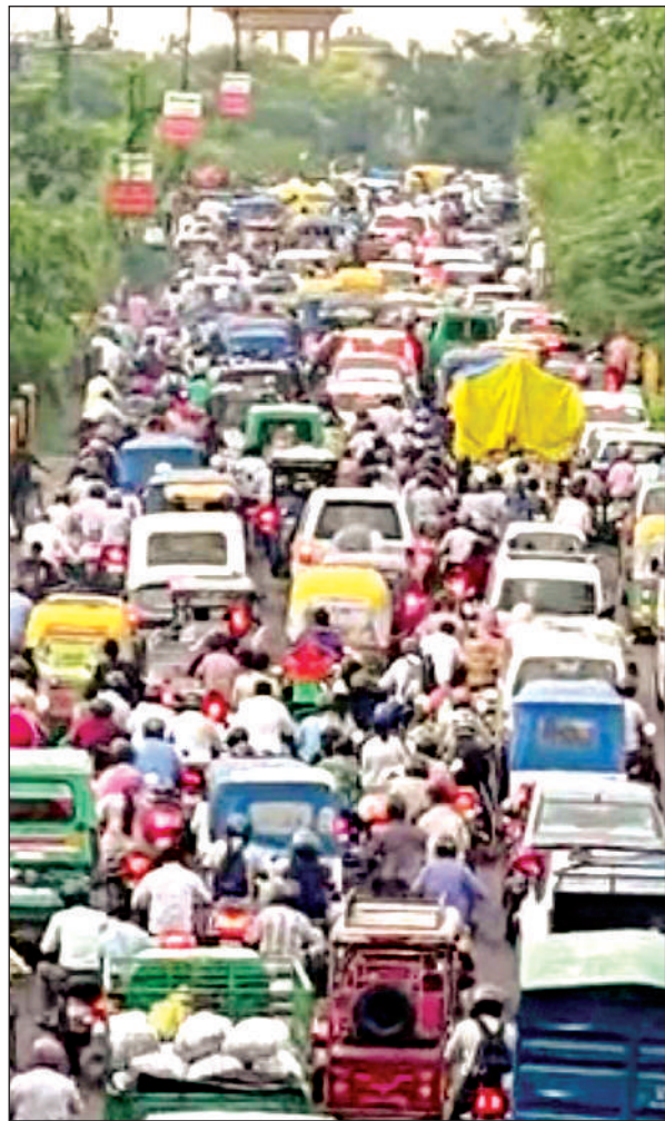
गोविंदपुरी पुल पर लगा जाम।