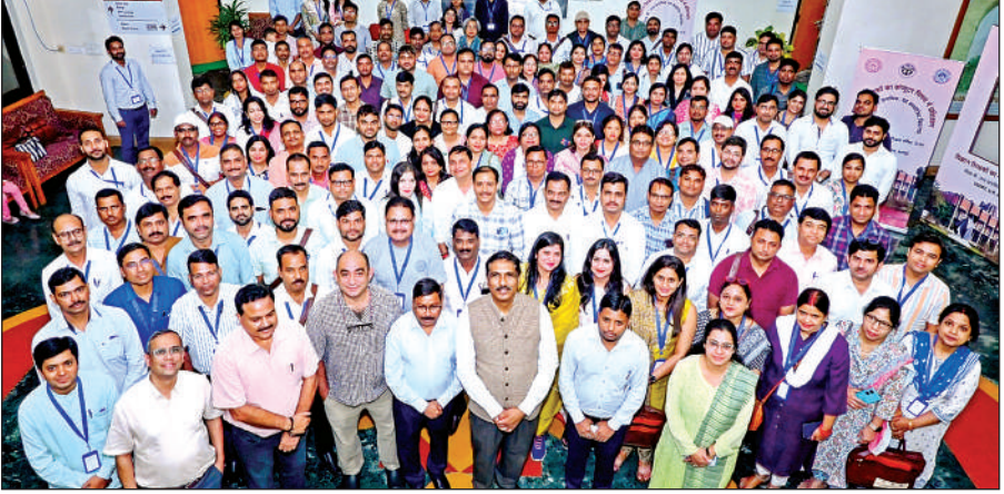
आईआईटी में प्रशिक्षण शिविर में जुटे शिक्षक।