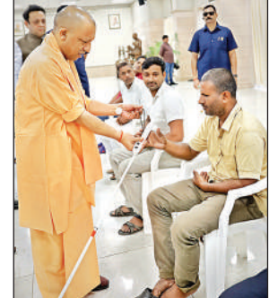
दिव्यांग को इलेक्ट्रॉनिक वॉकिंग स्टिक देते मुख्यमंत्री योगी।

प्रदेश के विभिन्न जिलों से आए 50 से अधिक फरियादियों ने मुख्यमंत्री से अपनी समस्याएं साझा की। ‘जनता दर्शन’ में जमीन से जुड़े विवादों