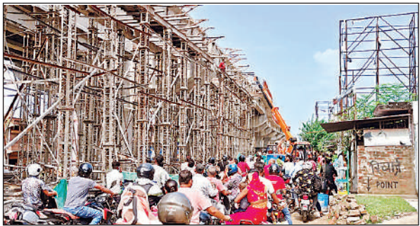
सरैयां क्रासिंग के पास जाम में फंसे वाहन।