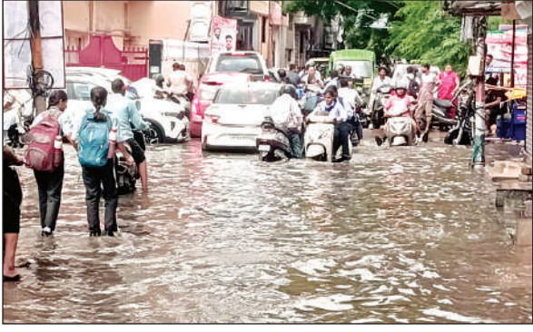
जाम से बचने को गली में घुसे तो और फंस गए वाहन।

घरों में पानी आ गया। यहां नाले के पानी को मंझाते हुए राहगीर निकले। बिरहाना रोड में भी बारिश का पानी भरने से लोग परेशान रहे। हैलट अस्पताल परिसर में पानी भरने से मरीजों-तीमारदारों को दिक्कत हुई। आरटीओ, आफिस, जेके टेंपल के बाहर, नीरक्षीर में भी बारिश का पानी भरा रहा।