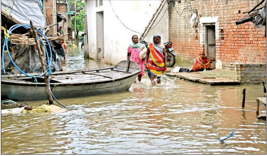
कटरी के गांवों में घुटनों तक पानी भर गया है। नावें चल रही हैं।