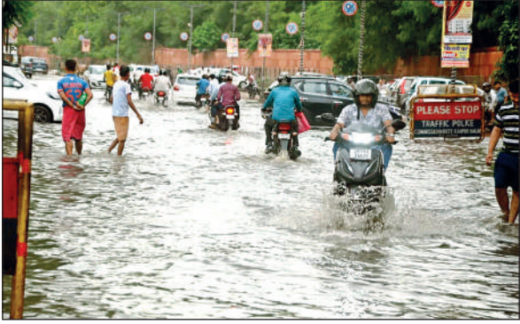
आनंदेश्वर मंदिर कॉरिडोर में भरा पानी।

हर बरसात में शहर का यही हाल होता, समाधान खोजने के लिए न अधिकारी गंभीर और न नेता