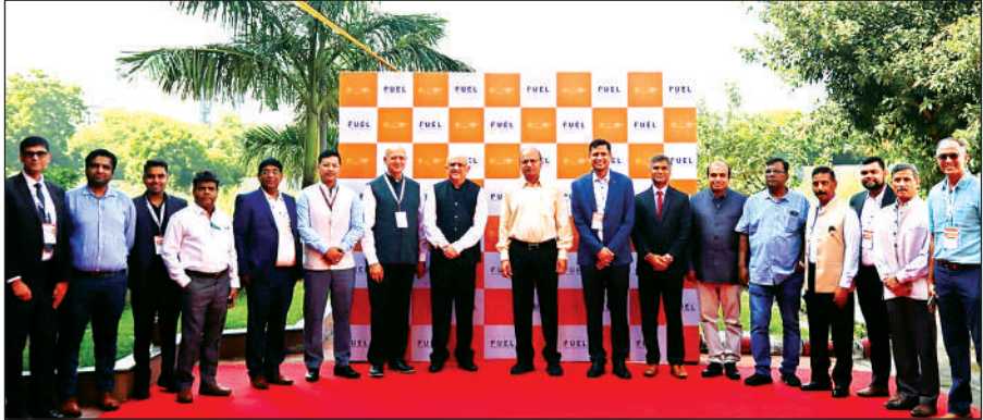
आईआईटी एसआईआईसी की बैठक में मौजूद अधिकारी और वैज्ञानिक।