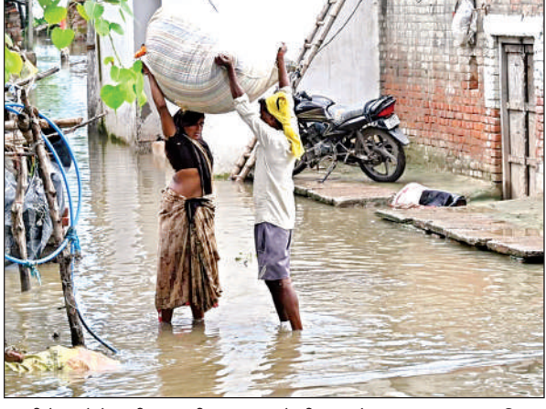
कटरी के गांवों में ग्रामीण जरूरी सामान बचाने की जुगत में।

गंगा बैराज पर जलस्तर इस साल के रिकॉर्ड स्तर पर पहुंच गया है। सोमवार को यहां 114.87 मीटर पानी दर्ज किया गया। यह खतरों के निशान से महज 13 सेंमी. ही रह गया है। ख्योरा कटरी के सात मजरों, बिदूर के छह गांवों में बाढ़ का पानी घुस गया है। हालात यह है कि घरों के अंदर तक पानी है। ग्रामीणों ने अपने जानवरों व गृहस्थी का जरूरी सामान लेकर गंगा बैराज पर टेंट लगाकर शरण