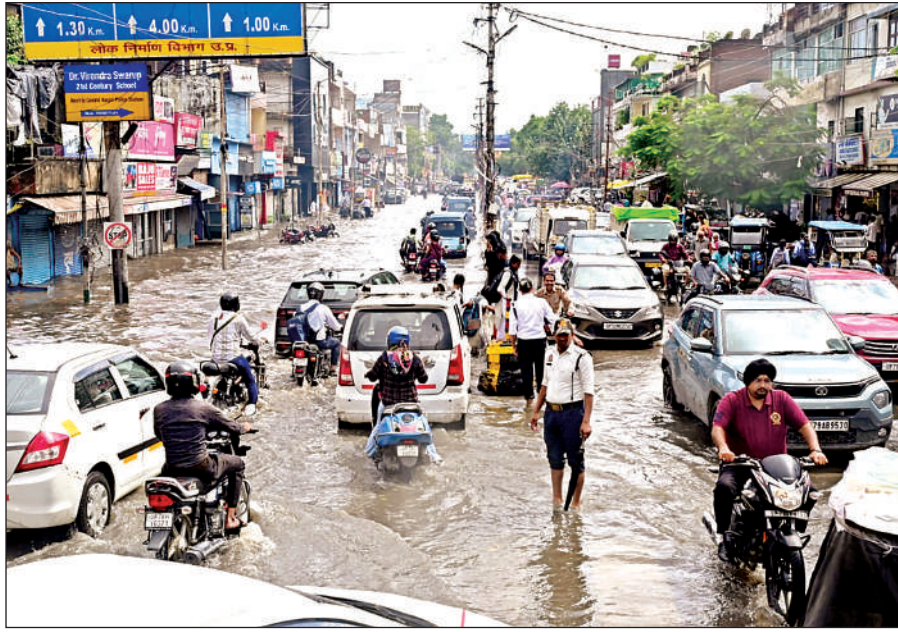
चावला चौराहे के पास जाम और जलभराव से जूझते रहे राहगीर।