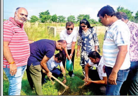
पौधरोपण करते जेसीआई के सदस्य।