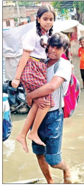
सीसामऊ में बच्ची को गोद में उठाया।