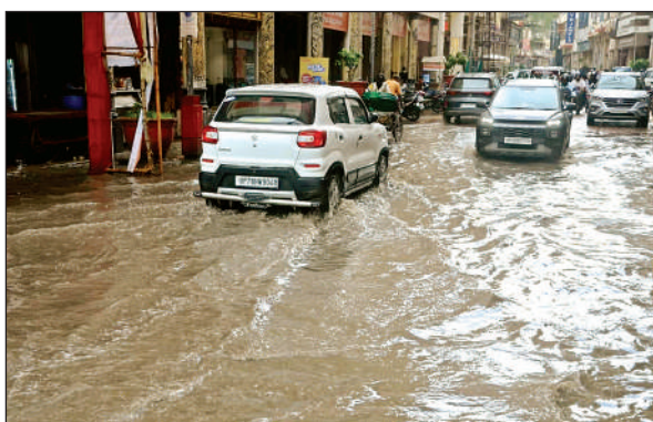
बिरहाना रोड भी जलभराव का शिकार।