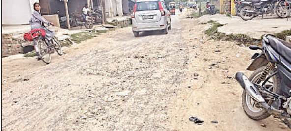
क्षतिग्रस्त पड़ी रोड।