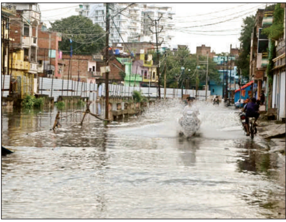
सीसामऊ नाला उफानाया, ग्वालटोली में जलभराव।