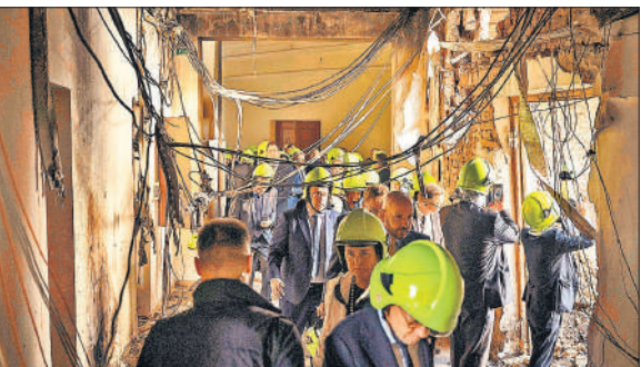
रूस के झेन हमले में क्षतिग्रस्त हुई कैबिनेट की इमारत का जायजा लेने पहुंचे जेलेंस्की ।

अमेरिका के राष्ट्रपति डोनाल्ड ट्रंप ने भारतीय वस्तुओं पर टैरिफ लगाया करके 50 प्रतिशत कर दिया है, जिसमें रूसी कच्चे तेल की भारत द्वारा खरीद पर 25 प्रतिशत अतिरिक्त शुल्क भी शामिल है।