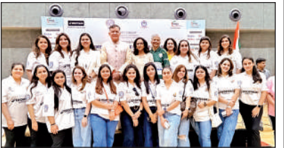
फिक्की प्लो की टीम के सदस्य।