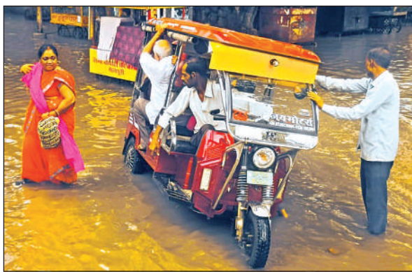
जेके टेंपल के बाहर जलभराव में ई-रिक्शा खराब हो गया।