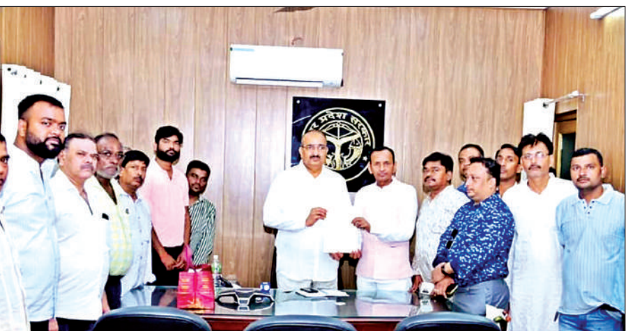
मंत्री निदेशक को ज्ञापन देते व्यापारी।

उपभोक्ता संतुष्टि का स्तर और बेहतर किया जा सके।