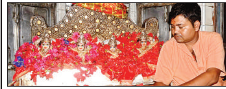
तोपेश्वरी देवी मंदिर में पूजा हुई।