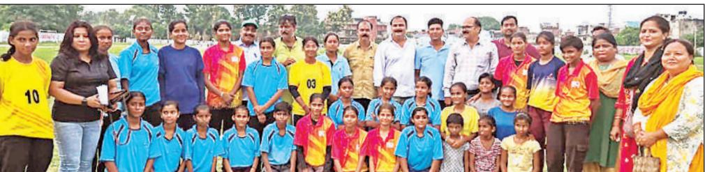
मंडलीय स्कूली खो-खो प्रतियोगिता में बालिका वर्ग की विजेता अयोध्या टीम।

बापू बालिका गर्ल्स इंटर कॉलेज के संयोजन में आयोजित प्रतियोगिता में चार टीमों ने प्रतिभाग किया। बालिका अंडर-19 मुकाबले में अंबेडकरनगर ने सुल्तानपुर को दो अंकों से और अयोध्या ने बाराबंकी