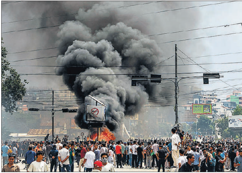
नेपाल के काठमांडू में सरकार विरोधी प्रदर्शन के दौरान आग के हवाले की गई सार्वजनिक संपत्ति।

उन्होंने बताया कि राष्ट्रपति पौडेल को लिखे अपने त्यागपत्र में ओली ने नेपाल के समक्ष मौजूद असाधारण परिस्थितियों का हवाला दिया और कहा कि वह मौजूदा स्थिति के संवैधानिक और राजनीतिक समाधान का मार्ग प्रशस्त करने के लिए पद छोड़ रहे हैं। सुरक्षा की खराब स्थिति को देखते हुए