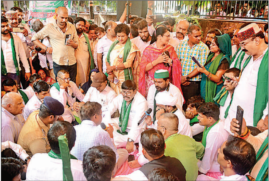
राजधानी स्थित शक्ति भवन में भाकियू भानु गुट की अगुवाई में धरने पर बैठे किसान।