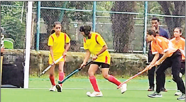
मुरादाबाद व चित्रकूट के बीच हुए राज्य सीनियर महिला हॉकी के लीग मुकाबले में गोल का प्रयास करतीं खिलाड़ी।

डाभासेमर स्थित डॉ. आंबेडकर अंतरराष्ट्रीय क्रीड़ा संकुल में प्रदेश खेल निदेशालय के तत्वावधान में चल रही प्रतियोगिता के दूसरे दिन पहला मुकाबला गोरखपुर व सहरानपुर मंडल के बीच खेला गया। गोरखपुर के खिलाड़ियों ने सहरानपुर पर 5-0 से आसान जीत दर्ज की। गोरखपुर की