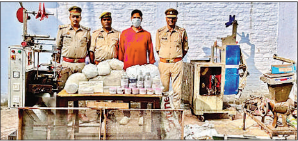
नकली गुटखा फैक्ट्री में पकड़े गए समान और आरोपित के साथ पुलिस टीम।