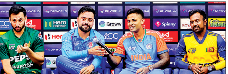
मीडिया को संबोधित करते पाकिस्तानी कप्तान सलमान अली आगा, अफगानिस्तान के कप्तान राशिद खान, भारतीय कप्तान सूर्यकुमार यादव और श्रीलंका के कप्तान चरित असलंका।

खिताब का प्रबल दावेदार भारत एशिया कप टी-20 क्रिकेट टूर्नामेंट में बुधवार को यहां जब मेजबान संयुक्त अरब अमीरात (यूएई) के खिलाफ अपने अभियान की शुरुआत करेगा तो ऑलराउंडर के जरिए टीम में पर्याप्त संतुलन स्थापित करने की कोशिश करेगा। भारत हालांकि अभी तक यह तय नहीं कर पाया है कि इस मुकाबले में तीसरे स्पिनर या विशेषज्ञ तेज गेंदबाज के साथ उतरना है या नहीं। मुख्य कोच गौतम गंभीर के कार्यभार संभालने के बाद से भारत ने सभी प्रारूपों में ऑलराउंडर को प्राथमिकता दी है। ऐसा विशेष कर बल्लेबाजी को मजबूत करने के लिए किया गया है ताकि आठवें नंबर तक उसके पास अच्छे बल्लेबाज रहे। अमीरात के खिलाफ मैच 14 सितंबर को पाकिस्तान के खिलाफ होने वाले महत्वपूर्ण मैच से पहले अभ्यास मैच की तरह होगा। कमजोर मानी जाने वाली यह टीम भारतीय टीम प्रबंधन को इस बात का अंदाजा देगी कि टूर्नामेंट में आगे बढ़ने के लिए किस संयोजन के साथ मैदान में उतरना बेहतर होगा। यूएई के खिलाड़ियों के लिए यह सबसे बड़ा मैच होगा।