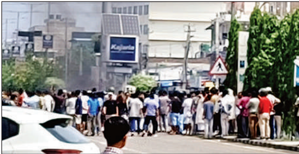
नेपाल में उपद्रव का नजारा।