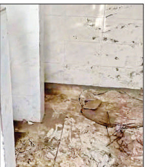
मवई की ग्राम पंचायत बीबीपुर में खराब पड़ा शौचालय।