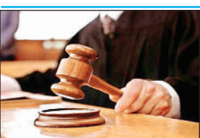
विधि संवाददाता, सुलतानपुर

● भूमि विवाद से जुड़े एक मामले में कोर्ट ने दिया आदेश