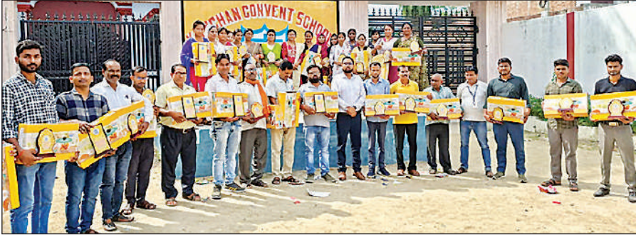
कंचन कॉन्वेंट के शिक्षकों को किया गया सम्मानित।