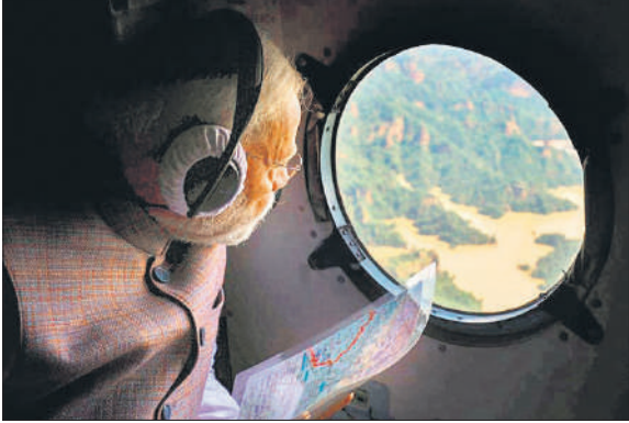
हिमाचल में बाढ़ और भूस्खलन प्रभावित क्षेत्रों का हवाई सर्वेक्षण करते प्रधानमंत्री।

प्रधानमंत्री ने बाढ़ प्रभावित पंजाब पर प्रत्येक मृतकों के परिजनों को 2 लाख रुपये और गंभीर रूप से घायलों को 50,000 रुपये की अनुग्रह राशि देने की घोषणा की। पंजाब में 1988 के बाद से सबसे भीषण बाढ़ से जूझ रहा है। पंजाब और उसके पड़ोसी हिमाचल प्रदेश में बाढ़ की स्थिति की समीक्षा करने के लिए एक दिवसीय दौरे पर आए मोदी हवाई सर्वेक्षण करने के बाद राज्य के सबसे बुरी तरह प्रभावित जिलों में से एक गुरदासपुर पहुंचे। यहां मोदी ने बाढ़ प्रभावित लोगों के साथ-साथ राष्ट्रीय आपदा