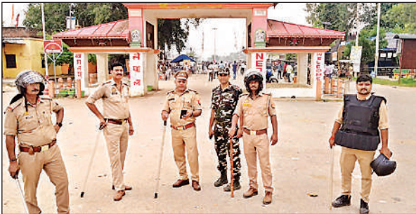
सुरक्षा को लेकर सीमा पर गश्त करते जवान।

सूत्रों के अनुसार नेपाल की राजधानी काठमांडू में भी हालात बेकाबू हैं। प्रदर्शनकारियों ने कई राष्ट्रीय स्तर के नेताओं पर हमला कर उन्हें दौड़ा-दौड़ा कर पीटा है। कुछ नेताओं के घरों में आगजनी की घटनाएं भी सामने आई हैं। हालात इस कदर गंभीर हो चुके हैं कि आंदोलनकारियों के