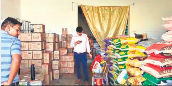
जांच पड़ताल करते खाद्य सुरक्षा विभाग के अधिकारी।