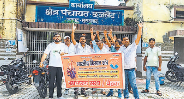
प्रदर्शन करते भारतीय किसान संघ के कार्यकर्ता ।

सत्र को समय से आरम्भ कर गन्ने का भाव 500 रुपये प्रति कि्वंटल करने एवं पत्नी पर मूल्य अंकित करने (निराश्रित पशुओं की समस्या का उचित व स्थायी समाधान निकालने की मांग की है। समस्याओं