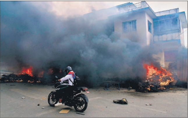
काठमांडू में प्रदर्शनकारियों ने मंगलवार को एक पुलिस थाना और तमाम वाहनों को फूंक दिया ।