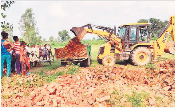
मुड़िया खेड़ा गांव में निर्माण सामग्री को ट्राली में लादती जैसीबी।