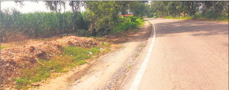
अधर में लटका सड़क चौड़ीकरण का कार्य ।

लगभग 6 माह से कांठ -हरिद्वार सड़क का चौड़ीकरण लटका है। मंडल मुख्यालय से छज़लैट तक सड़क का काम पूरा हुआ है लेकिन छज़लैट से सहसपुर के बीच 12.5 किलोमीटर का हिस्सा वन विभाग की जमीन के विवाद में फंसा हुआ है। यह क्षेत्र बिजनौर जिले का संरक्षित वन क्षेत्र है और दोनों ओर वन विभाग की जमीन होने की वजह से प्रशासन को यहां नया विकल्प ढूंढना ज़रूरी है। साल 2024 के अंत में इस प्रोजेक्ट की मंजूरी मिली थी। इसके तहत छज़लैट