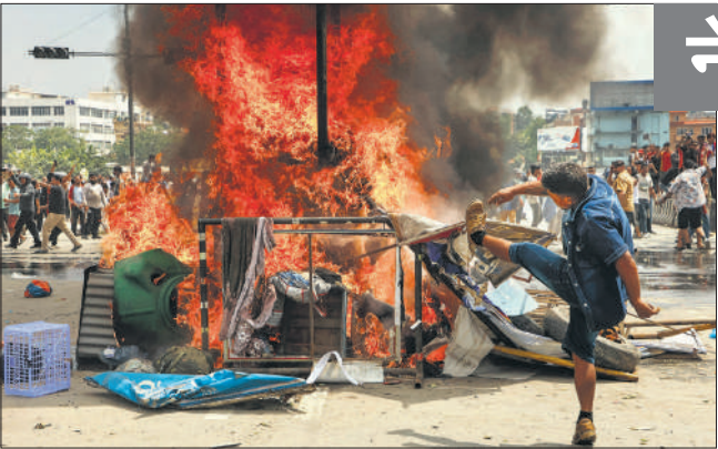
सड़कों पर नारेबाजी और आगजनी के साथ युवाओं ने जमकर अपने गुस्से का इजहार किया ।