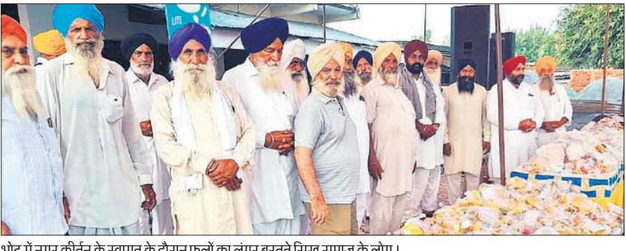
भोट में नगर कीर्तन के स्वागत के दौरान फलों का लंगर बरतते सिख समाज के लोग।