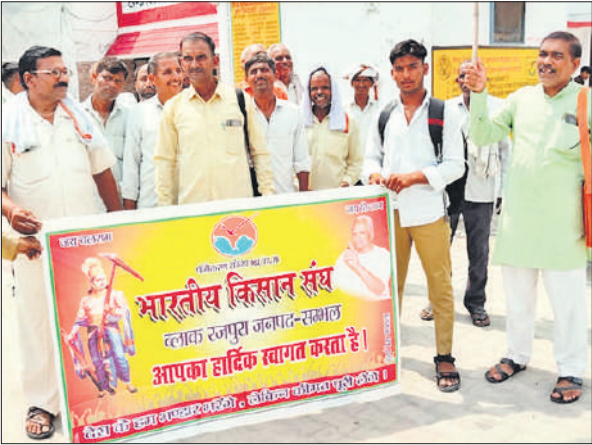
रजपुरा ब्लाक कार्यालय पर प्रदर्शन करते भारतीय किसान संघ कार्यकर्ता।

प्रदेश व्यापी आंदोलन के तहत मंगलवार को भारतीय किसान संघ के कार्यकर्ता जनपद के ब्लॉक मुख्यालयों पर पहुंचे। धरने पर बैठकर अपनी मांगों के समर्थन में नारेबाजी की। कहा कि नकली बीज व खाद की समस्या के साथ ही कीटनाशकों में मिलावट, खाद वितरण में अव्यवस्था, बिजली व