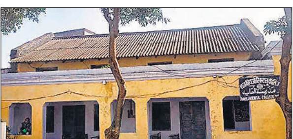
राजकीय रजा इंटर कॉलेज के दो कमरों में चलता है राजकीय ओरियंटल कॉलेज।

मदरसा आलिया नवाबी दौर में यूनिवर्सिटी हुआ करती थी और इसमें इंडोनेशिया, बांग्लादेश, अफगानिस्तान के अलावा कई देशों से छात्र शिक्षा ग्रहण करने आते थे। आजादी के बाद मदरसा आलिया को ओरियंटल कॉलेज का नाम दिया गया