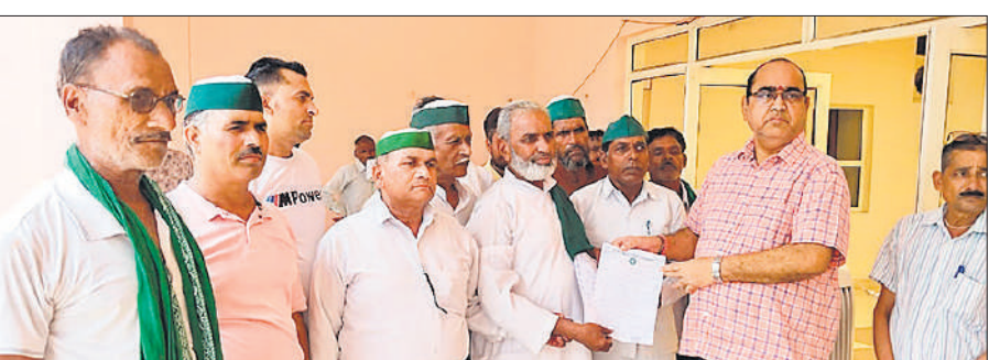
एसडीएम को ज्ञापन सौंपते भाकियू लोकशक्ति कार्यकर्ता।