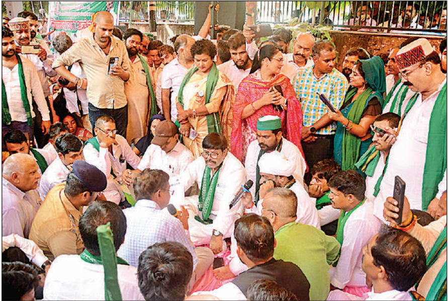
लखनऊ स्थित शक्ति भवन में भाकियू भासू गुट की अगुवाई में धरने पर बैठे किसान ।