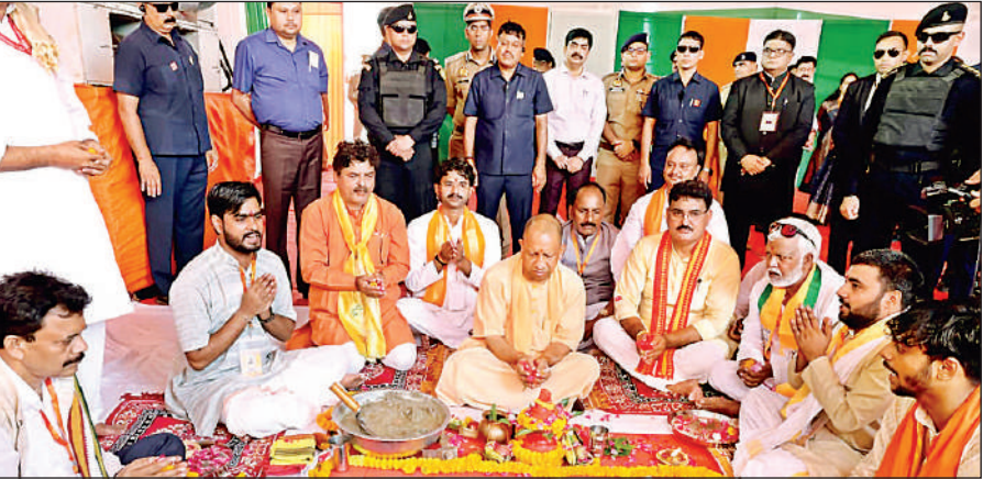
बस्ती जिले के बसहवा गांव में सरस्वती शिशु मंदिर का भूमि पूजन करते मुख्यमंत्री योगी आदित्यनाथ । साथ में अन्य लोग ।

मुख्यमंत्री ने मंगलवार को बस्ती के बसहवा में सरस्वती विद्या मंदिर वरिष्ठ माध्यमिक विद्यालय के भूमि पूजन और शिलान्यास करने के बाद बोल रहे थे। इस दौरान उन्होंने पौधरोपण किया और पुस्तक का विमोचन भी किया। सीएम ने कहा कि स्वतंत्रता के बाद जब सरकारें भारतीय शिक्षा मॉडल विकसित करने में विफल रहीं, तब नानाजी देशमुख ने गोरखपुर से सरस्वती शिशु मंदिर की नींव रखी। आज बिना सरकारी सहयोग के 12 हजार से अधिक विद्यालय विद्या भारती के माध्यम से राष्ट्र निर्माण में जुटे हैं। ये संस्थान सिर्फ पढ़ाई नहीं, बल्कि भारतीयता, संस्कृति और राष्ट्रीयता के भाव से ओतप्रोत नागरिक तैयार कर रहे हैं। सीएम ने कहा कि गुलामी की सोच ने भारत को अपनी जड़ों से काटा। हमने सुहेलदेव जैसे वीरों को भुला दिया और आक्रमणकारियों को पूजना शुरू कर दिया।