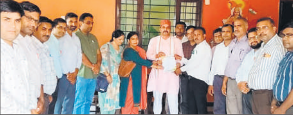
संभल में भाजपा जिलाध्यक्ष को ज्ञापन सौंपते शिक्षक।