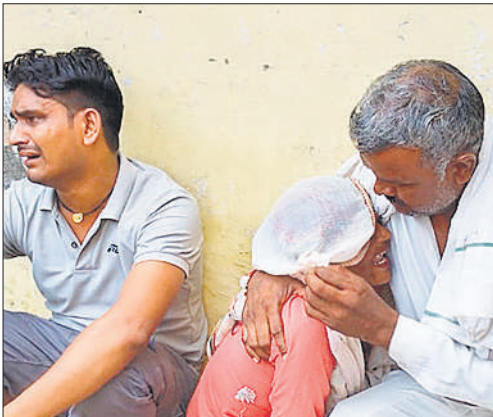
मृतक के परिजन विलाप करते हुए।