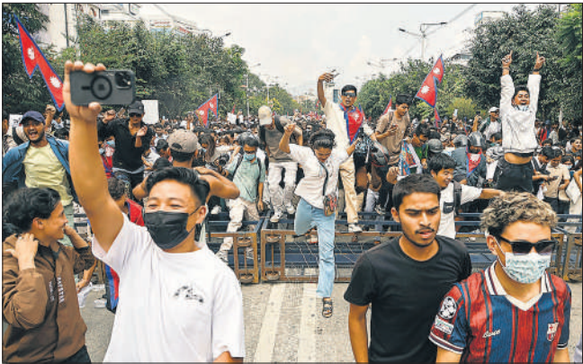
युवा प्रदर्शनकारी सड़कों पर उतरे तो पुलिस के बैरिकेड भी उन्हें नहीं रोक पाए ।