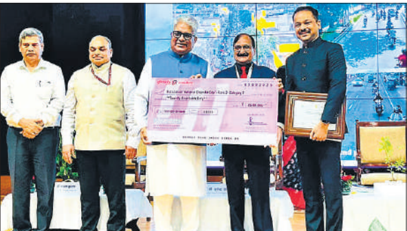
सांकेतिक चेक प्रदान करते केंद्रीय मंत्री भूपेंद्र सिंह यादव।