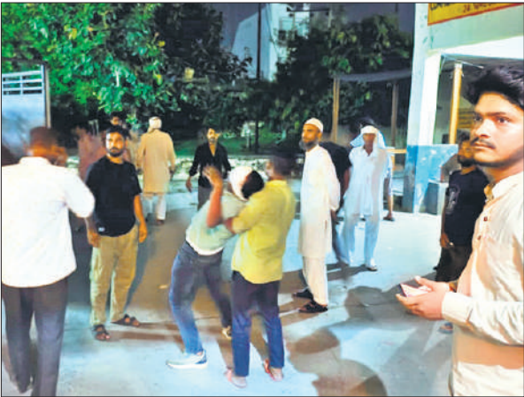
तीन किशोरों की मौत के बाद सीएससी पर बिलखते परिजन।