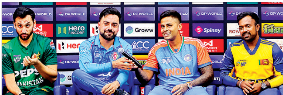
मीडिया को संबोधित करते पाकिस्तानी कप्तान सलमान अली आगा, अफगानिस्तान के कप्तान राशिद खान, भारतीय कप्तान सूर्यकुमार यादव और श्रीलंका के कप्तान चरित असलंका।

खिताब का प्रबल दावेदार भारत एशिया कप टी-20 क्रिकेट टूर्नामेंट में बुधवार को यहां जब मेजबान संयुक्त अरब अमीरात (यूएई) के खिलाफ अपने अभियान की शुरुआत करेगा तो ऑलराउंडर के जरिए टीम में पर्याप्त संतुलन स्थापित करने की कोशिश करेगा। भारत हालांकि अभी तक यह तय नहीं कर पाया है कि इस मुकाबले में तीसरे स्पिनर या विशेषज्ञ तेज गेंदबाज के साथ उतरना है या नहीं। मुख्य कोच गौतम गंभीर के कार्यभार संभालने के बाद से भारत ने सभी प्रारूपों में ऑलराउंडर को प्राथमिकता दी है। ऐसा विशेष कर बल्लेबाजी को मजबूत करने के लिए किया गया है ताकि आठवें नंबर तक उसके पास अच्छे बल्लेबाज रहे। अमीरात के खिलाफ मैच 14 सितंबर को पाकिस्तान के खिलाफ होने वाले महत्वपूर्ण मैच से पहले अभ्यास मैच की तरह होगा। कमजोर मानी जाने वाली यह टीम भारतीय टीम प्रबंधन को इस बात का अंदाजा देगी कि टूर्नामेंट में आगे बढ़ने के लिए किस संयोजन के साथ मैदान में उतरना बेहतर होगा। यूएई के खिलाड़ियों के लिए यह सबसे बड़ा मैच होगा।