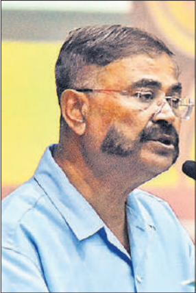
कार्यशाला को सम्बोधित करते पूर्व डीजीपी।

अमृत विचार : वर्ष 2047 में देश की आजादी के सौ वर्ष पूर्ण होंगे। इस समय तक हमें दुनिया में भारत और देश में प्रदेश को नंबर एक पर लाना है। यह तभी संभव है, जब देश के हर जिले का विकास हो इसलिए समर्थ उत्तर प्रदेश 2047 अभियान चलाया जा रहा है। यूपी, जो 2017 से पहले था, अब काफी बदल गया है। अपराधियों पर कार्रवाई के बाद भयमुक्त हो चुके यूपी में अब दूसरे राज्यों से लोग निवेश करने को आगे आ रहे हैं। अभियान का मकसद यह कि समाज का कोई भी वर्ग विकास से बाहर न रहे, इसलिए कार्यक्रम में आपकी सहभागिता और आपके सुझाव से हर वर्ग को फायदा मिलेगा। यह बातें समर्थ उत्तर प्रदेश-विकसित उत्तर प्रदेश-2047 अभियान में पूर्व डीजीपी प्रशांत कुमार ने जीआईसी आडिटोरियम में कहीं। पूर्व आईएस रामाशंकर मौर्य ने कहा कि भारत की अर्थव्यवस्था को मजबूत करने के लिए उत्तर प्रदेश का महत्वपूर्ण योगदान होना जरूरी है। प्रदेश की 6 ट्रिलियन अर्थव्यवस्था बनाए जाने का लक्ष्य रखा है। उन्होंने विकसित भारत के लिए सुझाव देने की अपील कर बताया कि लोगों को सुझाव देने के लिए क्यूआर कोड भी लांच किया है। सुझाव देते ही सहभागिता संबंधी सर्टिफिकेट जनरेट हो जाएगा। उत्तर प्रदेश में कौशल विश्वविद्यालय की स्थापना किए जाने, हिन्दी को भारतीय और अधिक आत्मोयता के साथ स्वीकारने, वोकेशनल एजुकेशन को प्रत्येक छात्र के लिए लेना और उत्तीर्ण होना