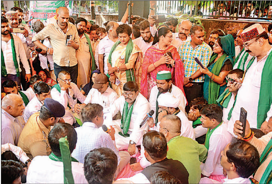
लखनऊ स्थित शक्ति भवन में भाकियू भासू गुट की अगुवाई में धरने पर बैठे किसान ।

■ अमृत विचार, लखनऊ : योगी सरकार ने गरीब बच्चों को निजी स्कूलों में प्रवेश दिलाने की प्रक्रिया को और कड़ा बनाते हुए सख्त नियम और निगरानी के साथ लागू कर दिया है। शिक्षा विभाग ने शासनादेश जारी करते हुए कहा कि आवेदन पूरी तरह ऑनलाइन होंगे और इसके लिए माता-पिता व बच्चे का आधार कार्ड अनिवार्य होगा। पूर्व-प्राथमिक कक्षाओं में प्रवेश की आयु सीमा 3 से 6 वर्ष और कक्षा-1 के लिए 6 से 7 वर्ष निर्धारित की गई है। पहली बार जिलास्तर पर क्रियान्वयन एवं अनुश्रवण समिति का गठन किया गया है, जिसकी अध्यक्षता जिलाधिकारी करेंगे। समिति में दर्जन भर से अधिक जिला स्तरीय अधिकारी सदस्य होंगे, जो पूरी प्रक्रिया की निगरानी करेंगे। प्रवेश आवेदन और प्रक्रिया के दौरान उत्पन्न विवादों का त्वरित निस्तारण चार सदस्यीय विवाद समाधान समिति करेगी, जिसका नेतृत्व सीडीओ करेंगे। िब्सिक शिक्षा मंत्री संदीप सिंह ने कहा कि योजना का लाभ अनुसूचित जाति, जनजाति, पिछड़े वर्ग, अनाथ, निराश्रित, एचआईवी/एडस व कैसर पीड़ित अभिभावकों के बच्चे, दिव्यांग परिवारों के बच्चे और वार्षिक आय 1 लाख तक वाले परिवारों के बच्चों को मिलेगा।