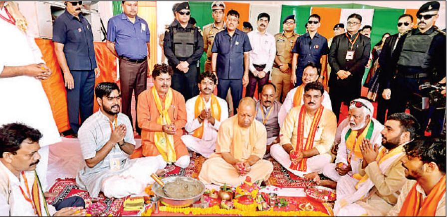
बस्ती जिले के बसहवा गांव में सरस्वती शिशु मंदिर का भूमि पूजन करते मुख्यमंत्री योगी आदित्यनाथ । साथ में अन्य लोग ।

मुख्यमंत्री ने मंगलवार को बस्ती के बसहवा में सरस्वती विद्या मंदिर वरिष्ठ माध्यमिक विद्यालय के भूमि पूजन और शिलान्यास करने के बाद बोल रहे थे। इस दौरान उन्होंने पौधरोपण किया और पुस्तक का विमोचन भी किया। सीएम ने कहा कि स्वतंत्रता के बाद जब सरकारें भारतीय शिक्षा मॉडल विकसित करने में विफल रहीं, तब नानाजी देशमुख ने गोरखपुर से सरस्वती शिशु मंदिर की नींव रखी। आज बिना सरकारी सहयोग के 12 हजार से अधिक विद्यालय विद्या भारती के माध्यम से राष्ट्र निर्माण में जुटे हैं। ये संस्थान सिर्फ पढ़ाई नहीं, बल्कि भारतीयता, संस्कृति और राष्ट्रीयता के भाव से ओतप्रोत नागरिक तैयार कर रहे हैं। सीएम ने कहा कि गुलामी की सोच ने भारत को अपनी जड़ों से काटा। हमने सुहेलदेव जैसे वीरों को भुला दिया और आक्रमणकारियों को पूजना शुरू कर दिया।