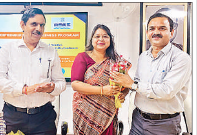
बीबीएयू में कार्यशाला में उपस्थित अतिथि।

अमृत विचार, लखनऊ: मां अष्टभुजी राष्ट्रीय धर्म ज्योतिष केन्द्र लखनऊ एवं ज्योतिष प्रांगण के संयुक्त तत्वावधान में आगामी 8 व 9 नवम्बर को दो दिवसीय राष्ट्रीय ज्योतिष धर्म सम्मेलन का आयोजन बिजनौर रोड में किया जाएगा। आयोजक आचार्य डॉ. रजनी अवस्थी ने बताया कि कार्यक्रम में विभिन्न राज्यों से 300 से अधिक ज्योतिषाचार्य भाग लेंगे। जिसमें टेरो कार्ड रीडर, रिपरिचुअल हीलर, रमल ज्योतिष, लाल किताब, ब्रह्म नाडी, वास्तुशास्त्र, हस्तरेखा, रेकी, वैदिक कर्मकांड और अवलट जैसे अन्य पद्धतियों से जुड़े विशेषज्ञ शामिल होंगे। उद्घाटन 8 नवम्बर को होगा। कार्यक्रम की अध्यक्षता प्रदेश के उप- मुख्यमंत्री ब्रजेश पाठक करेंगे। मुख्य अतिथि आचार्य मोहित शुक्ला होंगे।