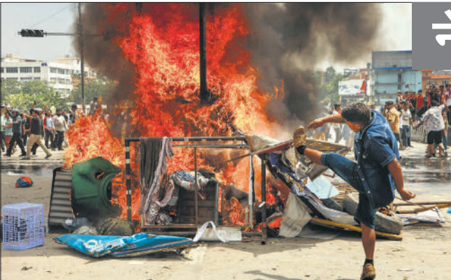
सड़कों पर नारेबाजी और आगजनी के साथ युवाओं ने जमकर अपने गुस्से का इजहार किया।