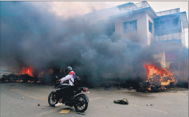
काठमांडू में प्रदर्शनकारियों ने मंगलवार को एक पुलिस थाना और तमाम वाहनों को फूंक दिया।