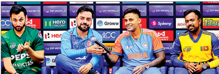
मीडिया को संबोधित करते पाकिस्तानी कप्तान सलमान अली आगा, अफगानिस्तान के कप्तान राशिद खान, भारतीय कप्तान सूर्यकुमार यादव और श्रीलंका के कप्तान चरित असलंका।

खिताब का प्रबल दावेदार भारत एशिया कप टी-20 क्रिकेट टूर्नामेंट में बुधवार को यहां जब मेजबान संयुक्त अरब अमीरात (यूआई) के खिलाफ अपने अभियान की शुरुआत करेगा तो ऑलराउंडर के जरिये टीम में पर्याप्त संतुलन स्थापित करने की कोशिश करेगा। भारत हालांकि अभी तक यह तय नहीं कर पाया है कि इस मुकाबले में तीसरे स्पिनर या विशेषज्ञ तेज गेंदबाज के साथ उतरना है या नहीं। मुख्य कोच गौतम गंभीर के कार्यभार संभालने के बाद से भारत ने सभी प्रारूपों में ऑलराउंडर को प्राथमिकता दी है। ऐसा विशेष कर बल्लेबाजी को मजबूत करने के लिए किया गया है ताकि आठवें नंबर तक उसके पास अच्छे बल्लेबाज रहें। अमीरात के खिलाफ मैच 14 सितंबर को पाकिस्तान के खिलाफ होने वाले महत्वपूर्ण मैच से पहले अभ्यास मैच की तरह होगा। कमजोर मानी जाने वाली यह टीम भारतीय टीम प्रबंधन को इस बात का अंदाजा देगी कि टूर्नामेंट में आगे बढ़ने के लिए किस संयोजन के साथ मैदान में उतरना बेहतर होगा। यूआई के खिलाड़ियों के लिए यह सबसे