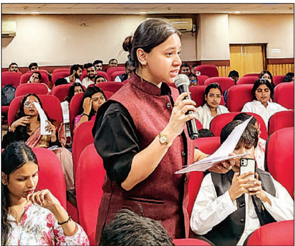
लोकभारत लोकमंथन में प्रश्न पूछती प्रतिभागी।