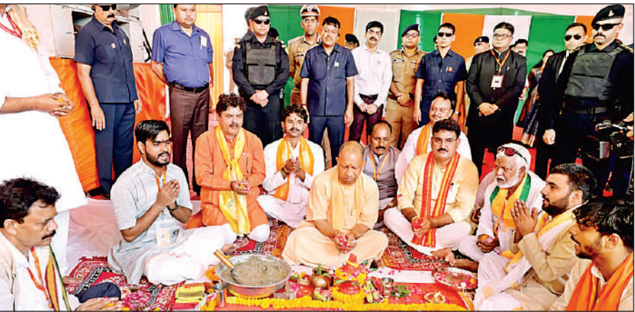
बस्ती जिले के बसहवा गांव में सरस्वती शिशु मंदिर का भूमि पूजन करते मुख्यमंत्री योगी आदित्यनाथ साथ में अन्य लोग।

मुख्यमंत्री ने मंगलवार को बस्ती के बसहवा में सरस्वती विद्या मंदिर वरिष्ठ माध्यमिक विद्यालय के भूमि पूजन और शिलान्यास करने के बाद बोल रहे थे। इस दौरान उन्होंने पौधरोपण किया और पुस्तक का विमोचन भी किया। सीएम ने कहा कि स्वतंत्रता के बाद जब सरकारें भारतीय शिक्षा मॉडल विकसित करने में विफल रहीं, तब नानाजी देशमुख ने गोरखपुर से सरस्वती शिशु मंदिर की नींव रखी। आज बिना सरकारी सहयोग के 12 हजार से अधिक विद्यालय विद्या भारती के माध्यम से राष्ट्र निर्माण में जुटे हैं। ये संस्थान सिर्फ पढ़ाई नहीं, बल्कि भारतीयता, संस्कृति और राष्ट्रीयता के भाव से ओतप्रोत नागरिक तैयार कर रहे हैं। सीएम ने कहा कि गुलामी की सोच ने भारत को अपनी जड़ों से काटा। हमने सुहेलदेव जैसे वीरों को भुला दिया और आक्रमणकारियों को पूजना शुरू कर दिया।