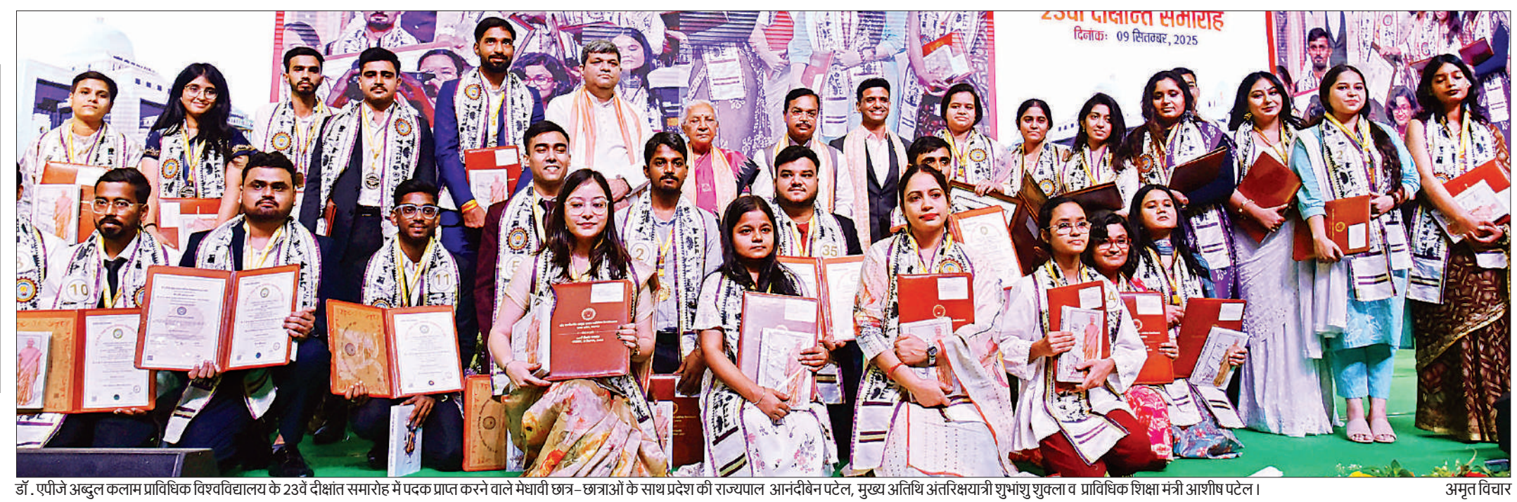
डॉ. एपीजे अब्दुल कलाम प्राविधिक विश्वविद्यालय के 23वें दीक्षांत समारोह में पदक प्राप्त करने वाले मेधावी छात्र-छात्राओं के साथ प्रदेश की राज्यपाल आनंदीबेन पटेल, मुख्य अतिथि अंतरिक्षयात्री शुभांशु शुक्ला व प्राविधिक शिक्षा मंत्री आशीष पटेल।