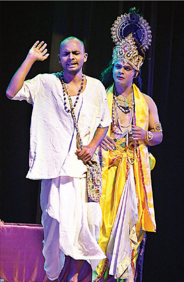
संतगाडगे प्रेक्षागृह में नाटक कलयुगी सुदामा का मंचन करते कलाकार।