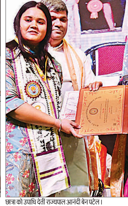
छात्रा को उपाधि देती राज्यपाल आनंदी बेन पटेल। अमृत विचार

तैयारी का समय होता है। इस इंतजार ने हमें तैयार किया। कहा कि यात्रा के दौरान मुझे दुनिया के कुछ बेहतरीन एवं कबिल लोगों के साथ काम करने का अनुभव मिला। अंतरिक्ष में कई शोध किये। जो आने वाले मिशन में काफी काम आएगा। छात्रों को दिये सफलता के मंत्र: शुभांशु ने छात्रों को छह मंत्र भी