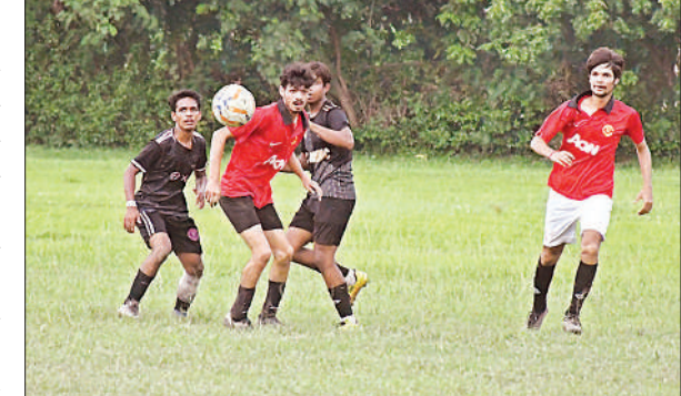
बॉल पर कब्जे को लेकर एक दूसरे से भिड़ते खिलाड़ी। अमृत विचार

कार्यालय संवाददाता, लखनऊ अमृत विचार: ला-मार्टीनियर पोले ग्राउंड में चल रही ला-मार्टीनियर फुटबॉल लीग में मंगलवार को खेले गए मुकाबलों में मिनी स्टेडियम (गोमतीनगर) और विंटर रिजर्व क्लब ने शानदार जीत दर्ज कर पूरे अंक हासिल किए। दिन का पहला मुकाबला मिनी स्टेडियम और स्वॉर्डवाकर्स के बीच खेला गया। मुकाबला शुरू से ही संघर्षपूर्ण रहा। दोनों टीमों ने आक्रामक खेल दिखाया और एक-दूसरे पर लगातार कई मूव बनाए, लेकिन पहला हाफ बिना किसी गोल के खत्म हुआ। दूसरे हाफ