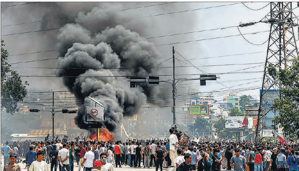
नेपाल के काठमांडू में सरकार विरोधी प्रदर्शन के दौरान आग के हवाले की गई सार्वजनिक संपत्ति।