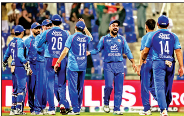
हांगकांग के खिलाफ जीत दर्ज करने के बाद जश्न मनाती अफगानिस्तान की टीम।

के आपरेशन सिंदूर के बाद दोनों टीमों के बीच यह पहला मुकाबला है। पाकिस्तानी कप्तान सलमान ने कहा अगर कोई आक्रामक होना चाहता है तो वह ऐसा कर सकता है। किसी खिलाड़ी को कुछ कहने की जरूरत नहीं है क्योंकि सभी अलग हैं। उन्होंने कहा तेज गेंदबाज हमेशा आक्रामक होते हैं। प्रस्तोता ने मीडिया से सिर्फ गैर राजनीतिक सवाल पूछने का अनुरोध किया। सूर्यकुमार और सलमान साथ में भी नहीं बैठे थे। उन दोनों के बीच में अफगानिस्तान के कप्तान राशिद खान बैठे थे।