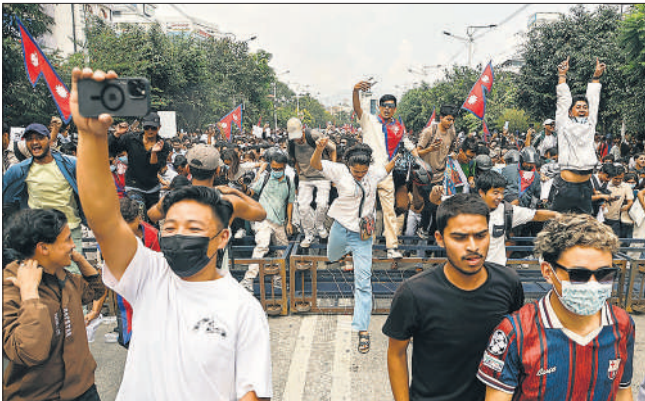
युवा प्रदर्शनकारी सड़कों पर उतरे तो पुलिस के बैरिकेड भी उन्हें नहीं रोक पाए।