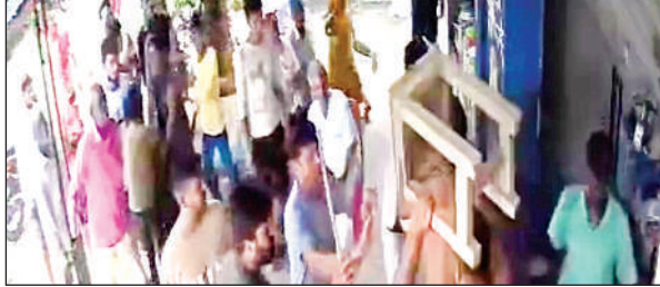
टॉवर कर्मी के साथ मारपीट करते लोग।

थे। इमें आग से जलाना, हाथियों से कुचलवाना आदि शामिल हैं लेकिन हर बार भगवान ने भक्त की रक्षा की। अंत में भगवान विष्णु ने नरसिंह भगवान का अवतार लेकर हिरण्यकश्यप का वध कर दिया। इस कहानी का आशय यह कि भक्त और भगवान के बीच अटूट रिश्ता बन जाता है जिसमें कोई भी विपदा उसका कुछ नहीं बिगाड़ सकती। इसी प्रकार ध्रुव 5 वर्षीय राजकुमार थे जिन्हें सौतेली मां सुरुचि ने पिता की गोद से बेदखल कर दिया था क्योंकि उसे ध्रुव से बहुत घृणा थी। अपनी मां सुनौति के कहने पर ध्रुव ने कठोर तपस्या कर भगवान विष्णु की आराधना की जिससे भगवान विष्णु प्रसन्न हुए और उन्हें दर्शन दिए।