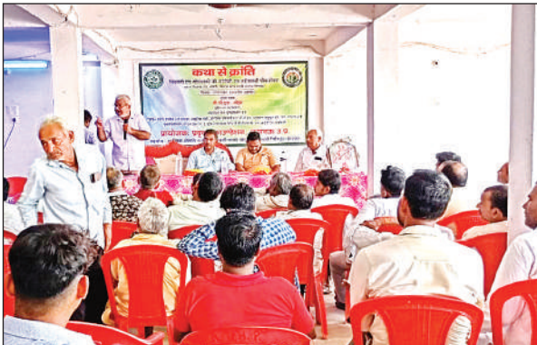
किसान गोष्ठी में मौजूद विशेषज्ञ और एफपीओ के लोग।