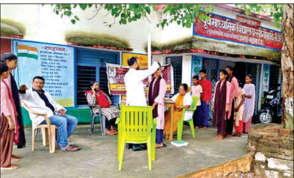
बच्चों का स्वास्थ्य परीक्षण करती स्वास्थ्य टीम।

इस मौके पर उच्च प्राथमिक विद्यालय पसवारा प्रधानाध्यापक ने कहा कि विद्यालयों में इस तरह की खेलकूद प्रतियोगिताओं के आयोजन से बच्चों की छिपी हुई प्रतिभाएं उजागर होती हैं आगे चलकर जिला व देश के लिए खेलों में प्रतिभाग करते हुए नाम रोशन करते हैं। कहा कि प्रतियोगिता में जीत मायने नहीं रखती बल्कि उसमें प्रतिभाग करते हुए अपना श्रेष्ठ प्रदर्शन करना आवश्यक होता है।