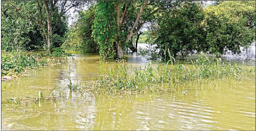
यमुना में आई बाढ़ से जलमग्न फसलें।