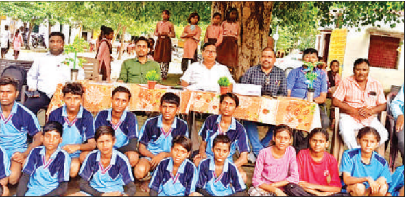
प्रतियोगिता में भाग लेने प्रतिभागी।

साइबर सुरक्षा उपायों और महिला सशक्त बनाए जाने को लेकर पुलिस टीम द्वारा श्री ब्रह्मचारी इंटर कॉलेज थाना खन्ना, पटेल शिक्षण संस्थान ननौरा श्रीनगर के अलावाशहर, कस्बा कबरई, कस्बा पनवाड़ी, थाना महोबकंट, थाना खन्ना के विभिन्न सार्वजनिक एवं भीड़ भाड़ वाले स्थानों, कस्बा कबरई में भीड़ भाड़ वाले क्षेत्र में एवं सार्वजनिक स्थानों में गोष्ठी और भ्रमण कर छात्राओं, महिलाओं बालिकाओं से वार्ता कर परस्पर उनकी समस्याओं को सुना गया तथा उन्हें उनके अधिकारों से संबंधित प्रमुख कानूनी प्रावधानों, गुड टच बैड टच, साइबर अपराध से बचाव एवं विभिन्न हेल्पलाइन नम्बरों की जानकारी देकर जागरूक किया गया।