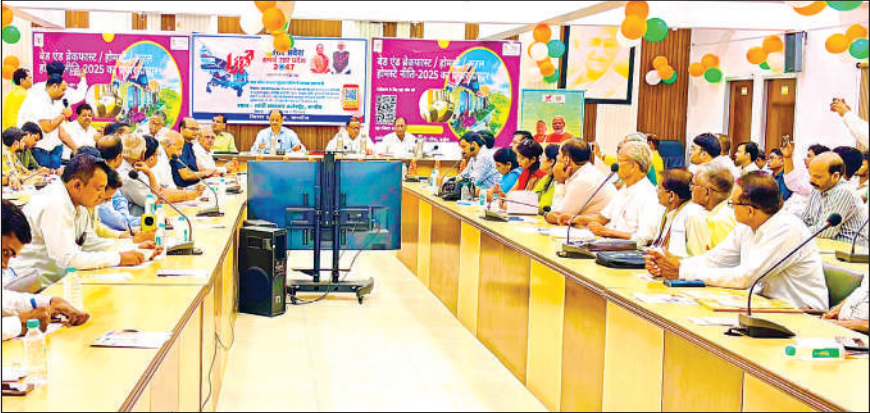
कलेक्ट्रेट सभागार में बैठक करते प्रबुद्धवर्ग समिति के पदाधिकारी, डीएम व अन्य लोग।