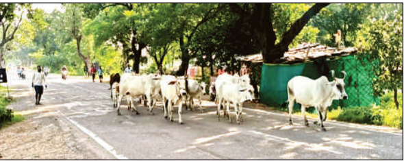
सड़क पर गोवंशों को पकड़ते सफाई कर्मी।