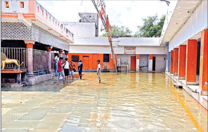
इटावा के सिद्धपीठ काली वाहन मंदिर में भरा पानी।