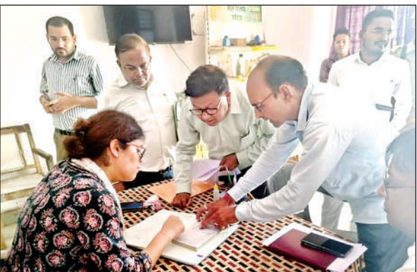
बीपैक्स धनुषधारी चरखारी में निरीक्षण दौरान रजिस्टर चेक करती डीएम।

ली और कार्य में लापरवाही बरतने पर चेतावनी दी। निरीक्षण के दौरान डीएम ने उपस्थिति पंजिका का भी अवलोकन किया और एक सप्ताह में विभाग की ओर से संचालित योजनाओं से सम्बन्धित पटल सहायकों के कार्य दायित्वों के