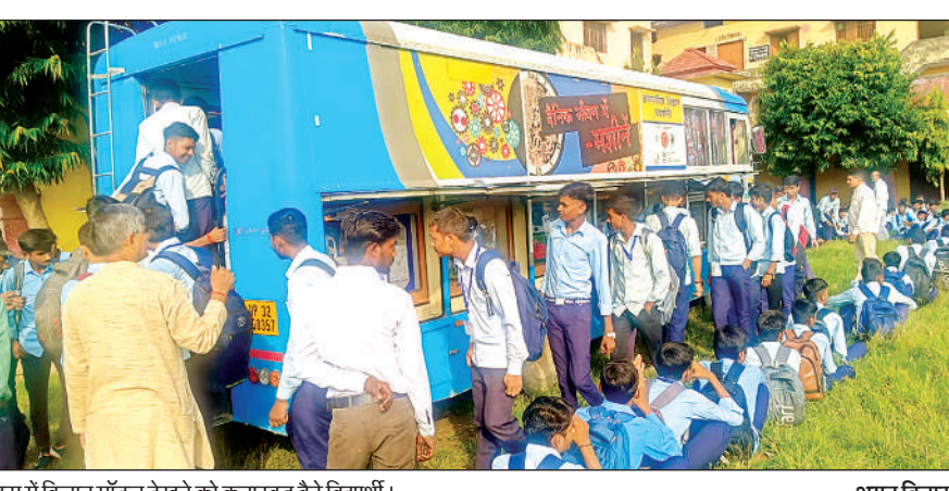
बस में विज्ञान मॉडल देखने को कतारबद्ध बैठे विद्यार्थी।