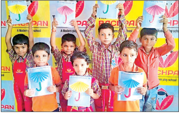
प्रतियोगिता के दौरान प्रतिभाग करते बच्चे।

की। बैठक में अछल्दा में बनने वाले बाईपास ओवरब्रिज के लिए फंड स्वीकृति पर चर्चा हुई। तय हुआ कि 73.42 करोड़ रुपये की धनराशि अक्टूबर 2025 तक स्वीकृत कर दी जाएगी। इसके बाद दिसंबर 2025