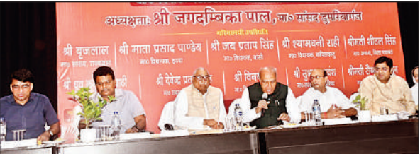
जिला विकास समन्वय निगरानी समिति दिशा की बैठक की अध्यक्षता करे सांसद जगदम्बिका पाल।

अमृत विचार : जिला ग्राम्य विकास अधिकरण द्वारा आयोजित जिला विकास समन्वय निगरानी समिति दिशा की बैठक लोहिया कलाभवन में सांसद डुमरियागंज जगदम्बिका पाल की अध्यक्षता में हुई। बैठक में सांसद डुमरियागंज जगदम्बिका पाल, विधायक इटवा नेता प्रतिपक्ष माता प्रसाद पाण्डेय को जिलाधिकारी द्वारा अंगवस्त्र एवं पौधा देकर स्वागत किया गया। सांसद डुमरियागंज जगदम्बिका पाल द्वारा 7 मार्च को आयोजित हुई बैठक के कार्यवाही समीक्षा की गयी। सांसद डुमरियागंज ने निर्देश दिया कि दिशा की बैठक में भारत सरकार राज्य सरकार द्वारा संचालित विभिन्न योजनाओं के विभागध्यक्ष को बुलाने का निर्देश दिया। अधिशासी अभियन्ता डूनेंज खण्ड द्वारा अवगत कराया गया कि गत बैठक में सैनुआ बांध पर 800 मीटर खड़जा लगाने के निे