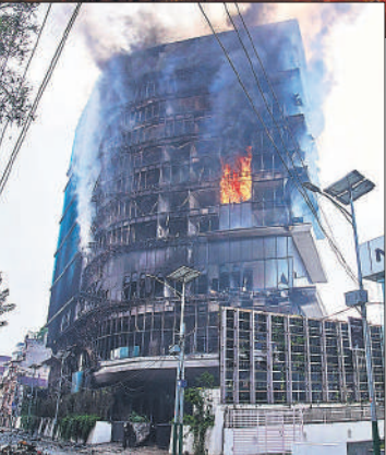
बुधवार को लपटों में घिरा काठमांडू का हिल्टन होटल।