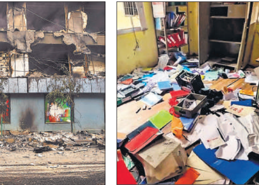
काठमांडू में फूँकी गई नेपाल पुलिस की गाड़ी।