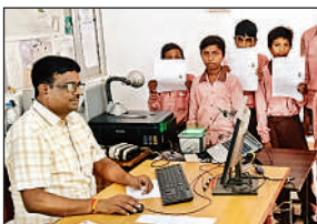
स्कूल में किया जा रहा आधार अपडेट।