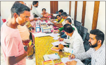
स्वास्थ्य शिविर में मौजूद ग्रामीण व स्टाफ।

मौजूद रहे। शिविर में ग्रामीणों को यौन जनित रोगों, एचआईवी, वीडीडिआरएल, एचबीएसएजी, एचसीवी व टीबी के बारे में परामर्श दिया गया। इसके साथ ही मरीजों को दवाओं का वितरण किया गया तथा एचआईवी, सिफलिस, एचबीएसएजी और एचसीवी की जांच भी की गई। स्थानीय लोगों ने इस शिविर का लाभ उठाकर स्वास्थ्य संबंधी जानकारी और मुफ्त जांच सुविधाएं प्राप्त कीं।