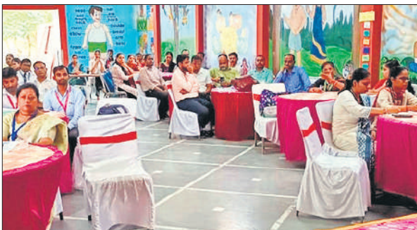
राजेंद्र गिरि मेमोरियल एकेडमी की कार्यशाला में मौजूद विभिन्न विद्यालयों के शिक्षक।