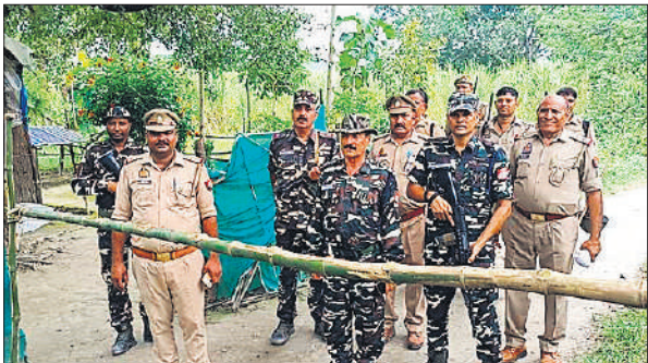
पाल सीमावर्ती क्षेत्र में अलर्ट के बीच बैरियर पर मुस्तैद फोर्स।