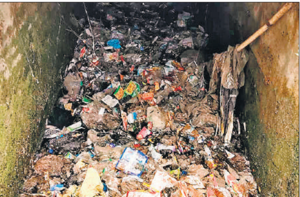
विशाल टॉकीज के पास स्लैब के नीचे नाले में जमा कूड़ा करकट। ●अमृत विचार

बाढ़-बारिश के दौरान भी जलभराव दूर करने के लिए चोक नाले खोले गए, लेकिन अब उनमें दोबारा से हालात बिगड़ते दिखाई दे रहे हैं। पॉलिथीन के ढेर, डिस्पोजल सामान से जुड़ा कूड़ा करकट जमा हो गया है। जिससे गंदगी का अंबार लगा है। नालों के स्लैब के नीचे की