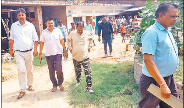
घायल के घर हाल जानने जाती वन विभाग की टीम।