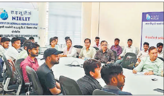
प्रशिक्षण कार्यक्रम में मौजूद छात्र छात्राएं व अन्य।