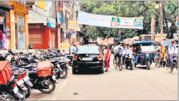
सुनगढ़ी तिराहा से गौहनिया की तरफ बढ़ने पर खड़े वाहन। ●अमृत विचार

नाकाफी साबित हुए। शुरुआती दौर में नाला सफाई में औपचारिकता बरतने की शिकायत हुई। इसके बाद बारिश में जलभराव होना शुरू हुआ। फिर छह दिन तक रुक-रुककर हुई मूसलाधार बारिश ने पूरे शहर को जलमग्न कर दिया था। जिसके बाद राजनीतिक खींचतान बारिश के बीच जलभराव को लेकर भी मची रही। नगर पालिका की अव्यवस्थाओं को जिम्मेदार