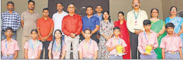
कार्यक्रम के दौरान सम्मानित किए गए बच्चे।