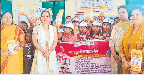
कार्यक्रम के दौरान स्कूली बच्चे व एचईडब्ल्यू के सदस्य।