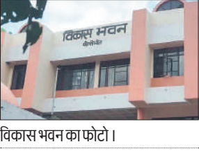
विकास भवन का फोटो।