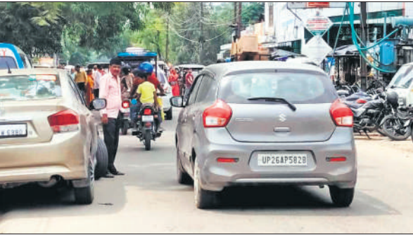
गांधी स्टेडियम रोड पर सड़क के दोनों ओर खड़े वाहन। ●अमृत विचार

कोई पार्किंग व्यवस्था नहीं है। बीते सालों में प्रशासन ने सुध ली और नगर पालिका के स्तर से पार्किंग के लिए जगह चिन्हित कर ठेके भी कराए गए। गांधी स्टेडियम रोड पर