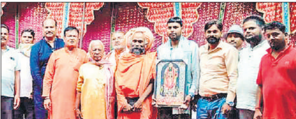
आयोजक और अतिथियों संग सम्मानित किए गए कवि।