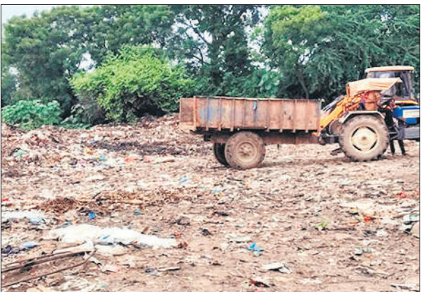
रोडवेज के सामने खाली जगह पर कूड़े का ढेर।

बरेली-हरिद्वार नेशनल हाईवे पर जहानाबाद मोड़ के पास नगर पालिका की ओर से शहर के विभिन्न स्थानों से जमा किया जा रहा कूड़ा फैका जा रहा था। इसे लेकर डीएम ने जवाब तलब किया। अब इसी तरह से रोडवेज के सामने खाली जगह में कूड़े का