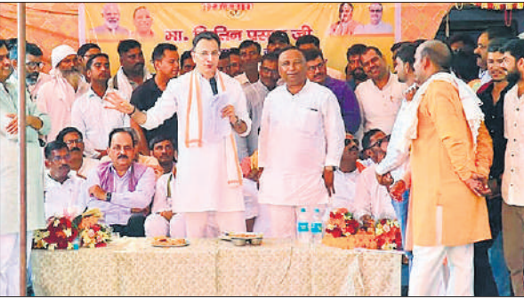
ग्रामीणों से संवाद करते केंद्रीय राज्यमंत्री जितिन प्रसाद।

कार्यालय संवाददाता, पीलीभीत अमृत विचार: बरेली हरिद्वार नेशनल हाईवे पर गत माह हादसे में हुई टेपो सवार छह लोगों की मौत के बाद डग्गामार वाहनों पर पुलिस और परिवहन विभाग की ओर से लगातार कार्रवाई चल रही है। इसके बावजूद सड़कों पर डग्गामार वाहन फर्राटा भर रहे हैं। 23 अगस्त को बरेली हरिद्वार नेशनल हाईवे पर जहानाबाद क्षेत्र में सरदार नगर गांव के पास कार और सवारियों से भरे टेपो की टक्कर हो गई थी। हादसे में टेपो सवार छह लोगों की मौत हुई थी। इस हादसे के पीछे वाहनों की तेज रफ्तार और यातायात नियमों की अनदेखी सामने आई थी। कार की तेज रफ्तार