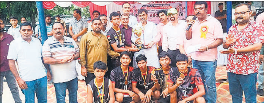
गोला के कृषक समाज की विजयी टीम को पुरस्कृत करते मुख्य अतिथि।