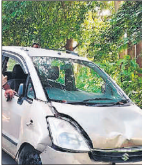
बाइक को इसी कार से लगी टक्कर।

एसएसबी और पीएसबी संयुक्त रूप से गश्त करती रही। न्यूरिया क्षेत्र की सीमा उत्तराखंड से सटी हुई है। वहां पर प्रशिक्षु सीओ की अगुवाई में पैदल गश्त की गई। बाजार समेत अन्य भीड़ वाले