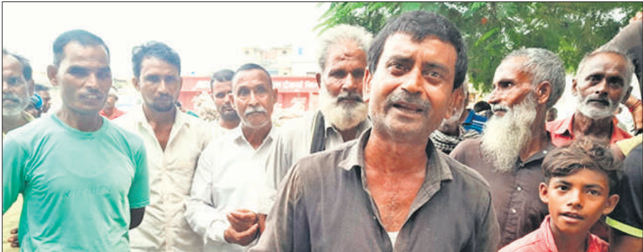
अपनी व्यथा बताता एक प्रदर्शनकारी।