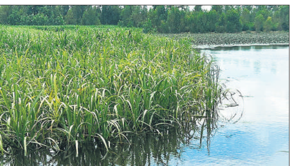
बरखेड़ा क्षेत्र में खन्ना के खेत में भरा पानी। ●अमृत विचार

जैसी परत बन चुकी है। जबकि इस नाले को भी जलभराव के दौरान साफ कराया गया था। इसमें कूड़ा करकट डालकर अव्यवस्था बढ़ाई जा रही है।