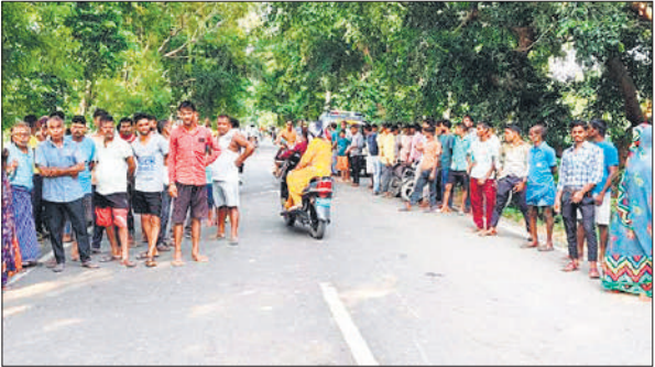
हादसे के बाद मौके पर लगी भीड़।