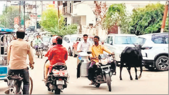
अशोक कॉलोनी गेट के पास मुख्य मार्ग पर फुटपाथ पर खड़े वाहन। ●अमृत विचार

शहर की सड़कों पर अतिक्रमण की भरमार है। दुकानों के आगे फुटपाथ पर रखे गए सामान को जाम की वजह के तौर पर देखा जाता है। मगर, इसके साथ एक