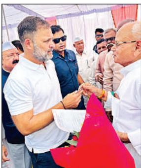
राहुल गांधी से मुलाकात कर समस्या बताता इप्सेफ का प्रतिनिधिमंडल ।