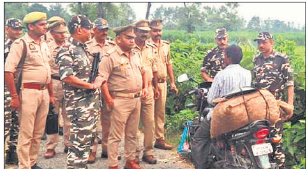
नेपाल सीमावर्ती क्षेत्र में आवाजाही करने वालों की चेकिंग करती पुलिस और एसएसबी।

वहीं पर बाइक खड़ी कर दी। एक सर्राफ की दुकान पर काम से चले गए। कुछ देर बाद वापस आए तो बाइक चोरी हो चुकी थी। पुलिस मामले की जांच कर रही है।